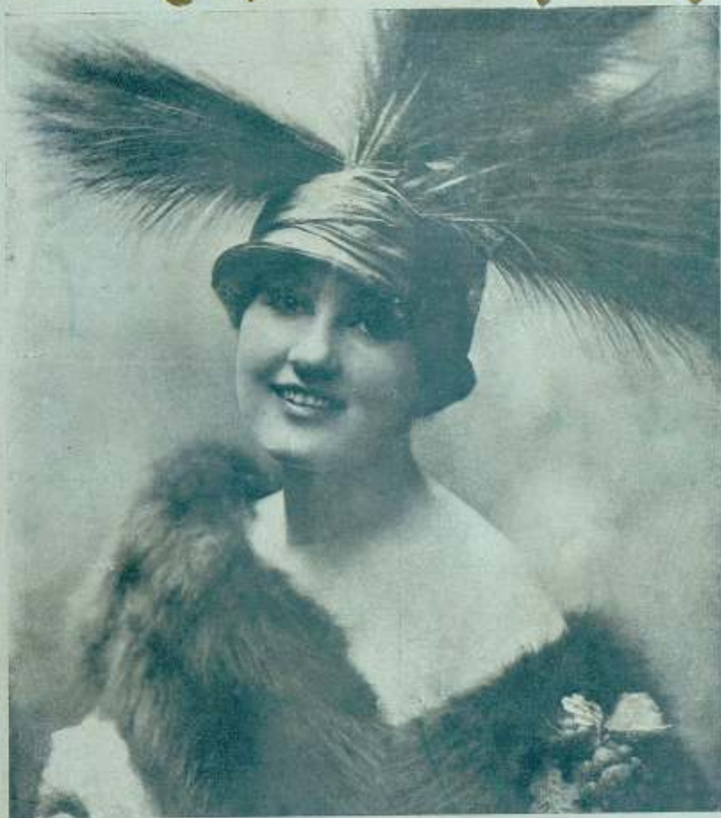
La eximia actriz HESPERIA , protagonista de la gran película La Dama de las Camelias , de la casa "TIBER FILM"