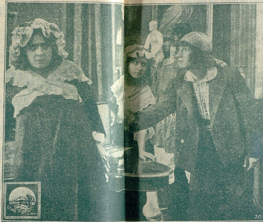
Una escena de la interesante película ¡PATRIA MÍA!

—Si papá le dijo ayer a mamá, si viera aquél besugo le dices que no estoy en casa.