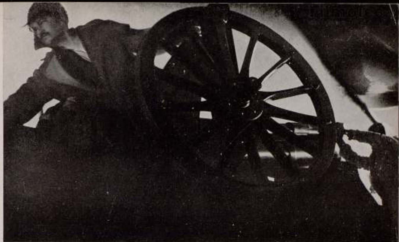
Eisenstein: "Octubre".