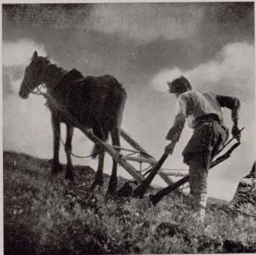
Eisenstein: "La línea General".

Sobre el barco hay un campo muy característico de individualización. Es el mundo opuesto a los marineros revolucionarios: el pope, los oficiales, el médico. Aquí otra vez tenemos imágenes conservando su color individual. He aquí la disposición: de un lado el drama del radicalismo medio-burgués aplastado comprendido de manera muy lógica; de otro lado la reacción zarista representada muy concretamente. Es un hecho esencial que nos demuestra de