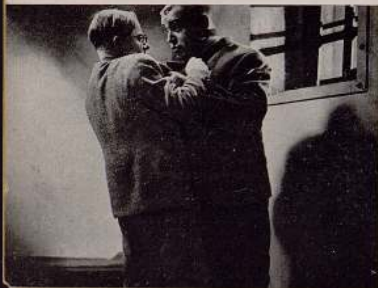
"El hombre que busca a su asesino", film alemán de Siodmack.

3. — Hace ya algún tiempo, en un artículo mío que titulaba: «Un cinema para el pueblo», abogaba por la creación de un cinema que llegara directamente a las masas populares y obreras. Un cinema que reivindicara estas masas, pues este papel se lo tengo yo concedido al cinema desde hace ya mucho tiempo.