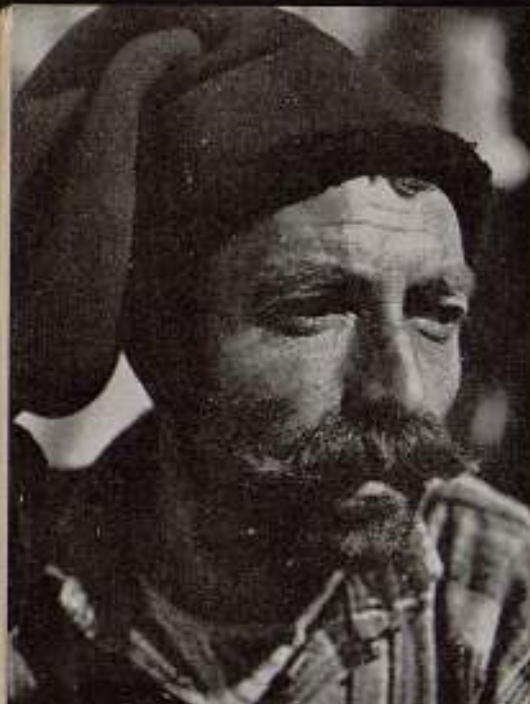
Un tipo de « Maria do mar », film portugués de Leitao de Barros.

(y casi siempre malas) de conocidas obras literarias, imitando a los films franceses e italianos que en aquella época nos llegaban de fuera. Al esfuerzo de carácter artístico siguió una desorganización y un desorden pavorosos, destruyendo en poco tiempo las bases de un edificio que acaso no hubiera tardado en erguirse, si el pueblo ibérico tuviera aquel instinto ordenado, metódico, práctico, del «businessman» germano o yanqui. Porque el cinema en países como Portugal, donde la mayor parte de la gente no ve en él sino una simple diversión sin gran importancia*, a pesar de ser estimado por todos, no podía vivir, por lo menos al principio (a no ser que se limitara a las fantasías de éste o de aquel entusiasta aficionado, que por cierto eran los que producían mejores obras), fuera del campo comercial, de donde verdaderamente todavía no ha salido.