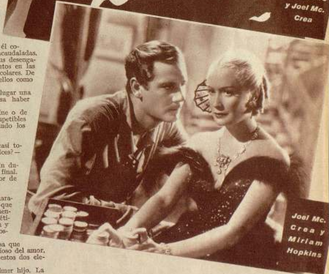
Joel Mc- Crea y Miriam Hopkins