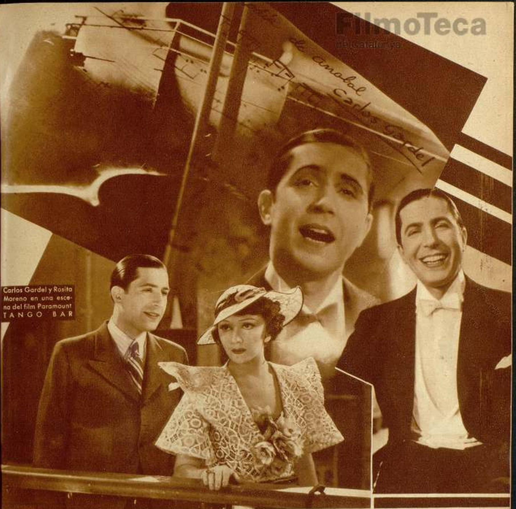
Carlos Gardel y Rosita Moreno en una escena del film Paramount TANGO BAR