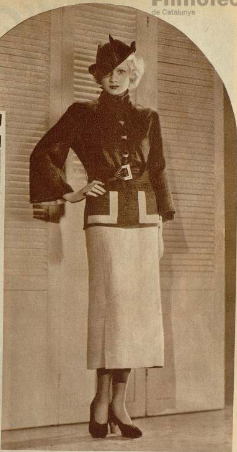
Bella combinación de falda y chaqueta en dos tonos distintos, que nos presenta Lucille Ball, de R. K. O Radio.