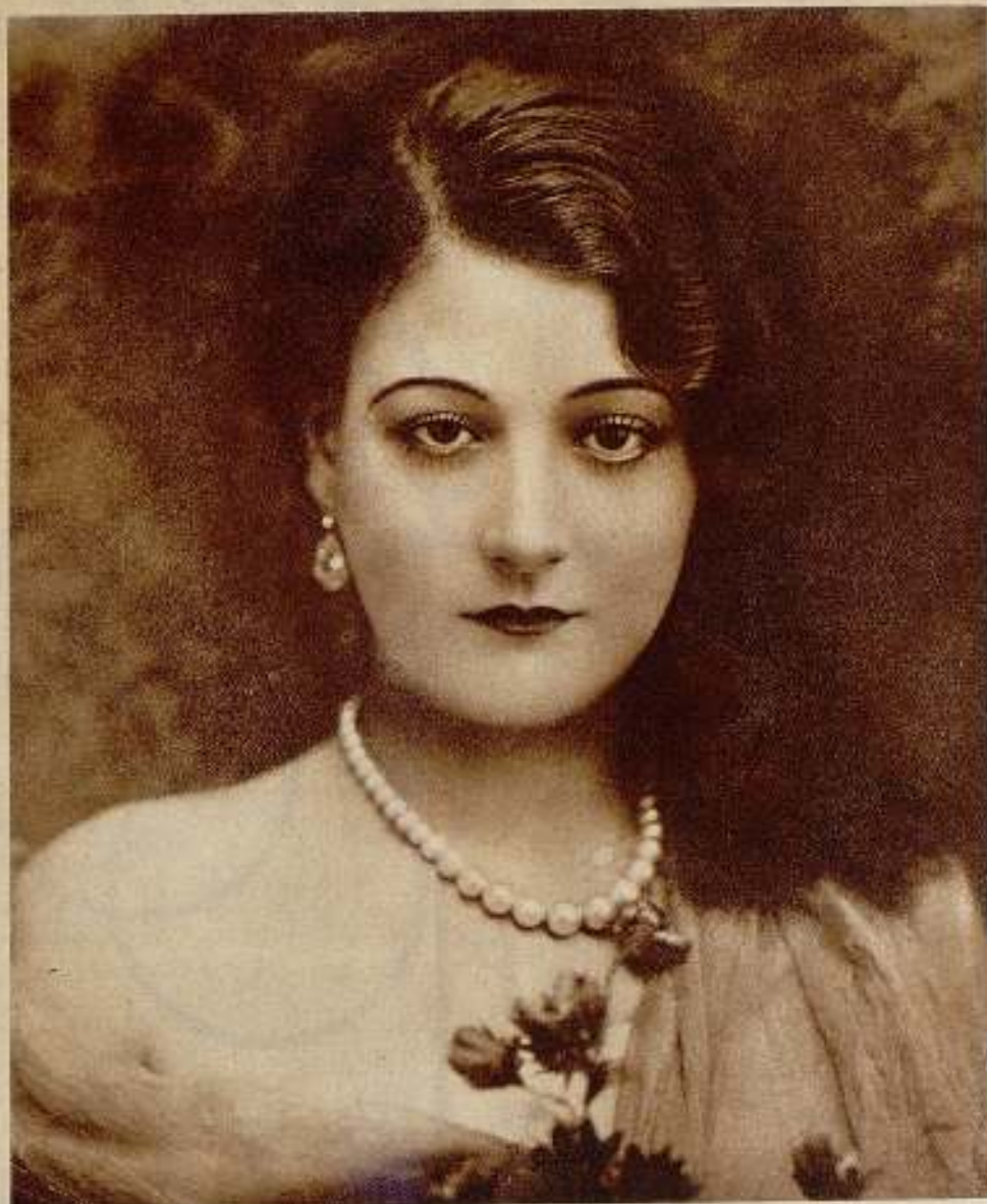
Sus pupilas fulgurantes y misteriosas como estrellas lejanas

parecido siempre un oso de circo, degenerado en señorito.—