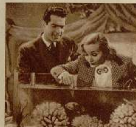
Una escena de «Concertina» con Carole Lombard y Fred Mac Murray