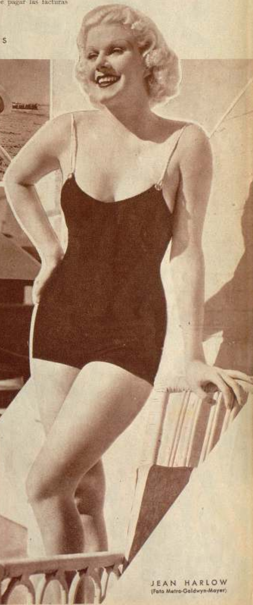
JEAN HARLOW