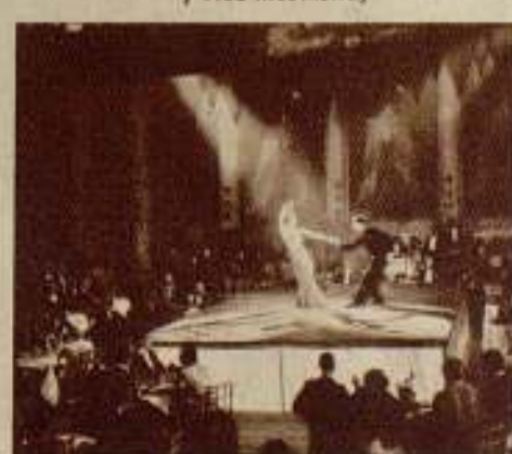
Una escena de «Es amor otra vez» con Jessie Matthews y Robert Young