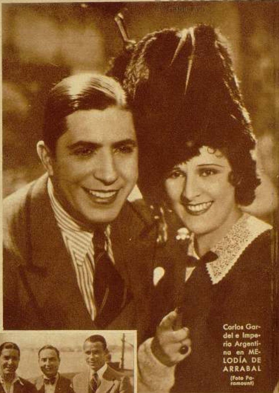
Carlos Gardel e Imperia Argentina en MELODÍA DE ARRABAL

CUANDO Carlos Gardel salió de Francia en compañía de su madre, el calendario marcaba esta fecha: 12 de mayo de 1892. Le faltaban cuatro meses para cumplir la edad de dos años que ya cruzó por primera vez el Atlántico para fijar su residencia en Montevideo, donde pasó su infancia.