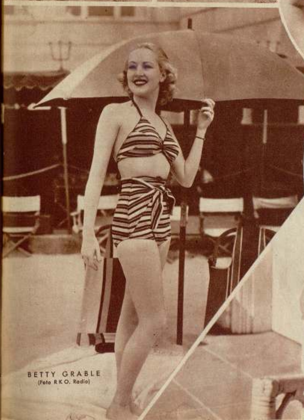
BETTY GRABLE