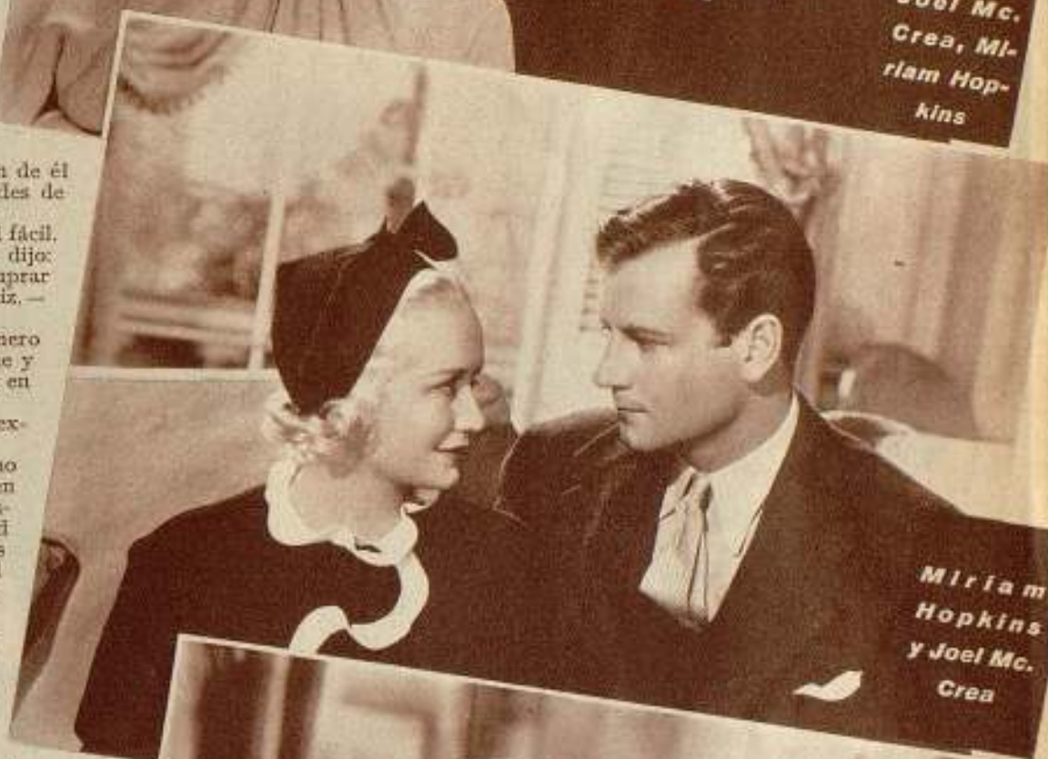
Miriam Hopkins y Joel Mc- Crea