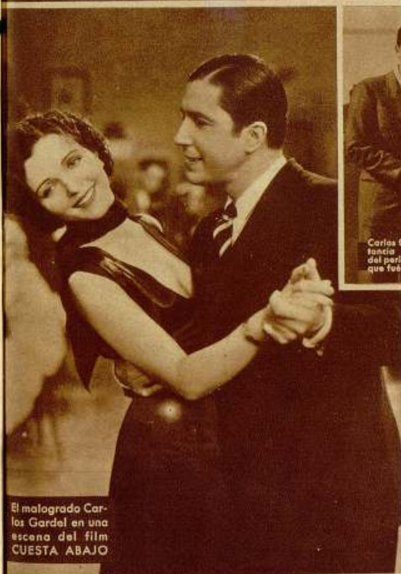
El malogrado Carlos Gardel en una escena del film CUESTA ABAJO