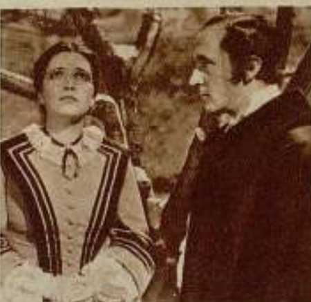
Una escena de «El ángel de la piedad» con Kay Francis en el papel principal

Ida Lupino, vivarachay tentadora, es la muchacha a quien Francis Lederer besa en la obscuridad de