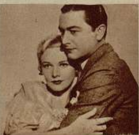
Madeleine Carroll y Robert Young en «Agente secreto»