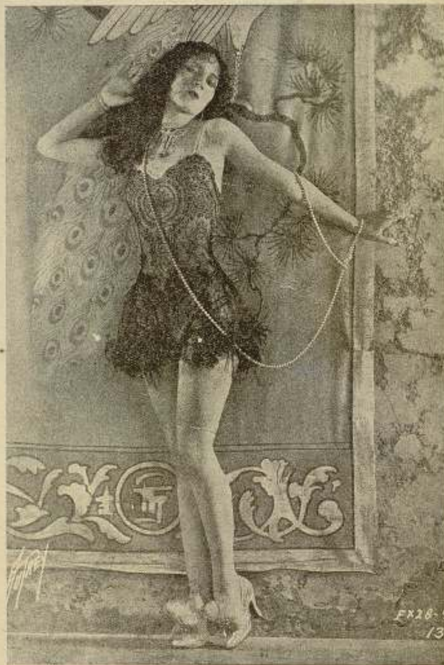
Olive Borden en una magnífica "deshabille"

los artistas de cine no somos las que sólo sabemos «coquetear» y dar besos, sino que también en la vida real podemos ser buenas señoras de casa y sabemos hacer todo lo que se requiere para hacer la felicidad de un hogar.»