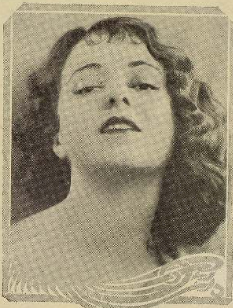
JANET GAYNOR en "2 GIRLS WANTED" WILLIAM FOX ATTRACTION

(Prohibida la reproducción sin citar la procedencia.)