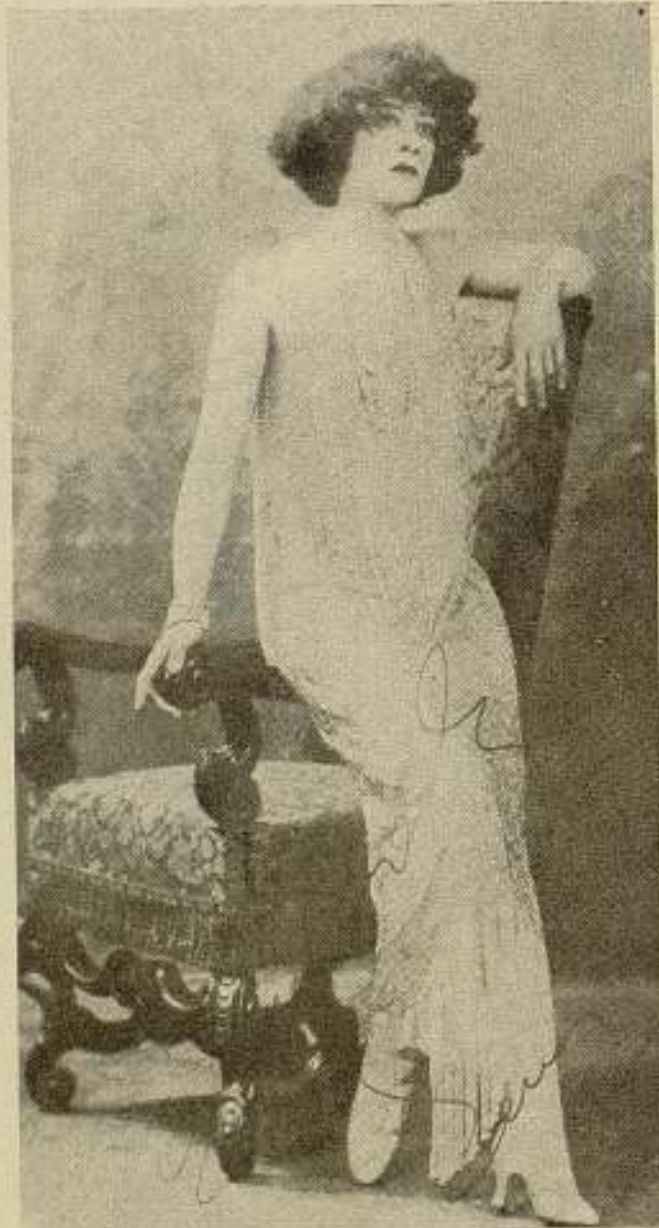
Miss Lenora Ulric, famosa actriz dramática, que ha entrado a formar parte del elenco de la Fox y que pronto aparecerá en la pantalla como protagonista de algunas de las grandes películas sonoras. Miss Lenora Ulric es una de las favoritas de los públicos inglés y norteamericano.