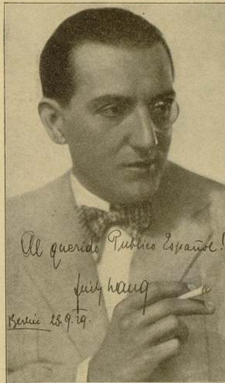
Fritz Lang, el animador de «Metrópolis» y «La mujer en la Luna»

sado que alemán, exquisito; es el verdadero hombre de mundo, con una gran cultura, que no le hace impertinente, sino ameno. Es el hombre viajero, que sabe entretener junto a él con el más cultivador de los encantos. Su actitud de hombre asequible me