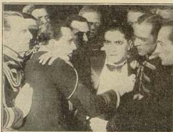
Ernesto Van Düren

Su estreno en España constituirá sin duda un acontecimiento memorable.