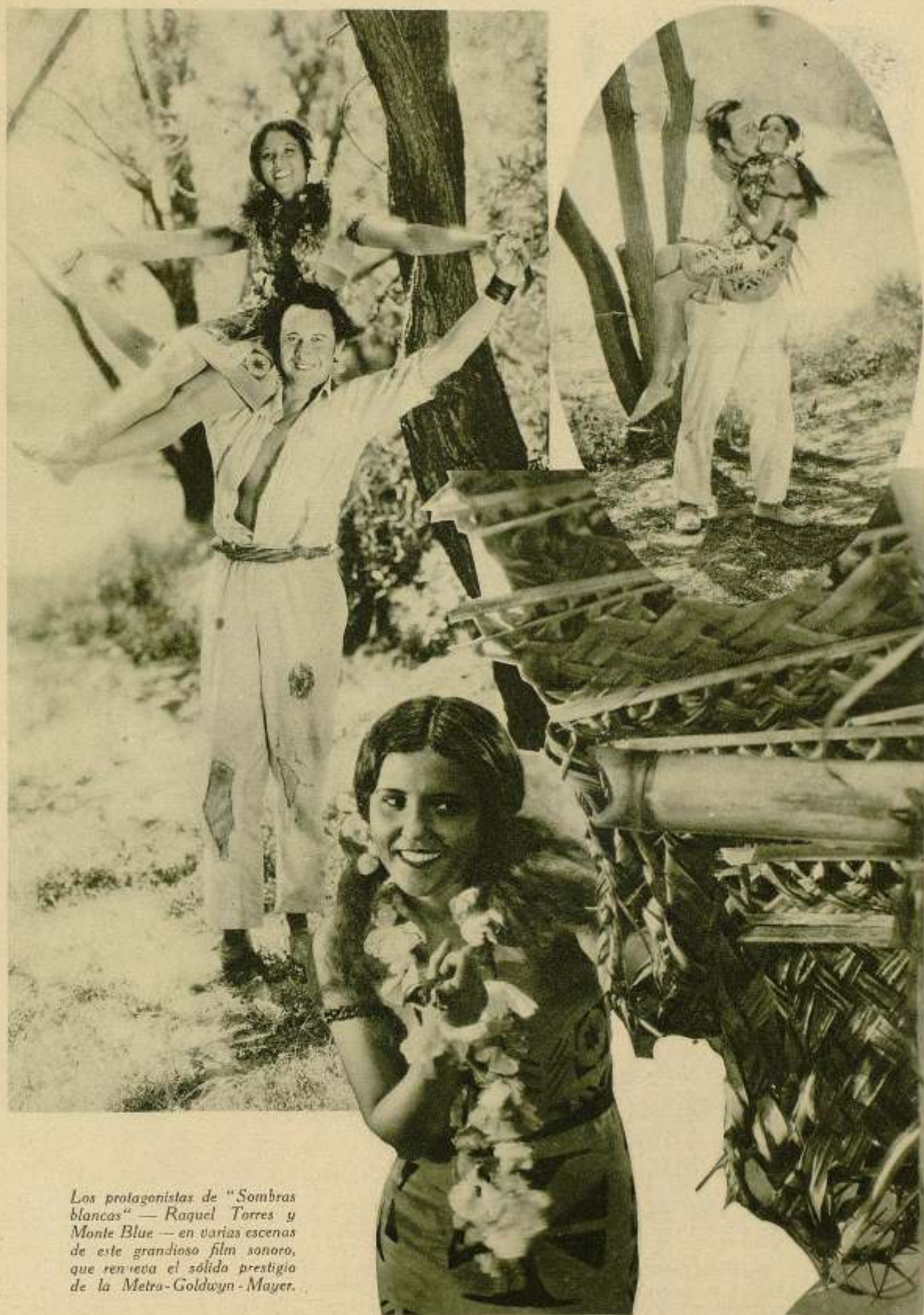
Los protagonistas de "Sombras blancas" — Raquel Torres y Monte Blue — en varias escenas de este grandioso film sonoro, que renueva el sólido prestigio de la Metro-Goldwyn-Mayer.