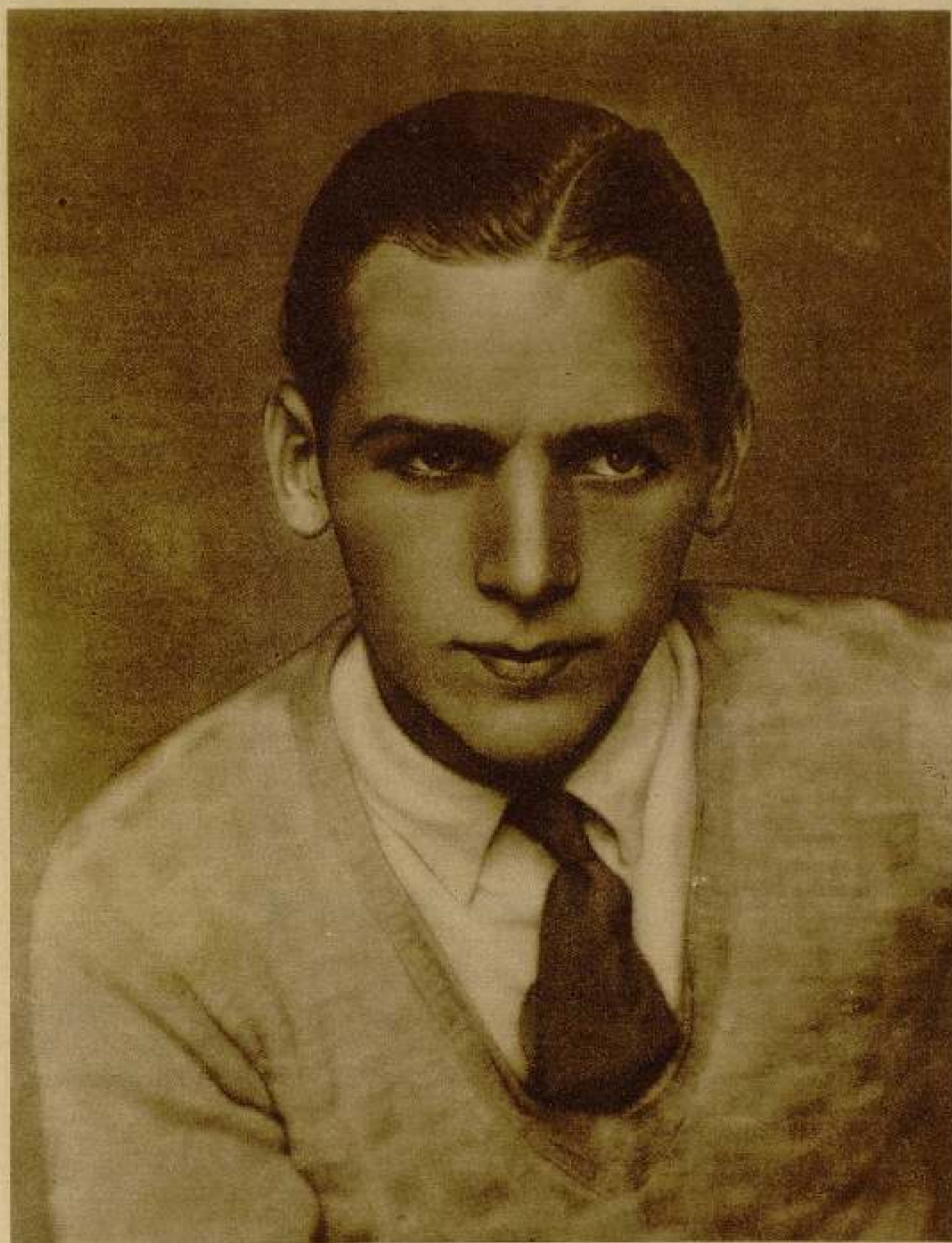
DOUGLAS FAIRBANKS (hijo)

que figura en el elenco de los "Artistas Asociados" y se destaca ya en la pantalla como una figura muy estimable del arte del silencio.