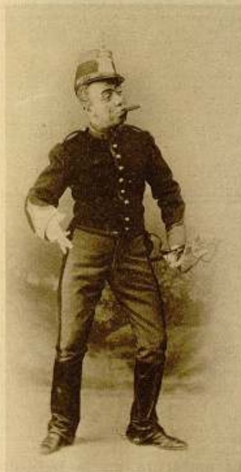
Fresno actor cómico en "La del Dos de Mayo", de los Quintero.

Rodeado de elevadas construcciones de presencia muy moderna y con apariencias de rascacielos — humildes rascacielos que sólo se pierden entre las nubes, cuando éstas bajan a las calles de la ciudad y envuelven a personas y cosas en espesa gasa, en densa niebla —, y en el trozo que va de la Red de San Luis a la Plaza del Callao, el más vistoso y céntrico de la Gran Vía, se halla, luciendo su distinción, el aristocrático Teatro Fontalba.