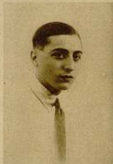
S. E. G.

Edad: 17 años. — Estatura: 1'550 m. Peso: 32 k. — Cabello rubio. — Ojos pardos. — Cultiva fútbol y gimnasia. Muy adelantado en la instrucción pri- maria.