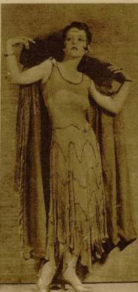
Clara Bow, una de las más bellas actrices del arte del silencio, luce garbosamente un elegante «talletta» con la que se exhibe en una de sus películas.

Como conclusión, podemos decir que «El Hotel Imperial» es una película que presenta muchos nuevos aspectos del arte de la escena muda, hasta ahora completamente desconocidos. Sin duda alguna que ha de influir poderosamente en la producción cinematográfica en general, ayudando a que en el futuro se impresionen obras con efectos escénicos hasta ahora no soñados y que se presente en la pantalla la tragedia de la vida a través de un primer completamente distinto. Tenga o no esta trascendencia, es seguro que «El Hotel Imperial», tal cual lo presenta la Paramount, es algo muy nuevo digno de ser admirado por los aficionados al Cinema y más digno aún de estudio por parte de los técnicos que aspiran a impulsar y dignificar cada día más el arte de la escena silente.