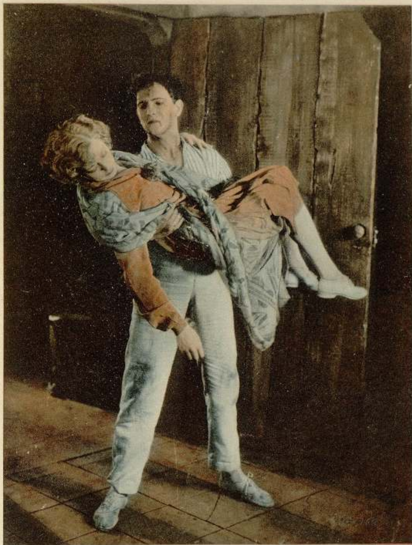
Dramática escena de Nautragio, film PRO-DIS-CO