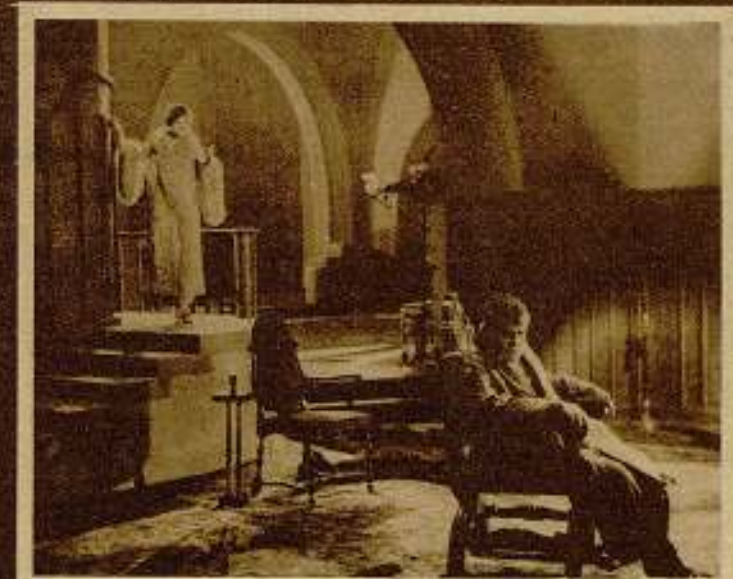
H. B. Warner, otro de los principales intérpretes, posee una fuerte personalidad artística.