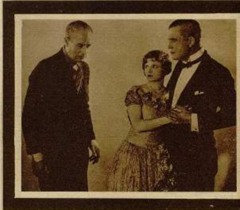
Vera Reynolds, la protagonista, tiene la gracia y la picardía de un muchacho.

Editada por la "Pro-Dis-Co" y perteneciente a las exclusivas Julio César, S. A.