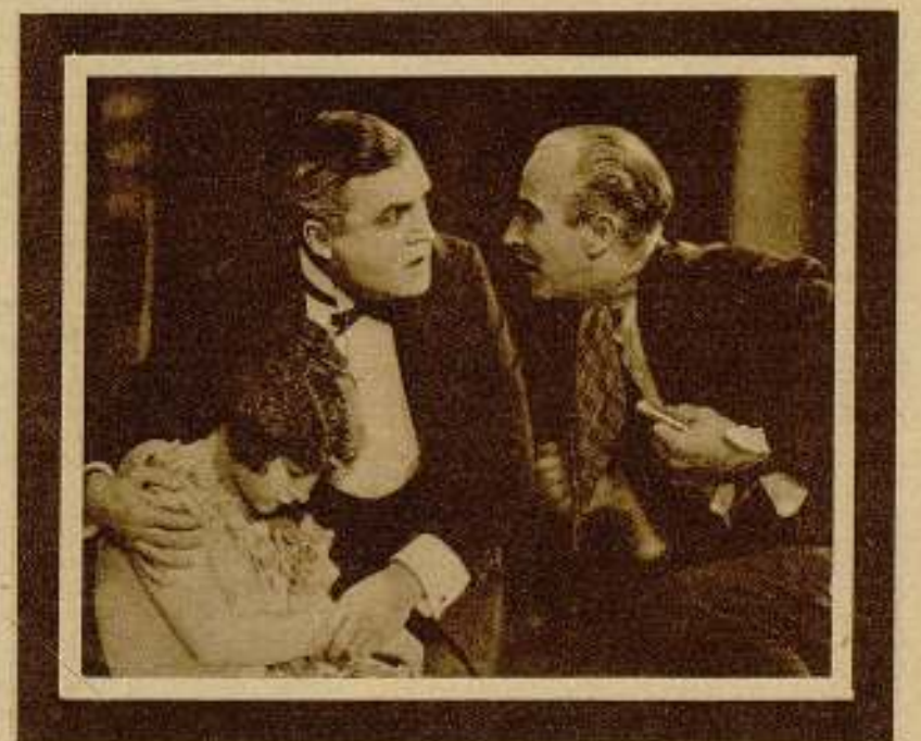
C. B. de Mille, el mago de la pantalla, ha colocado sus producciones a la vanguardia del arte mudo.

"¡Silencio!", que desfilará por las pantallas barcelonesas, es una comedia dramática, plena de emoción y de interés. Su estreno ha de constituir uno de los acontecimientos más importantes de la temporada.