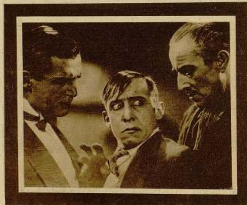
Las películas marca Pro-Dis-Co, tienen siempre la garantía de una buena dirección.