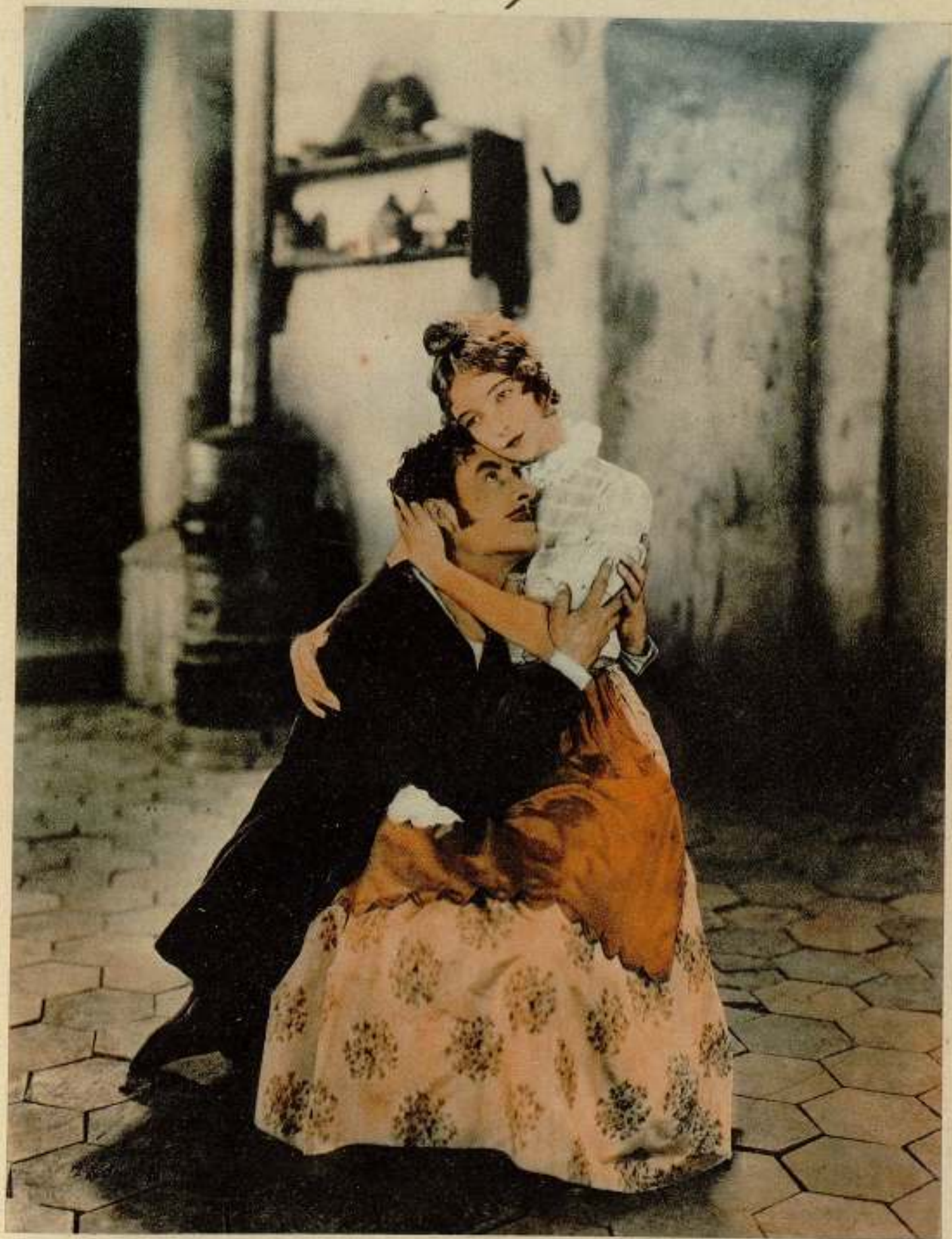
Una de las más bellas escenas de «Vida bohemia», de la METRO GOLDWYN