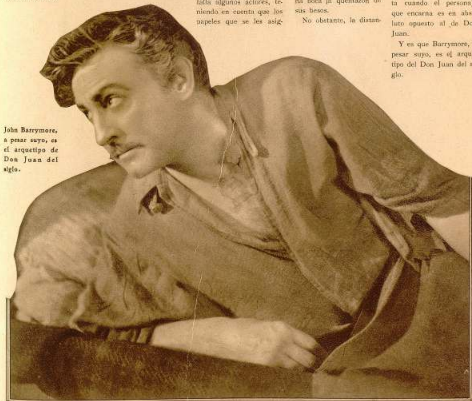
John Barrymore, a pesar suyo, es el arquetipo de Don Juan del siglo.