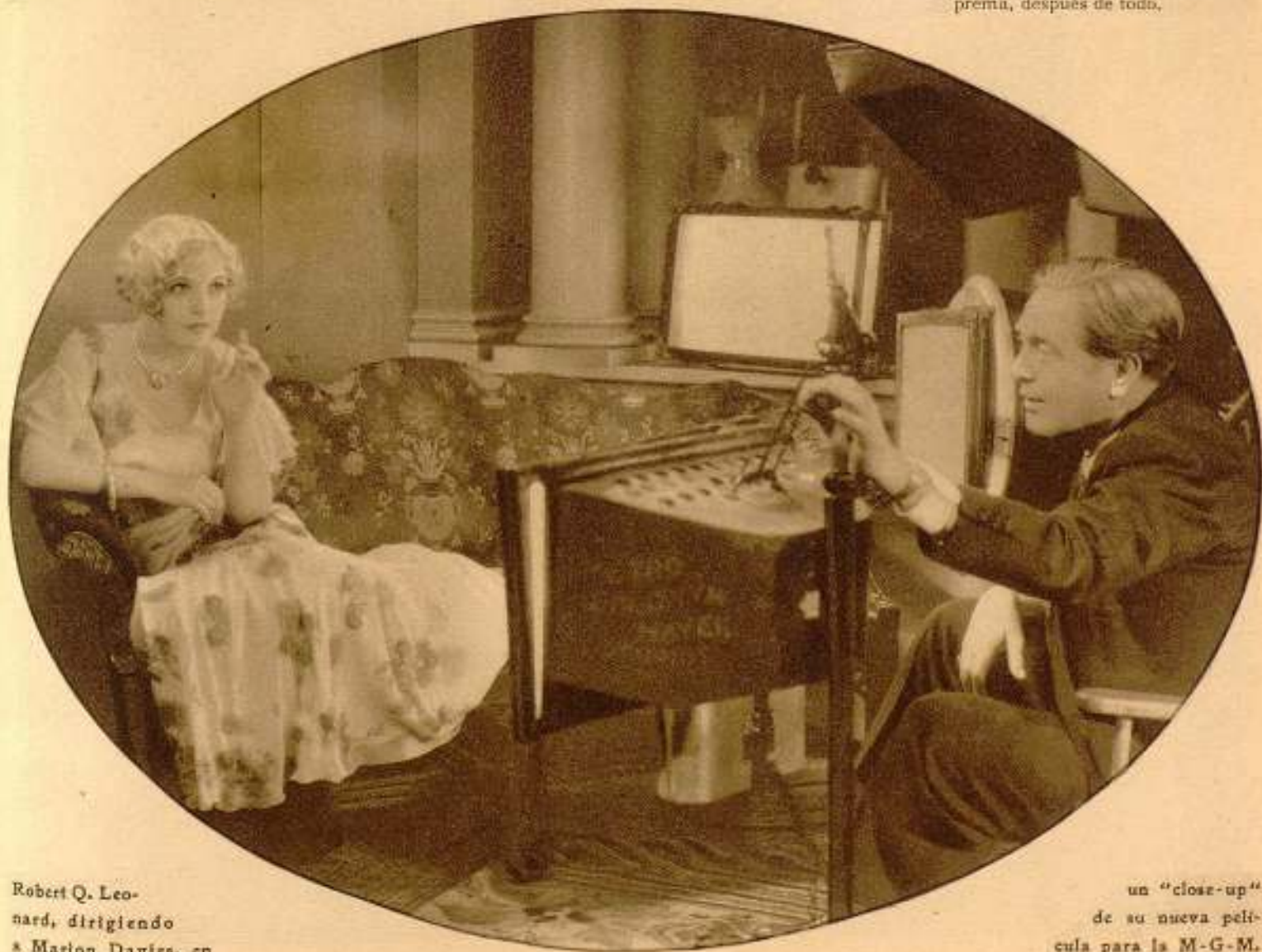
Robert Q. Leonard, dirigiendo a Marion Davies, en

Y lo mejor es que transmite su alegría y sus dones, lo cual constituye la emoción suprema, después de todo.