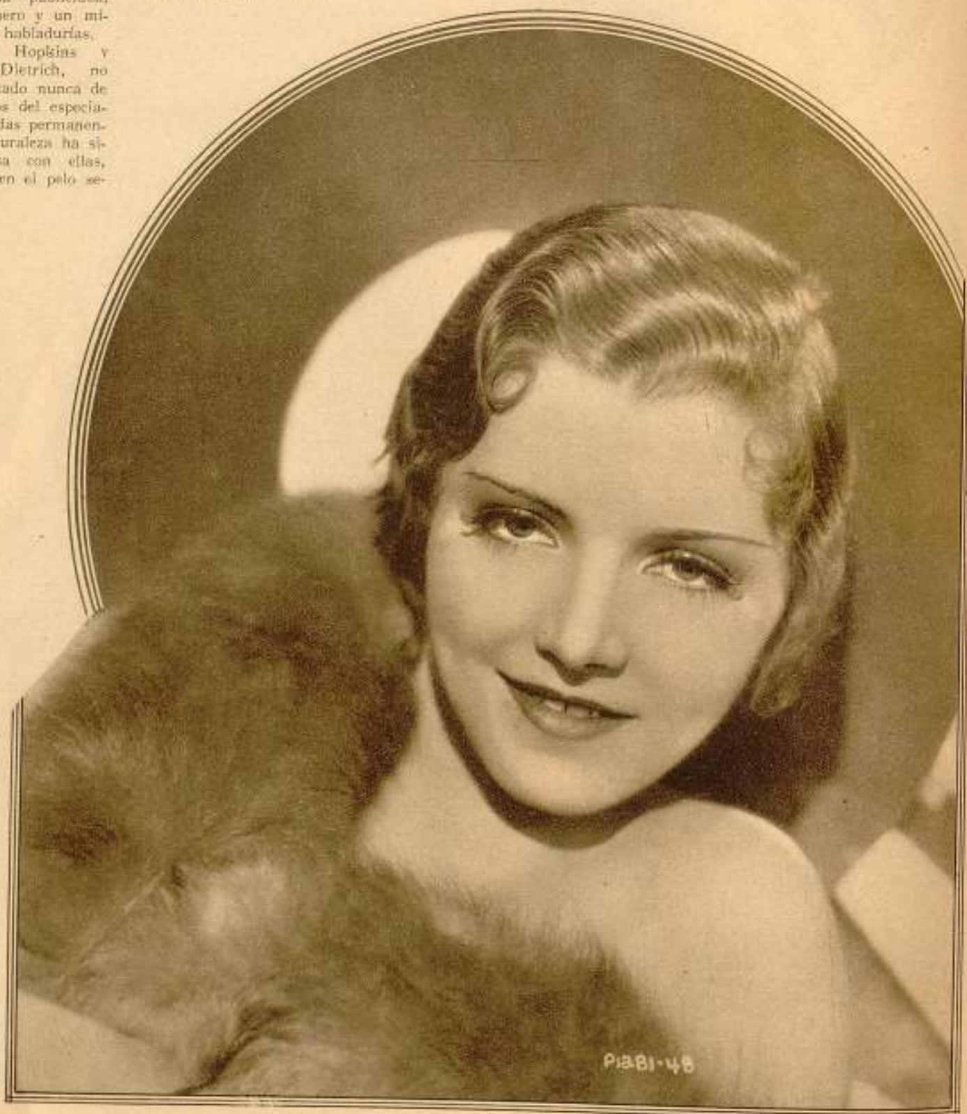
Peggy Shannon, tiene una de las cabelleras más largas y hermosas de Hollywood.

La manicura y el alineamiento de las cejas se deja, por regla general, al cuidado de las doncellas de las artistas.