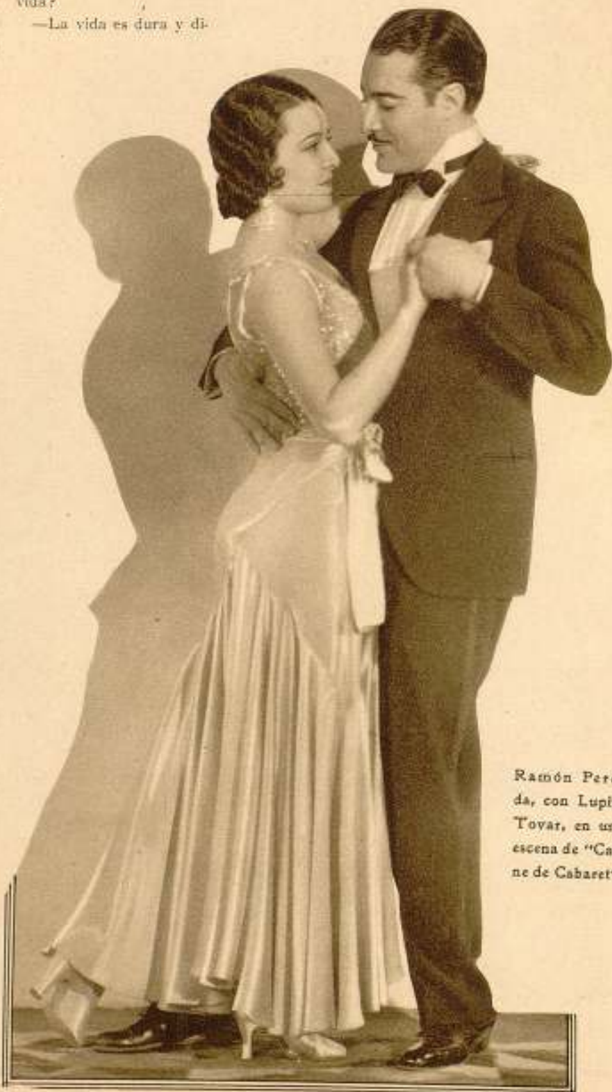
Ramón Pereda, con Lupita Tovar, en una escena de "Carné de Cabaret".