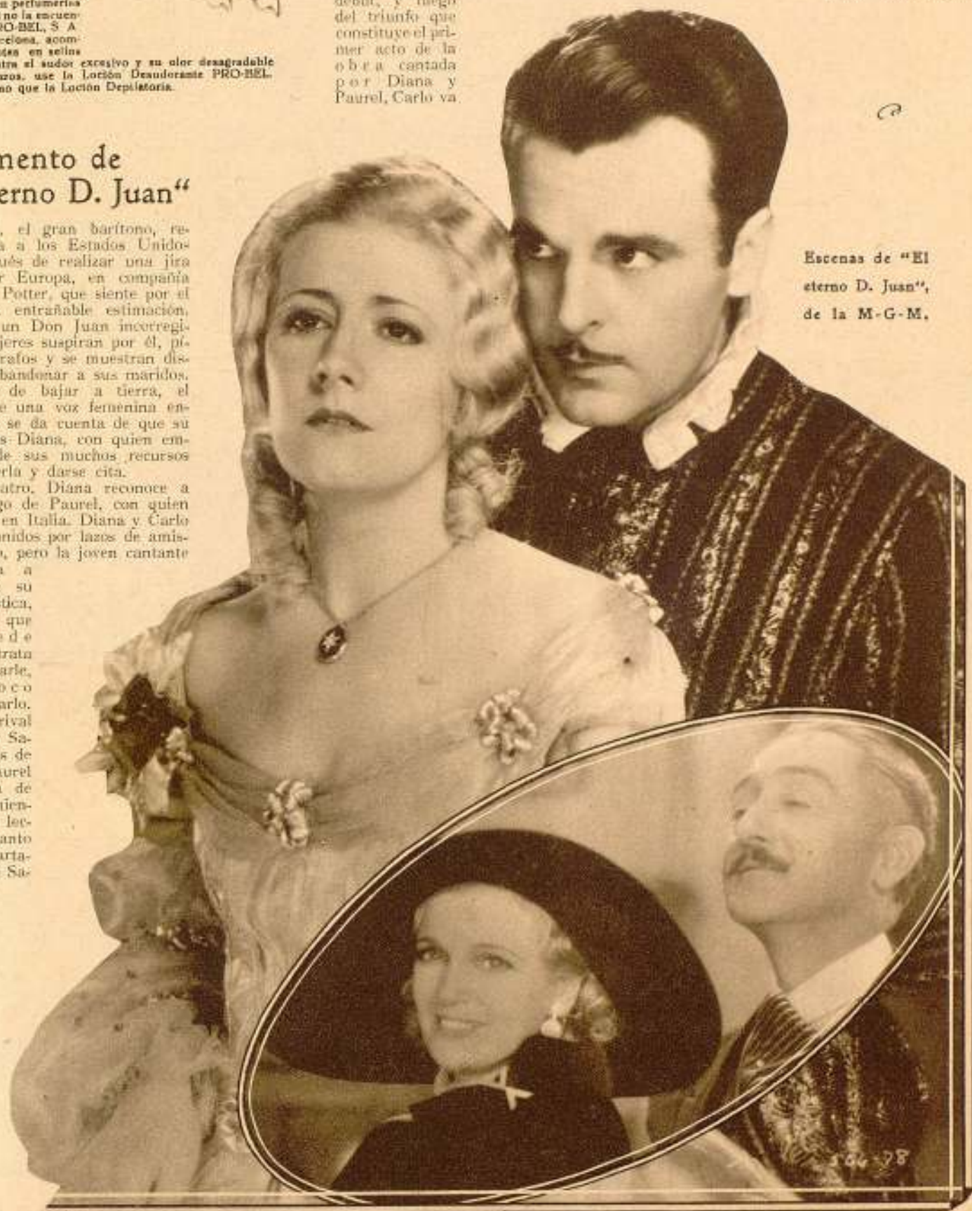
Escenas de "El eterno D. Juan", de la M-G-M.

Carlo es rival de Paurel y Savarova lo es de Diana. Paurel se enamora de Diana, y mientras le da lecciones de canto en su departamento, llega Sa-