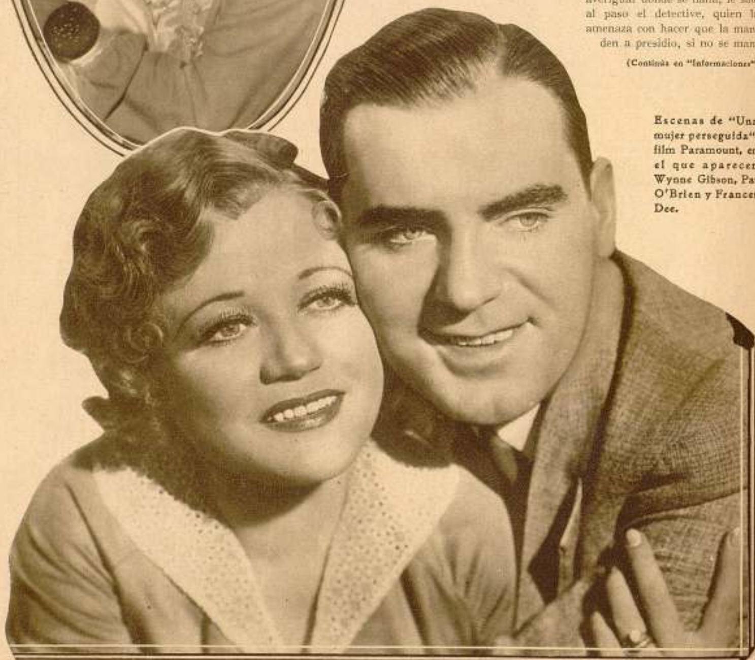
Escenas de "Una mujer perseguida", film Paramount, en el que aparecen Wynne Gibson, Pat O'Brien y Frances Dee.