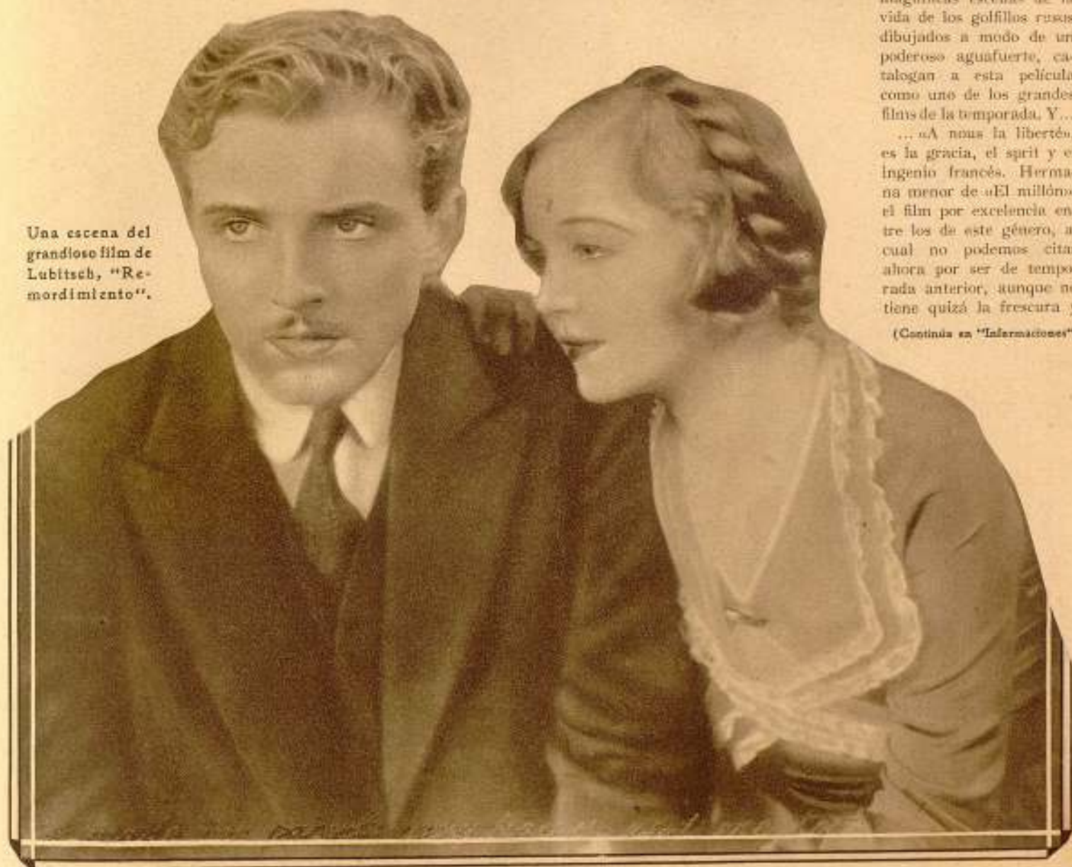
Una escena del grandioso film de Lubitsch, «Remordimiento».