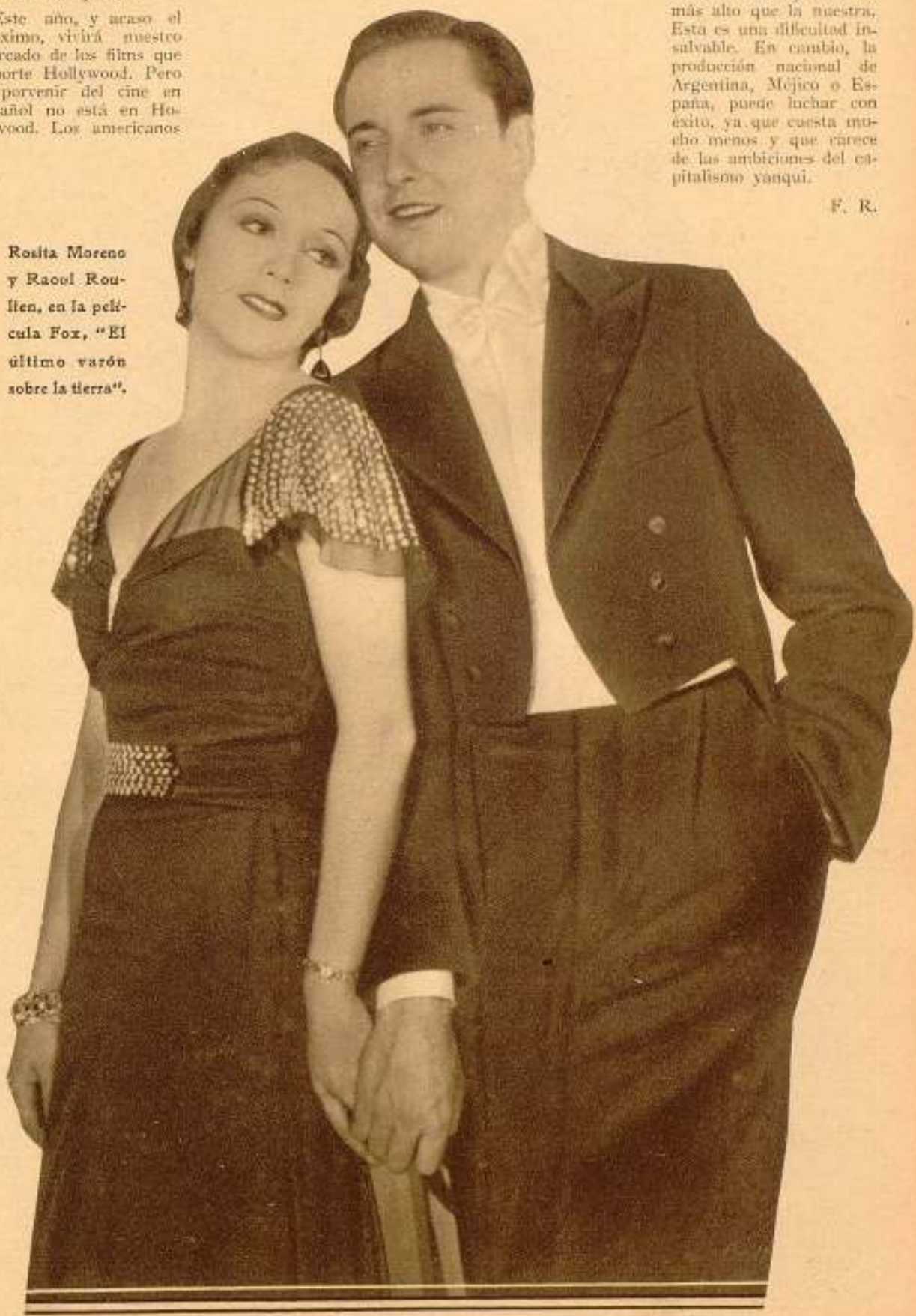
Rosita Moreno y Raoul Roulien, en la película Fox, «El último varón sobre la tierra».