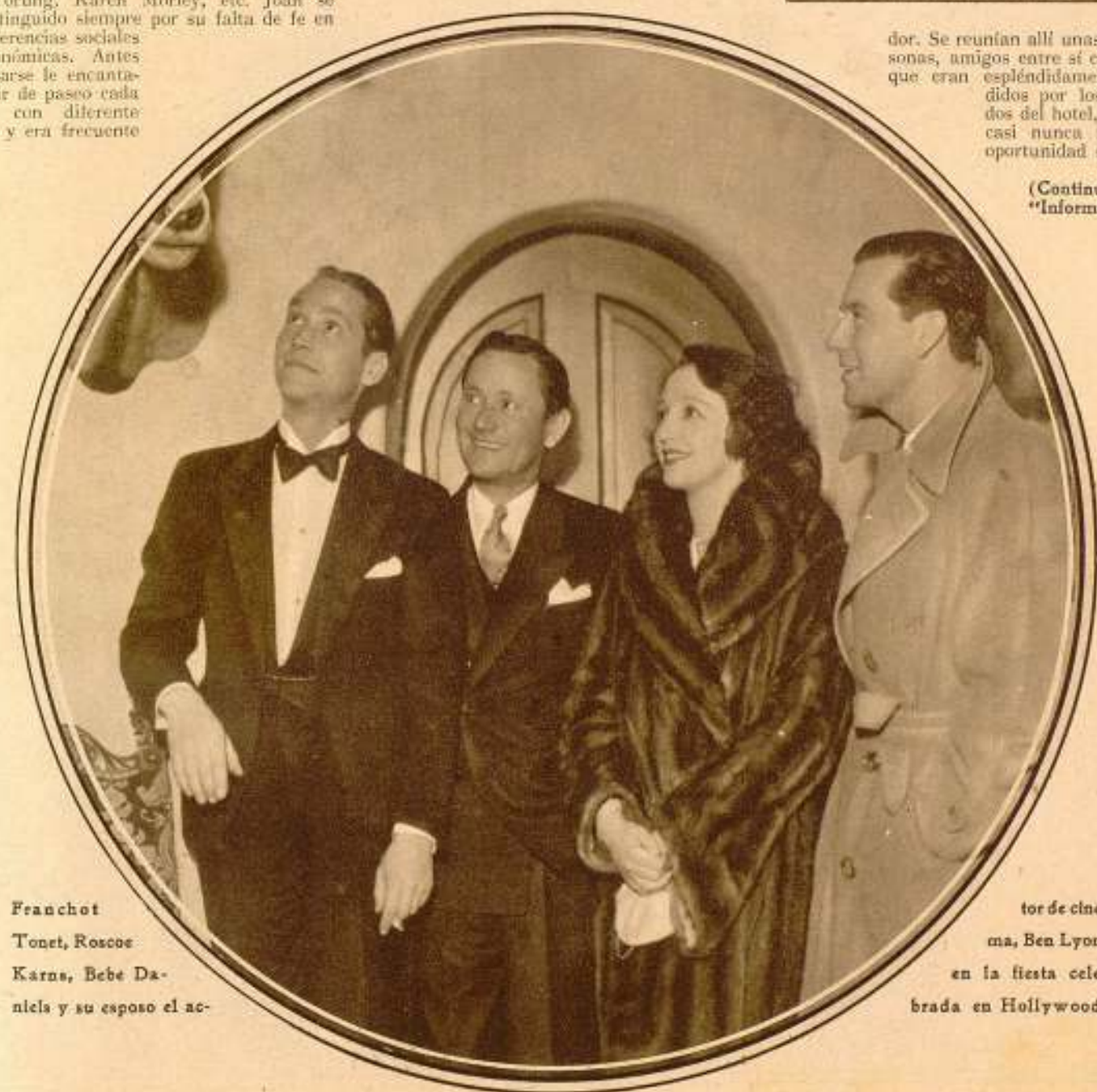
Franchot Tonet, Roscoe Karns, Bebé Da- niels y su esposo el ac-