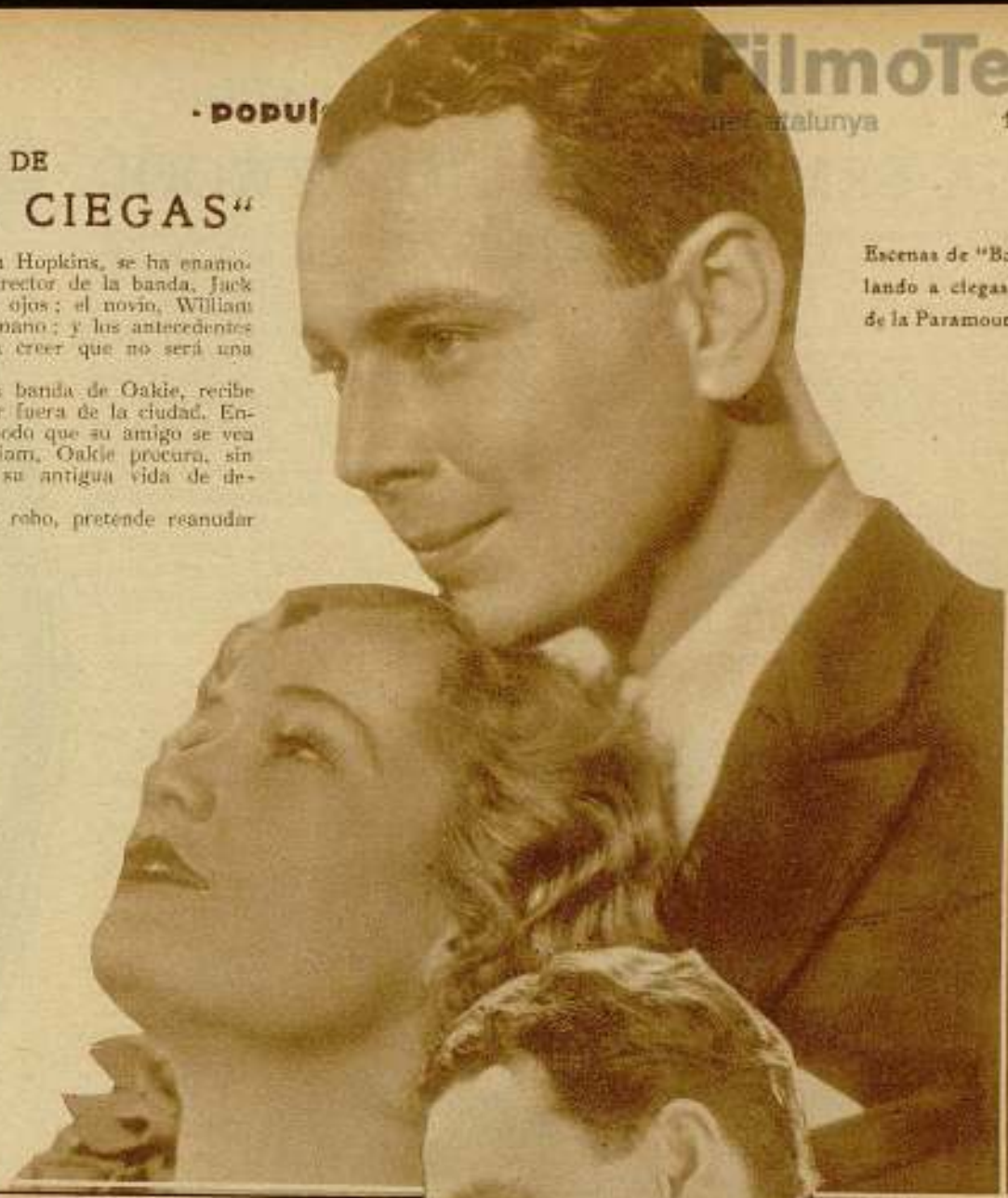
Escenas de "Bailando a ciegas", de la Paramount.

La llegada de la policía que busca a Raft, ocasiona una serie de dramáticos lanceos, en uno de los cuales recibe un balazo Jack Oakie. El herido, que se juzga en trance de muerte, exhorta a William a que se reconcilie con Miriam, que es inocente. Hacen las paces los novios, y la alegría de ellos y de Oakie llega al colmo cuando se les dice que el herido estará completamente curado antes de un par de semanas.