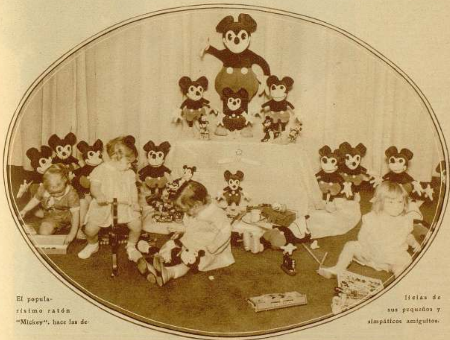
El popularísimo ratón «Mickey», hace las de-

Y he aquí el motivo de por qué la figura del simpático arcedoco mundial, cada día adquiere más preponderancia y son en mayor número la lista de sus admiradores.