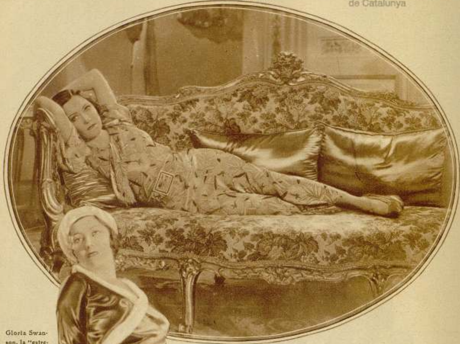
Gloria Swanson, la "estrella" de "Esta noche o nunca", de Artistas Asociados.