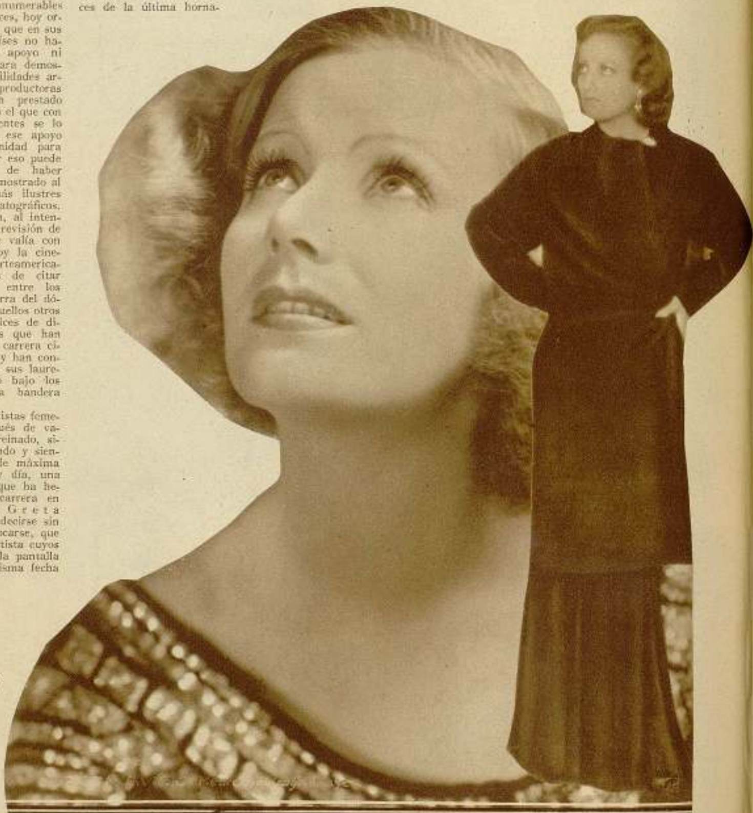
Greta Garbo, y silueta de Joan Crawford, dos de las actrices más famosas del cine yanqui.