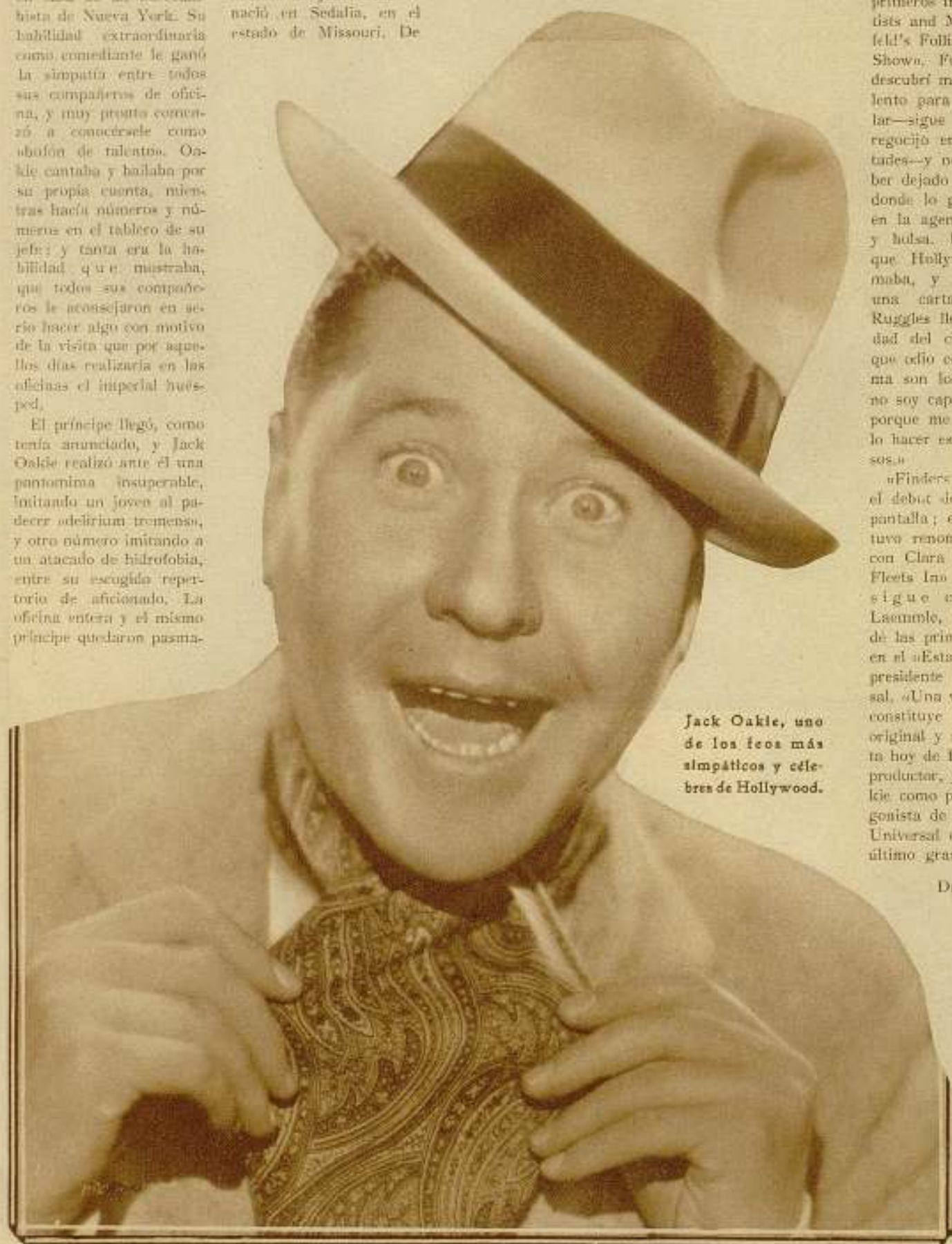
Jack Oakie, uno de los feos más simpáticos y célebres de Hollywood.