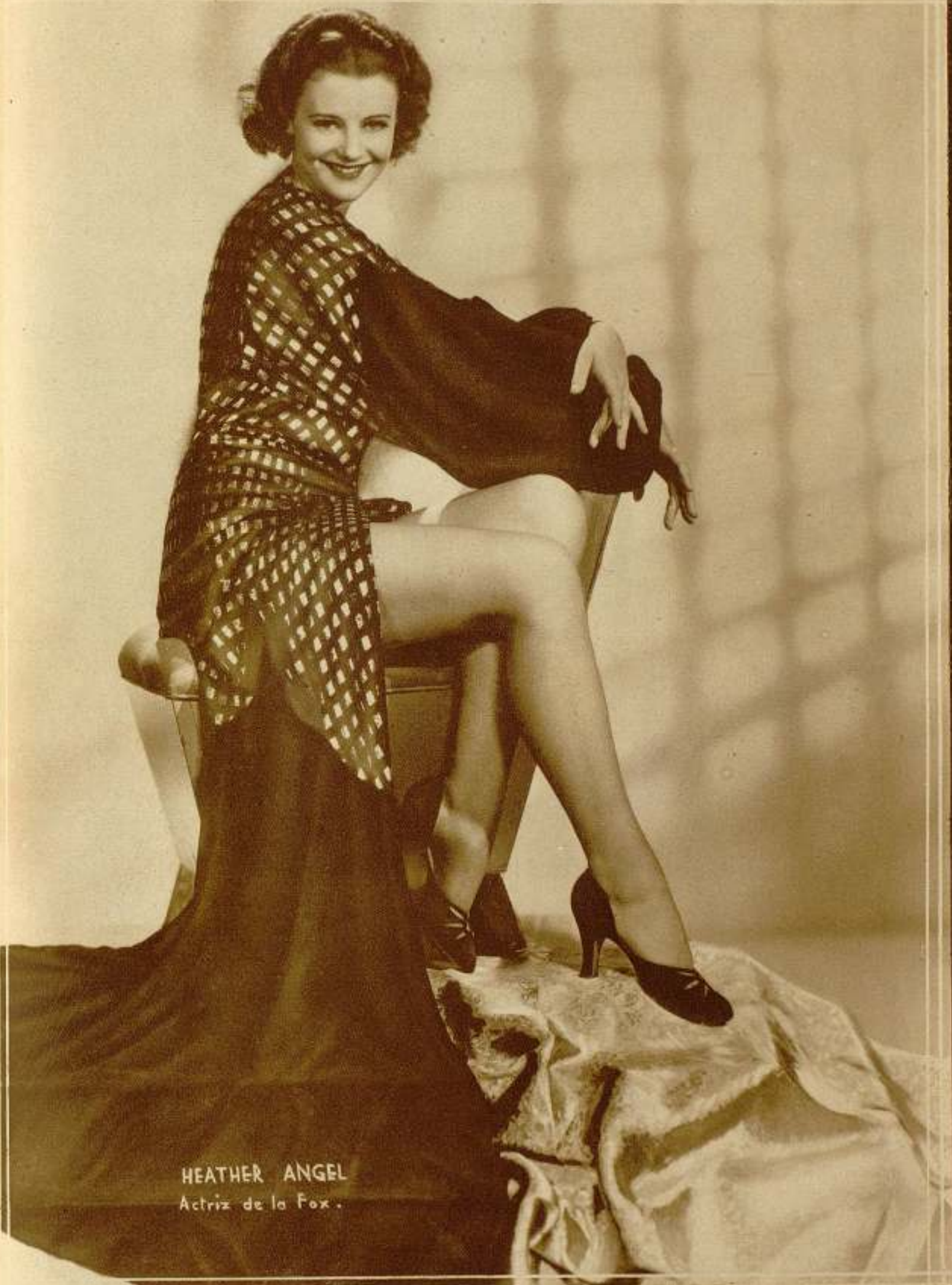
HEATHER ANGEL Actriz de la Fox.