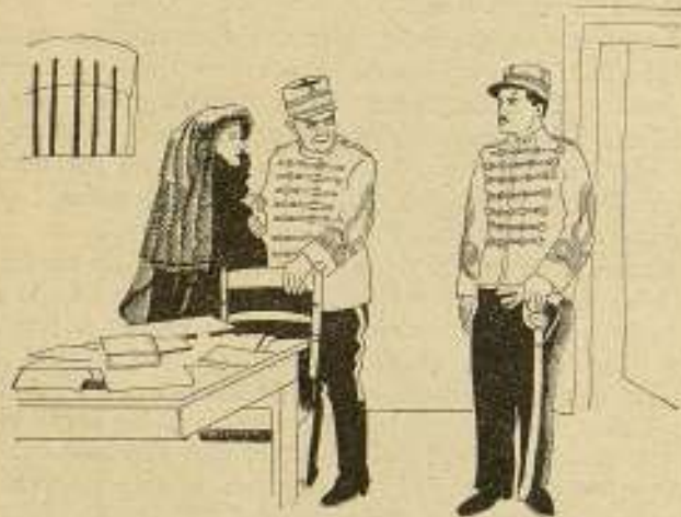
Dreyfus sintió que era mirado y el oficial volvió la espalda para que los esposos se abrazaran.

Y su voz queda ahogada por un sollozo... ¡ Qué la ale- gría también hace llorar ! Dreyfus fué conducido a prisiones militares en París para esperar allí la revisión del proceso. Allí, en una ante- sala, le espera su esposa. Va enlutada, tocada su cabeza