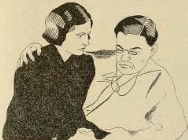
...y la esposa suplicó a Dreyfus que firmara la petición de indulto.

Dreyfus se ha tendido sobre la cama. Va hacia él su es- posa y se sienta a los pies de la misma. En sus ojos aso-