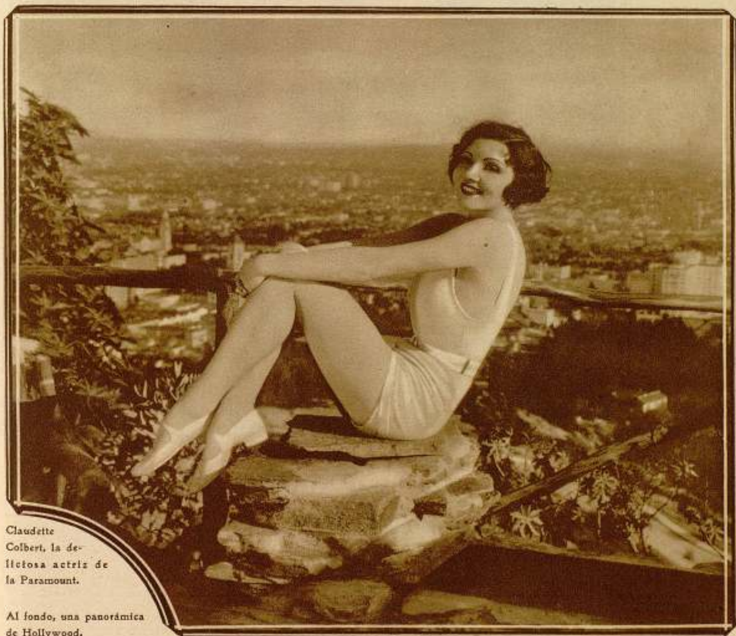
Claudette Colbert, la deliciosa actriz de la Paramount.