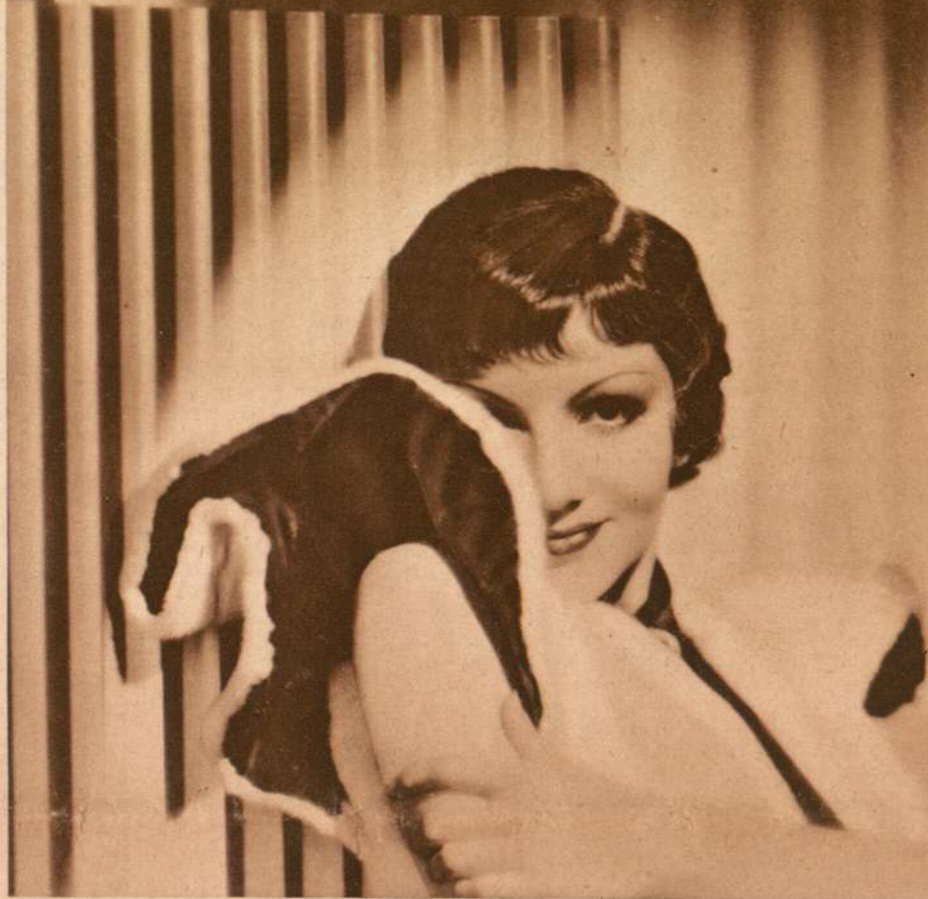
Claudette Colbert, primer premio de interpretación de la Academia de Ciencias y Artes Cinematográficas.

—Relativamente, a mi entender. Pero otro debió ser el parecer de los directivos, porque me encomendaron sucesivamente varios papeles de relativa importancia en «The Cat Came Back», «A Kiss in the Taxi» («Un beso en el taxi»), «The Pearl of Great Price», «Ver Nápoles y morir», «Fast Life» y «The Barker»; pero sobre todo debo nombrar mi trabajo en «Dinam», la obra de Eugenio O'Neill. Le he mezclado mis interpretaciones teatrales y cinematográficas, porque a estas horas ya no sabría distinguir cuáles fueron unas y cuáles fueron las otras, aunque parezca mentira. Tenga en cuenta que alterné el trabajo en el cine y en las tablas. No fué hasta el sonoro que me dediqué exclusivamente a las películas.