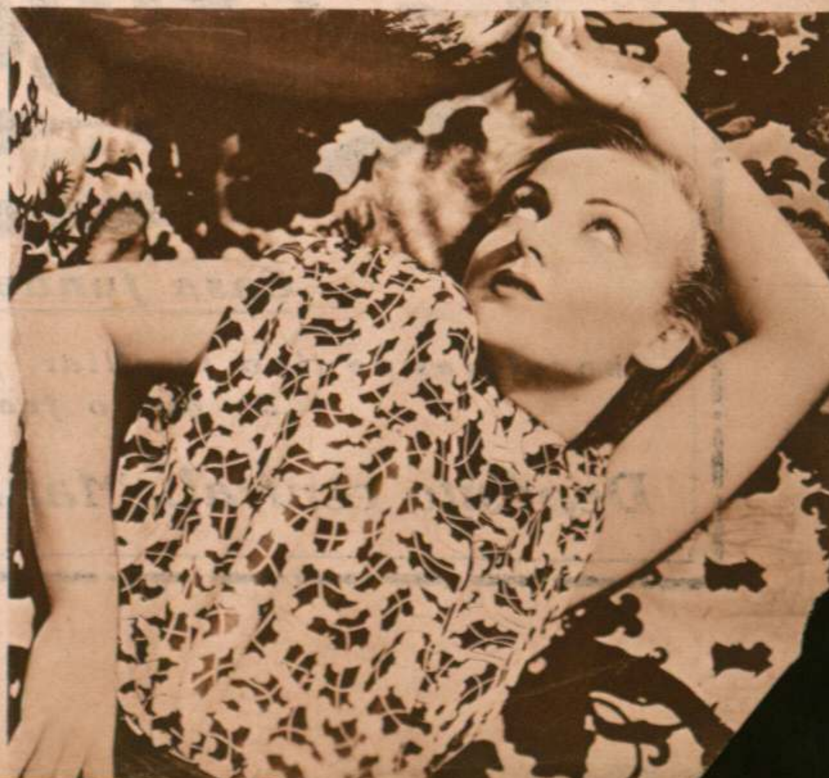
Carol Lombard, la mujer más elegante de Hollywood.