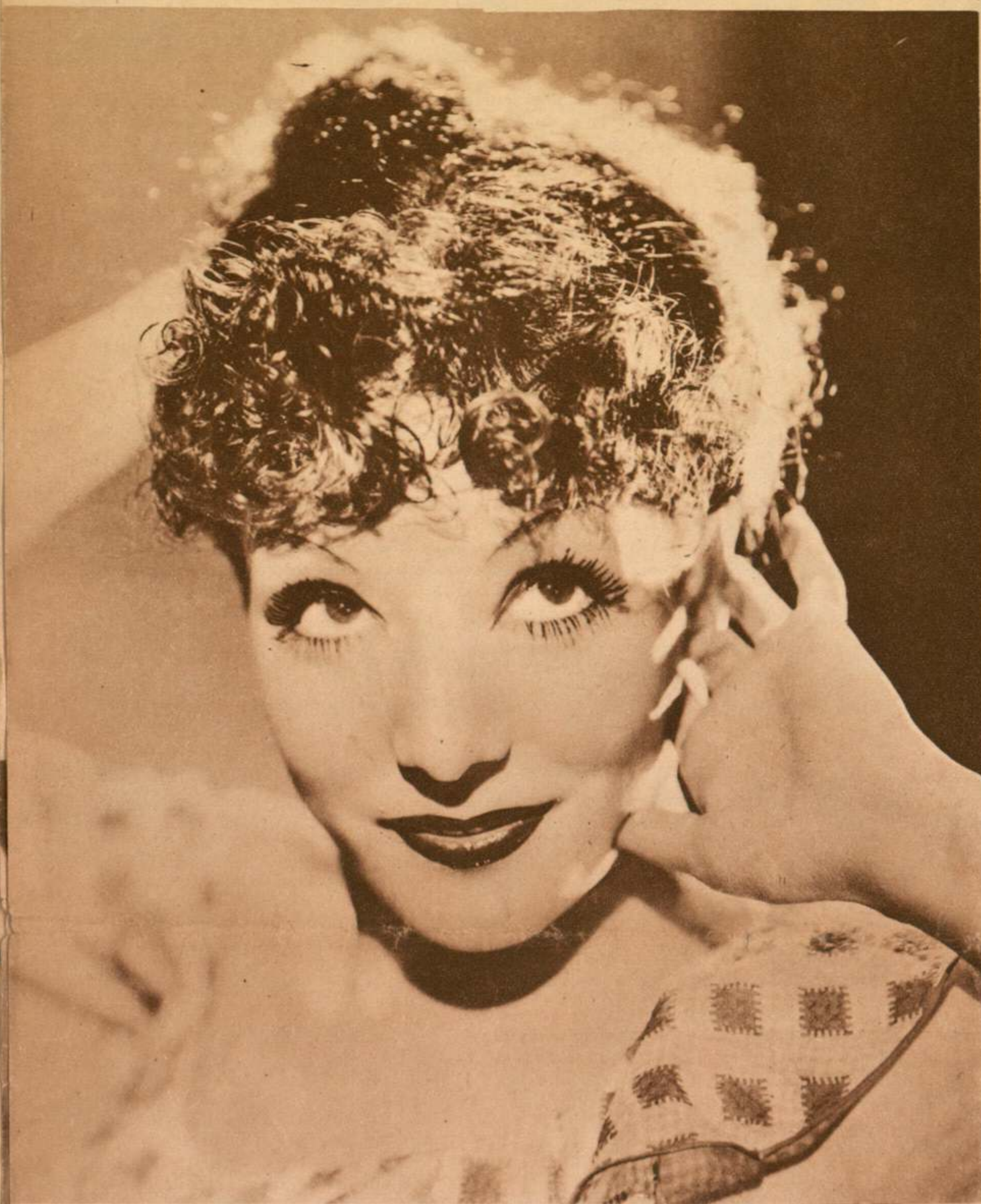
Lupe Vélez, castiza y morena, es una hembra de «frapio», capaz de ponerle cascabeles al lucero del alba.

siendo siempre la que dejamos consignada. La entrevistamos en su hotel. Pasamos a su amplio departamento. Lupe Vélez se levanta, se refriega los ojos y se despereza. Vemos recortada su silueta, ondulante y fina, de una estatura mediana, bajo un pijama de seda oscura. El color parecería más bien para un vestido, pero ella ha resuelto que sea pijama. Todo lo resuelve así, porque a ella le parece, como todo lo que hace, como todo lo que habla, como todos los juicios que lanza. Es morena, de un color mate, que hace el cutis lustroso; tiene un pelo renegrido, abundante y más bien largo, que le cae sobre la frente en dos arcos sedosos; también los ojos son muy negros, ligeramente tirados hacia arriba por la línea divergente de las cejas; tiene mucho de tropical; es un físico cálido, con color, con sello, que hacen aún más pintoresco la rapidez de los movimientos y el expresivo sabor de la palabra. Es una planta tropical colocada en el «hall» de un gran hotel.