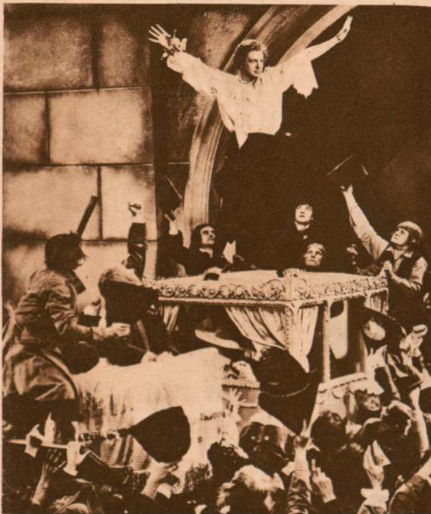
Una emocionante escena del gran film inglés, «El Consejero del Rey».

En los estudios ingleses de Ealing hemos sido recibidos en un palacio por la reina en persona. Así es, en efecto, por extraño que parezca, Reina en la película «El consejero del rey» por encarnar el personaje de la infortunada princesa inglesa Carolina Matilde, convertida luego en reina de Dinamarca, y reina por su belleza maravillosa, dulce, serena, indescriptible por la prosa vulgar de un humilde comentarista.