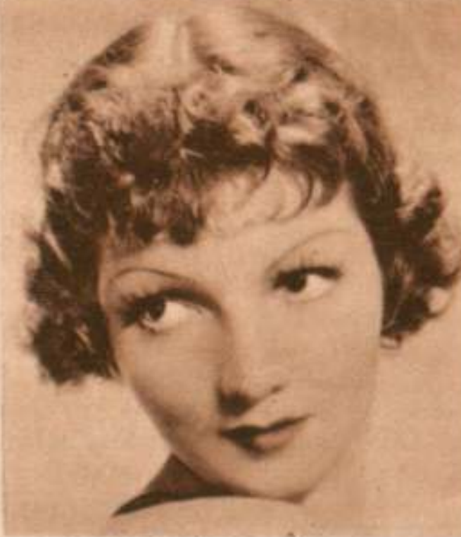
Claudette Colbert, bellísima, nos ofrece una instantánea de su rostro perfecto lleno de gracia y de sensualidad.