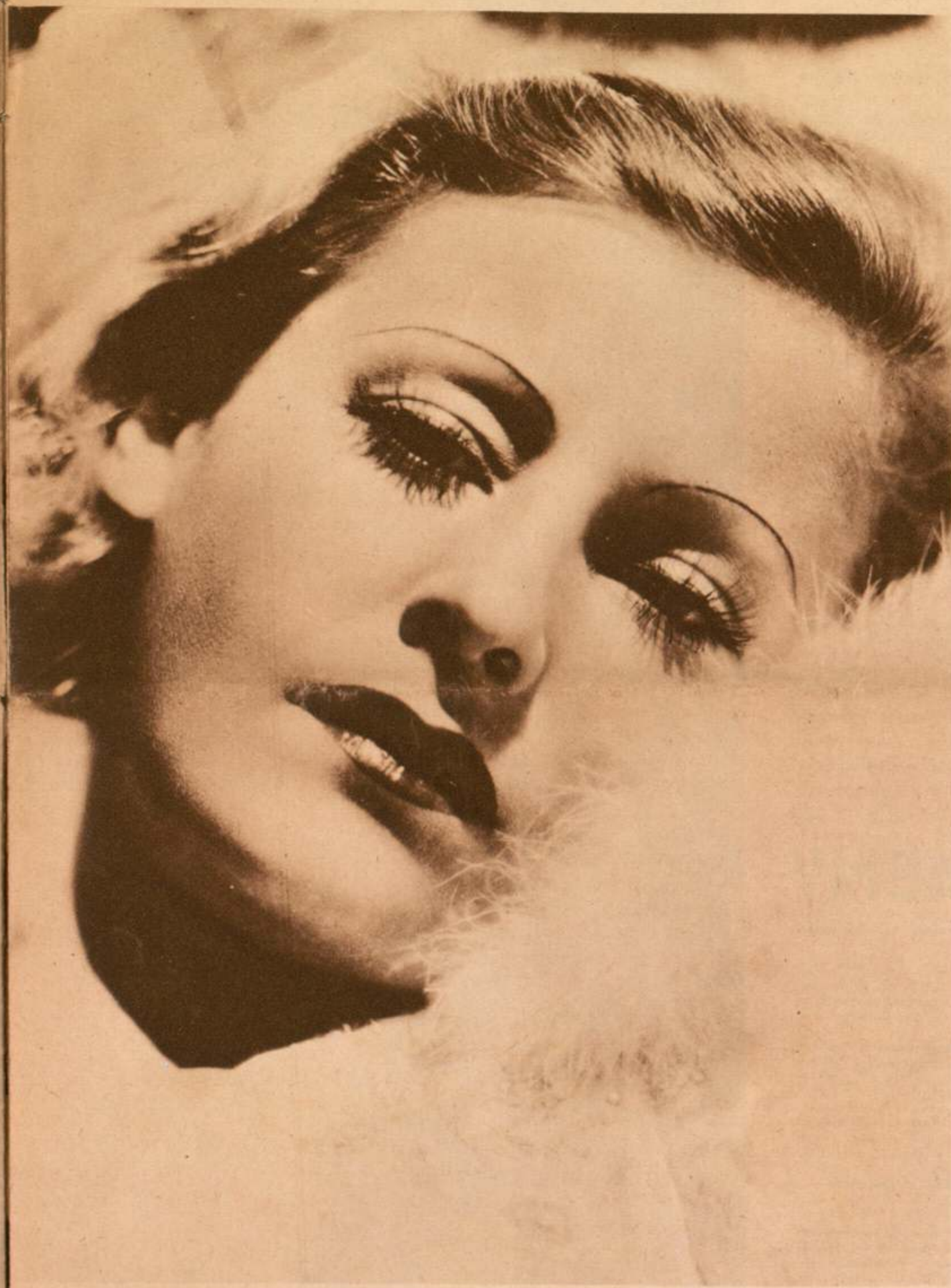
Lilian Harvey en «Rosas negras».

Los bellos paisajes de Finlandia, el puerto de Helsingfors, vida y costumbres finlandesas, todo eso formará el fondo de la acción en que se desarrolla este film.