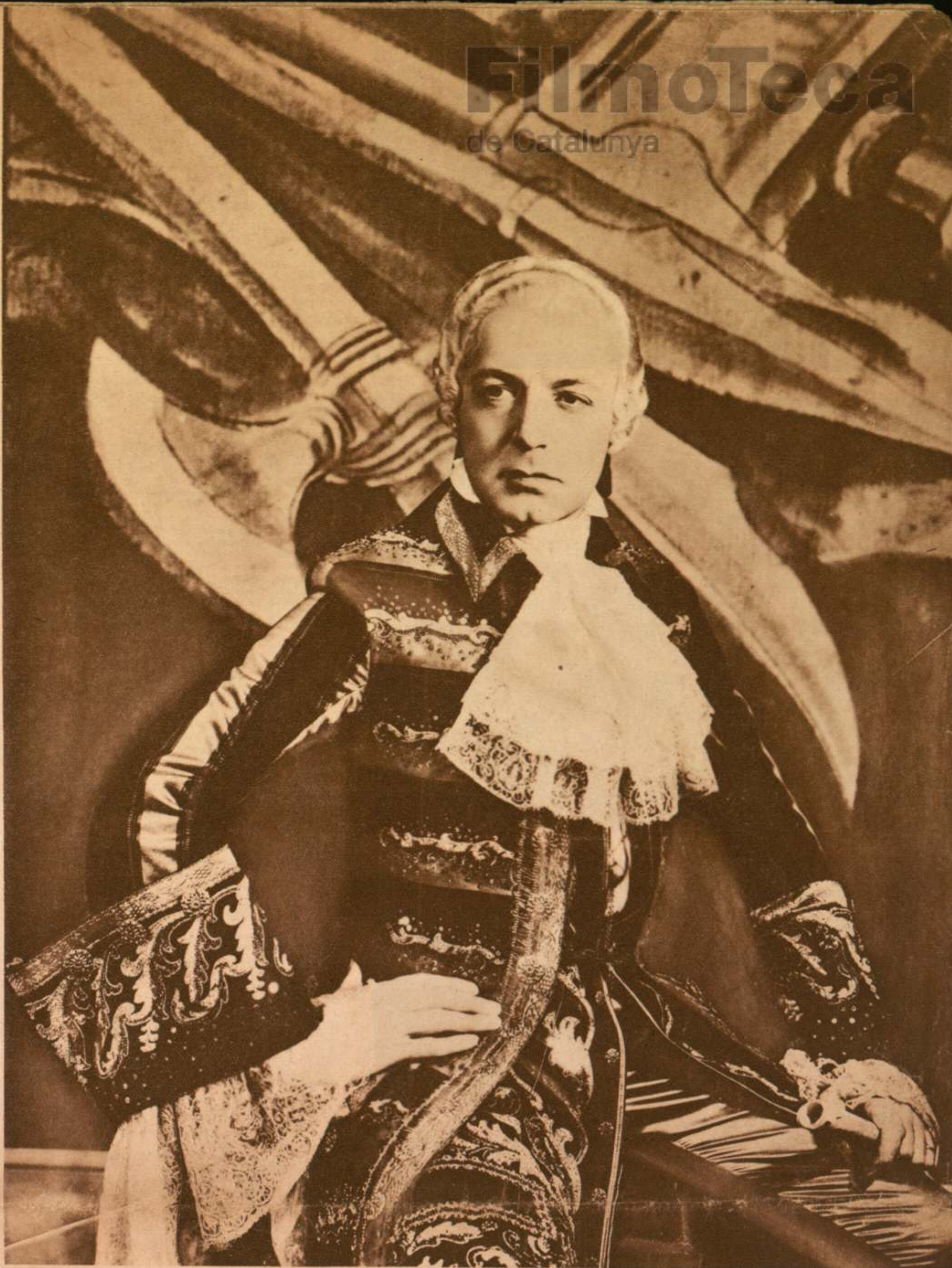
Clive Brook, el gran actor de cine norteamericano, protagonista del film inglés «El Consejero del Rey», que distribuyen Selecciones Capitolio.