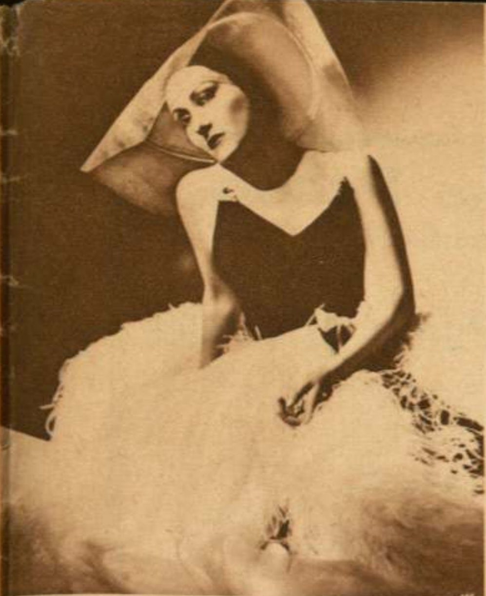
Gloria Swanson, la admirable rival de Constance Bennett.