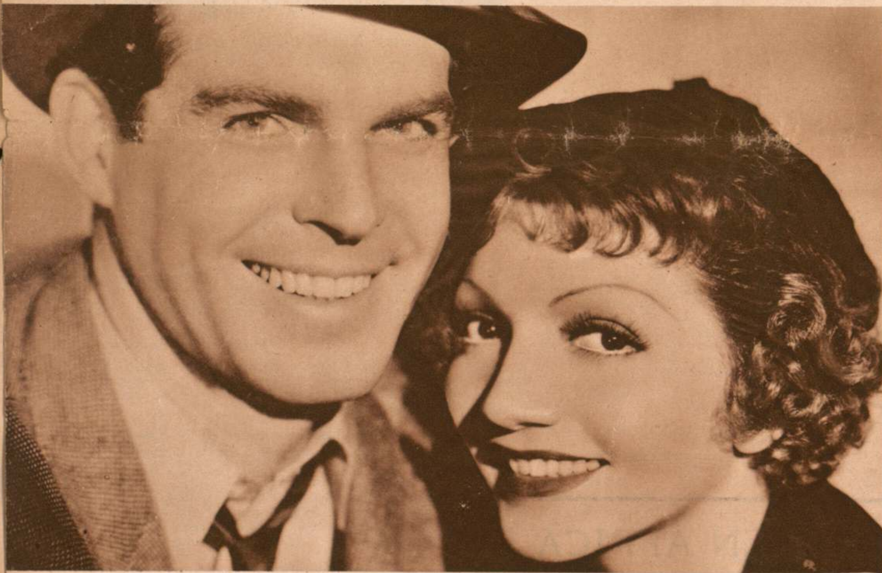
Claudette Colbert y Fred Mc. Murray en «El lirio dorado», película en la que obtuvo la famosa artista de la Paramount el primer premio de interpretación del año 1934.