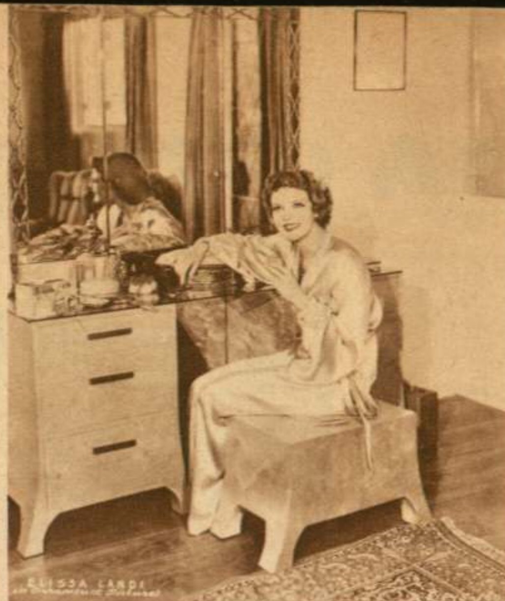
Elissa Landi, cuyos vestidos se copian y cuyos gustos se siguen en Hollywood.

tas sobre los pretendientes, los trajes que exhibían—exclusivamente creados para ellas— y los papeles que interpretaban para el cine.