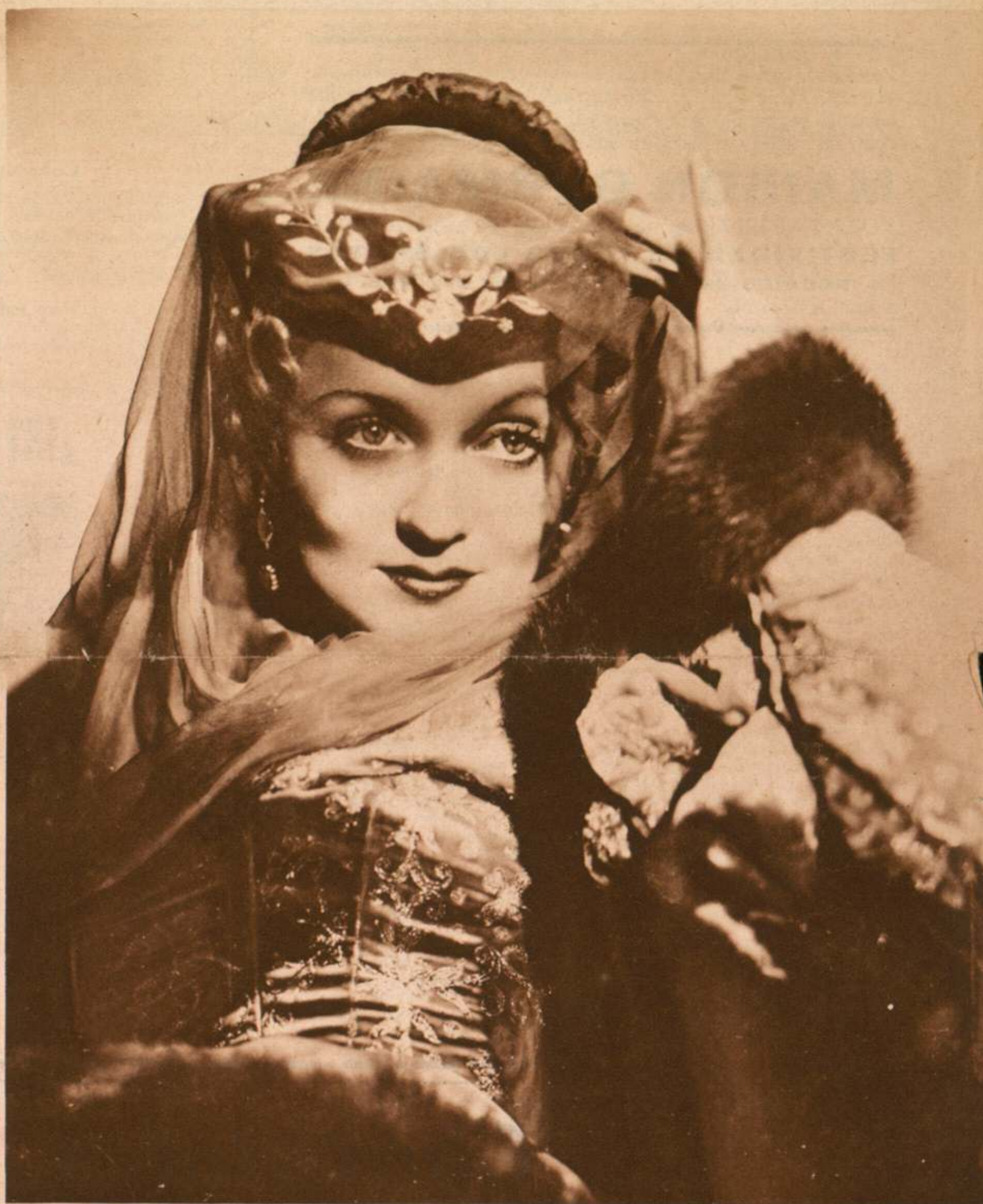
Kay Francis, una de las que, en los últimos tiempos, más se han preocupado en Los Angeles de imponer modas y modelos.