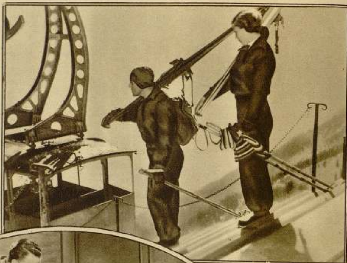
Escenas de "El padrino ideal", de Exclusivas Huet.

Y Andrés, demasiado encariñado con la muchacha, demasiado rendido siempre a sus caprichos, accede a crear-