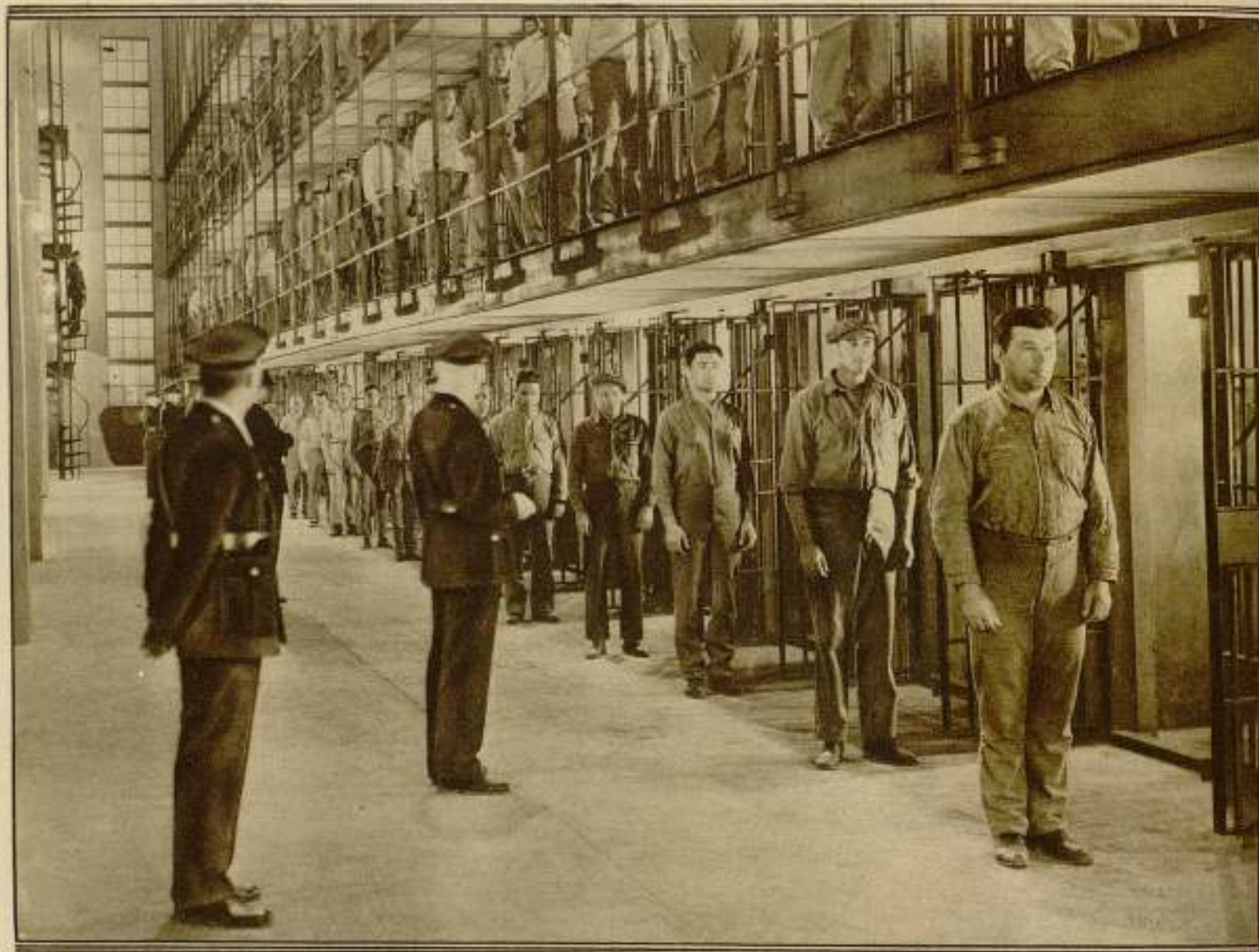
Una escena de la película de la Warner Bros. "20.000 años en Sing-Sing"

En cambio Loretta Young está en las celdas de los criminales más endurecidos; de los más rebeldes penados. ¿Por qué? Lewis E. Lawes dice en su report que ha de ser precisamente por el gran contraste, porque los presos ven en ella a la mujer comprensiva y buena, que si la hubieran encontrado en el principio de su vida, quién sabe si les hubiera evitado muchísimos males... Los presos no han sabido explicar el por qué