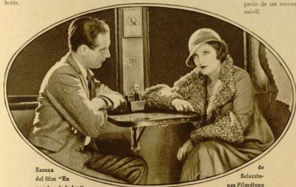
Escena del film "En nombre de la ley"

¿Vencerá la Ley en esta lucha sin piedad?