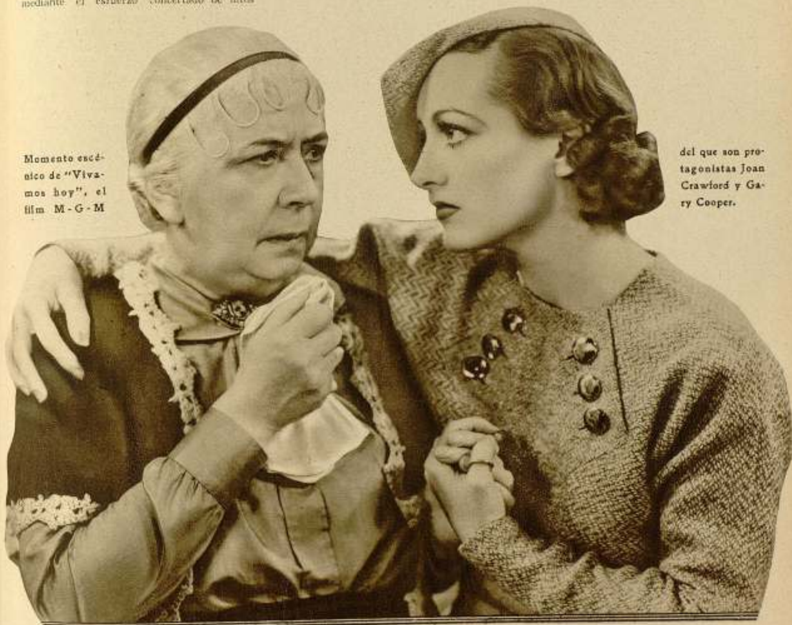
del que son protagonistas Joan Crawford y Gary Cooper.