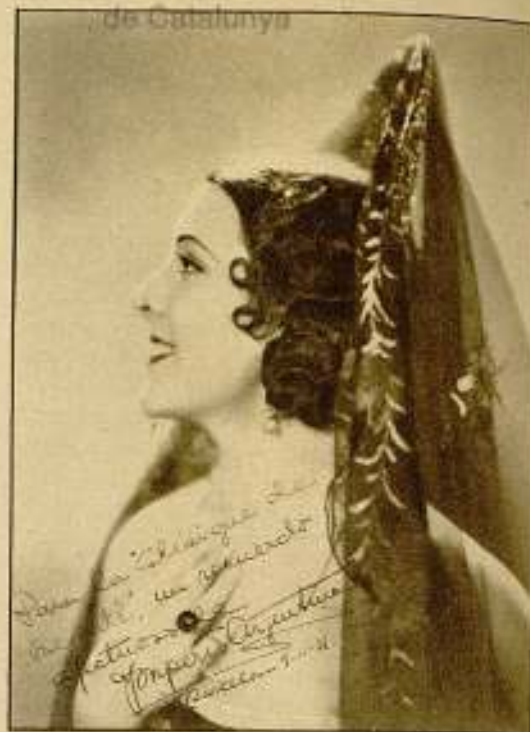
CLINIQUE DE BEAUTÉ - Rambla de Cataluña, 5

iniciador de la fabricación de automóviles en grande escala.