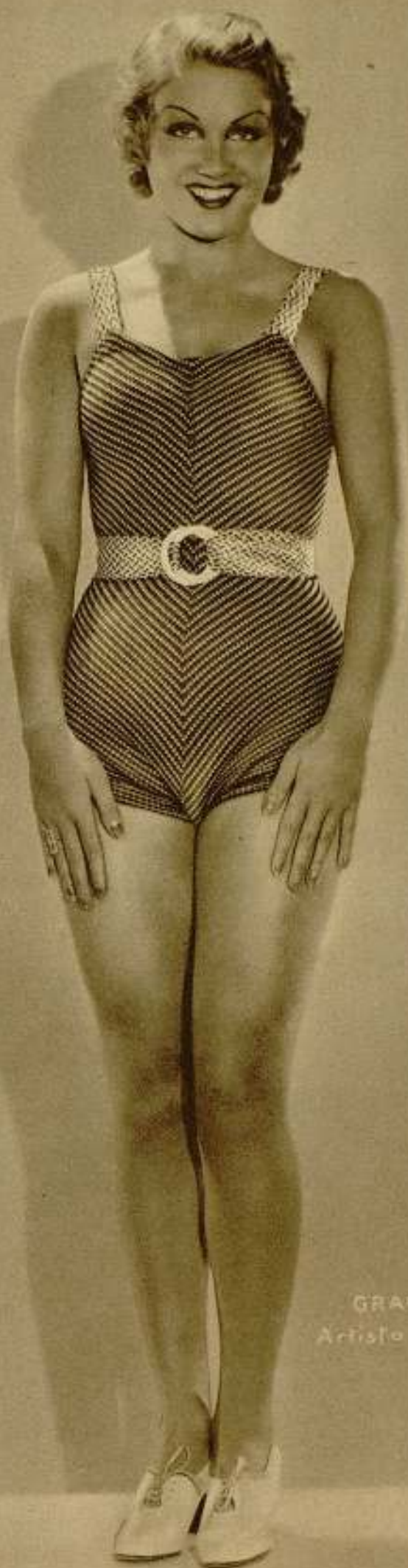
GRACE BRADLEY Artista de la Paramount