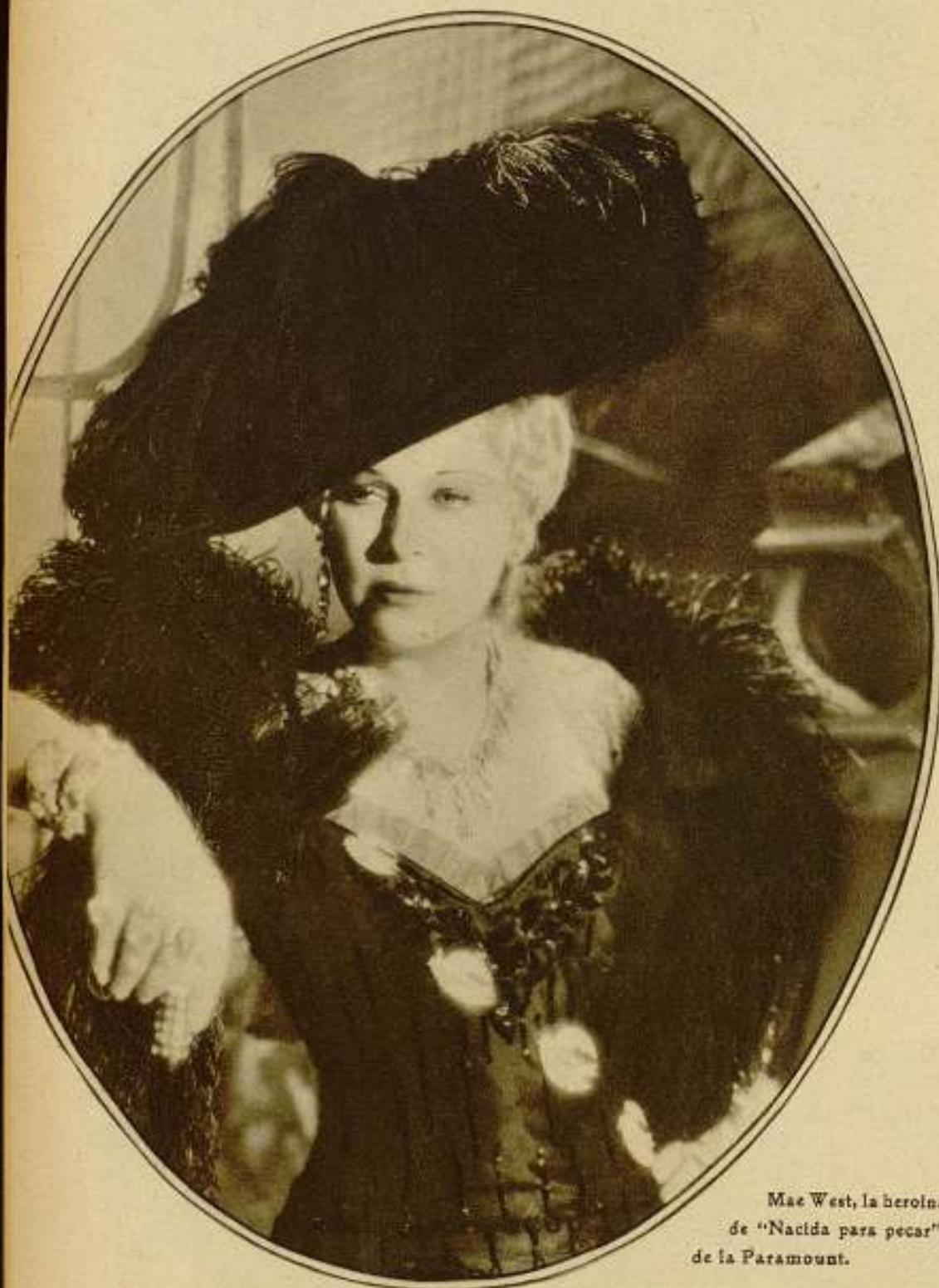
Mae West, la heroína de «Nacida para pecar», de la Paramount.

En esta obra se combina el ambiente de la vida de alta sociedad de Nueva York con el del circo. Su reparto, a más de Mae West, incluye a Cary Grant, Edward Arnold, Gertrude Michael, Gregory Ratoff, Kent Taylor y Dorothy Peterson.