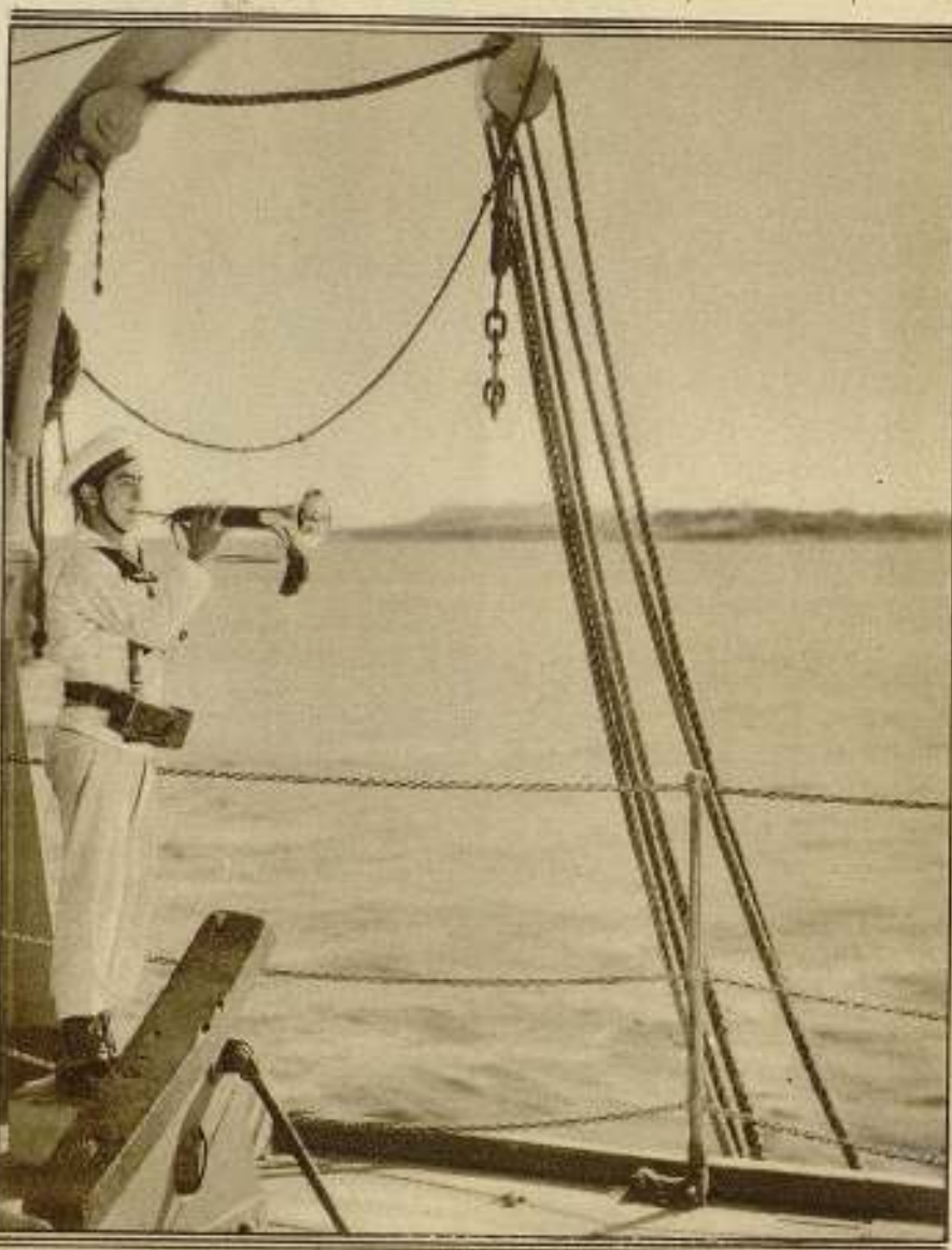
Una escena del film nacional de Distribución Orpheo Film, “Susana tiene un secreto”.