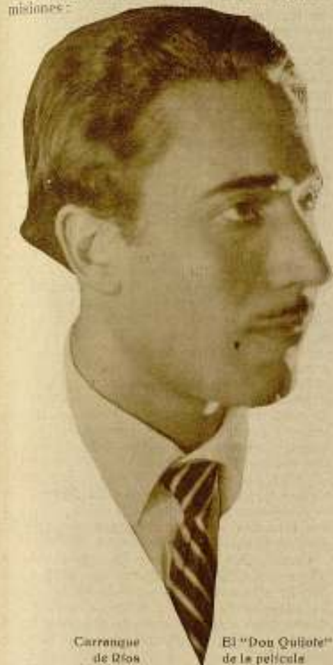
Carranque de Ríos

La dirección de una película, que es un bello arte y por lo tanto un arte liberal, está al alcance de todo el mundo. A esta dirección le corresponden dos grandes misiones: