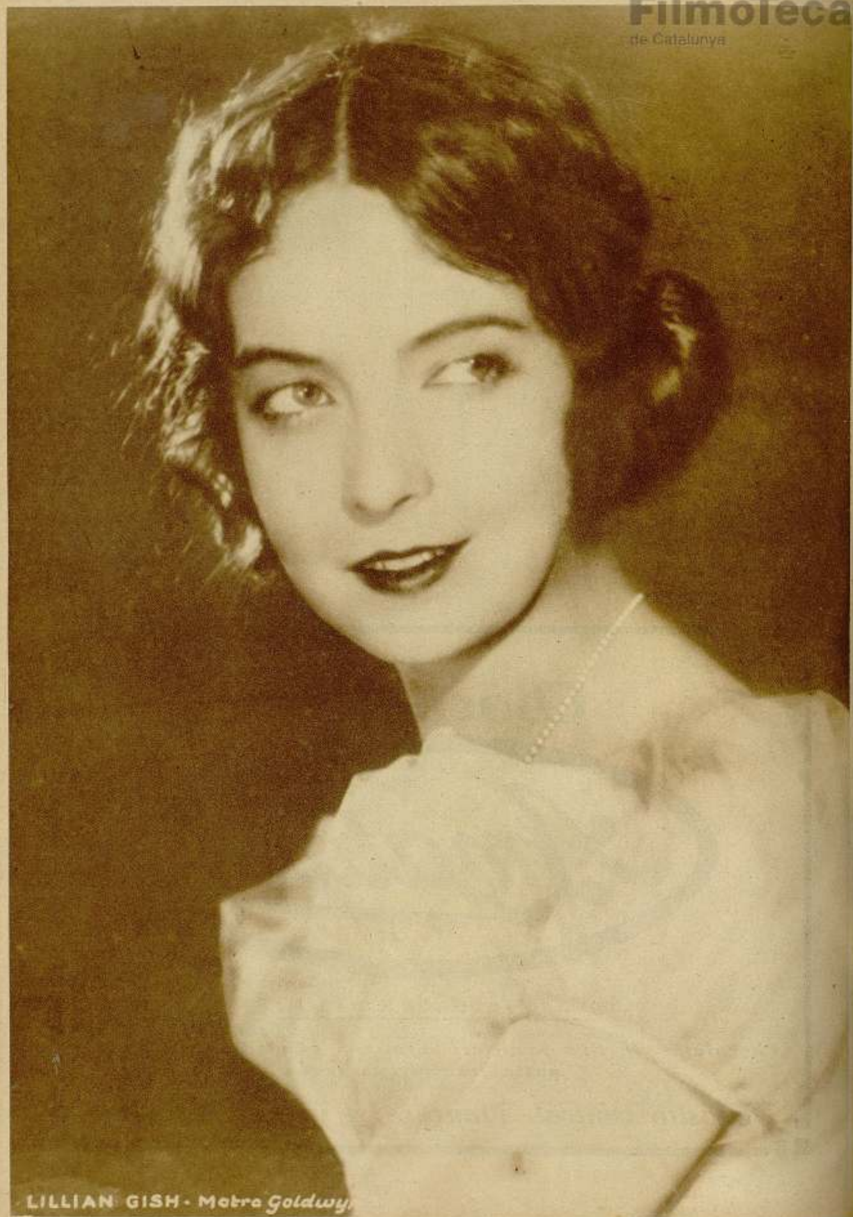
LILLIAN GISH - Metro Goldwyn