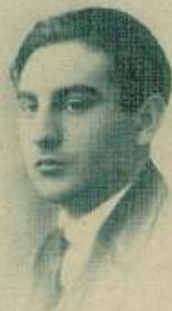
El escritor Francisco de Ayala.

—Piensa usted igual que Francisco Ayala.