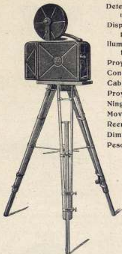
Aparato dispuesto para proyectar