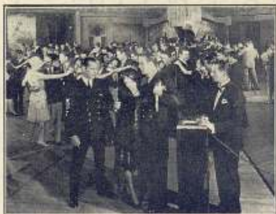
Una interesante escena de Submarine

En El gran Charco , película Paramount que está filmando actualmente en compañía de Maurice Chevalier, miss Colbert hace un derroche de riqueza en su vestuario que no tiene segundo en la historia del cine. Caracterizando el papel de hija de un millonario que frecuenta los centros aristocráticos europeos y americanos, luce en cada escena un vestido distinto. Cada uno de estos vestidos son creaciones de la misma artista, quien se preocupa tanto de su vestuario en escena como de los de uso personal. Es de advertir que todas las prendas que luce en El gran Charco coinciden, tanto en forma como en objetivo, con las ideas que la artista expone en este trabajo y pueden servir de modelo para la elegante lectora que busque en su atavío la expresión emotiva de su personalidad.