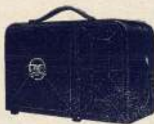
Aparato enteramente cerrado

Solicite catálogos y presupuesto, que remiten gratuitamente los agentes exclusivos para España: