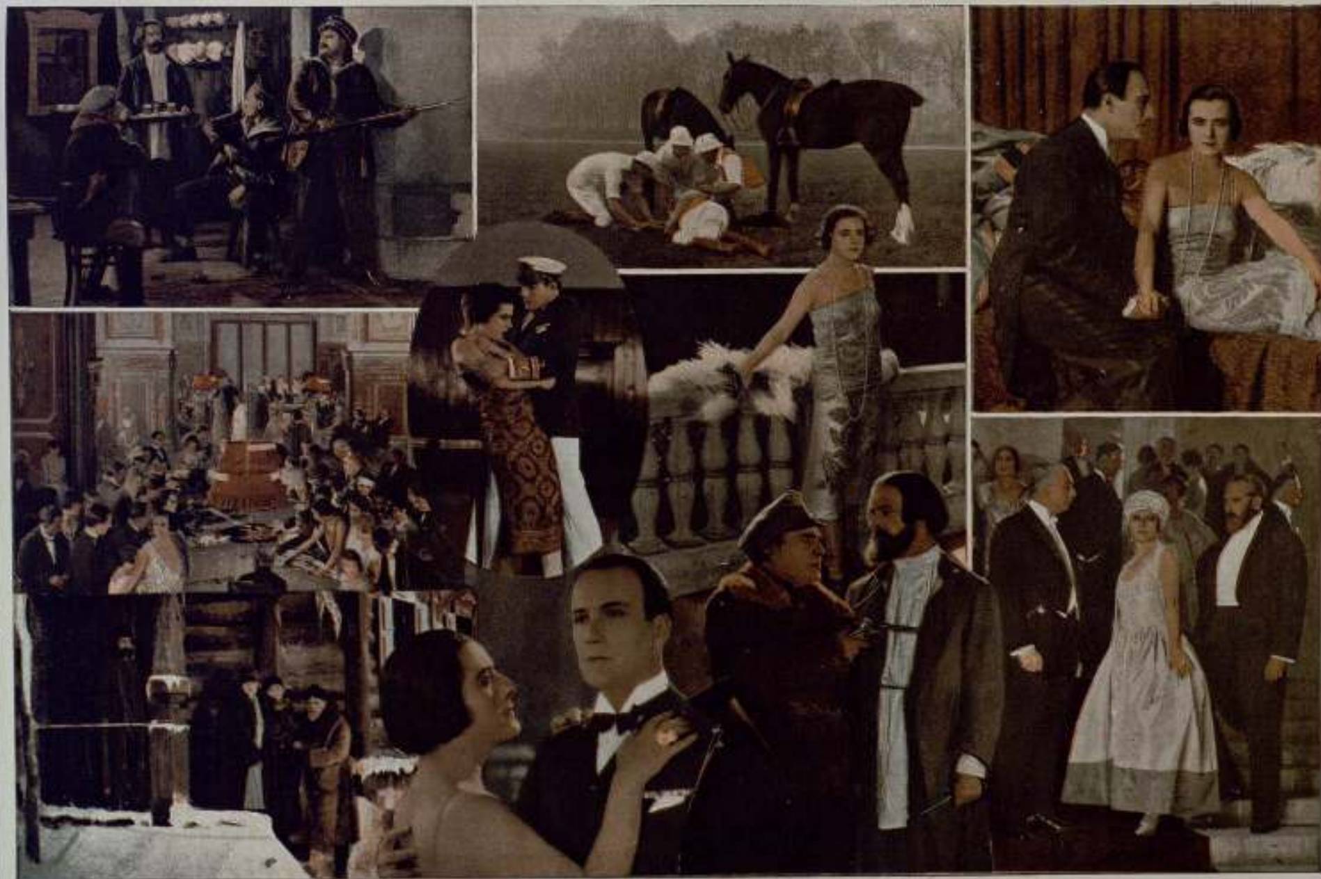
Algunas escenas de EL FIN DE MONTECARLO