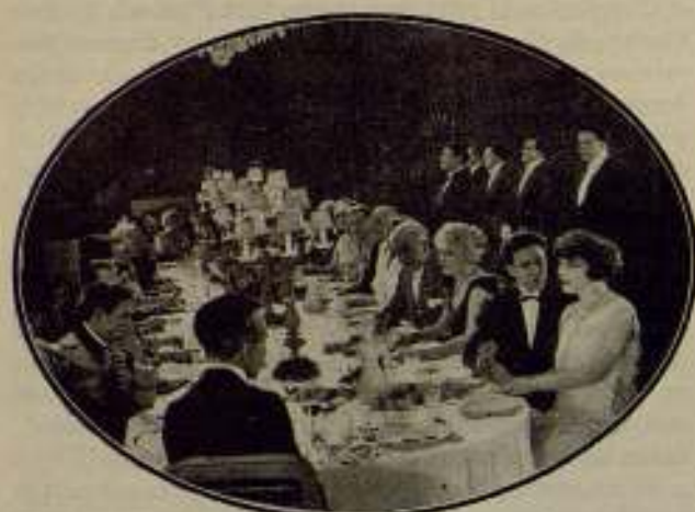
Una escena de la obra Boy , cuya marcha triunfal sigue en todos los cines de España. Editada por Goya Films, exclusiva de Selecciones Capitolio.