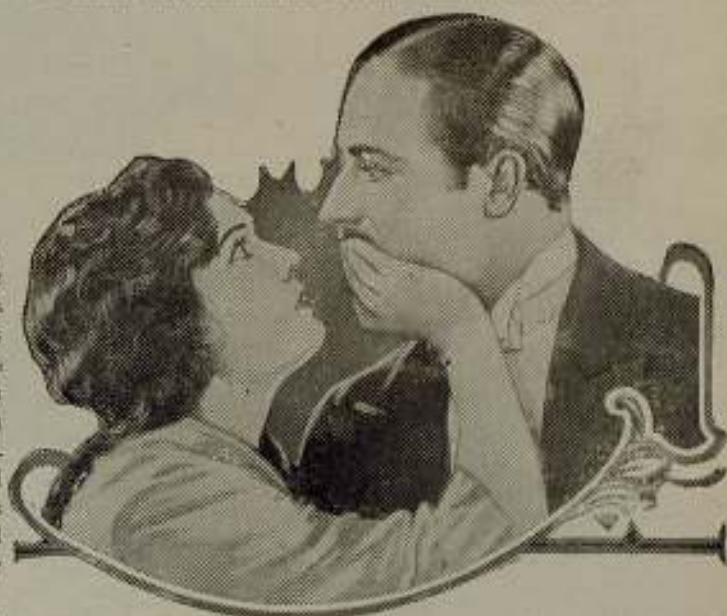
Pola Negri y James Hall en Hotel Imperial , la gran producción de la Paramount Picture, dirigida por A. Mauritz Stiller

Cada uno de sus movimientos, de sus gestos, de la expresión de cualquiera de sus emociones, naturalmente, sin cálculo, sin nada que revele el artificio, viene a formar la personalidad de esta artista. Y esto, a no