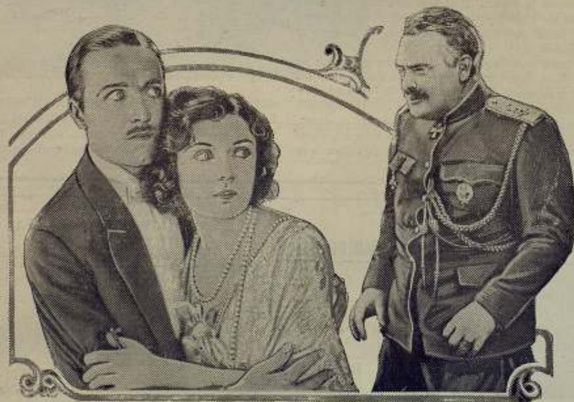
Pola Negri, James Hall y George Siegmann en una escena de la producción de Mauritz Stiller Hotel Imperial , editada por Paramount Picture