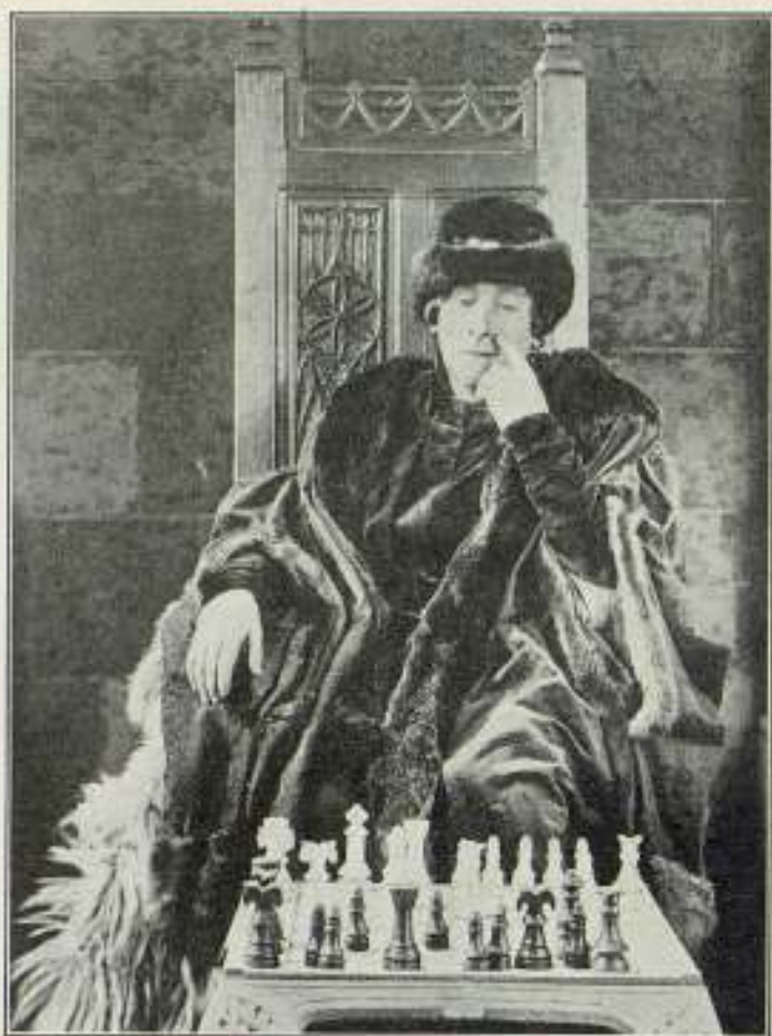
Charles VIII (Luis XI)

había recogido en sus Estados a su sobrino, el heredero del Trono, el Delfin, desterrado por su padre, El futuro Luis XI, al contrario que su primo Carlos, se deleitaba con el trato de los humildes. Bajo su aspecto de despreocupado poseía un alma ardiente y guardaba un cariño a la Francia, cuyos males conocía. En lo más recóndito de su corazón acariciaba el proyecto de realizar la unidad nacional y de abatir el poder de los Señores feudales. Carlos y Luis estaban destinados a empeñarse en una lucha de la que dependía el porvenir de la Francia. Las aspiraciones de esta Francia dividida se encontraban encarnadas en dos jóvenes a quienes el amor había aproximado: Juana Fouquet, hija de Maese Fouquet, platero, ahijada del Delfin, y Roberto Lottereau, poeta estandarte de Borgoña, hermano de leche de Carlos el Temerario.