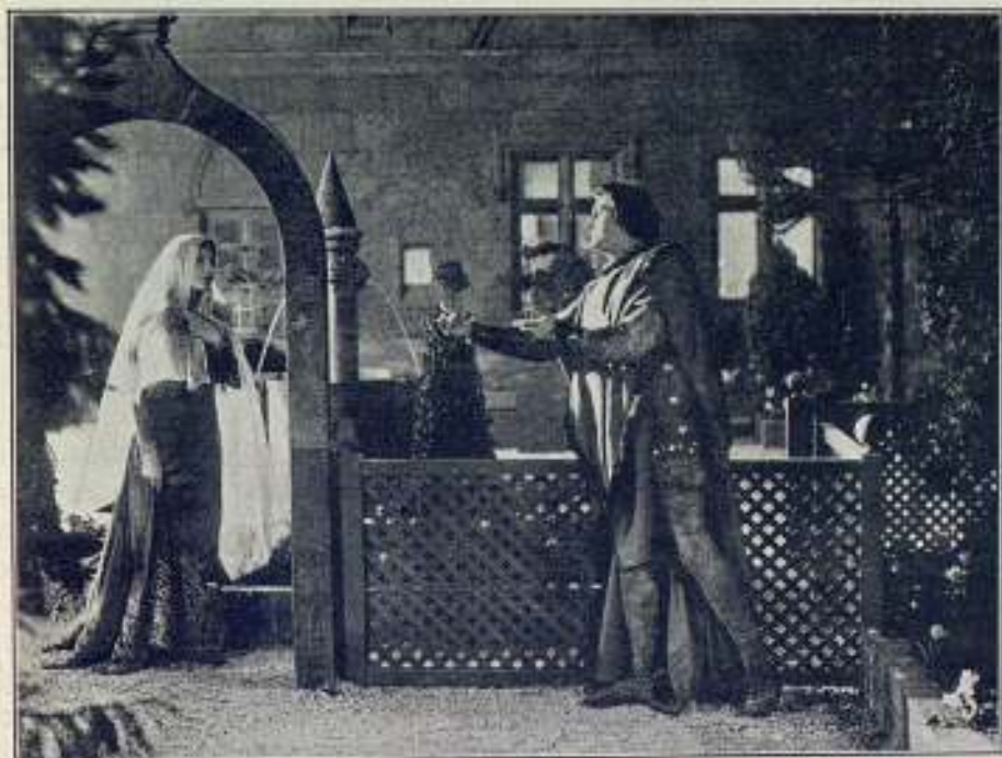
Las aspiraciones de esta Francia dividida...

Durante la representación, Roberto Lotereau sale para cumplimentar una misión de su Señor y tras él lo hace Juana, encontrándose fuera de la tienda donde se celebra la fiesta, pero cuando van a decirse sus amores, el Señor del Lau se interpone entre ellos obligando a Roberto a ir donde el Temerario le ha mandado y a Juana a acompañarle a la