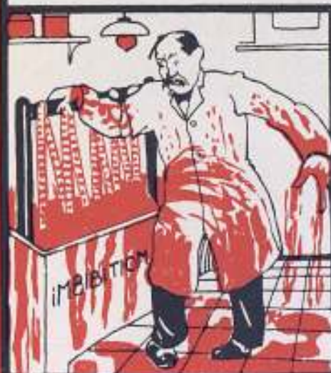
El pobre chico no conoce..

El fastidioso entintado pasó ya a la historia empleando nuestro film de color.