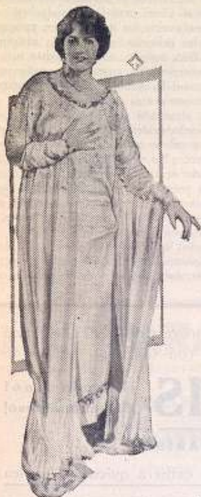
Doris Kenyon elige un vestido de seda para sus horas de ocio

Estos vestidos negligée se hacen rápidamente y son esenciales para toda mujer de distinción. Ciertamente que muchos de ellos sólo pueden ser usados por las señoras en la inti-