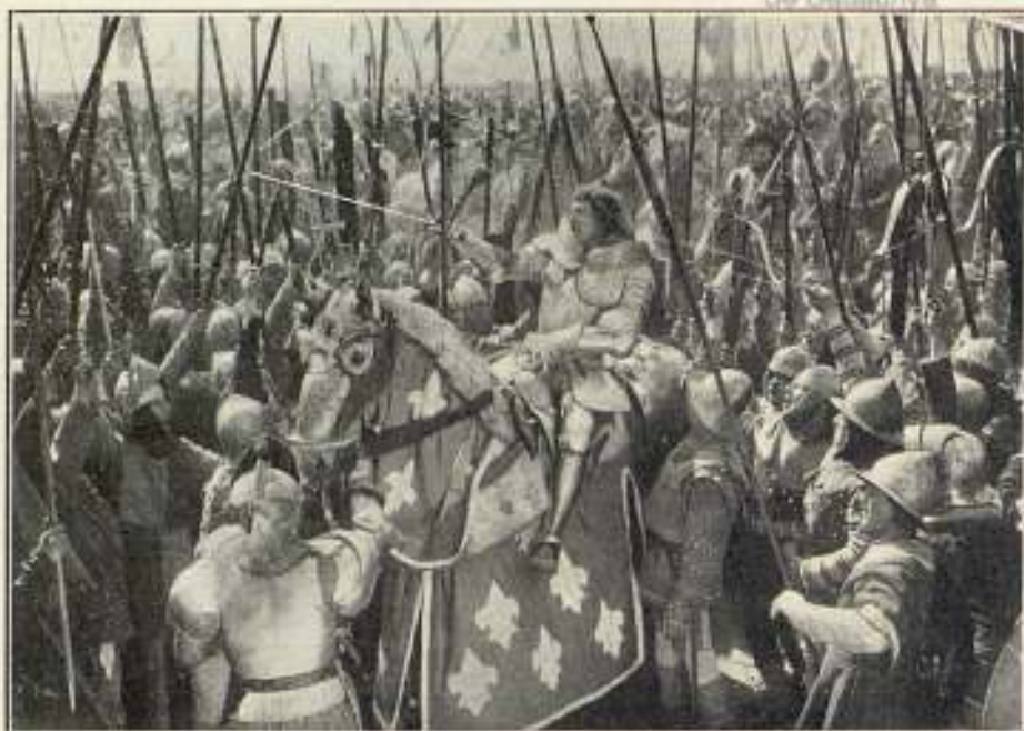
Luis XI a Montlhéry

recepción privada de aquél, en la que la dice que verá al Rey.