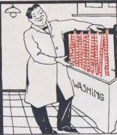
el film Gevaert coloreado.

El fastidioso entintado pasó ya a la historia empleando nuestro film de color.