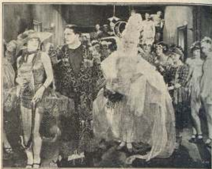
Una escena de La mujer que supo resistir . Obra perteneciente a Selecciones Capitolio, cuyo próximo estreno se anuncia en los aristocráticos Salones Kursaal y Cataluña