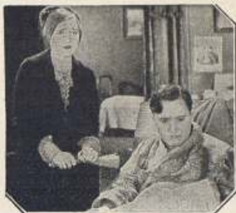
Agnes Ayres en una escena de Bluff , producción Paramount Pictures.