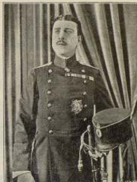
Stuart Holmes en el papel del "Duque Miguel" (Miguel el Negro)

Los principales intérpretes de la grandiosa producción