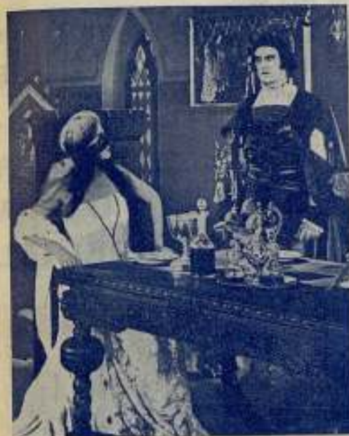
Una escena de la obra