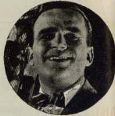
DOUGLAS FAIRBANKS en

Nuevas producciones de la temporada 1923 1924