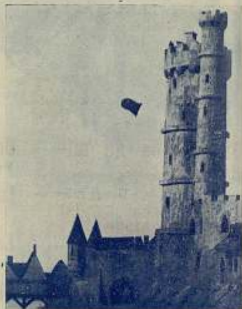
La célebre «Torre de Nesle»