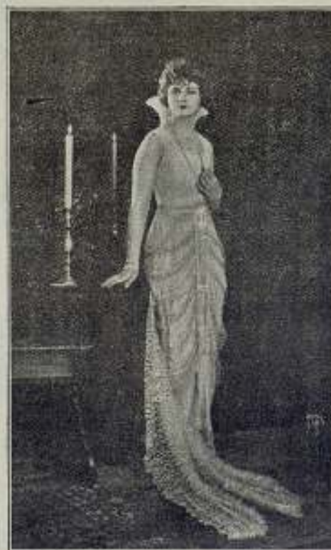
Alice Terry en el papel de "Princesa Flavia"