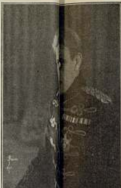
Lewis Stone, en el papel de "Rodolfo Rassendyll" "Rey Rodolfo"