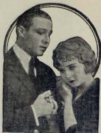
Rodolfo Valentino y Alice Terry en una escena de la película Eugénie Grandet , de las «Selecciones Capitales»

La Sociedad Exprinter se encarga de organizar el viaje desde el punto de salida, Inglaterra, Bélgica, Holanda, Suiza, España u otros países.