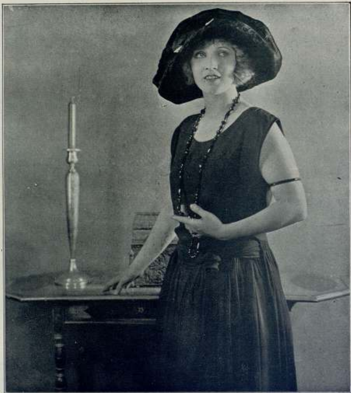
MARY MILES MINTER

La deliciosa actriz, creadora del No me llame usted chiguilla y Norah , del