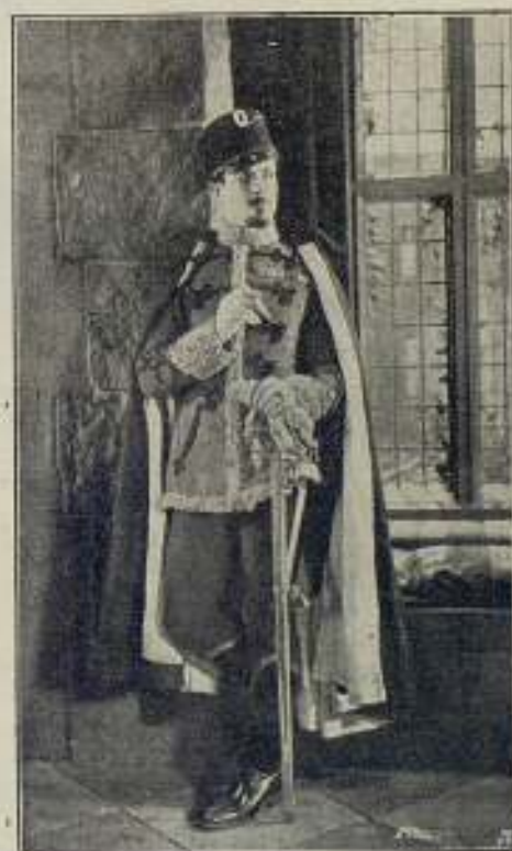
Ramón Navarro en "Roberto de Hentzen"