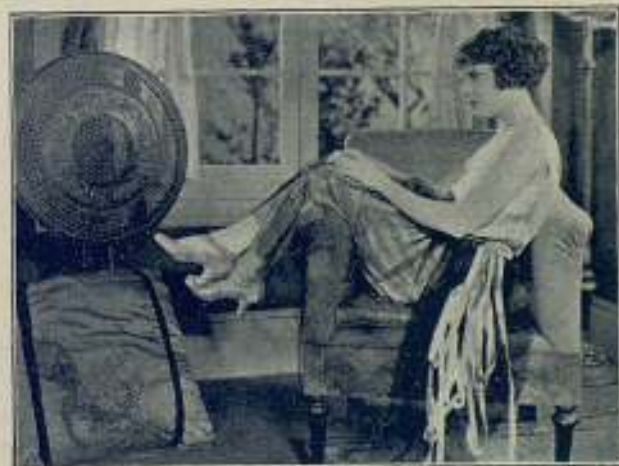
STRUCK VIOLA DANA, en la película La fuga de la novia . Selección «Capitales»