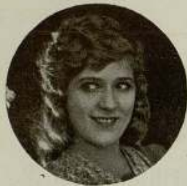
MARY PICKFORD en