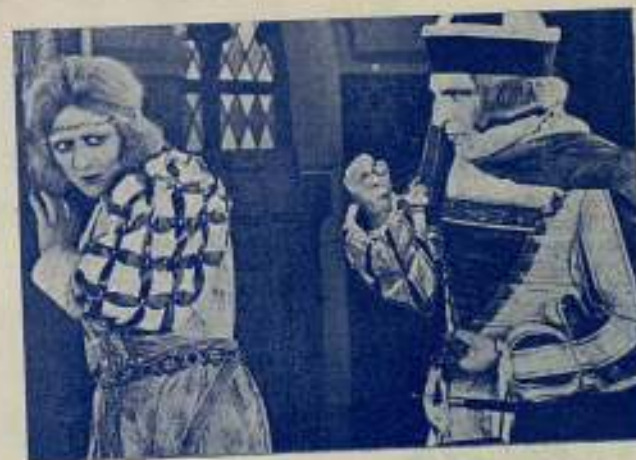
Una escena de la obra