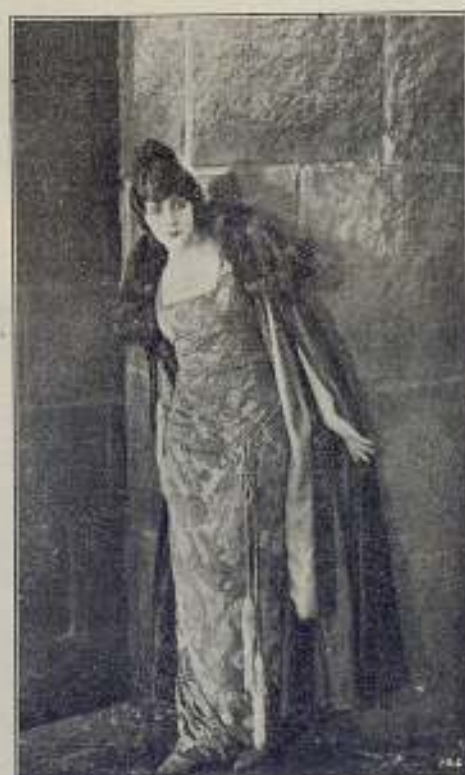
Barbara La Marr en "Antonietta de Mauban"