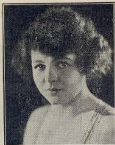
HELENE CHADWICK GOLDWYN PICTURES