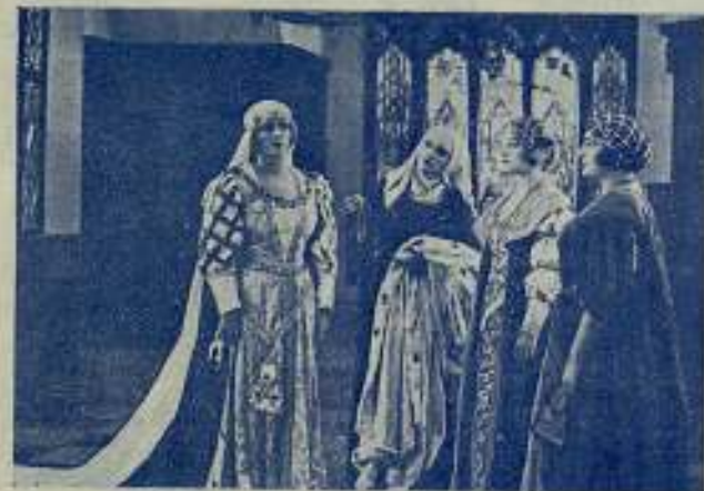
Una escena de la obra

adaptación cinematográfica de la célebre novela de la época del Romanticismo, original del inmortal autor