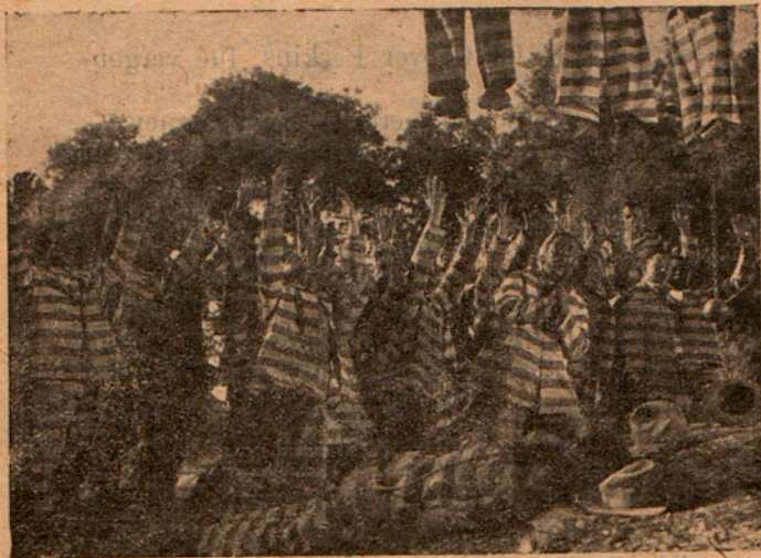
— ¡Izarlos! — gritó Perkins.

penado que caminaba con su pesada cadena al lado de Barney.