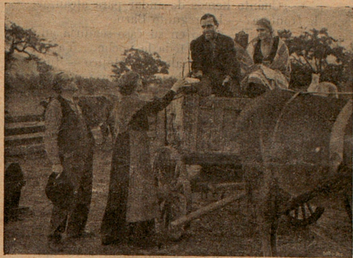
— ¡Buen viaje!

terminar de hablar con Barney...—, pero debe habérselos tragado la tierra.