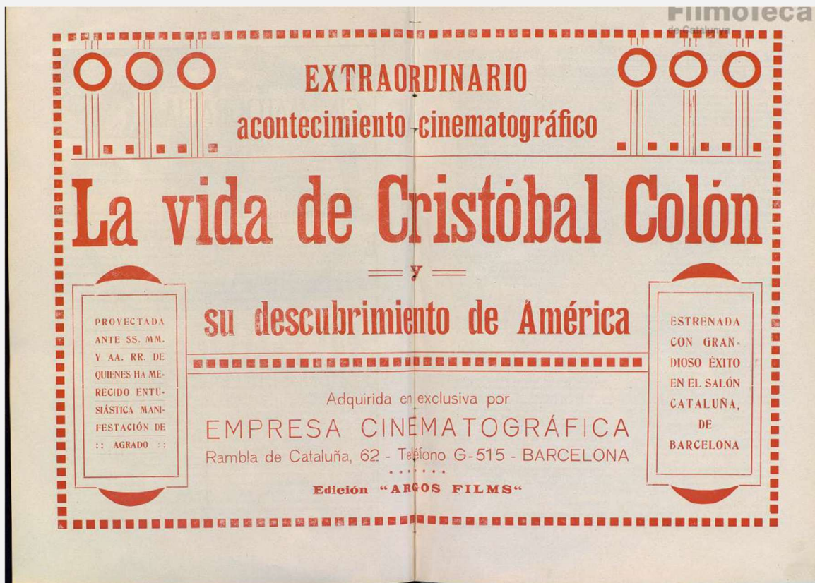
Arte y cinematografía, Barcelona 31-05-1917, pp. 6-7