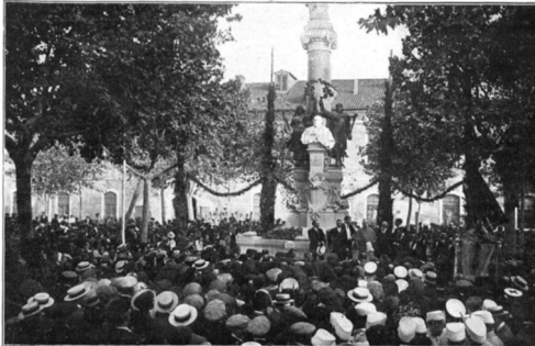
ASPECTE DE LA SANGLA DURANT L'ACTE INAUGURAL

INAUGURACIÓ DEL MONUMENT A MILA Y FONTANALS A VILAFRANCA DEL PANADÉS