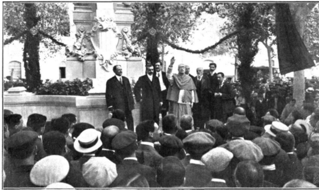
El obispo de Vich pronunciando un discurso en el acto inaugural del monumento erigido al eminente literato catalán Milá y Fontanals, efectuado el día 30 de Agosto en Vilafranca del Panadés

Mundo gráfico , 11 de septiembre de 1912 p.12