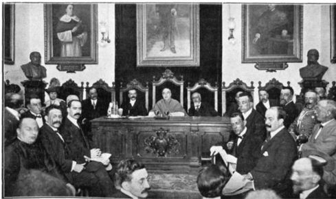
LA PRESIDENCIA DE LA SESSIÓ D'HOMENAJES CELEBRADA A LA CASA COMUNAL DESPRÉS DE LA INAUGURACIÓ DEL MONUMENT (Siguera y Balbó n.º)

Il·lustració Catalana , 8 de septiembre de 1912 nº483