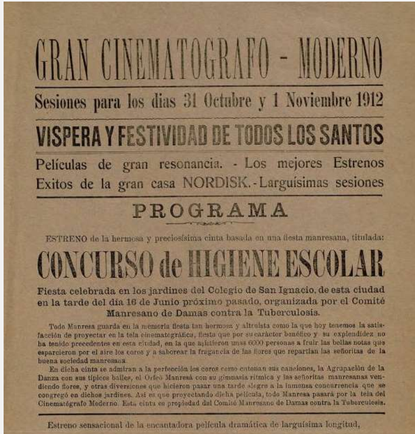
Cartel del Gran Cinematógrafo Moderno de Manresa

https://mdc.csuc.cat/digital/collection/cartelleres/id/685/rec/1