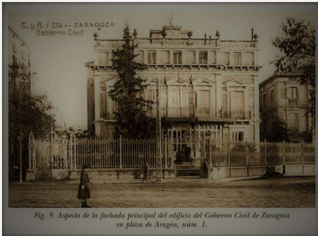
Fig. 9. Aspecto de la fachada principal del edificio del Gobierno Civil de Zaragoza en plaza de Aragón, núm. 1.

https://www.unizar.es/artigrama/pdf/26/3varia/11.pdf p.758