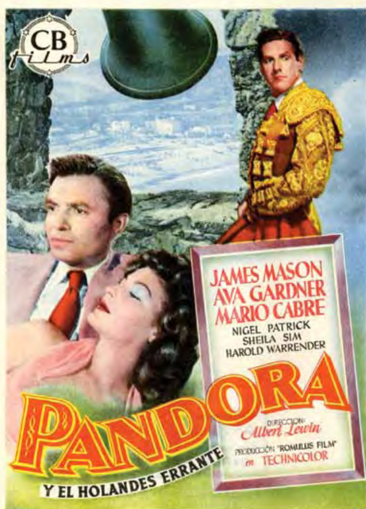
Col·leccioneu els pòsters de la Biblioteca del Cinema.