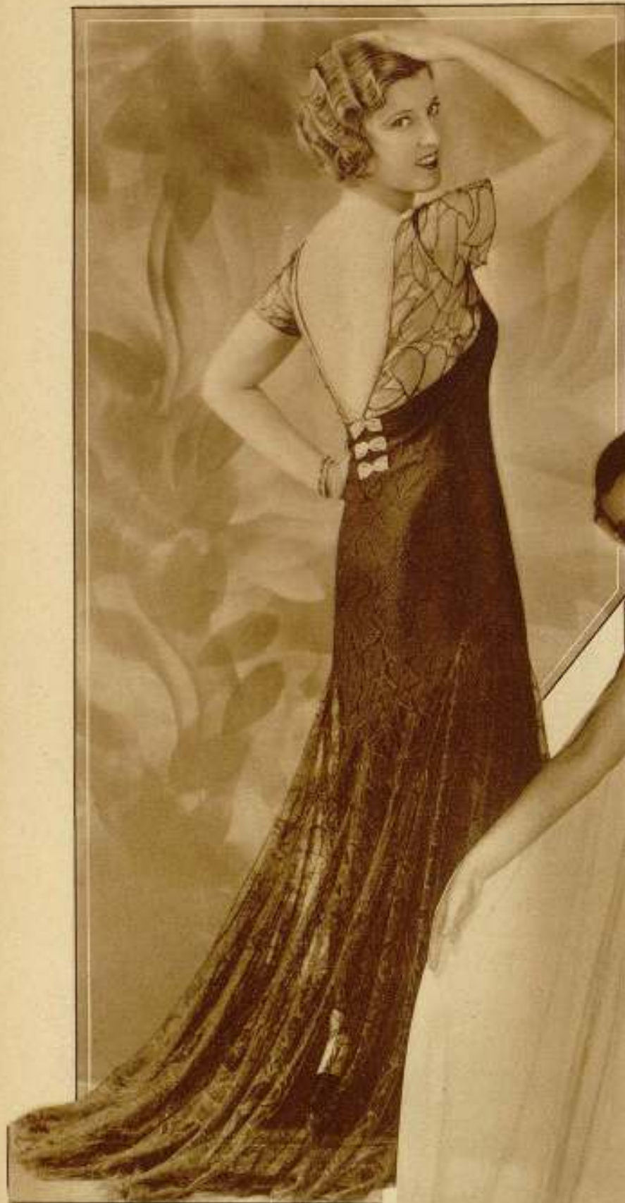
Los vestidos de Jeanette Mac Donald en "¡Mío serás!"

En la página de enfrente damos la sinopsis de este film.