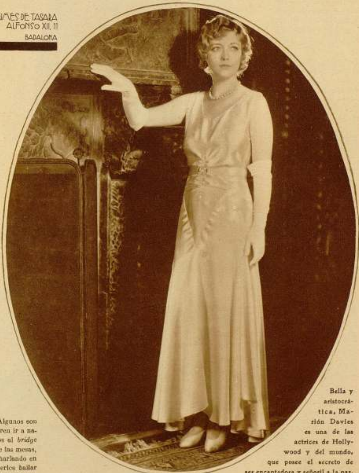
Bella y aristocrática, Marion Davies es una de las actrices de Hollywood y del mundo, que posee el secreto de ser encantadora y señorial a la par.