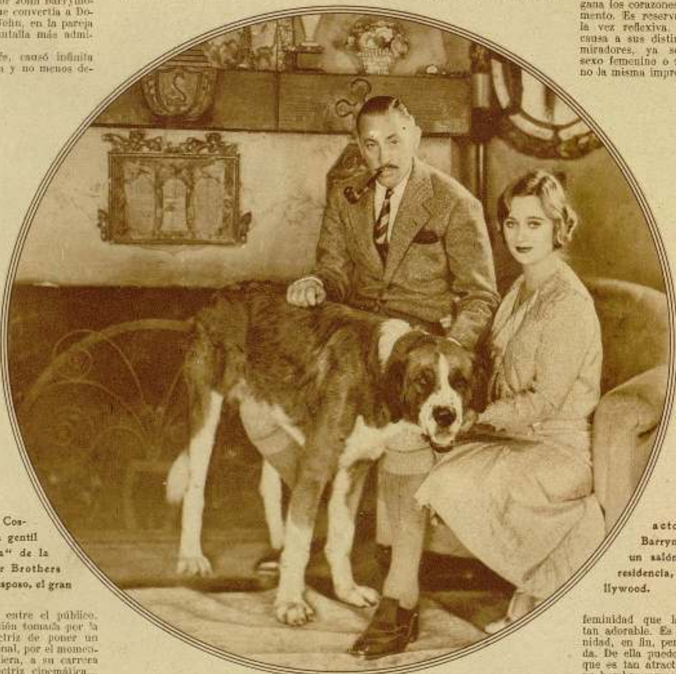
Dolores Costello, la gentil "estrella" de la Warner Brothers con su esposo, el gran

El tipo de belleza de Dolores Costello es frágil, delicado y dulce como una violeta. Su personalidad es tan atrayente que se gana los corazones al momento. Es reservada y a la vez reflexiva. Dolores causa a sus distintos admiradores, ya sean del sexo femenino o masculino la misma impresión de