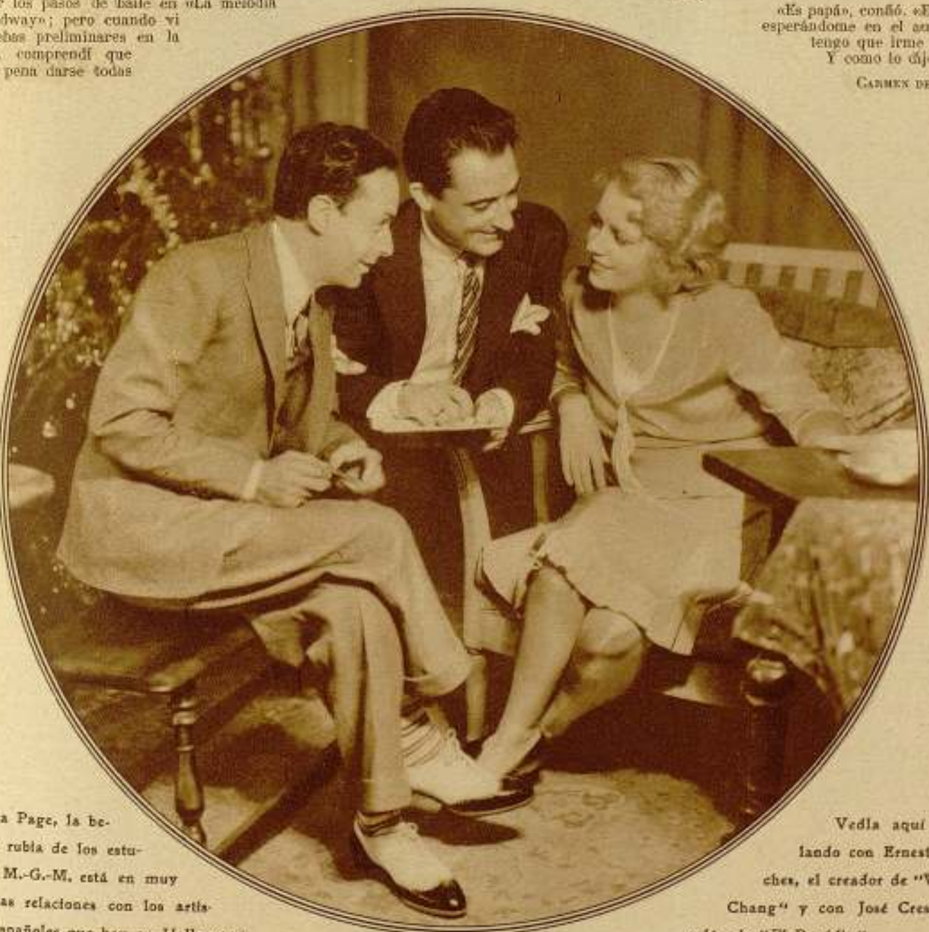
Anita Page, la belleza rubia de los estudios M.-G.-M., está en muy buenas relaciones con los artistas españoles que hay en Hollywood.