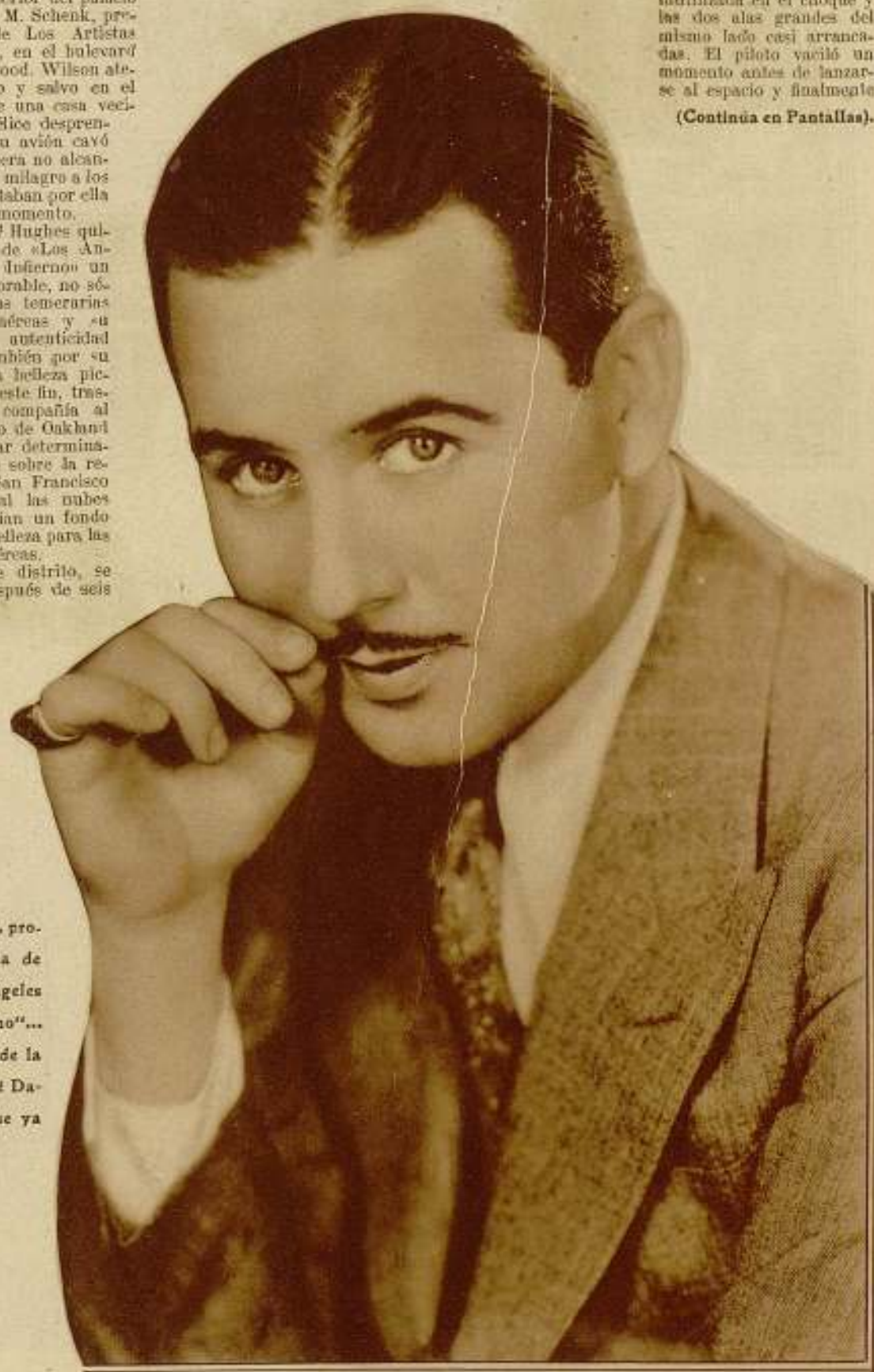
Ben Lyon, protagonista de «Los Angeles del Infierno»... y esposo de la linda Bebé Daniels. ¡Que ya es suerte!