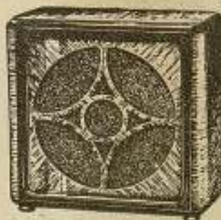
Altavoz 29 R