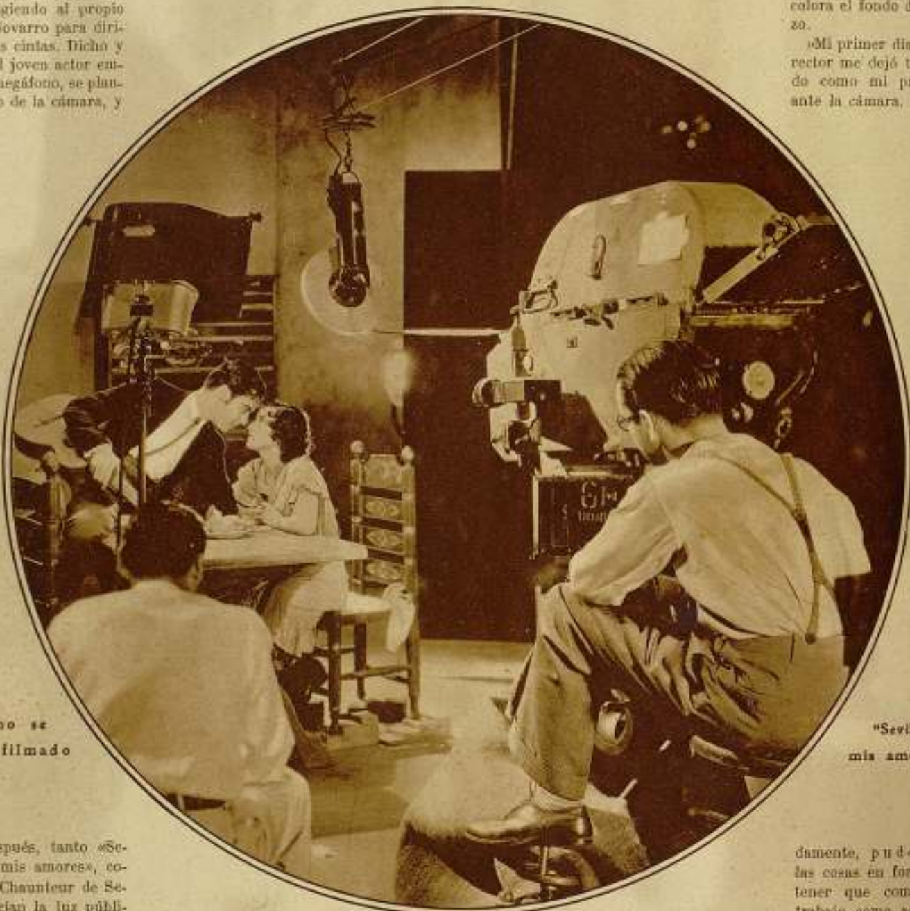
Cómo se ha filmado

«Mi primer día como director me dejó tan fatigado como mi primer día ante la cámara. Afortunadamente,