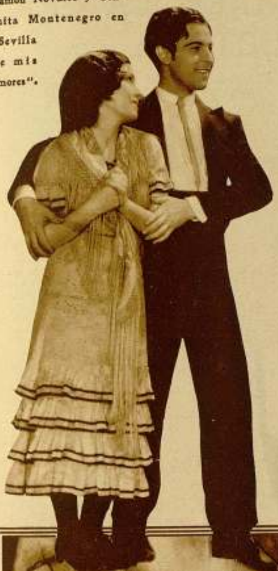
Ramón Navarro y Conchita Montenegro en "Sevilla de mis amores".

cámaras, micrófonos, trajes, ¡todo vuestro! Y vuestra labor consiste en juntar estos factores, delinear las escenas, y luego darles continuidad. Es algo así como jugar con títeres gigantes. En casa tengo un teatro en miniatura en el que acostumbraba poner piecitas teatrales y operetas para mi propio solaz, con un grupo de amigos íntimos y de miembros de mi familia formando el auditorio.