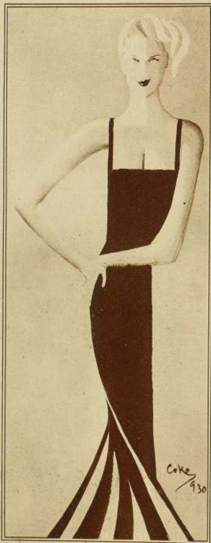
Norma Shearer según el lápiz de Coke

El amor llamaba a la puerta de la oficina del director. Miss Shearer lo sabía. Pero si Thalberg oyó sus llamadas, no dio señales de ello. Su trato para miss Shearer continuó en las mismas bases de negocios que antes. Las discusiones por papeles o argumentos continuaron. Norma veía que otras muchachas se llevaban las partes que ella merecía. Peleó, lloró y rogó por ellas; pero Thalberg no cedía. Más lágrimas. Thalberg seguía inmovible.