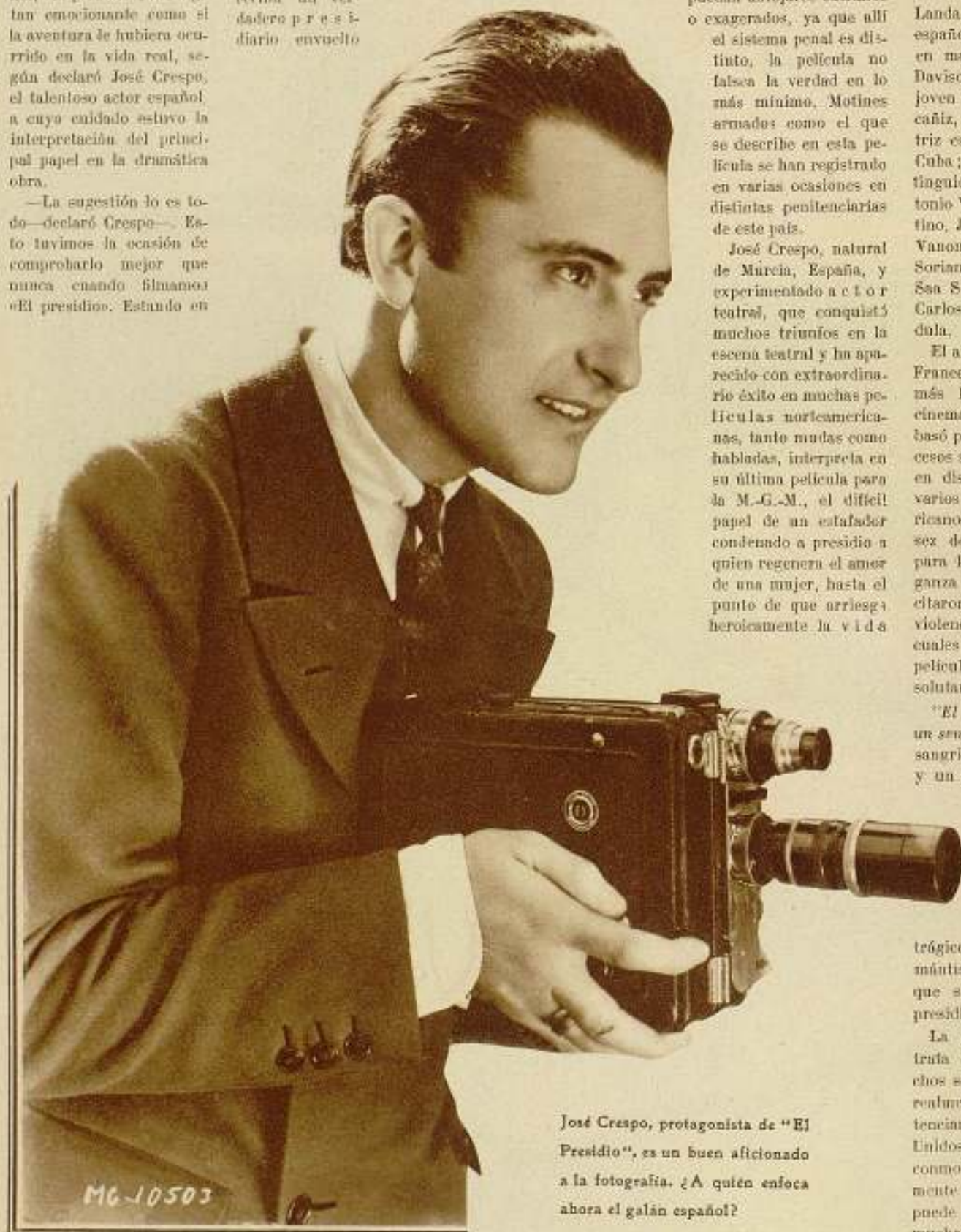
José Crespo, protagonista de «El Presidio», es un buen aficionado a la fotografía. ¿A quién enfoca ahora el galán español?

La película de que se trata está basada en hechos semejantes ocurridos realmente en varias penitenciarías de los Estados Unidos y que a su tiempo conmovieron profundamente al mundo entero, y puede decirse que explica muchas de las causas que