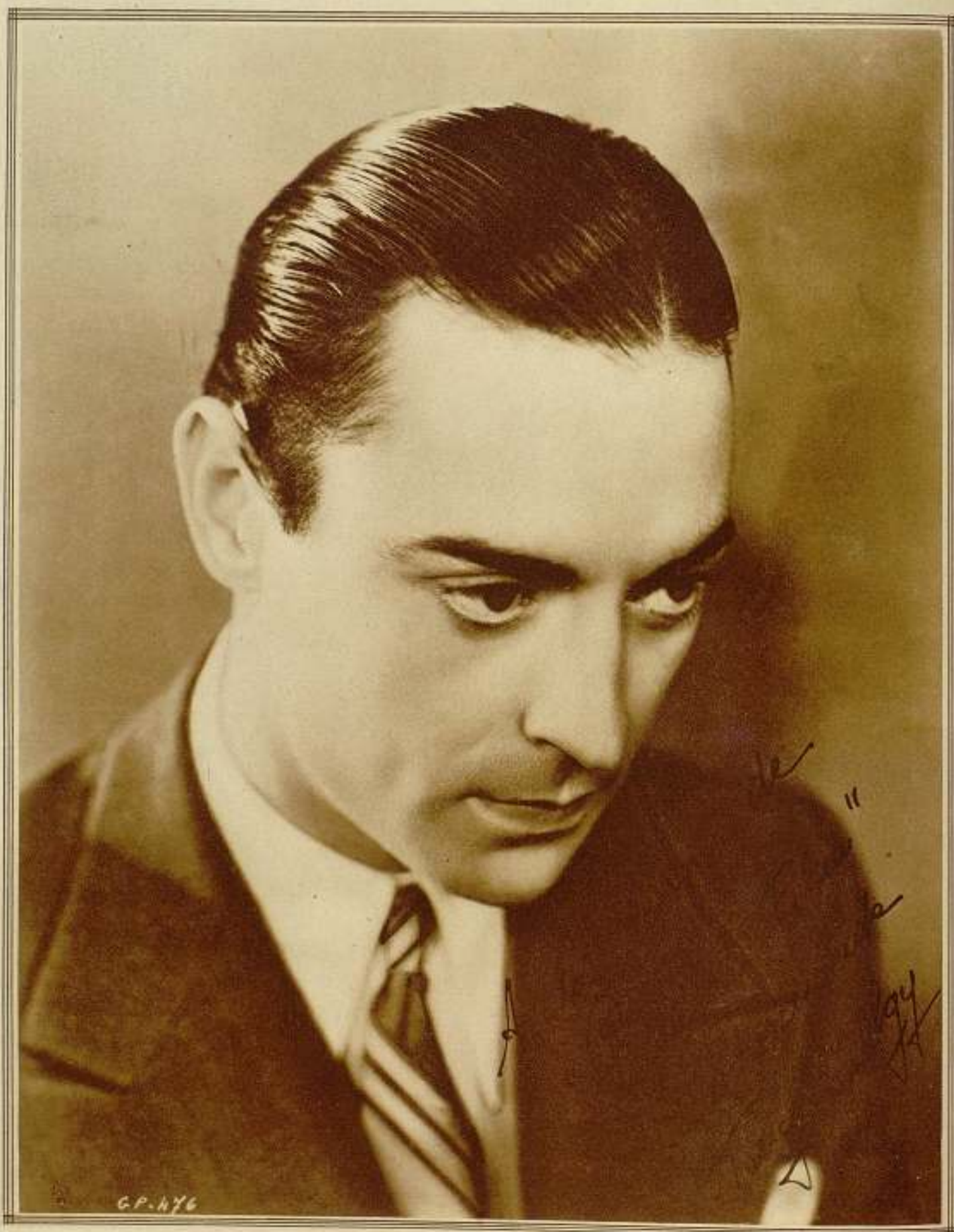
Tony D'Algy, actor de raza hispana, que ha incorporado la Paramount a su estudio de Joinville, en París, para sus producciones habladas en español.