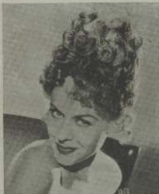
La bella Paulette Goddard en su interpretación de Jeannine.