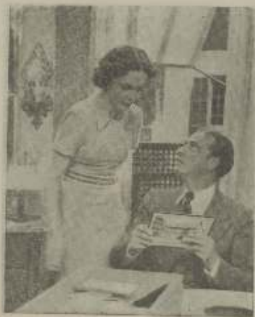
—¿Cómo tiene usted esa foto en su poder?