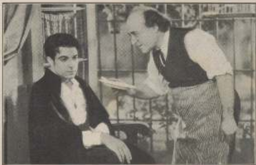
Esforzase en prepararle los apetitosos platos.