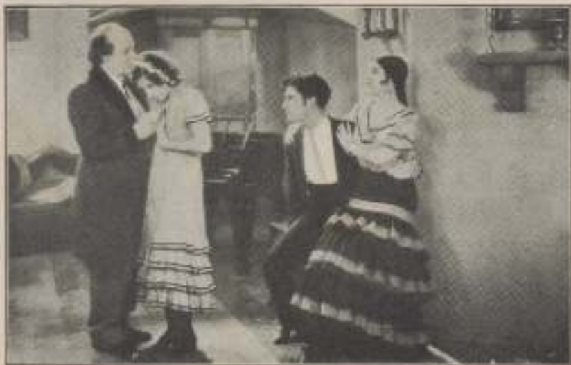
— ¡Tío Esteban! ¡Tía Esteban! ¡Sáqueme pronto de aquí!