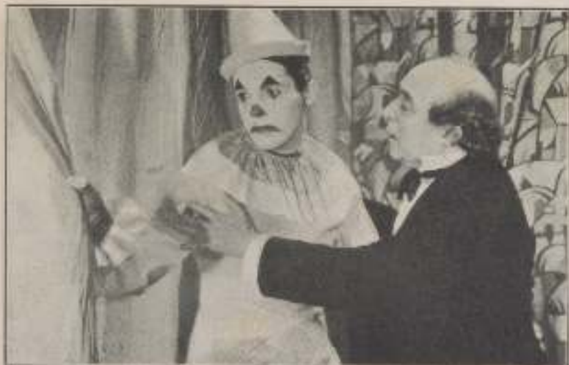
— ¡Canta mejor que nunca!