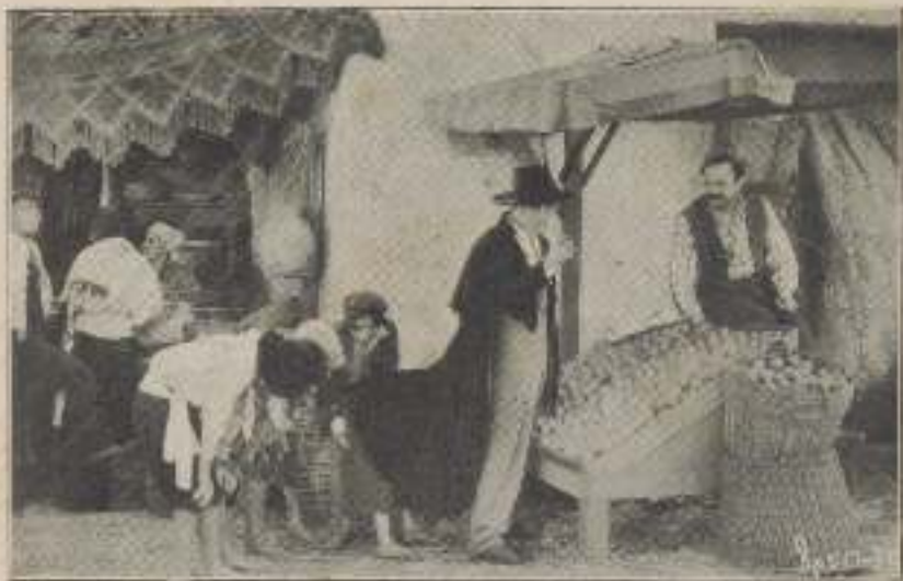
Una de ellas se escondieron debajo de su capa...