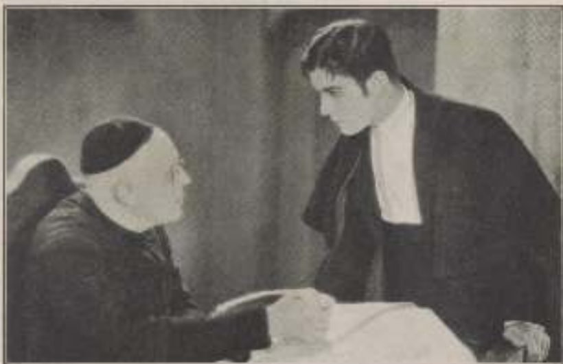
— ¿Cómo te llamas, hijo?