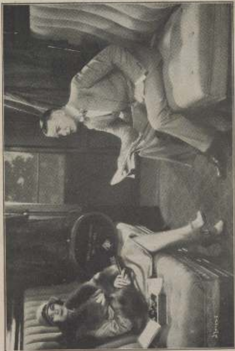
...conspicuous are often in