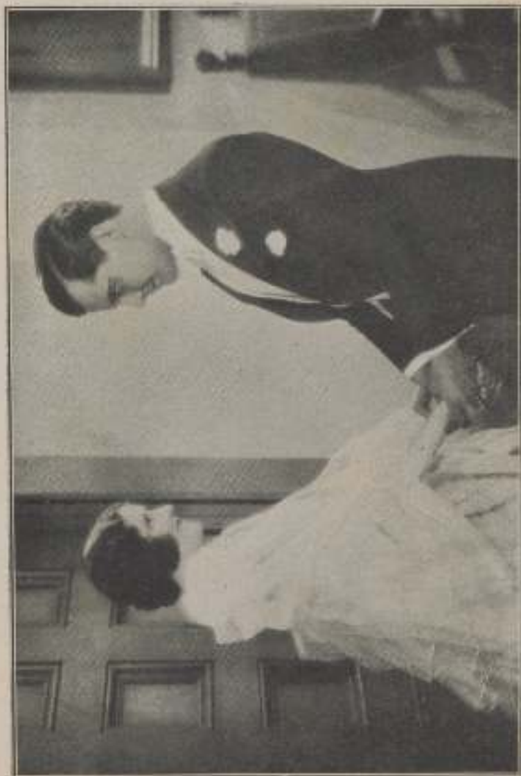
...Einfachheit, die so oft mit der Nacht...