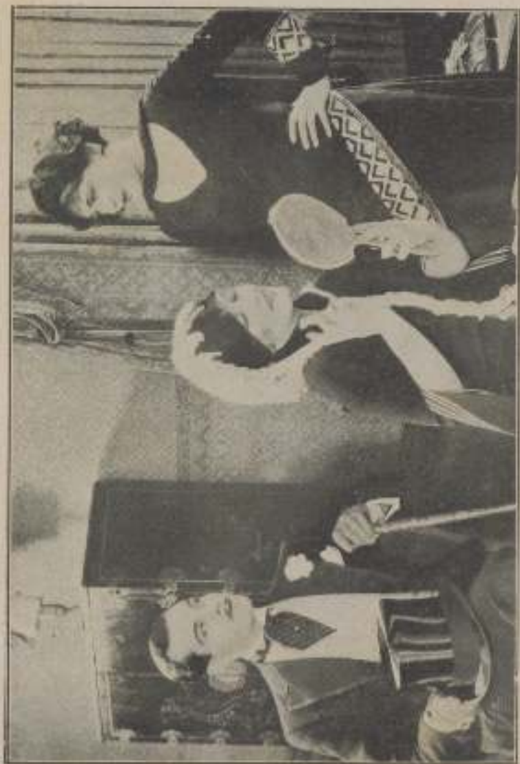
—¿Has visto nunca un cuerpécito tan lindo?