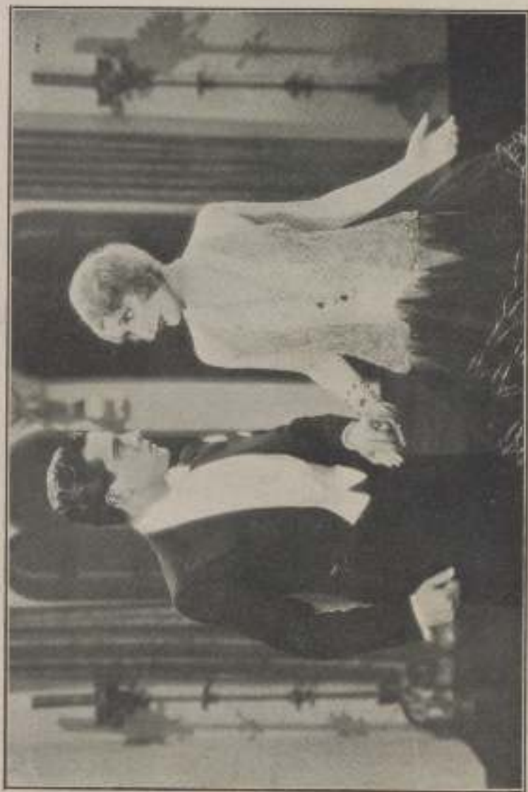
— « Pour que vintisse enfin ! »