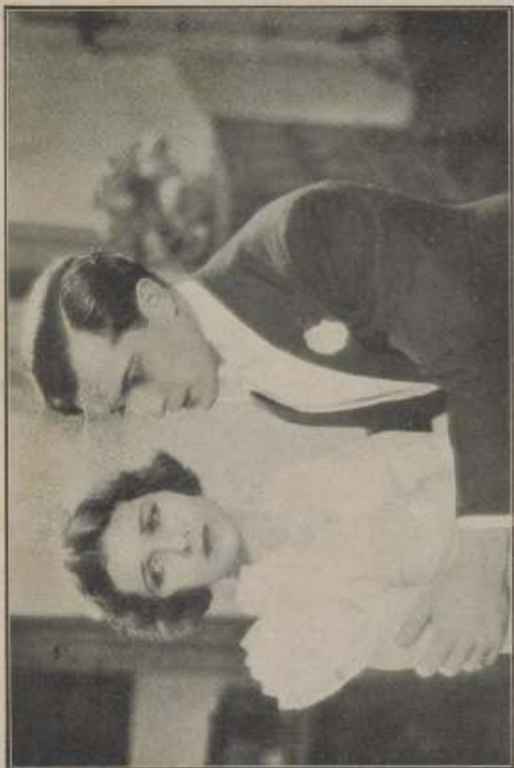
the Neelys used similar in manner to set.