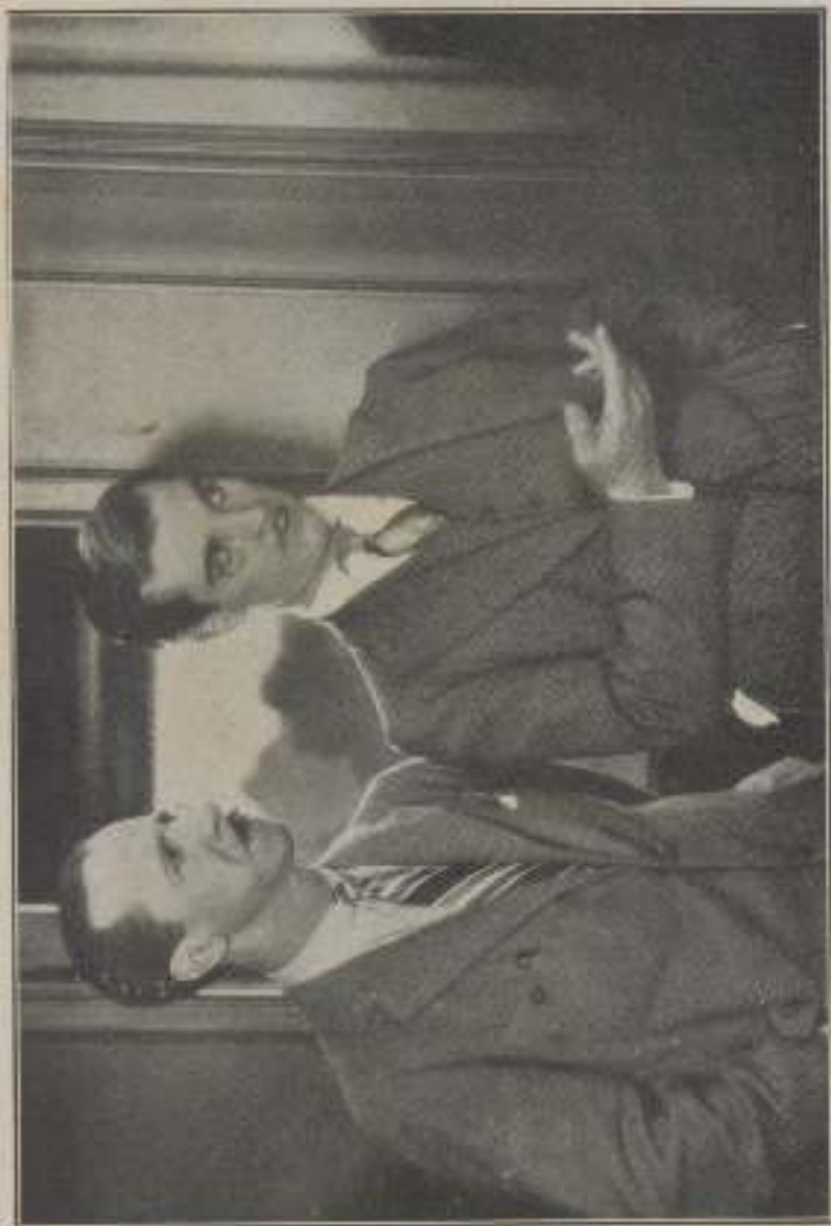
... en luyo otra remedio que presentarle...