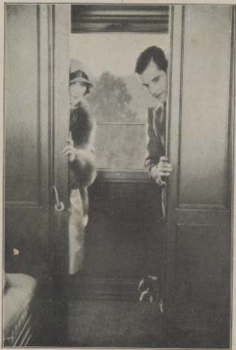
Volvieron al departamento.