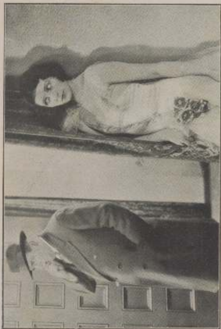
Elis, eccezionale fotografa...