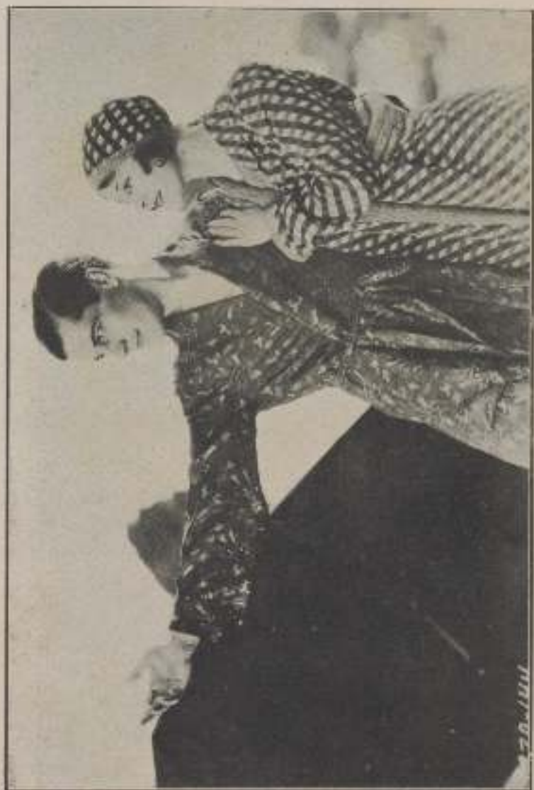
— 4 — «Вечерняя газета»