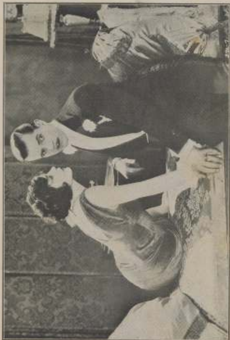
—¿Me querés mucho tiempo?