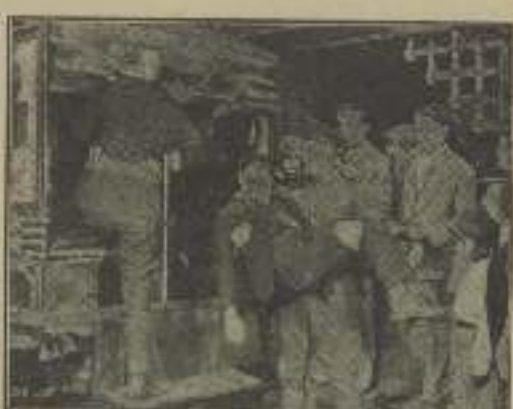
Enoclosané escena que se ve en "El pogramo de fiesta"

—Pero qué... ¿me conoce usted? No sucedió nada de eso. Sin limitarse siquiera, se arrojó la solapa del saco y me respondió sencillamente: