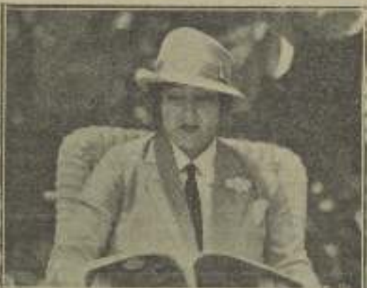
Gloria Swanson en La esclava del pasado, sentirle pensando en el porvenir

Sería mejor que el cinematógrafo nos deleitase con la actualidad, pero tampoco está