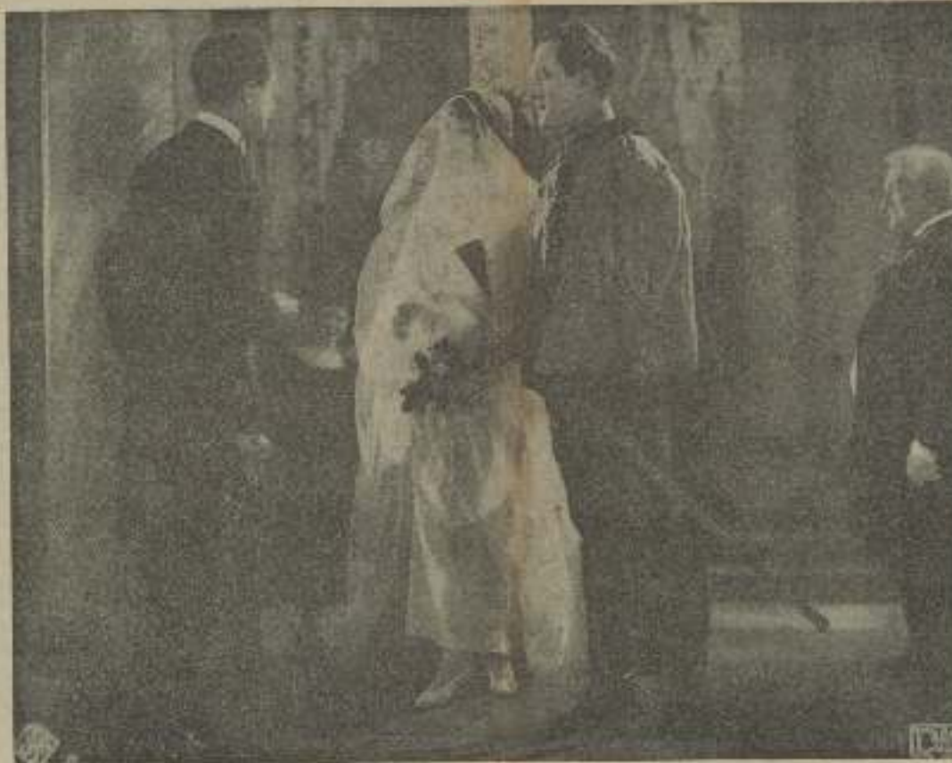
Med ahí donde termina, no fallaba más "Paseo de amor" de la Ufa