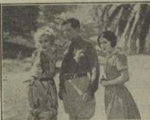
Joan Crawford, la Venus de Hollywood, en "Comrades in Arms"

Artísticamente hablando no deja tampoco que desear. Su cuerpo de Afrodita es el