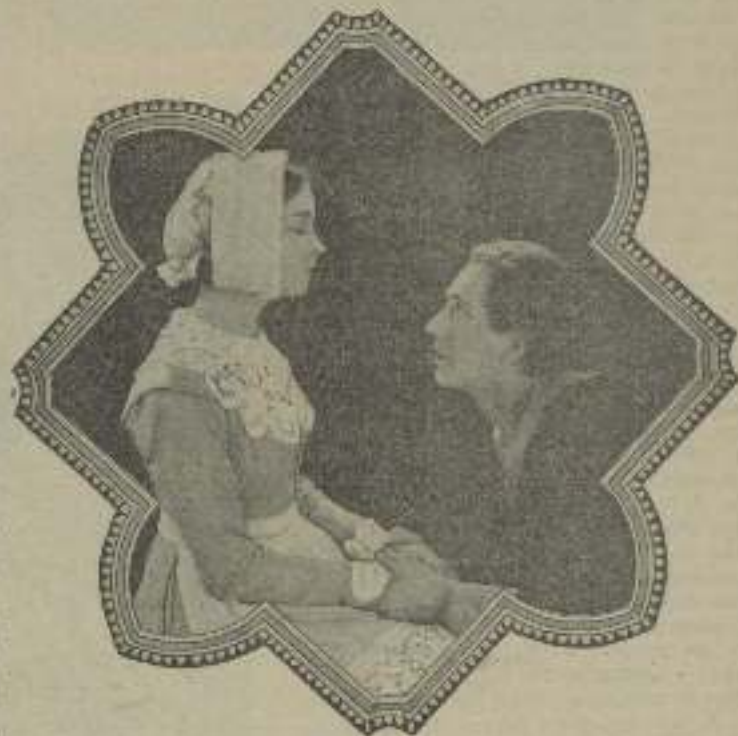
¿Cuánto amor sabe Lillian Gish y Lars Hanson en "La mujer marcada"?

Descansa el codo izquierdo sobre la mesa o el borde de una silla, manteniendo la mano abierta, con los dedos ligeramente separados y en posición vertical. En seguida, con los dedos de la mano derecha, tirad de la piel hacia abajo, en movimiento rotativo, y semejante al que hacéis al probaros unos guantes nuevos. Repetid colectivo en igual posición el codo y mano derechos.