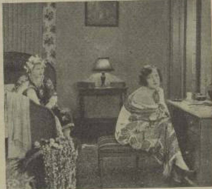
Joan Crawford, la Venus de Hollywood, en dos escenas de "Ballarinas con taxímetro" y a pesar de todo, ¿de qué?!