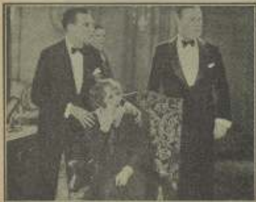
Una intriguosa escena de "Tendidos de vidrio"