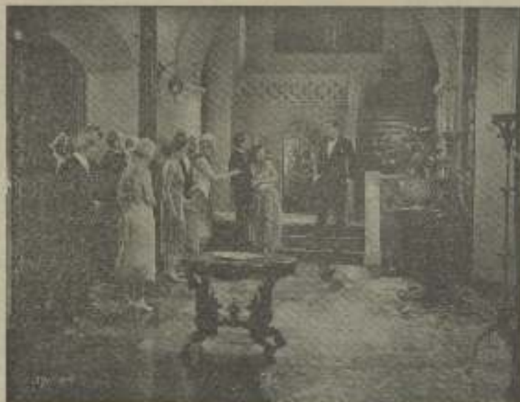
Joan Crawford, la Venus de Hollywood, en "Bailarinas con taxímetro"

—No lo crea. —¿Quié no? Si yo le dijese al oído... —¿Qué? —El nombre de vuestra galán que... —¿Qué? Continúe... —Por usted creo que está... —¿Cómo está? —Mochales. —¿Mochales! ¿Qué es eso? —¿Eso? Nada, un adjetivo castizo con el cual los españoles recalamos a todo aquel que se halla loquero de zanahori. —¿Y quién es quien por mí así se halla? —¿A qué se lo conoce? —Seguramente. —Vamos, no se haga usted la desercio- nada. Jaki Pickford es un gran muchacho. Joan sé perfectamente al saberme curera