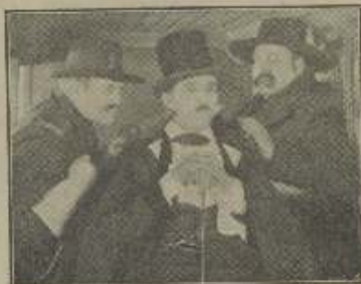
Raymond Griffith entre dos jueces en "Munas arriba"

Al volver a la ciudad es cuando notan tal peculiaridad, que en el fondo no es tal, sino la cosa más natural del mundo. Y especialmente la observan al tener que vestir los decorados trajes de soirée. Y continúan las lamentaciones, porque, en efecto, el contraste entre la parte de la piel que el traje de baño dejaba al descubierto y la parte que oculta, que el mayor decote del modelo de re-