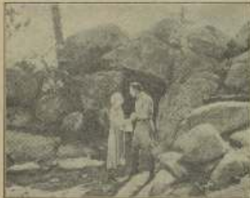
La voluntad y la naturaleza brindan al amor "Alarma del barco"

—Nada de eso. Y si así fuera, un smile tan fino como usted bastaría a confundirlos. Me acordé de los ingleses que antes por mí en los estudios, y a quienes achacaba los más negros absurdos en nombre de la cortesía.