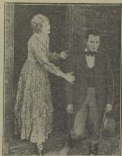
Luchando entre el amor y el ira en "La caravana del oro"

sabemos si a lo mejor resultan publicistas famosos, artistas apañados, o simplemente comunes millonarios que han ido a visitar los estudios del cine. Sin embargo, los rasgos de aquella cara me eran como