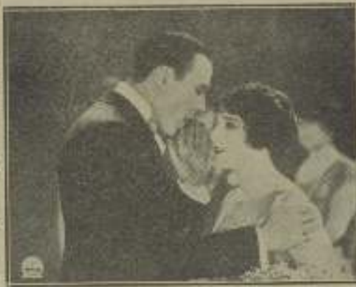
"Buenos la detección" recibe una con-fidencia a veces