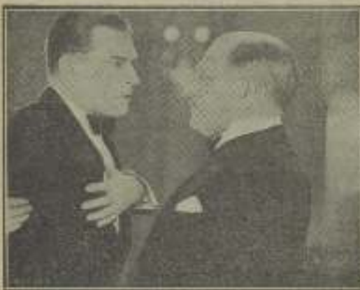
—¿Qué le duele? —¡Aquí... el corazón...! (Tejadas de vidrio)

culé la batalla más formidable contra la gordura que ha encontrado jamás una actriz para reducir su cuerpo. Mildred se entregó al patillaje de verduras como parte de su programa de reducir, junto con una rigurosa dieta de jugo de naranja, para el desayuno, sandwichs de pollo, sin mantequilla, y una taza de té para pura el almuerzo, y para la comida algunas verduras, sin probar la carne, ni las papas ni la mantequilla, ni nada dulce.