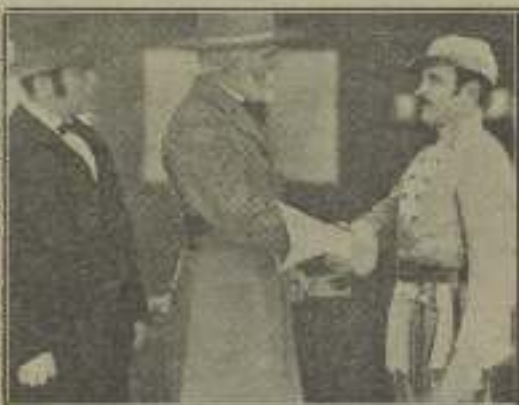
Un intrigante encuentro en "Mauve arrête"

lícula histórica, pensamos que en ellas, el arte, está por debajo de la parte dramática.