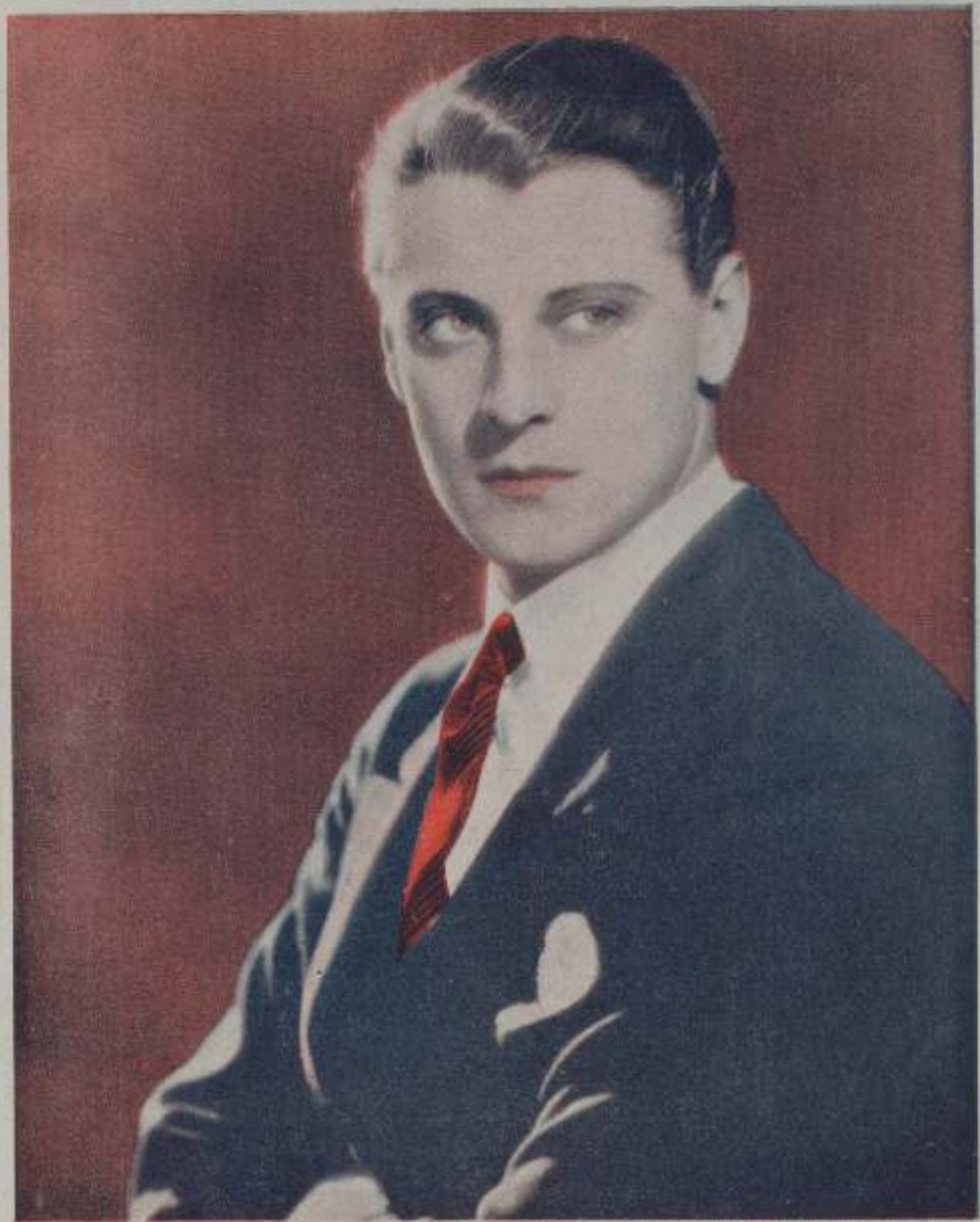
Ralph Forbes, excelente actor que actúa en las producciones Metro-Goldwyn Mayer