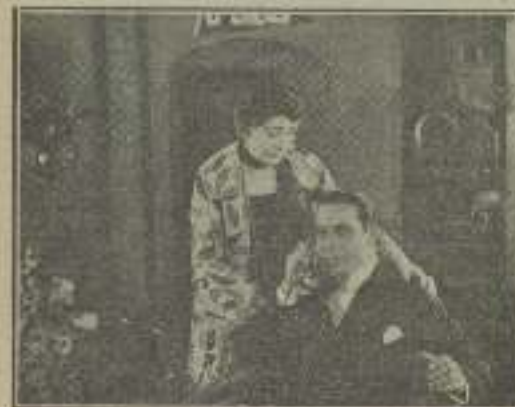
Un hombre feliz que accede a todo En nombre del Amor