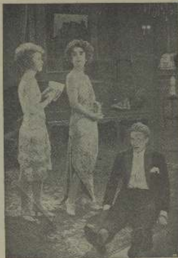
Ella de la "Casta Sarrana" como podría ser de "Una vida sin consecuencias"

Ante todo conviene saber que un régimen alimenticio adecuado y la falta de ejercicio son los directamente responsables de esta circulación torpe, lenta, que hace que la sangre casi se estacione en determinadas partes del cuerpo. Y las manos son particularmente sus-