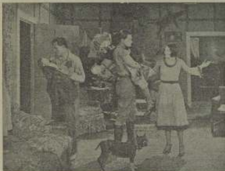
Joan Crawford, la Venus de Hollywood, en "Corazones comprensivos"

Pocas horas después, cuando podía en- frangir las notas apuntadas no pudo por menos de confesarme que la lindísima Lu- cille Lesueur tenía razón. Es natural que se de libertad a la mujer, pero a la vecla- dera mujer, a esa hija de Pamina cuyo prototipo tan bien vive en ella, porque