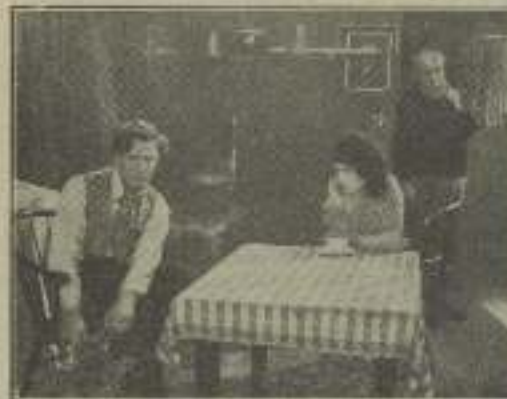
Elle toda la espera de "El capitán salvación"