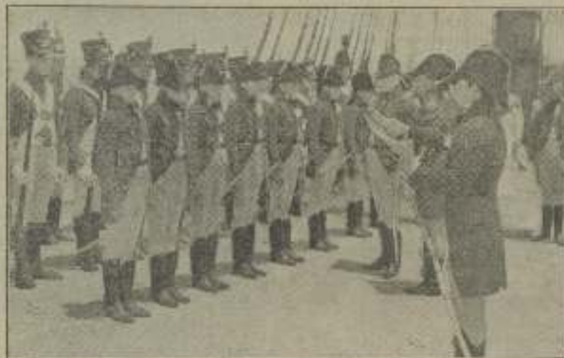
Ricorra formación en Trípoli, agitando sus jardones y mandos.

Para mantener el cuerpo dentro de los límites requeridos les es preciso constante ejercicio y rigurosa dieta.