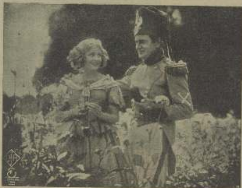
¿De qué marca de chocolate debe hablarse a Tomu Doent "Al momento de chocolate" que así la hace sonreír? ¡Ché lo sé!

Este año el calor parece que nos quiere hacer una broma haciéndonos sudar la verdadera gota gota. Parece mentira que en California, un estado verdoso del Estado del Tio Sam donde apenas aprista el calor, este año nos tengamos que cambiar la camisa tres veces al día si queremos ir un poco decentitos.