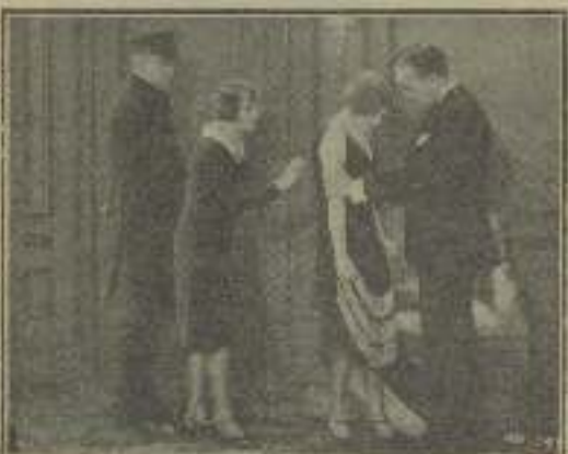
Aquí ocurren escenas delicadas como "Los Tejados de vidrio"

lícula histórica, pensamos que en ellas, el arte, está por debajo de la parte dramática.