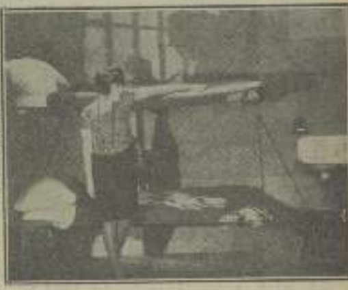
81: "La mano de Dios" aparece en nuestra vida, tarde o temprano.