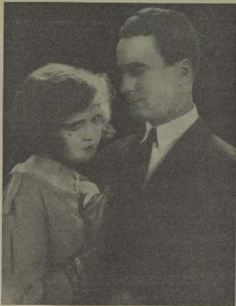
Dixie debe ser suéter el amor en "La isla de los sueños" a juzgar por el título de esta interesante pareja