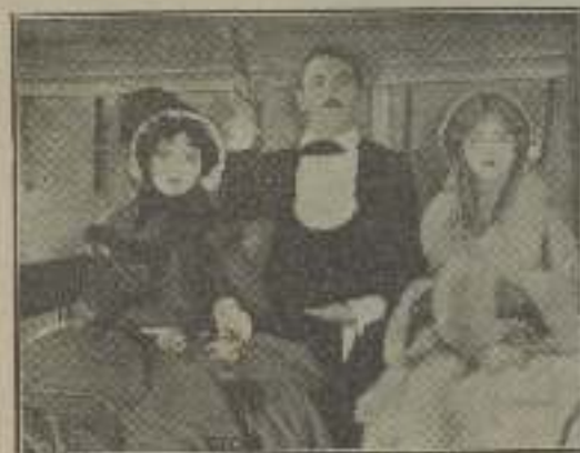
"Manos arriba" es lo mejor al todo de una noche bonita

Como tónico para las pestañas, no conozco nada mejor que el agua balsámica. La mejor manera de aplicarla, es mojando un poquito de algodón en esta inofensiva y refrescante agua, y colocarlo sobre los ojos, al acostarse. El balsámico es excelente estímulo para la piel que circunda los ojos.