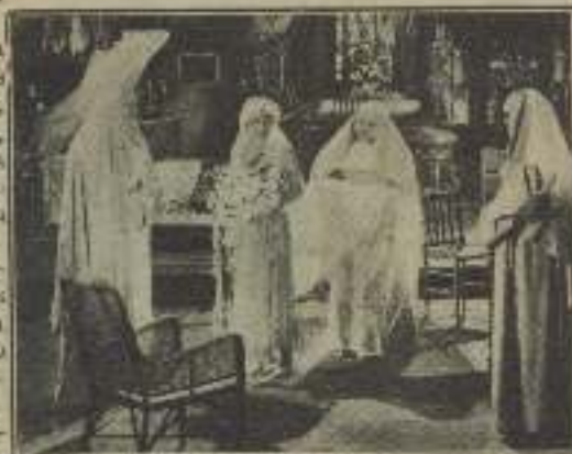
El peso de los pesados una se acuerda de él... que no en balde «La sangre mandado».

la pregunta que se hacen los que todavía no saben quien se encargará de escribir la «Comedia de la mujer y el Pelicón». Pero, las artistas españolas de la pantalla, son poco numerosas y resulta un tanto aleatorio confiar un papel de esa importancia a una principiante. ¿Quién entonces? Hasta ahora, las llamadas algunas siendo muchas y pocas las elegidas. Es decir, ninguna.