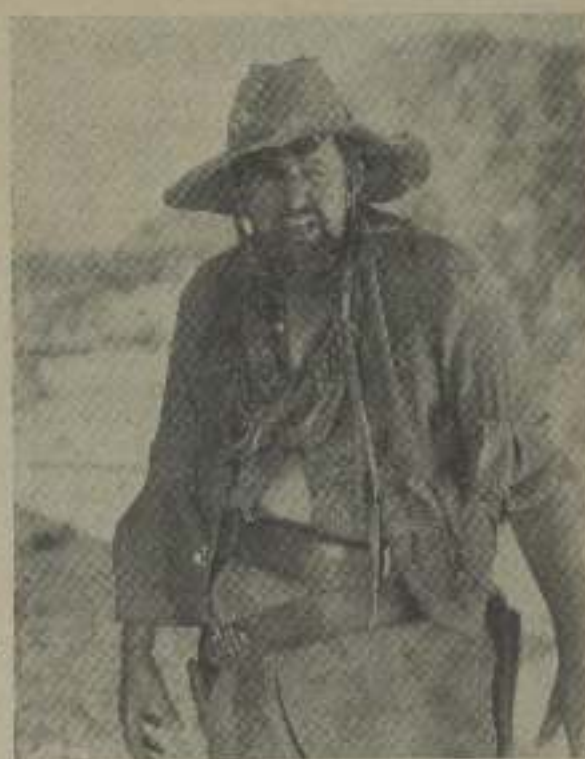
Un tipo que intriga es este de «El jinete misterioso»

En los estudios de la Fox se declaró un violento incendio que amenazó con destruirlos completamente, pero gracias a la