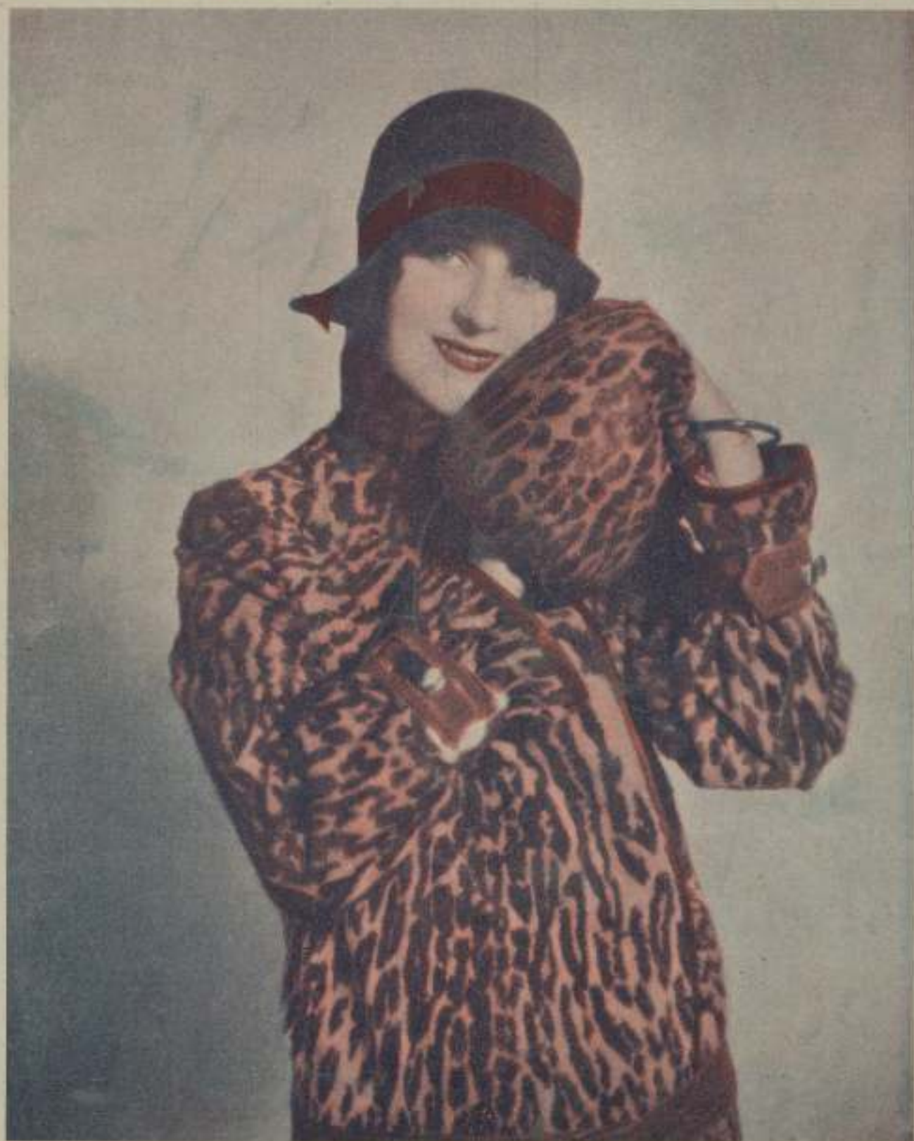
NORMA SHEARER, la estrella gran de M. G. M. que ma dice su mezcla de favorita en el resto de la pantalla.