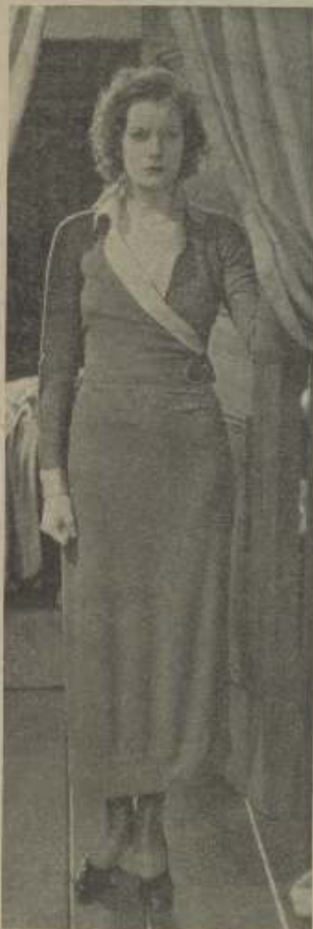
Greta Garbo en «Amor», la mirada incierta, el puño cerrado parece decir: ¡Infeliz!

Pero... la voz de Greta Garbo se hizo ligeramente apenada—pero... yo era una niña muy mala y con ello trastorné completa mente la escuela. Usted sabe, a mí me gustaba salir de noche lo que usted no tiene