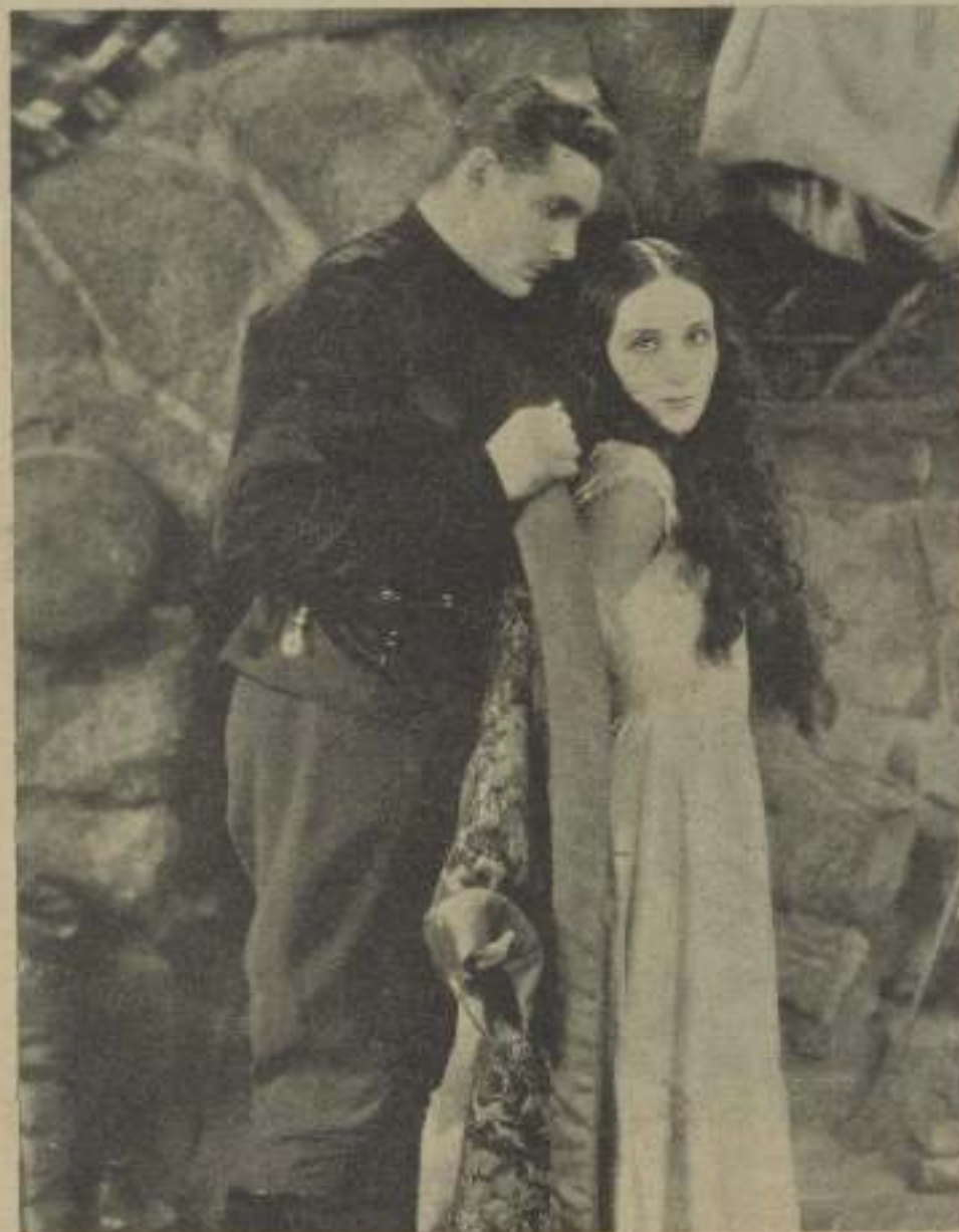
Buena ocasión la que Dolores del Río (y de la Fox) brinda al simpático guía de "La bailarina de Moscú" en esta escena. ¡No aprovechará!

Dolores del Río es quizás una de las ar-