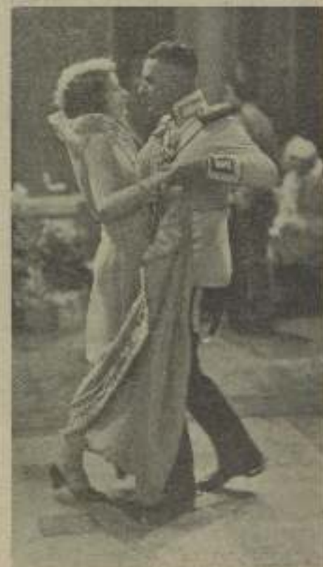
Greta Garbo y John Gilbert en "Amor a primera vista" que interpretaron muy al natural.

— Mi hermano quiere venir a América... ¿con el cual? No sé, es tan tímido... también, también era yo tímida.