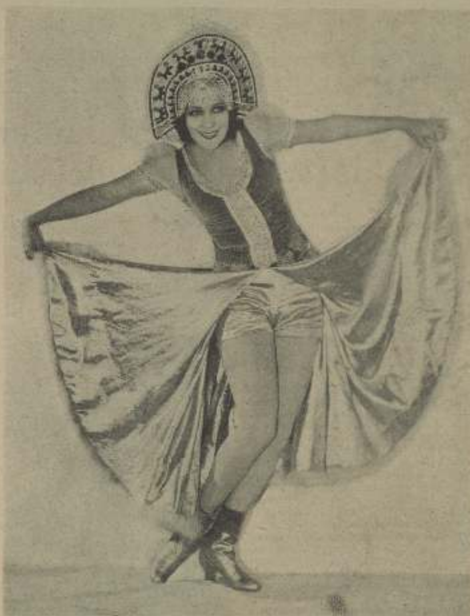
Flor vistosa, acubal y hermosa mariposa, ave de maravillosos plumaje, estrella del cielo iranído, ilusión de las «Ml» y una noche, copia de amor, es nos figura Dolores del Río (y de la Fox), transformada en tentación en «La danza de Moscú».

Claro que todo eran ilusiones mías. Si un solo instante detuvieron la atención en mi humilde persona fué debido, sin duda alguna, a mi insignificancia. Y no es que yo sea feucha lectora amiga, a nadie mejor que a ti puedo decirselo sin sonrojos; pero, al lado de la belleza imponderable de Billy Do o e o de los ojos picarrescos de Madge Bellamy ¿qué puede representar mi personilla?