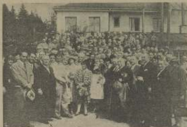
Los empresarios de Austria durante la última visita efectuada a los estudios de la KEMKA, de Munich.

Barcelona 14 de Junio de 1928 AÑO XVI NÚMERO 441