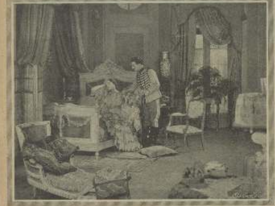
Una bella escenas en «El sombrero de paja de Italia»