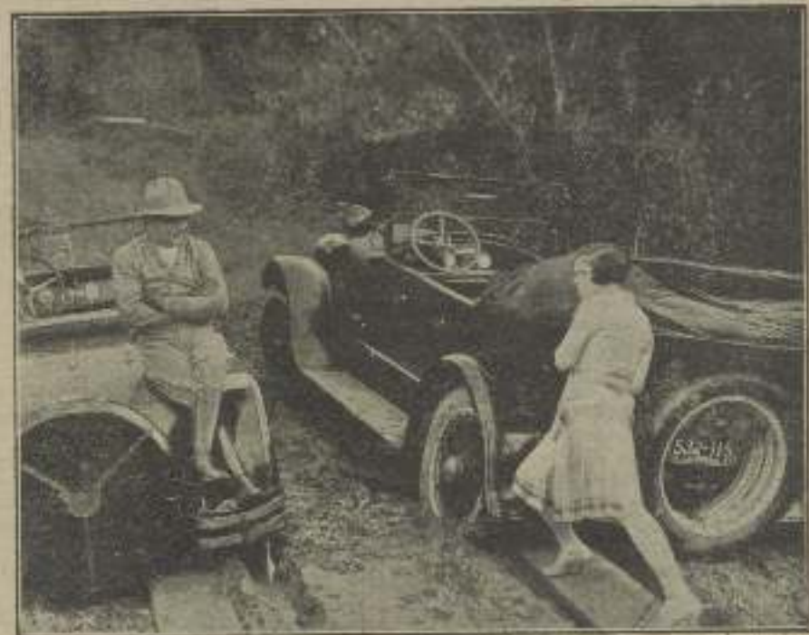
«La pequeña aventurera» es la onicena más grande de la vida el amor.

Ya veremos el ojo clínico que le tendrá Irving.