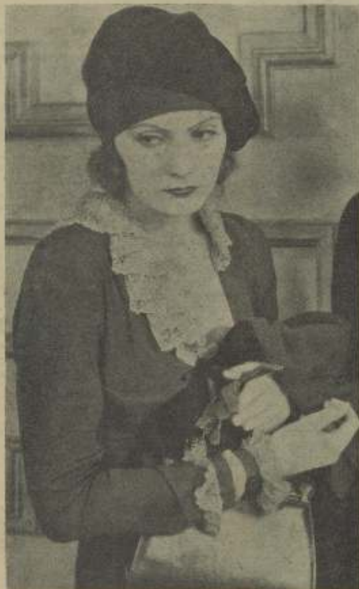
Greta Garbo, la simpática y exquisita artista, de quien, por su alma delicada y sensible, su nombre es sinónimo de «fior de sentimental», como se advierte en esta escena de «Amor».

Durante nuestra permanencia allí alguien habló al señor Stiller de nuestra venida a América. Él decía que habíamos pero un confesar nada en concreto y regresamos a