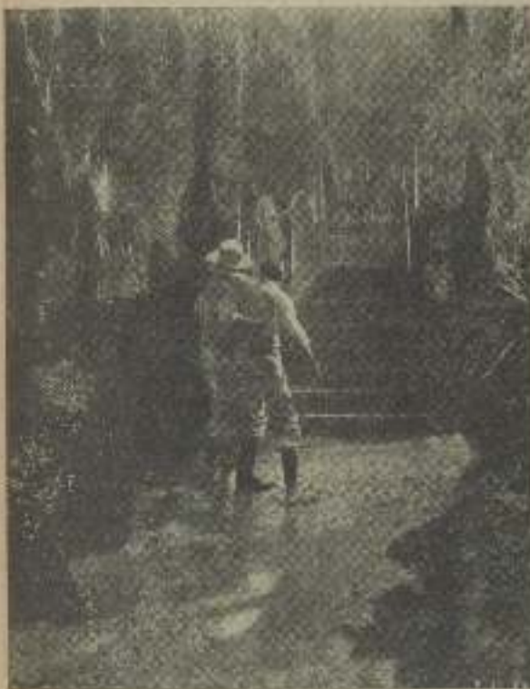
De más peso en la vida... debe decidir en esta escena el protagonista «Si me volvierá a mirar»