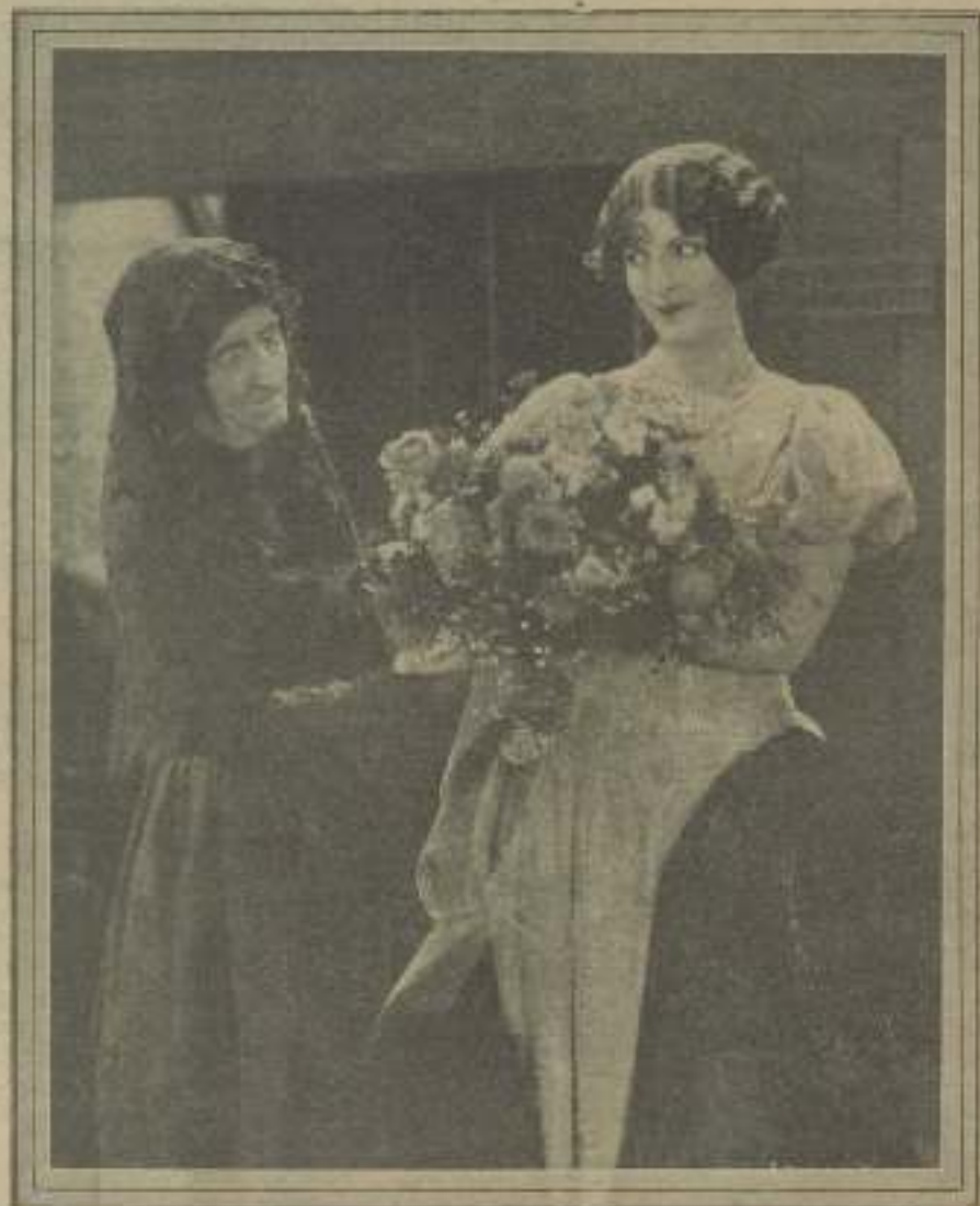
«Son como yo», hermanas, riernas, seductoras, dice con los ojos, radiante de contento, la bella y expresiva protagonista de «Las joyas del diablo».

Después de esta banquete pantagruélico y pontificado por los aires de la mente subterránea, nos llevamos a visitar la grande de París, Su Basílica del Sagrado Corazón en primer término. La nueva forma de la ciudad elegante es que puede decirse así. Yo amaba ya el santo lugar, había en otros momentos dejado a las plantas del Nazareno mis oraciones y mis lágrimas a la infalible figura del Hombre de Guileo que vino hacia nosotros tendiendo el brazo protector, amigo, sin colores, sin artificios, sacro mármol, impoluto de una genial simplicidad únicamente. No hay para mí manera de