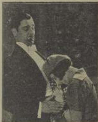
Una sentimental escena de «Eli» que enternece

Glória Swanson declaró hace unos días mientras cenaba animadamente con varias amigas, que al andar con muletas la amantaba. Lo único que la ponía nerviosa era el