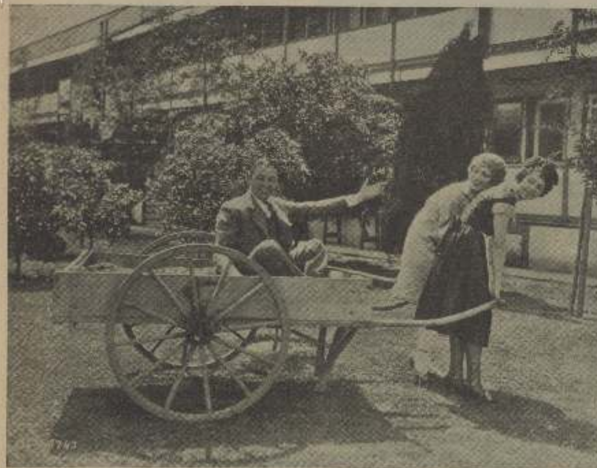
George K. Arthur en los descansos de la filmación demuestra que su buen humor no es una cosa artificial, sino que desborda siempre con una elegancia de hombre joven y feliz