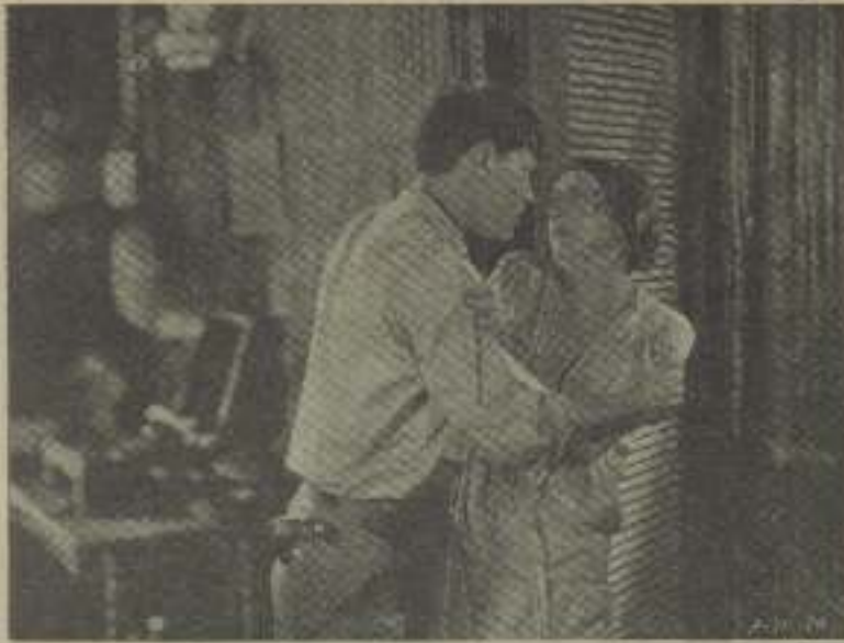
«Si me volvieras a hacer no te escogería a ti»