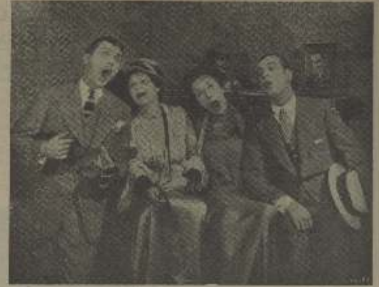
... ay... ay... ay... que cosas más divertidas tiene el «Juego de damas»!

la es empleada de las oficinas de la First National y hoy considerada como la más hermosa rival de Clara Bow. Porque Alice Ho-