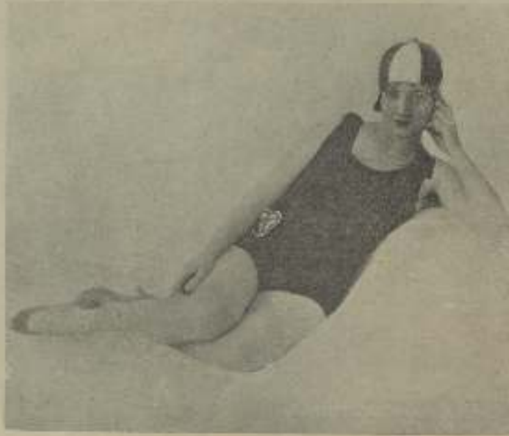
Dulce es la dulce luz nienta de la bellísima artista Mercedes Jacos

La aviación es actualmente la diversión de más novedad entre la gente de cine. Pola Negri está haciendo construir en Los Angeles una gran casa de apartamentos que entre otras conveniencias modernas tendrá un campo de ocho acres para aterrizaje, además de hangares para meter los aeroplanos.