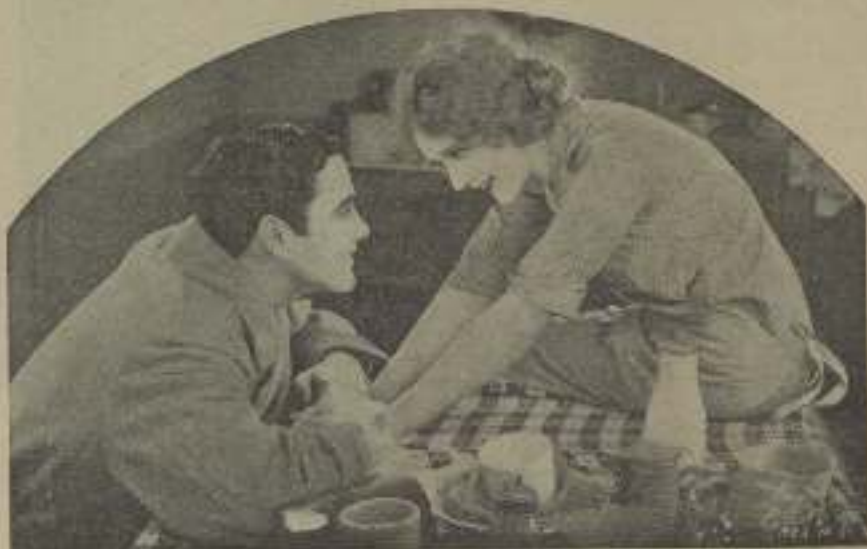
MARY PICKFORD se aprestaba hablando de amor en "La pequeña vendadora"