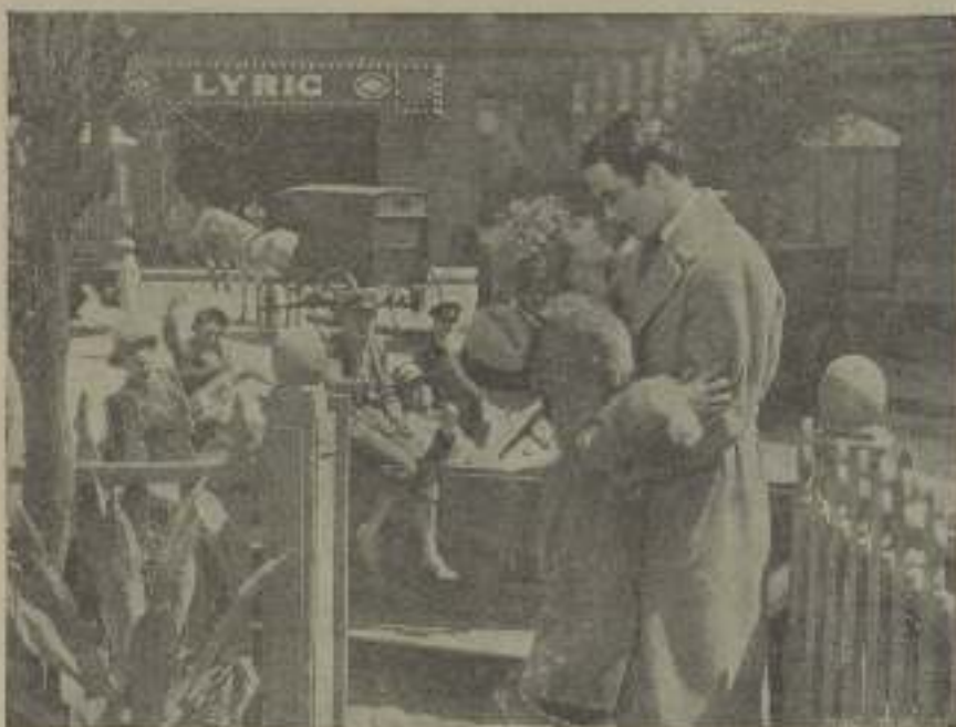
La vía por Mary Pickford en La pequeña vendadora, una maravilla con su arte.

Así como siempre, tenemos la satisfacción de que Douglas y Mary nos distinguen. Nin