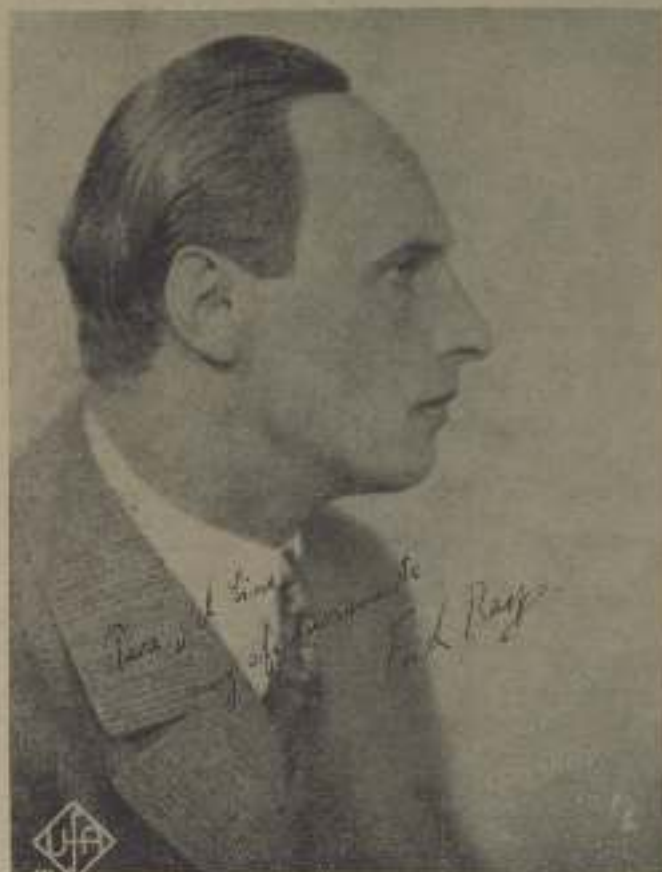
El eminente artista Fritz Lang, astro de la UFA

Al andar de las diversiones del cine no se puede pasar por alto las orquestas de las películas famosas. Estas ocurren generalmente en el Teatro Chino en el boulevard