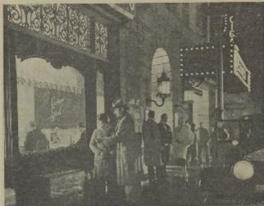
Una espléndida escena de "La pequeña vendadora" de hermosa perspectiva

Yo había mirado mientras Douglas hablaba a mi objeto amable Ducrés que no dejaba ni un momento de mirar a Douglas con cara de optimismo. Entonces Douglas volvió a continuar el interrumpido discurso, esto a causa de las taxis de St. Joasim — un