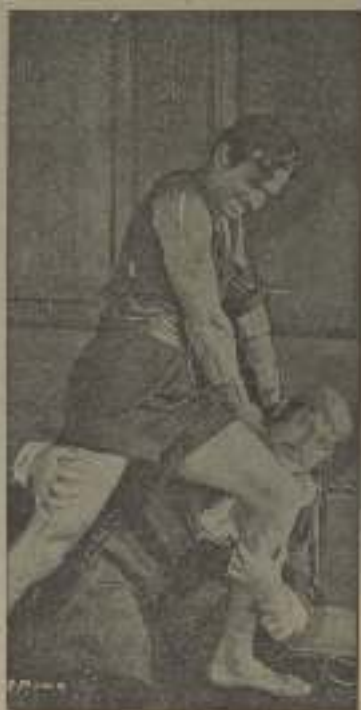
Douglas Fairbanks en El Pinta Negro hace gala de sus fuertes hercúleos.

No le extraño que alborotara porque entré tarde. Yo vengo cada día y todos son amigos míos.