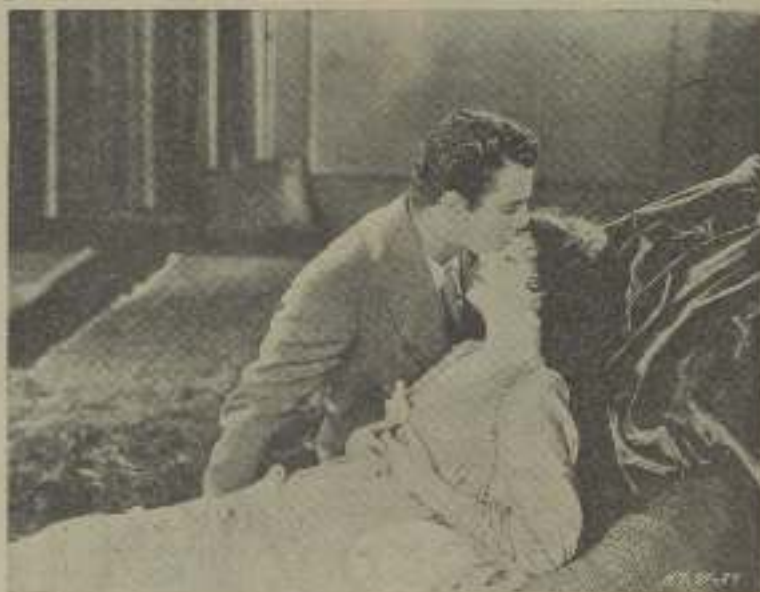
Amar y ser amada... ¿Qué bien interpretan esta felicidad suprema Luis Alonso (Gilbert Roland) y Norma Talmadge en Margarita Gautier

Poco podemos decir hoy a nuestras lectoras nuevas de tan apasionado y discutido zaldá de la pantalla, nuevo astro destacadísimo de Hollywood. Sólo buena vista en primera película, y nos ha maravillado su