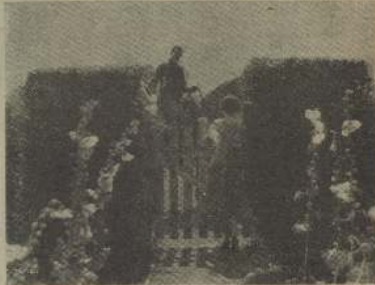
Un adós del «Hornie» misterioso