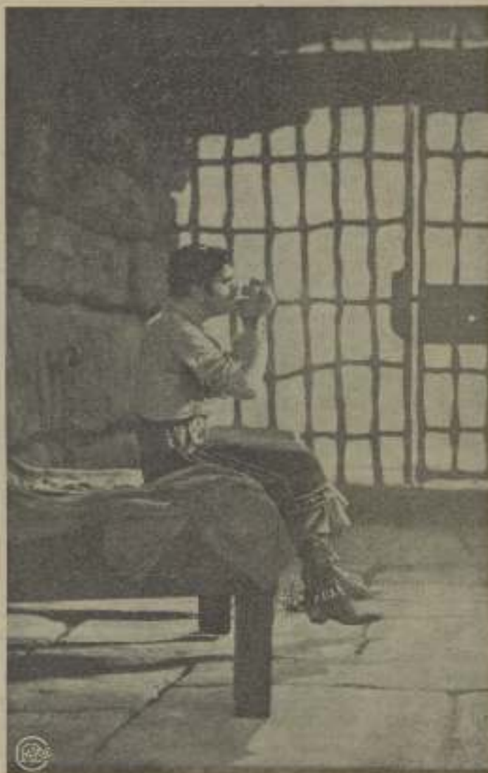
Los duques con tabaco sus manos, debe decirse Douglas Fairbanks en este encara de El Gaucho

Tenía ya abandonada cuando el tren llegó pero Mary y Douglas no aparecerán por parte alguna. El jefe de tren nos dijo que habían bajado en la última estación y que suponía que debían haber llegado en el hermoso Renault que poseía la manufactura francesa a su disposición.