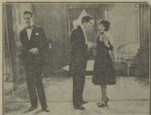
Clara Bow, en dos interesantes escenas de "It" en cuya película perfecciona el fino y exquisito arte que la ha hecho popular mundialmente.

Por fin hizo falta un tipo para el cual yo venía, según dijeron, como mandada a ho-