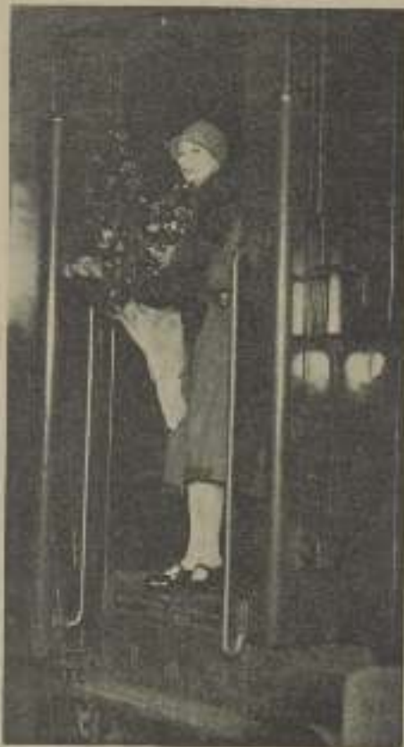
Anna Pavlova a su llegada a París, en la estación de Lyon