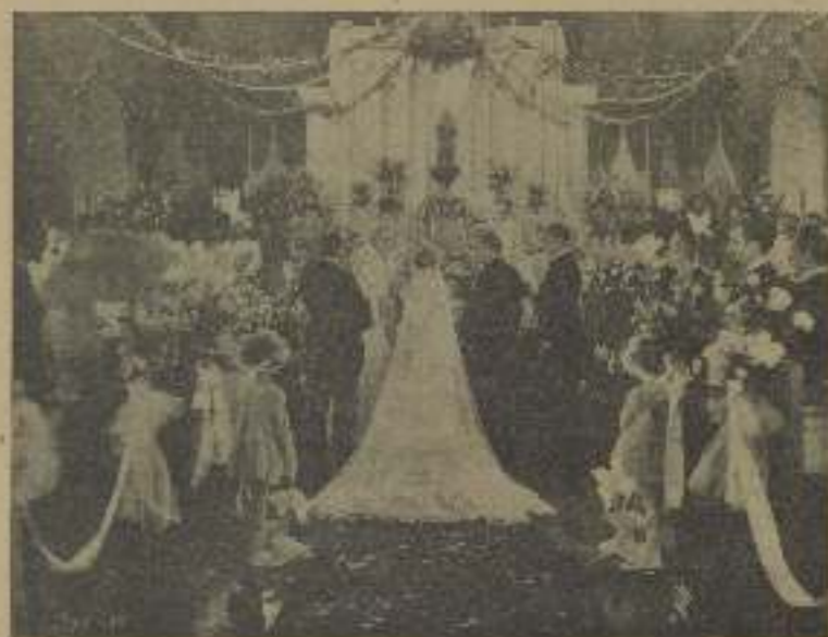
Este es el mejor de los «lances del quintero»