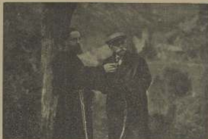
Otro bello momento de la película El tren