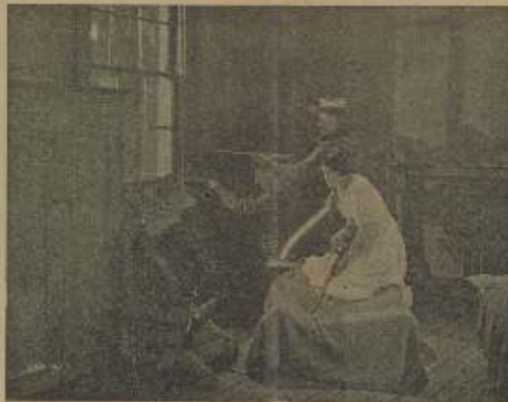
Si la «Noblez del Piel Roja» no se manifiesta, van a morir todos.