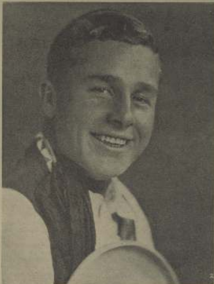
Ber King, el nuevo rey de los taqueros norteamericanos

—Henri Roussel, comenzará próximamente la realización de un gran film. No se conoce aun ningún detalle, ni sobre el escenario ni sobre los intérpretes.