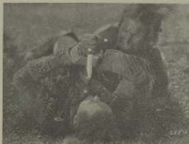
El nuevo piel roja por la cinta se vendieron su traje