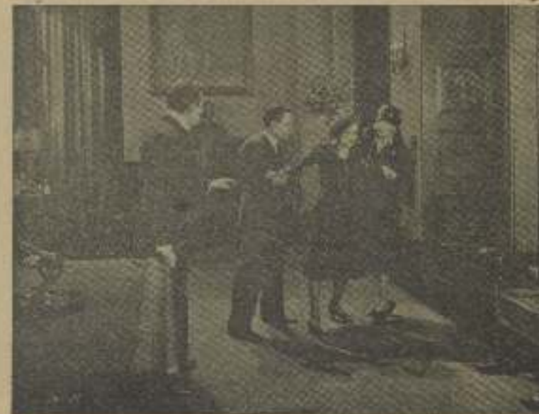
¡Podrás abalanzarte con taxímetros por ciudades como han de pasar!