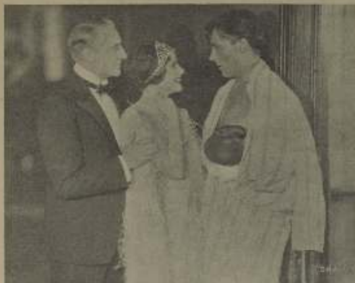
George O'Brien está encantado cuando mira en «Elitario» el gran film de la Fox después de la victoria, chicas guapas le felicitan.