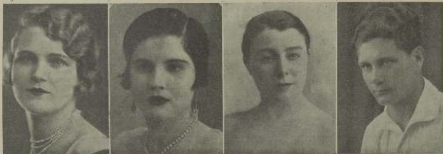
Ocho concursantes al concurso de la Emelka de Barcelona, Almería, Granada y Gerona.