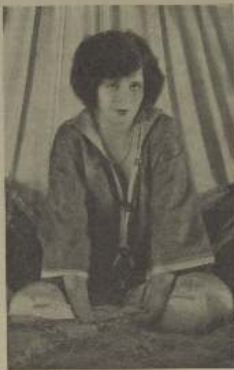
Clara Bow, como podéis ver, es hermosísima hasta al salir de la cama.

Recíbil, pues, no perder mi sangre fría y contesté a la insolencia de aquellas escaristas con el más profundo desdén. Hubo un momento en que no pude contenerme más y ya a encaramarme con una de las nuevas