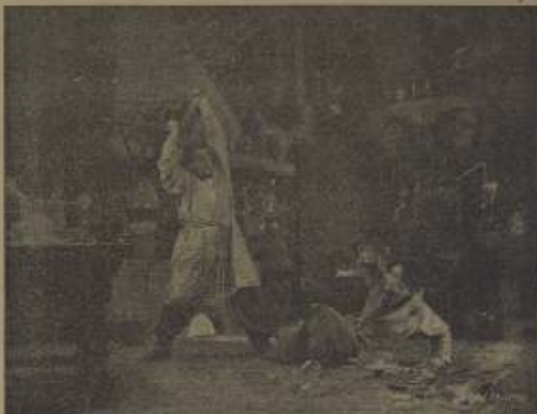
Más que «Mágico dominio» pasara una noche en estradas

Se filmaba en el Cairo, sobre los fondos más interesantes y más característicos. La Ciudadela, La Mezquita de Mohamed Ali, Los tumbos de los Califas, El baño judío, Las Pirámides, La Esfinge, La presa del Nilo.