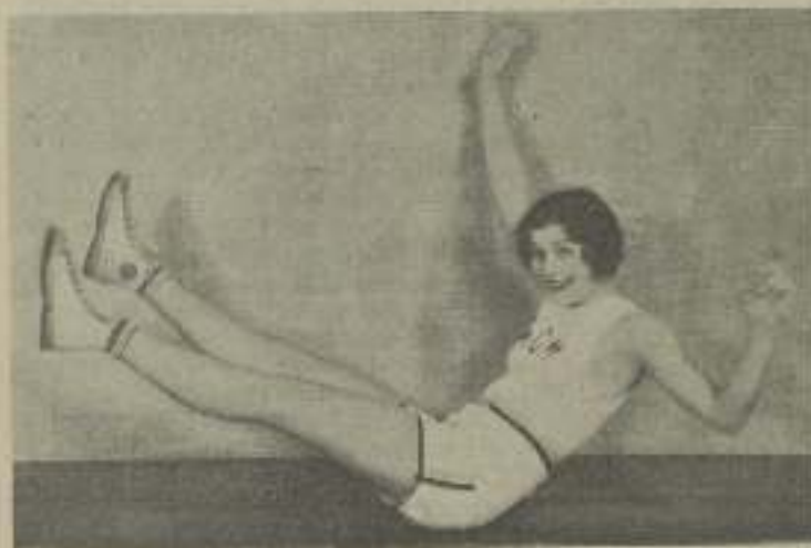
Marceline Day, se acaba de dar un portazo que ni pa qué...

Pues bien, me habían transcurredo unas horas desde que entregamos el rollo para su revelado en el laboratorio, cuando el viento, que aún reinaba apáticamente, se decompuso en un verdadero torнадо. ¡Este sí que venía de veras! Vaya ímpetu y velocidad que trajo!