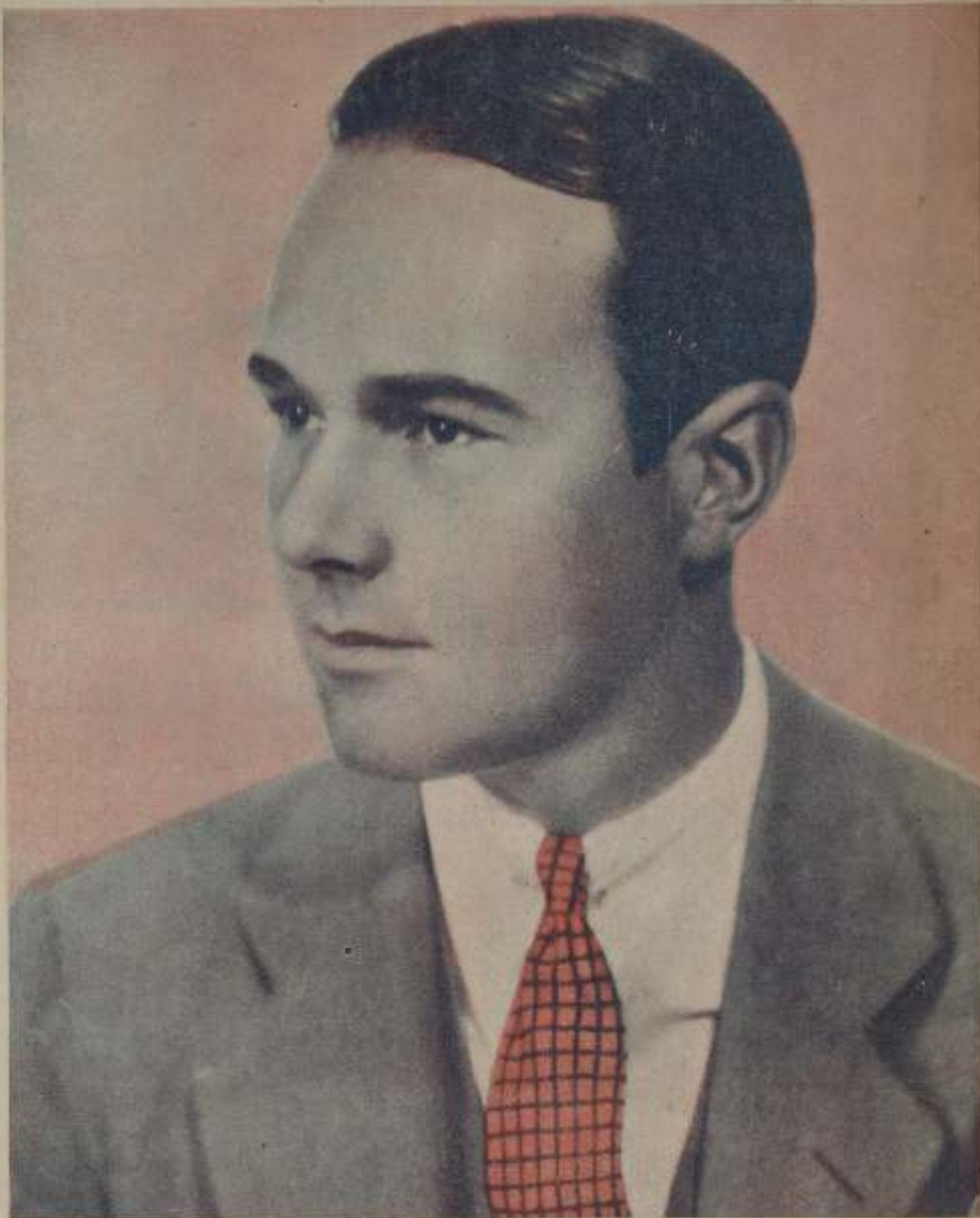
WILLIAM HAINES, UNO DE LOS PRINCIPALES INTERPRETES DE SU SARGENTO MALACARA, DE LA METROPOLITANA.