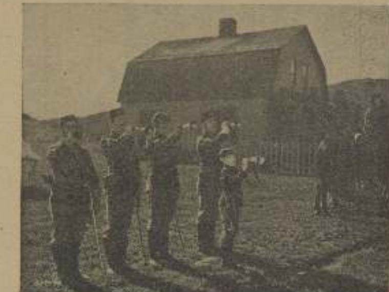
«El Pequeño Corneille» es el gran Jackie Coogan