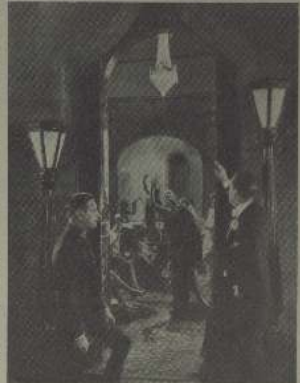
Una escena de El poeta de la guerra

No hay duda de que en España podría alguna industria aprovechar la fama de los artistas españoles para explotar sus productos con buen resultado.