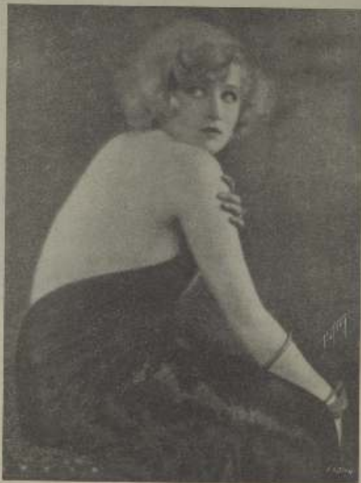
GRETHE NISSEN, la estrella de la "Fox".

Muy limitados son también los argumentos que se prestan a semejante realización cinematográfica. La vulgarización de los métodos de Carl Mayer condujo fuertemente a la monotonía. Un experi-