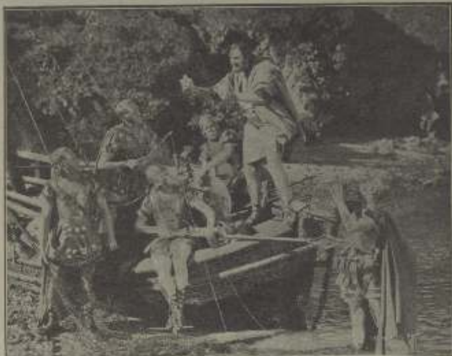
Una interesante escena de El Rey de reyes

Se han puesto a la venta los Estudios que