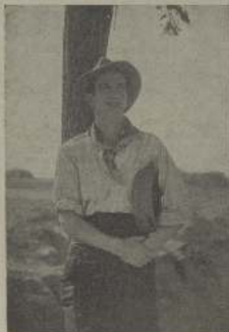
El palda A. Nos divertimos en Rosas y espumas

Bueno, Linda, me estoy cayendo de sueño, no creas que pienso ir a trabajar mañana, King Vidor me dijo que no traba-