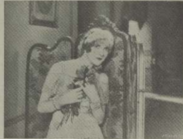
Colosales escenas de La Duquesa de Brabant

Recientemente se celebró en la Habana un plebiscito encaminado a conocer el actor más popular entre los cubanos, habiendo obtenido John Barrymore 2,063 votos; John Gilbert 2,355 y Ronald Colman 2,296.