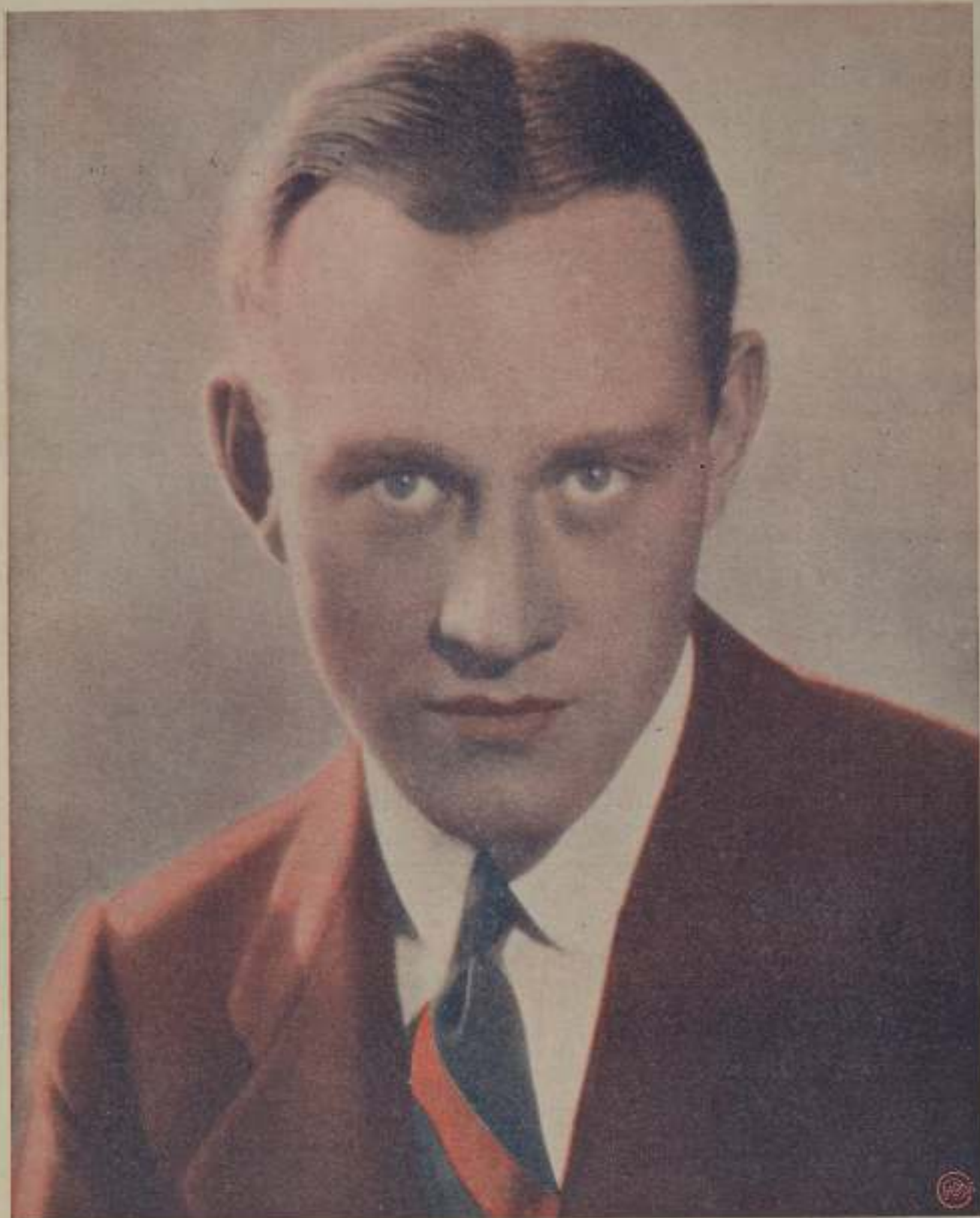
CONRAD NAGEL, NOYABLE ASTRO DE LA METHU-GOLDWYN