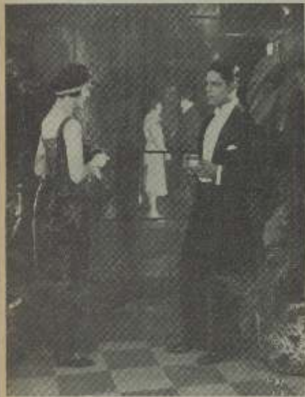
Una escena de Houra de Muzier

como fundan en Inglaterra y toman el control de producciones que hacen películas para sus propias y no obstante sus películas inglesas. Desde luego es muy cierto el ataque de "Hacia la ley, hecha la trampa".