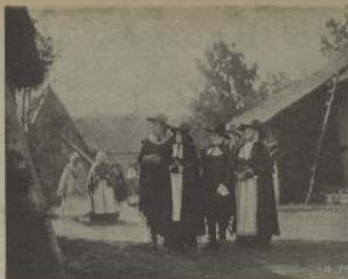
Una interesante escena, como refleja la expectación de estos campesinos y una vez el lector en La Mujer moicuta