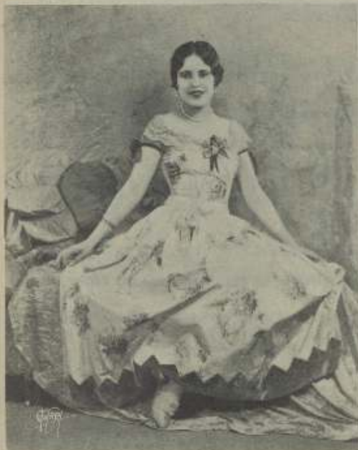
Nuestra simpática compatriota, la hermosa María Casares, nacida de las flores y cuna del arte silente