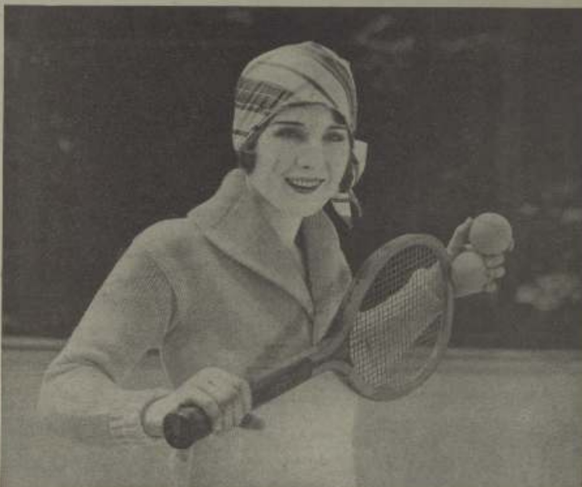
Norma Shearer en Japón a utilizar la raqueta y (de izquierda a derecha)

trabado le llamo usual escribir para el cine. Bien sabe usted que esto no es propiamente escribir. Mis historias las desarrollo a medida que voy trabajando. Cuando ideas, o las circunstancias me sugieren un argumento, lo archivo en mi memoria, y a veces pasan años sin que se me ocurra ponerlo en acción, pero cuando ella haga los detalles me viene a la mente con facilidad que a mí mismo me asombra.