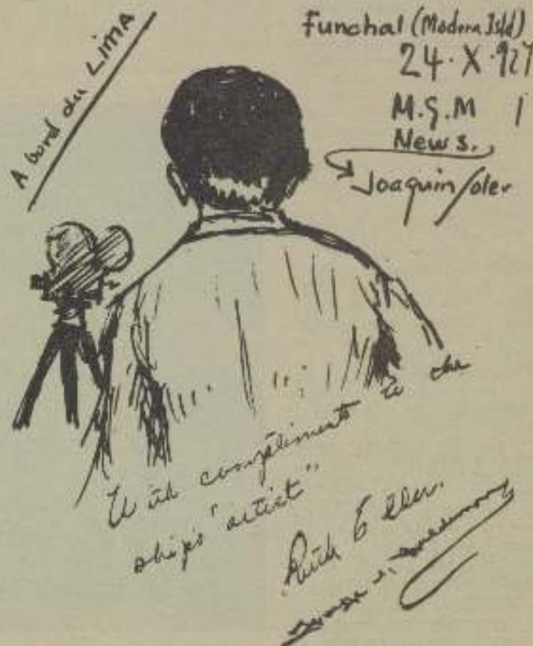
Caricatura de Joaquín Soler, ejecutada por Ruth Elder