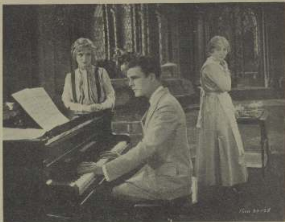
En esta patética escena de 'Madra má', se evidencia que el corazón de una madre no se engaña fácilmente