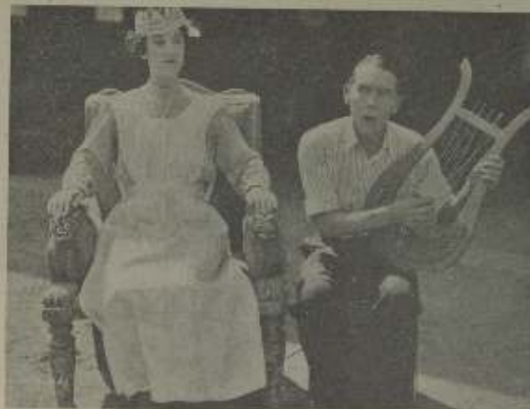
Una clásica escena en «Los cómicos que pasan»