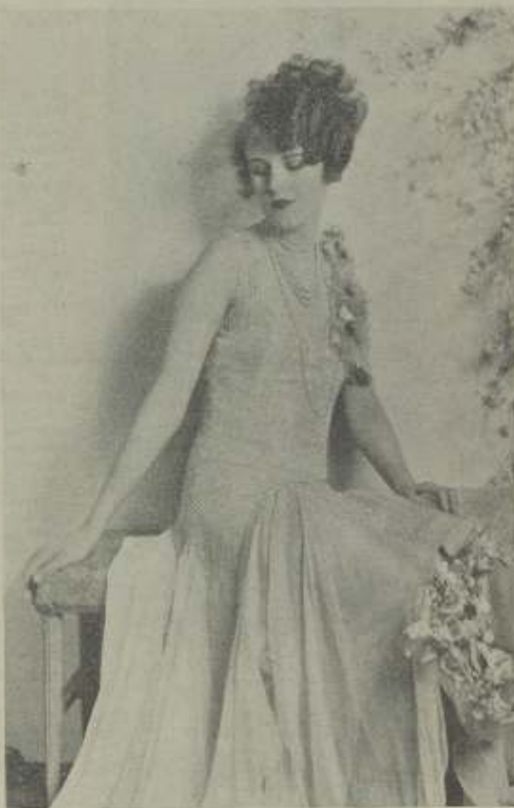
Janet Gaynor, la simpática estrella de la Fox

Aquí tenemos a James Murray, que fue elegido por King Vidor como el tipo ideal para el desempeño del papel principal en la obra "La Maldad". Le asignaron muchos dólares a la semana al empezar su trabajo en dicha obra, pero tan buena fue la impresión que produjo a sus principales, los directores de la Metro Goldwyn, que, sin titubear al poco tiempo le concedieron el sueldo que le han seguido concediendo.