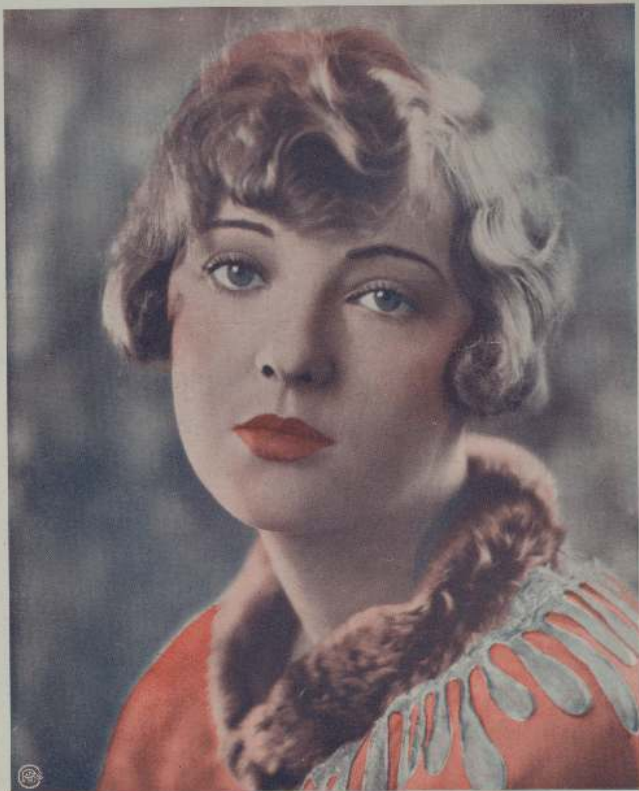
DOROTHY MACKAILL - First National