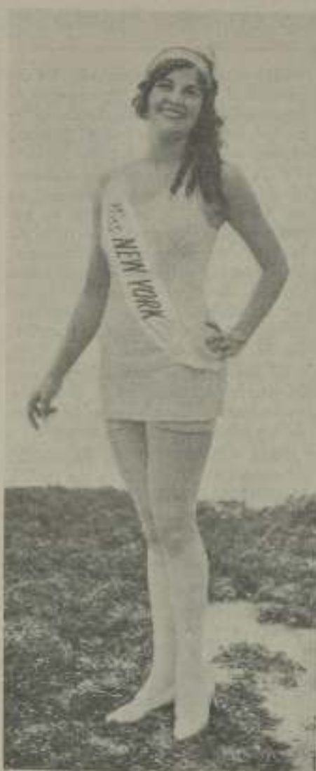
La «Miss Universo 1927» acribe complacido de la distinción de que ha sido objeto

cometa su concreción propuesta por el telegráfico, excita la curiosidad de cualquiera y a