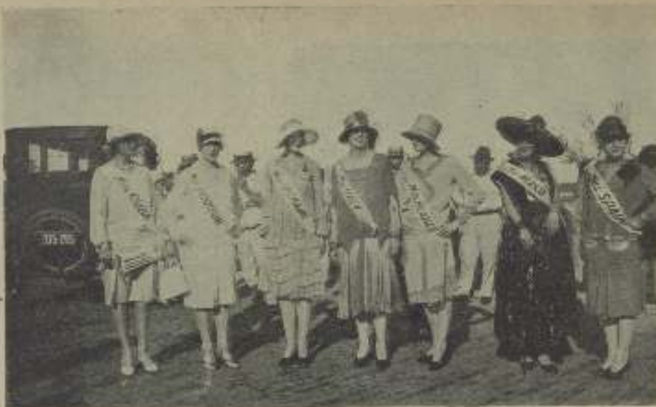
Aquí tenéis a las bellezas internacionales de 1927, durante el desfile matinal celebrado en la playa de Galveston