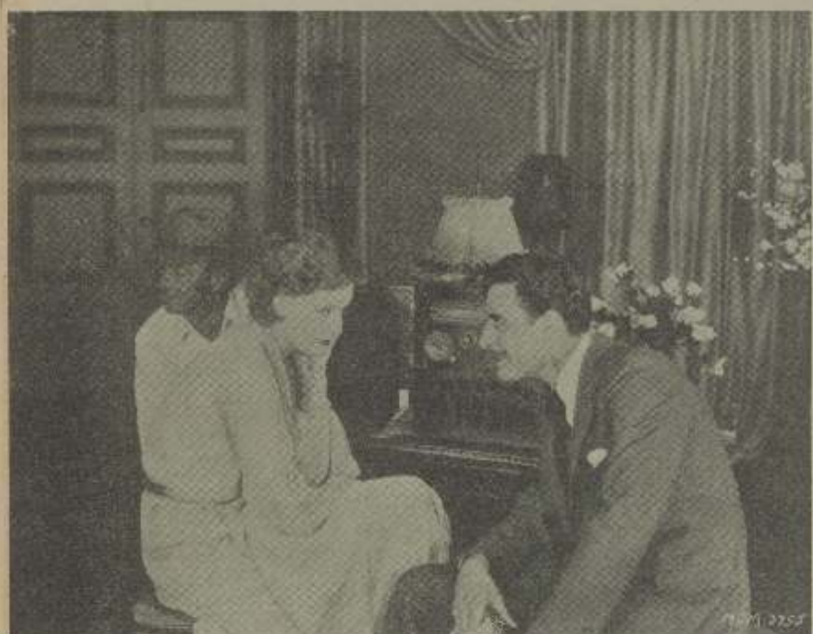
En un intervalo de la filmación de El Humano y la Carne, la maravillosa Greta Garbo y John Gilbert, que juntas un tal romántico por radio y que están viviendo un idilio no menos intenso que los que juegan