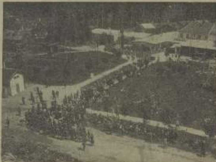
Montaje de su pagado, escena cinematográfica

El arquitecto, que con sus colegas de la película no tiene más parámetro que el de la igualdad de nombre, debe ajustarse a la esencialidad de la película. Estudios especiales le han facilitado conocimientos de los efectos de los diferentes colores sobre la pantalla. Así tiene que ser también perito en cuestión de geometría perspectiva y del espacio para saber matizar el efecto fotográ-