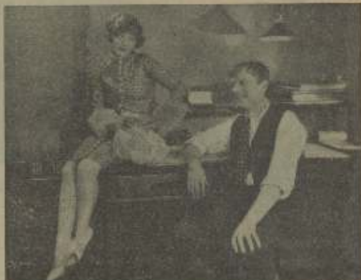
La verdad es que Marion Davies es una bella "little, la trabajadora".