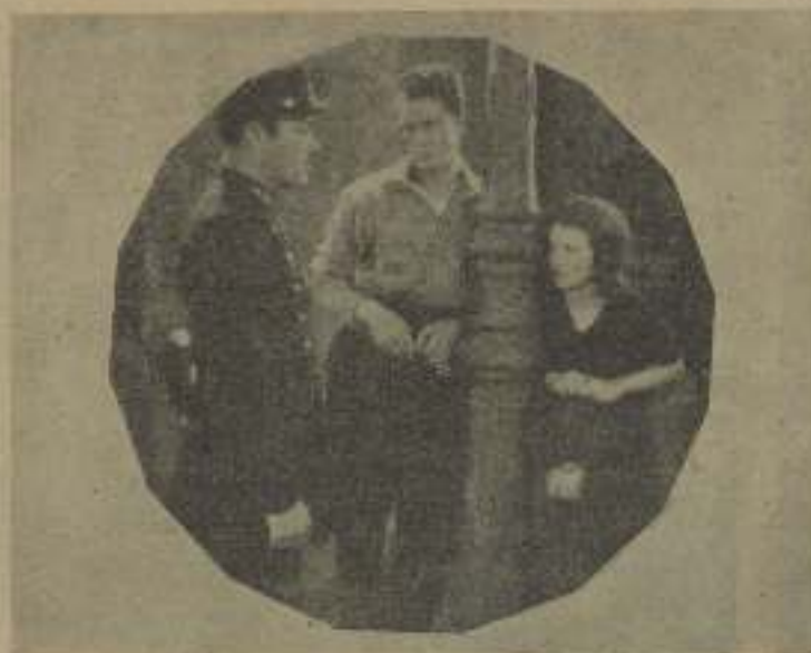
Charles Farrell y Janet Gaynor, las favoritas de El séptimo cielo

EL CINE LO CONFECIONAN VERDADEROS ENTUSIASTAS DEL ARTE MUDO Y ESTE ES EL SECRETO DE SU EXITO