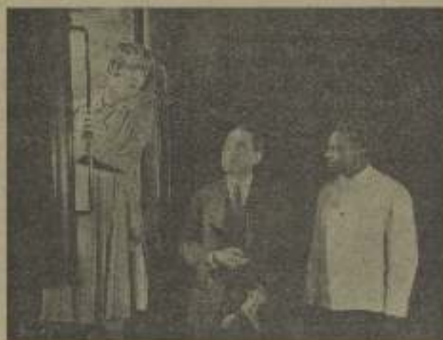
Amor a gran velocidad. Suponemos que la velocidad le imprimirá el tren