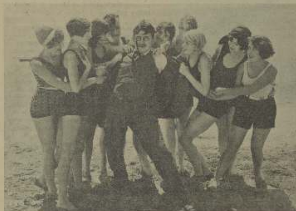
Una situación difícil para su Asador aprendida, y que muestra equilibrio de vedada.

en cuando sonríe, presentando toda la cara; la cámara a la mayor altura posible para aceptar la elevada frente del comediante.