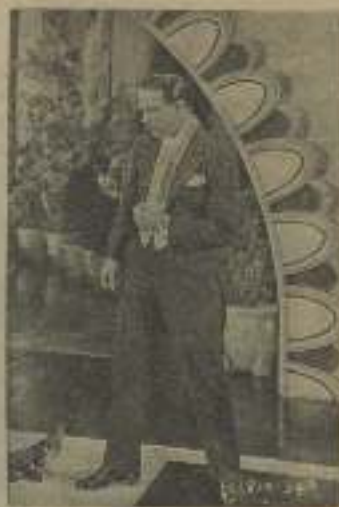
Rodó en "Cobos"

de se me cierran y tengo que hacer un gran esfuerzo para volverlos a abrir. El sueño se va apoderando de todo mi ser, sueño.