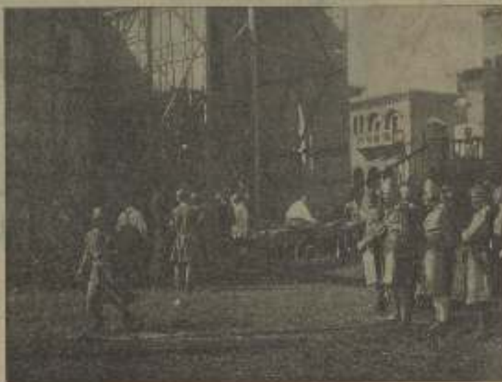
Las composetas se disponen a salir en escena