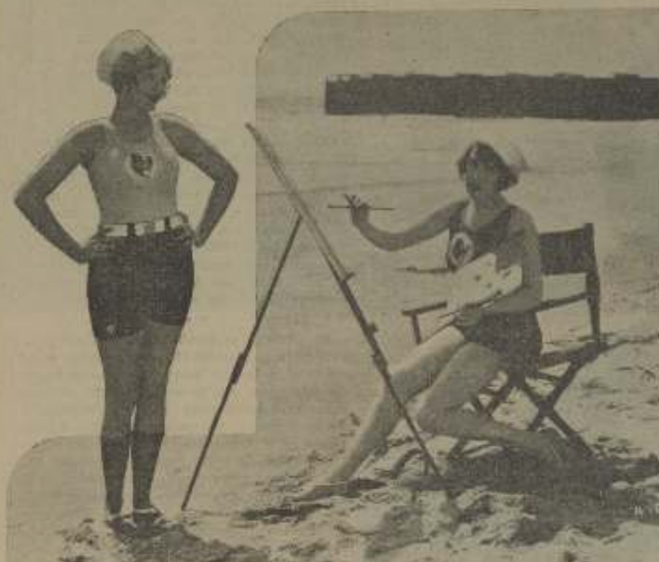
Das bellas, una piola y otra modelo, que son verdaderas "modelos" de belleza

está dispuesta a continuar su contrato con Pola Negri a 10,000 dólares semanales y además así es seguro el cancelamiento del contrato con Thomas Meighan por 200,000 dólares que percibirá el artista por la anulación. Thomas Meighan actualmente cobra 125,000 dólares por cada película y habla de hacer cuatro al año.