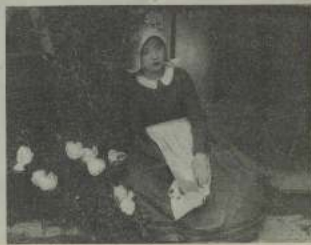
Marion Davies abogada con los típicos ropajes de la lundana. Here en esta escena de "El malino rojo".