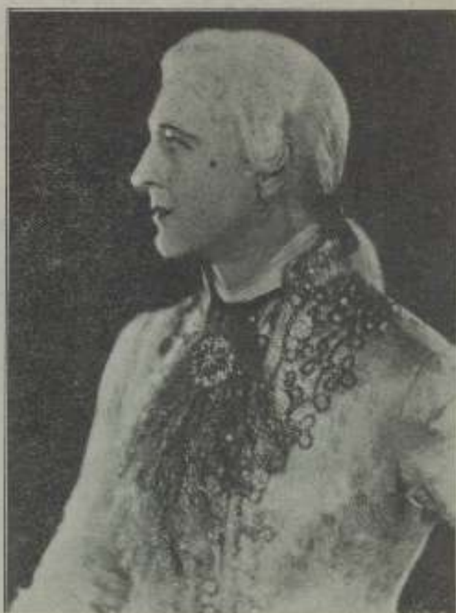
John Barrymore, el galante galán, protagonista de Los Amores de Manón