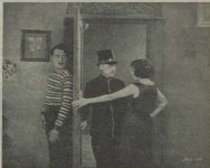
Participa una extraordinaria a lo que quedará, pero la verdad es, aunque no le concede el título que se trata de una escena de "El palacio de las maravillas"

LUIS SAAVEDRA Hollywood, septiembre 1927.