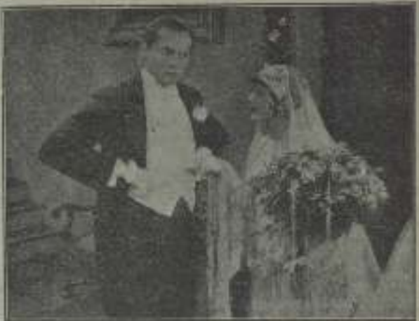
Se dice mucho acerca de lo que debe saber una joven, pero lo que parece más definitivo según la eterna de la película que se titula así, es el casamiento.

A pesar de que la prensa norteamericana no dice una palabra del asunto parece que es cierto que, hace unos cuantos días, Gilbert Roland — Luis Alonso, el hijo de Paquita — fue atacado por varios individuos que, según se asegura, querían el propósito de desfigurarle la cara a fin de inutilizarlo para las fiestas de la ciudad. Como excepción pro, hablo de este atentado, se menciona en una lista el nombre del esposo de una famosa estrella, administradora del gran hospital de la ciudad hasta el grado de hospital como radiólogo al marido. Dada la influencia que se sitúan como agentes en el que fortuna, fracasado otro, no deberá sorprendernos al que Gilbert Roland no puede contar con el esplendor a que se ha hecho acreedor, según la crítica. Pero también debemos perdonarnos para, de nosotros un poco, sabemos si se conoce alguna injusticia con