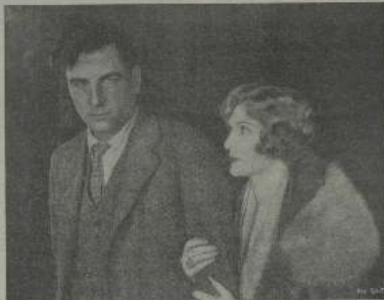
Milton Sills, el actor de extraordinario éxito, en una escena de Hombres de acero

—Vamos, consistió de una hora más declaró.