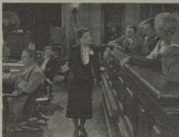
Nancy Wheeler está demostrando en esta escena de "El caso del Sr. X" que ella pertenece al fuerte

Dos ciudadanos de Salt Lake, no sólo, mas si con miras interesadas o completamente desinteresadas, han decidido pagar todos los gastos de viaje y estancia en esta ciudad, durante dos años, a la bella