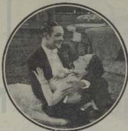
Leatrice Joy en una escena de La viuda de nadie .

Más tarde se adhirió a las comedias Wiles Barro Black Diamond, después de un