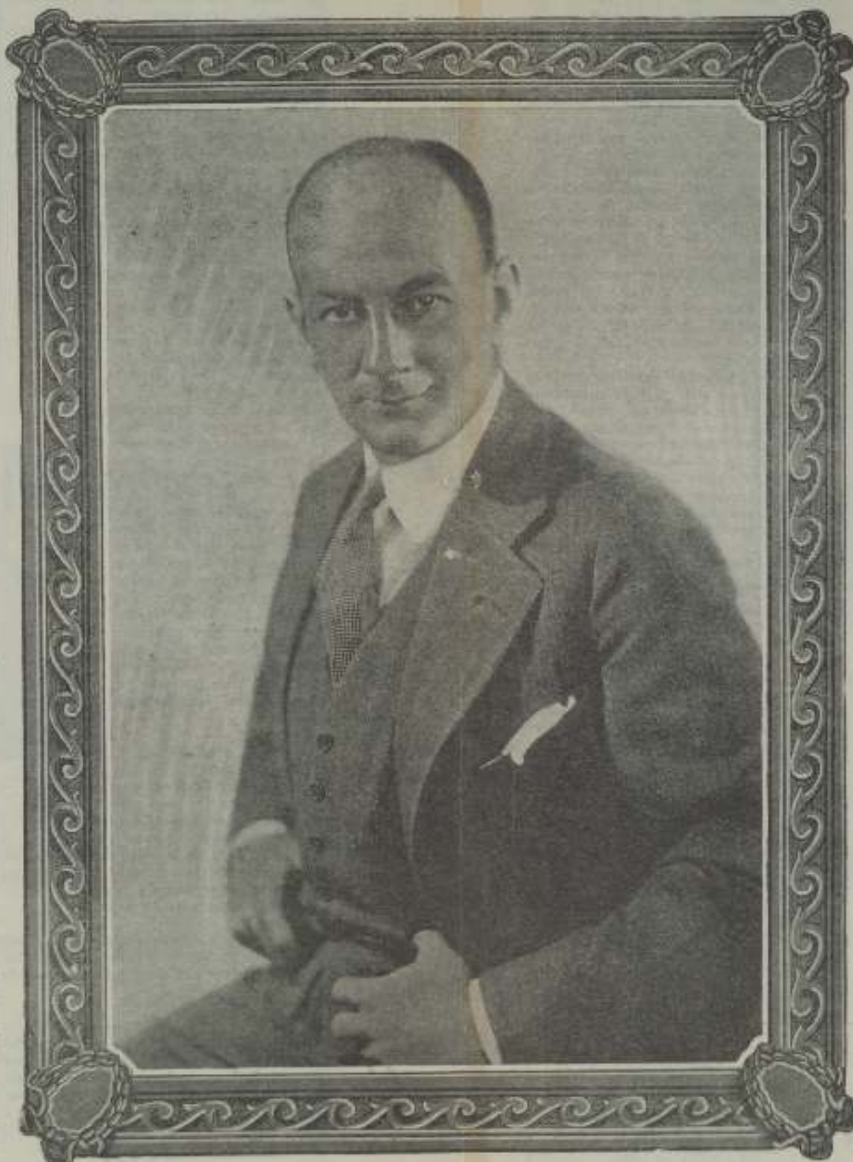
OTRO DIVORCIO FINIDO

En este mundo no hay duda que nadie está contento con su suerte.