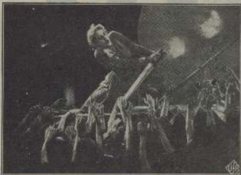
¡Cúidate belleza encierra esta escena de la hermosa película Metrópolis!

grande. El tratado nos aturde. No se ha preocupado el cronista de envolver su andaz preñada en las muletas de una literatura habilidosa, curulesca, envilecida. No infortunadamente ha saltado a la arena, ha plantado su atreva bandera de combate en medio de