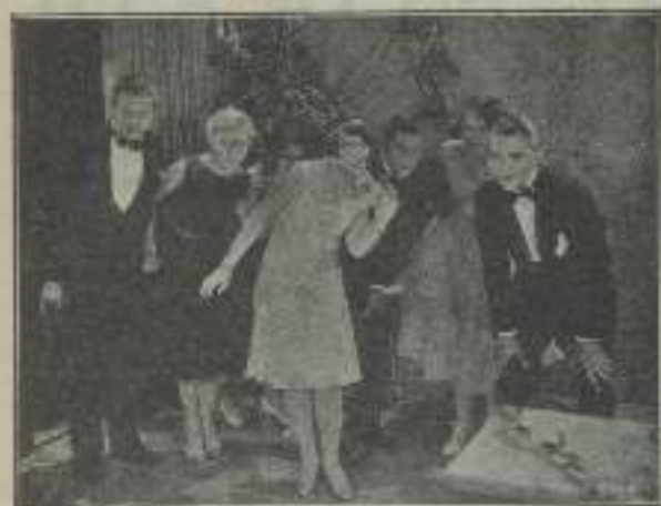
No hay que hacer mucho de lo que hacen ya que la película se titula Amor de estudiante por lo regular se trata de mucho ruido y pocas nueces.

de encargar al director Von Sternberg la realización de la mencionada película.