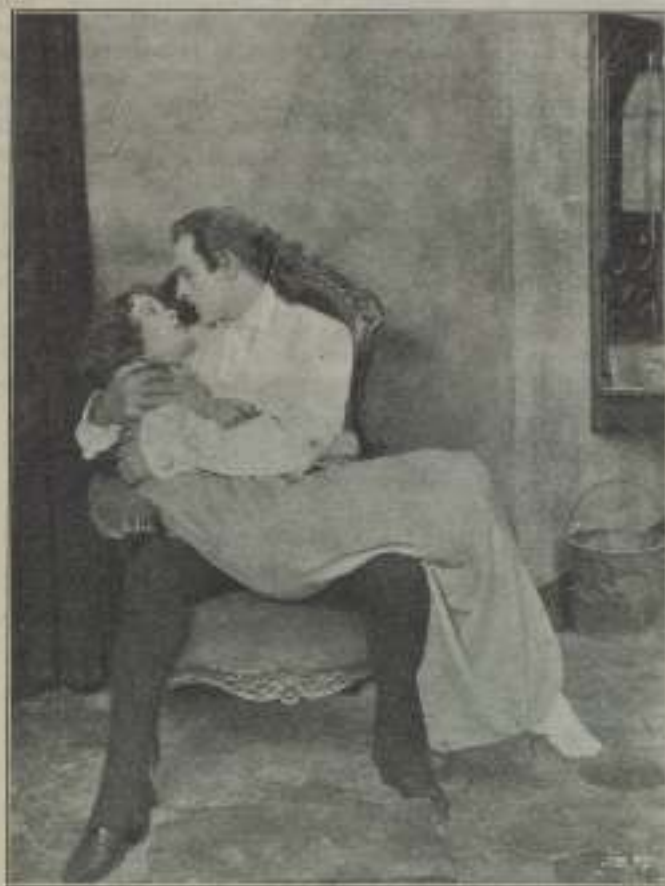
John Barrymore y Dolores Costello en brezo en Los Amores de Manón