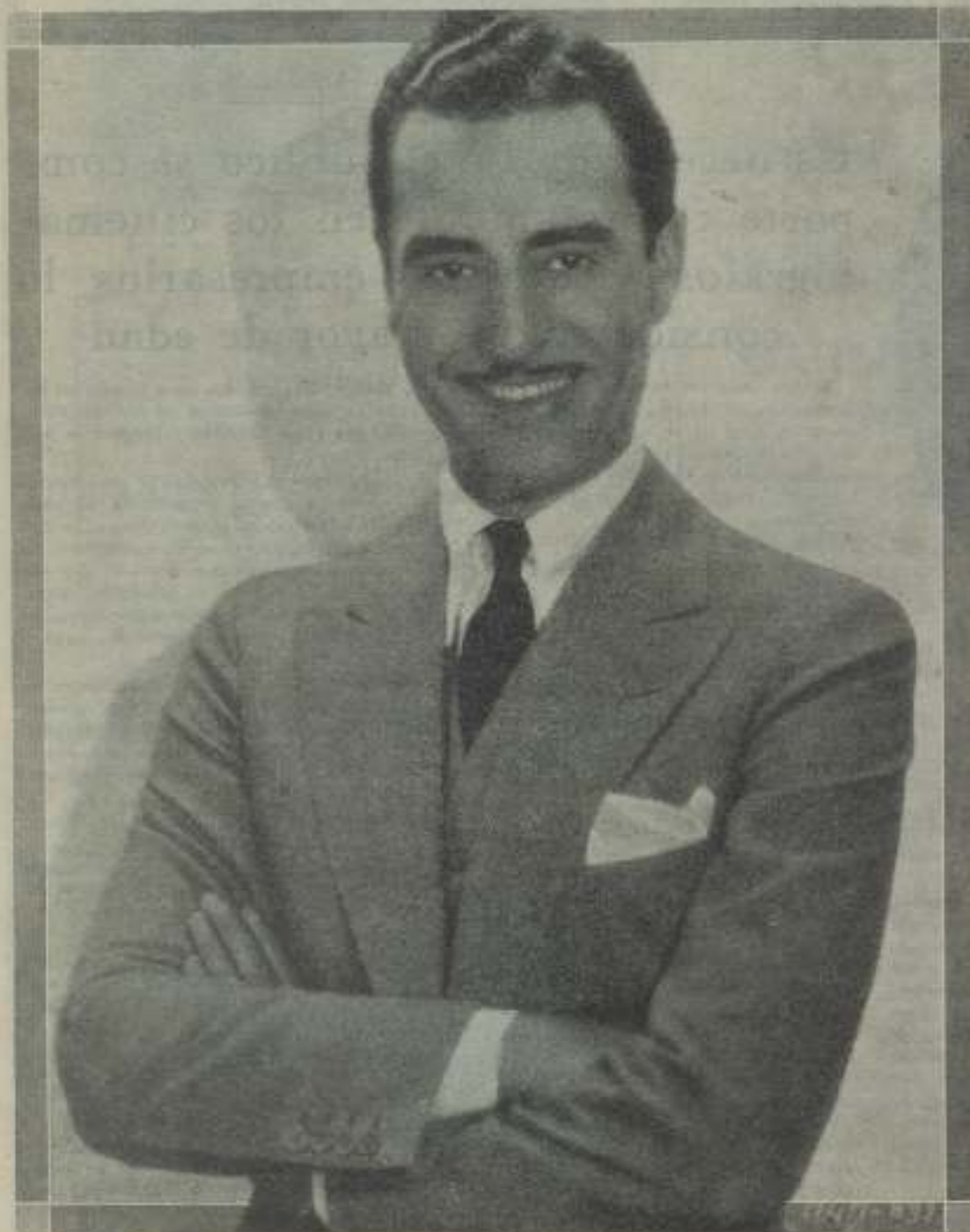
JOHN GILBERT, el juvencito de las damas

EXISTE un actor que hallándose en el más elevado punto a que la gloria puede llevar a un mortal, tan sólo piensa en poner fin a su carrera, sustrayéndose a la popularidad.