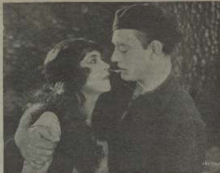
Conrad Nagel dispuesto a abrazar a su compañera, en "El cielo en la tierra", una película ya conocida bien su nombre

«EL CINE» ES LA REVISTA CINEMATOGRAFICA MAS IMPORTANTE DE ESPAÑA Y DE MAS CIRCULACION