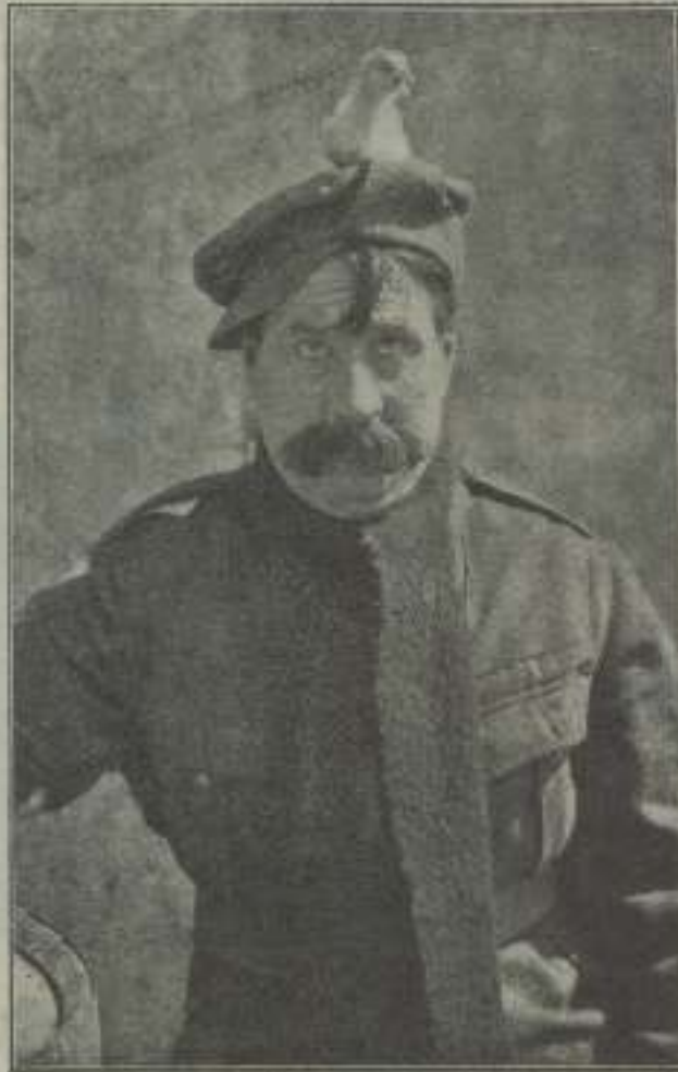
Sydney Chaplin, mostrando algunas ideas cómicas para ilustrar su actuación en "El fresco de las trincheras"

malida alfombra y las pesadas cortinas de un color verde botella, semejan al mundo invernal que rasga la gloria de las películas cómicas. Por los muros se extiende la librería, de dos metros de altura, con puertas corredizas de esbato, faldas de lana por el excesivo peso de la gravitación.