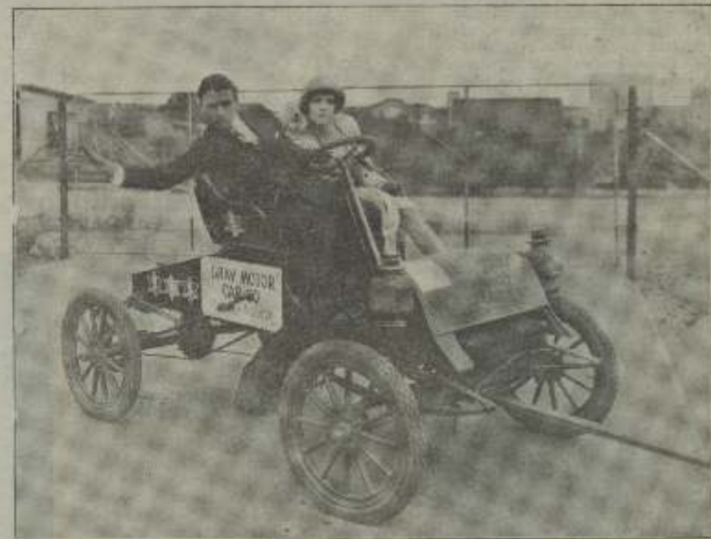
Marie Prevost y George K. Arthur, salen a dar un paseo en auto, por seguirle así el argumento de "Coal una señora", para esto usó en 1913, y el coche Ford, es un verdadero cocharrón del 1913.