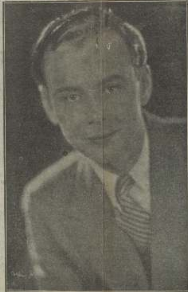
William Collier, hijo, uno de los galanes más simpáticos de la pantalla