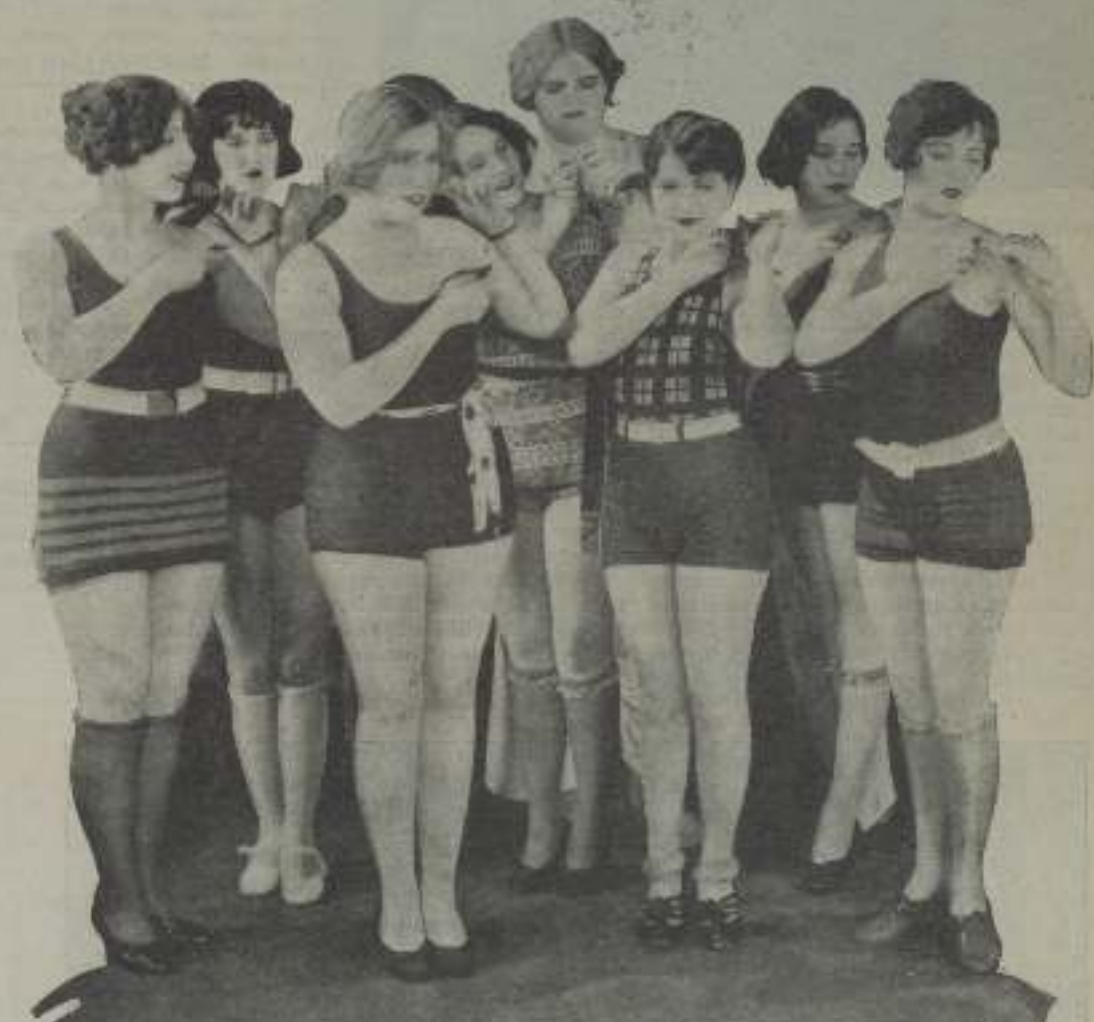
Óperas muchachas de Hollywood, que consumen los dolores de Sydney Chaplin

—Ústed lo ha dicho. ¡Oh! El ambiente de una película es