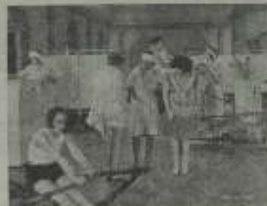
Una escena muy divertida de Las oclocias de la ballera

con el hombre amado un modesto cuartito de pensión. También suele haber una gran duquesa, con muchas joyas y muchas sedas, que desprecia un reino, para huir en aguas