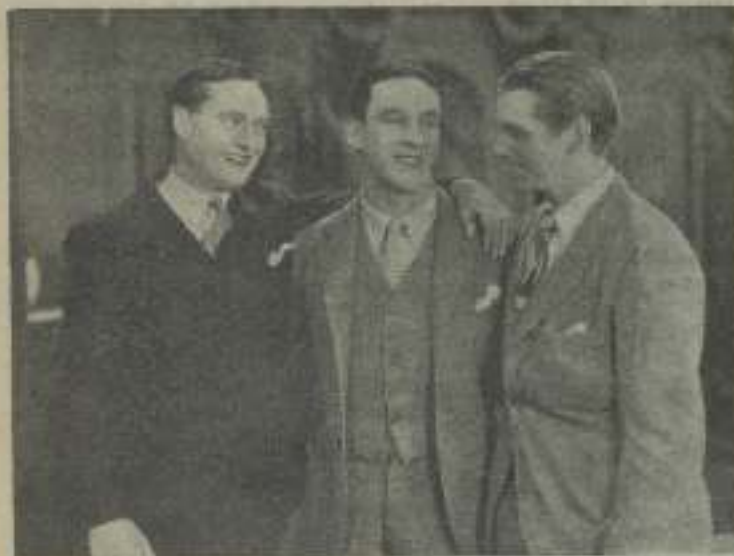
George O'Brien, Edmund Lowe y Douglas Fairbanks hijo, en "Genio de guantes", una cinta de vañolazos, aunque un lo curioso