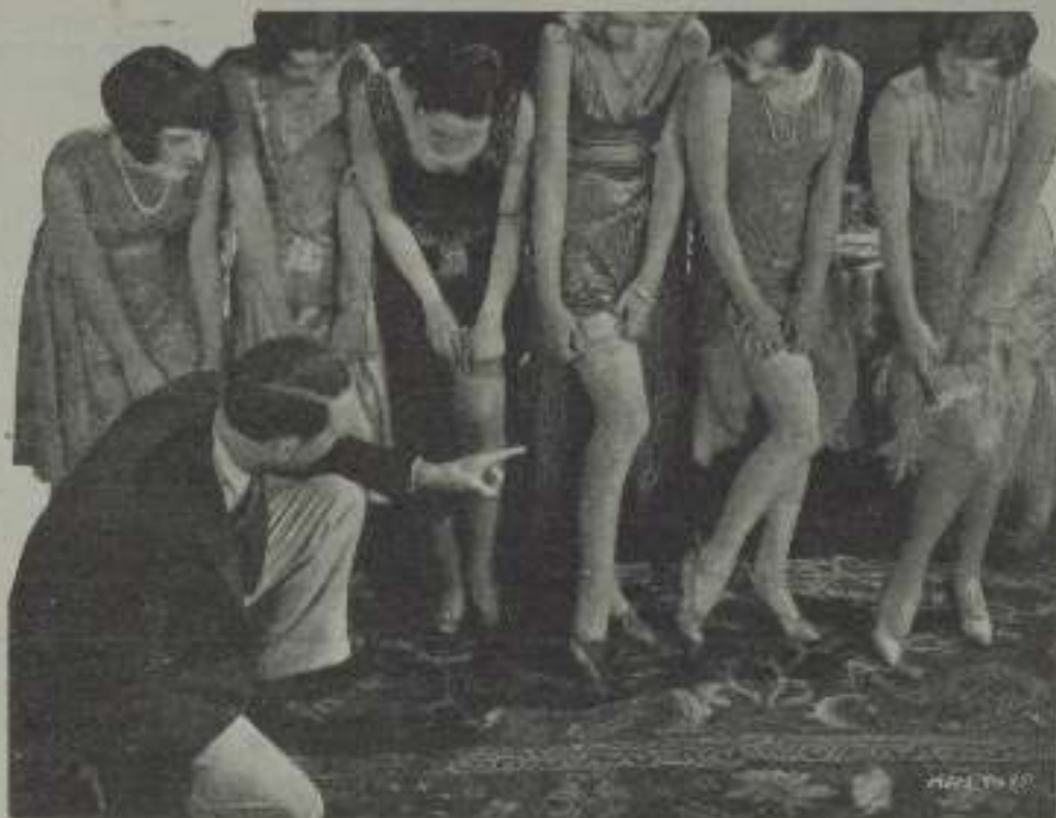
Por aquí, sí... por aquí ¡no!!

tomarlo los reyes, y ha ahí un guzapo de cuerpo entero, con las orejas y toda el cuerpo afuera, pero del que no todos se apercebirían de momento, pues el público que asiste al cine, como el de los demás espectadores, saben desde los unillabitos, que de todo hay en la vida del Señor, hasta los más finados, ¡ni que decir tiene!, que el principal ingrediente, la razón de ser del chocolate es el cacao (que, "sin embargo", sólo empuja de nombre algunos chocolates modernos), pero hay todavía quienes ignoran que es originario de América, y, por tanto, no habiendo sido ésta descubierta aún, no podían los Reyes Católicos estorear en aquella ocasión chocolate super extra fino (marca registrada), ni ningún otro engendrado en cacao (¡oh, de. Deino aroma que por el olfato sube a coquillar el gusto!, ¡oh, saboreo interrescador que predispones al arrepost, miento de haber tomado café de "garroñ, nes", "manchetas", etc., etc.): en cuyo desentramamiento tampoco podían pensar ahora en mentas Amalher: Matías López; Baix; Pedrosa; Cudill; Juncosa; Coma; Nella; etc., etc.) de millares de fabrican, tes diseminados por las cinco partes del mundo que proveen del sabroso desayuno a millones y millones de estómagos.