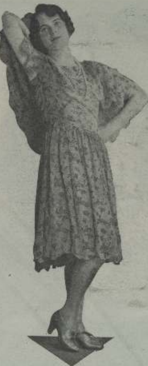
Lois Moran, la hermosa estrella de la Fox.

siempre peculiar del Oeste y al finamente logró ascender a la popularidad deseada en "La rana", papel que desempeñó en la película "El hombre milagroso". Chaney siempre ha sido un buen actor, pero necesitó de la llamada "prueba" para que el público le des-