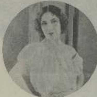
DOLORÉS DEL RÍO

El segundo año rebajó el capital existente. Desde el año 1846 hasta 1851 se duplicó cada año el capital anterior y de esta manera, en este último año alcanzó la suma