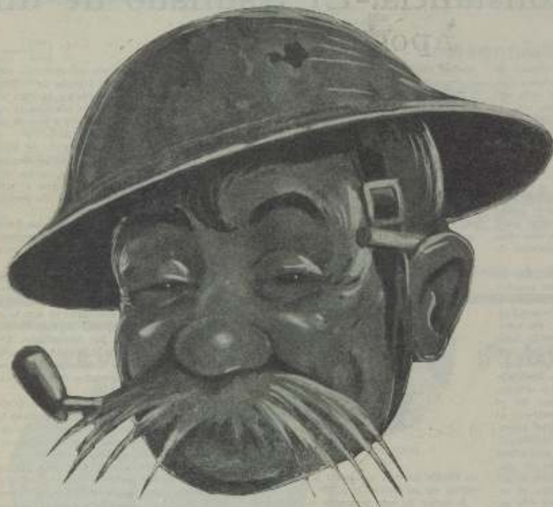
Spá Chaplin, el famosísimo actor cómico, tal como aparece en "El trofeo de las trincheras"