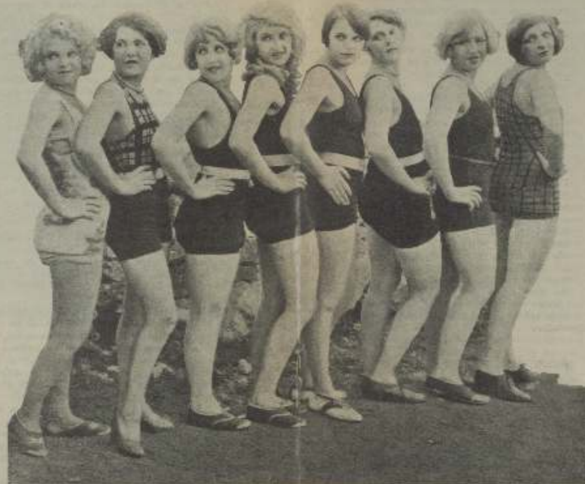
La procesión de la belleza.

Niagara perfecta dijo nada, sin duda re-