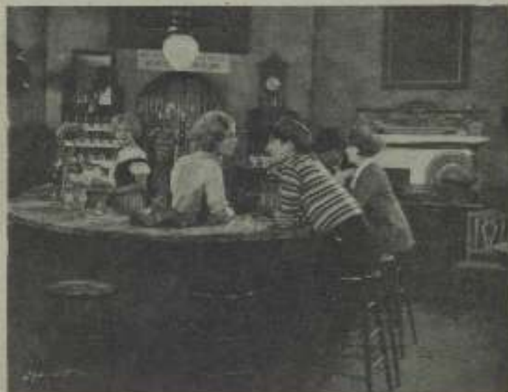
Una oficina al ultramóvil era que aparece en el Palacio de las Maravillas.

Rata es una superstición traída del teatro, pero hay otra propia a los actores del cine únicamente. Cuando uno sale en escena