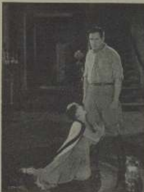
«Señor, no se puede! pero sí, es posible, pues es una escena de Atarax del dios»