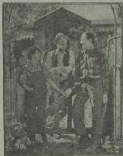
El campo con sus paisajes, la sencillez de los habitantes, algo que atrae animalito y con una más encantadora aceptación hacer lo que hace el protagonista de «Miguelita» está

en su bols la pata trasera izquierda de un conejo Dorothy Sebastian, otra actriz de Metro-Goldwyn-Mayer, lleva al mismo animalito; pero en la liga de la rodilla.