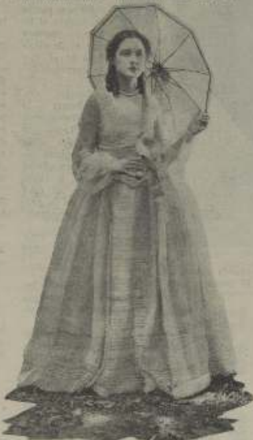
Eleanor Boardman, ataviada con uno de los trajes que lució en El Caballero del Amor, está casada con King Vidor.

demonstrado eloquentemente que es también un arte que requiere las ventajas del nacimiento. Ya es frecuente el casamiento entre actores de la escena muda; directores se casan con estrellas; estrellas se casan por los sagrados lazos de Himeneo, con autores cinematográficos; y todo ésto constituye un