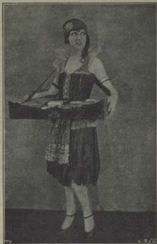
Mae Mac Avoy, vestida de tobacco girl para trabajar en su película Flare de Cabaret

El Cabaret Montmartre de Hollywood nos dice la encantadora Mae Mac Avoy — tuvo días de esplendorosa gloria. Allí se congregaba diariamente, después de la cotidiana tarea en los estudios, la casi totalidad de los miembros de la familia del «film». En Montmartre se han realizado más de un encuentro que luego se tradujo en boda, se casaron varios noviazgos, entre ellos el del desgraciado Valentino con Joan Acker, y se celebraron numerosas fiestas de cumpleaños. Montmartre es todavía el encanto de algunos compañeros de trabajo y el sueño dorado de las señoras, que por darse el gusto de pasar alguna noche en este local de precios elevadísimos, se privan de todo durante meses. Ellas creen que quizás allí puedan encontrar la oportunidad de ser elegidas estrellas desafiando con la mirada a los escasos directores que pululan en estos últimos tiempos por el en un día famoso centro de reunión de los favoritos de todos los públicos. Las muchachas tabaqueras, que allí llamamos «tobacco girls», son unas deliciosas chiquillas, muy bonitas todas ellas, que con simpatía hacen comprar su costosa mercancía, ya sólo vender cigarrillos y cigarrillos a elevado precio, a los más famosos actores que por allí se dejan caer y muchas más de un disgusto matrimonial entre los turistas que vienen a ver el famoso Hollywood y quedan prendadas de las «tobacco girls» del Cabaret Montmartre.