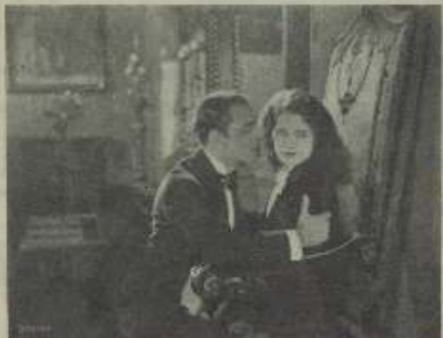
Novena Álvarez, más joven que nunca en "Sexo 4411"