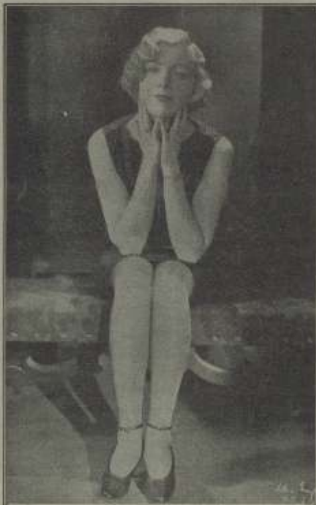
Estas Revistas, imparable de líneas y estatuaria como siempre está pasando en la película "Amor mío", donde dice la revista todaría, pero a pesar de dar crédito a sus palabras, nos resistimos a creerlo.

Es de todos conocido que la crítica, en una sesión privada, va invitada y por lo tanto si su juicio no fuera favorable, por de ser causa de una reclamación judicial.