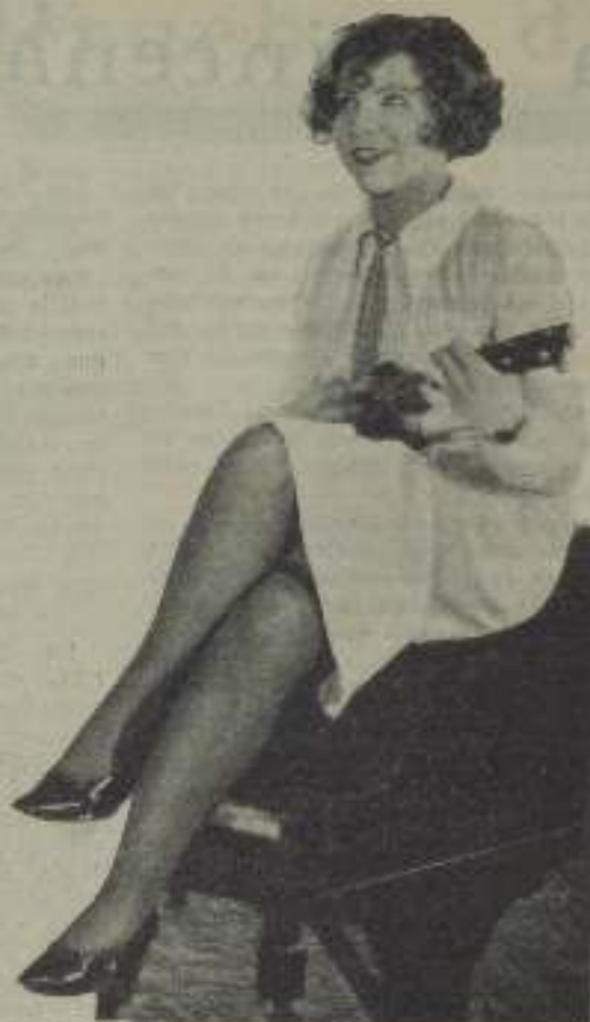
Una de las consagradas niñas de Carlisle está imitando aquello de "We Avere no humanas."

Los Chaney, el inolvidable Lon Chaney, el héroe de las mil caras, era ya un actor de renombre cuando el cine estaba apenas en la infancia. En aquella época, un actor tenía que ser capaz de interpretar todos los géneros. Lon Chaney era un comediante y un trágico, un mago, un acróbata, todo. Generalmente, pertenecía a compañías que recorrían el país. En honor a la verdad, Lon Chaney fué siempre un éxito. Toda vez que, el famoso artista fue,