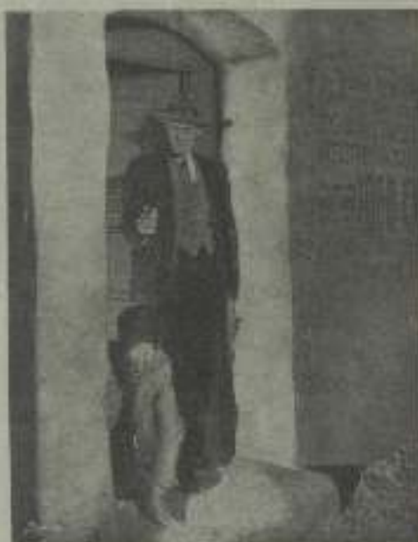
Algo muy horrible debe ocurrir en esta escena de El Palacio de las Maravillas.

Casi todos los actores creen que si colocan sus zapatos en un estante más alto que el