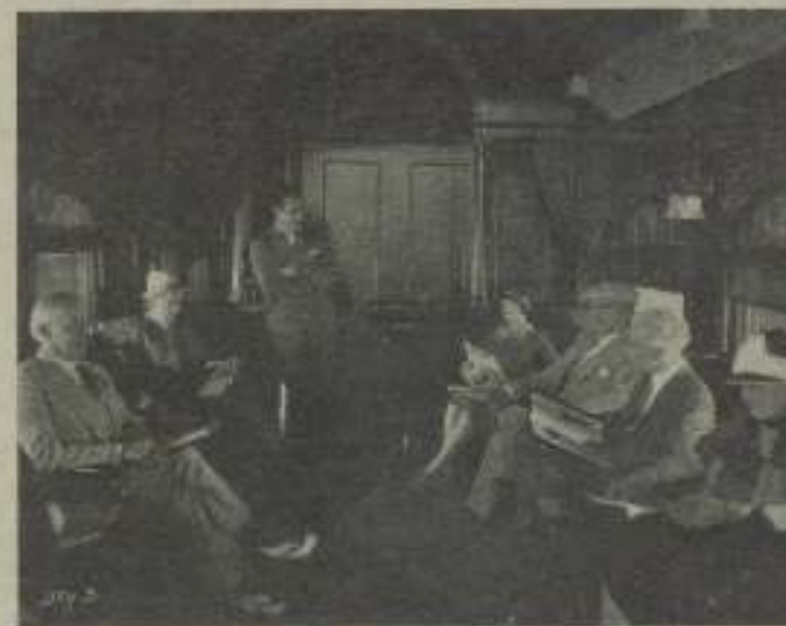
No hay duda que esta escena de amor en un tren, se cuenta a mil maravillas el día de "Amor a gran velocidad"