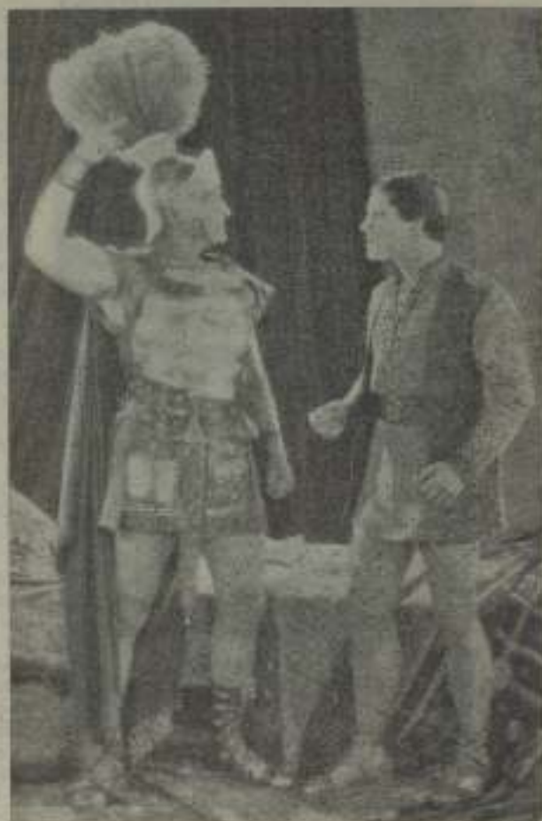
El gran actor Ramón Novarro en una escena de la sublime producción "Rom-Rom"

Y estos hechos son hechos de carne y hueso como los demás, son vivos con palpitaciones y latidos, con estroberias con