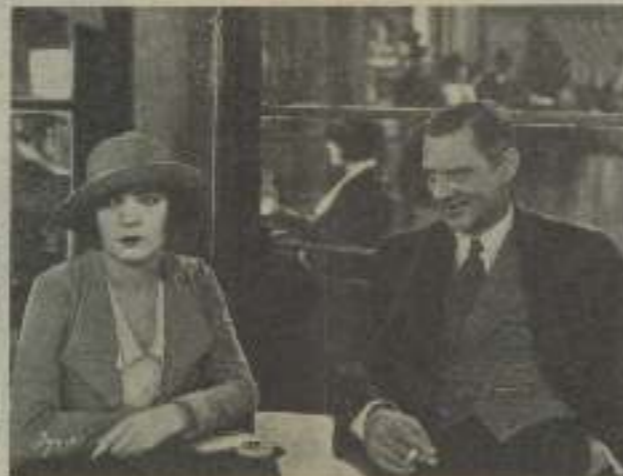
Una seducción a todo tren de "El palacio de las maravillas"

Antes de que el "Central Casting Bureau" fuera fundado por la Sr. Zambardo Hays, fundador, habían pequeños Castings que cobraban el 10 por