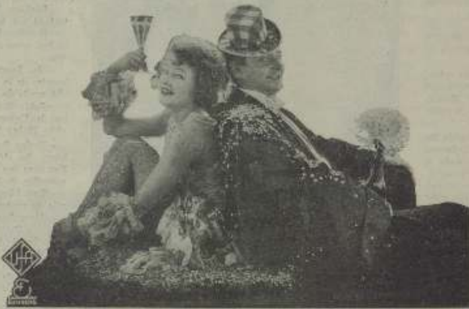
¡Bebida por tí!, pero bebo para mí, está diciendo Lillian Harvey en esta escena de "La terrible Lola"

ocida y nuestro cerebro ha debido hacer un gran esfuerzo para plasmar en unas palabras una situación de las que ella produce en sus personales interpretaciones.