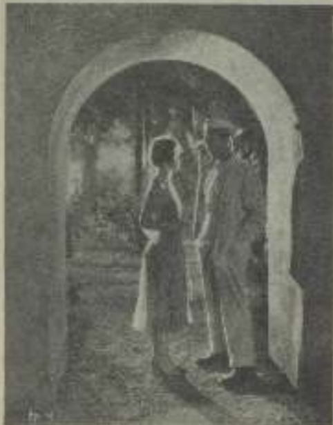
¡Cuidado bellísima, cuéntame qué sacas de "La mujer mandó"!