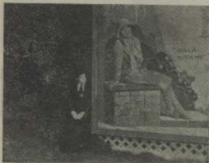
Harry Langdon está pensando lo bien que lo pararía con una chica tan guapa en Sportman de ocasión

Pola Negri, hija del mismo país, observa también esta superstición. Los lechones son llamados de buena suerte en casi todo el mundo. En Irlanda se acostumbra regalar cordón de perlas a los herederos de tierras, para que tengan buenas cosechas. En la China, se ruegan a los niños recibir unción hermosa lechoncillos de seda para ahuyentar los malos espíritus y el mal de ojo. En Polonia recibe un poco lechón de regalo al emprender cualquier negocio im-