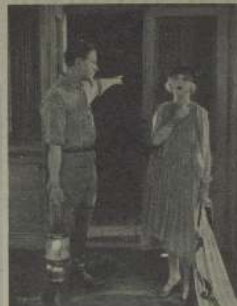
Una mujer con su aristocrática de salón, en "Amores del desierto"

"EL CINE" es un informativo, precioso y útil de primera categoría de los dedicados al arte nuestro.