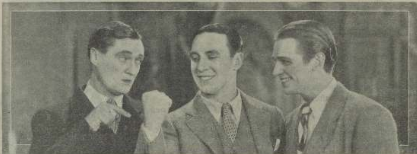
George O'Brien, Edmund Lowe y Douglas Fairbanks, hijo, protagonistas de Gente de Guantes