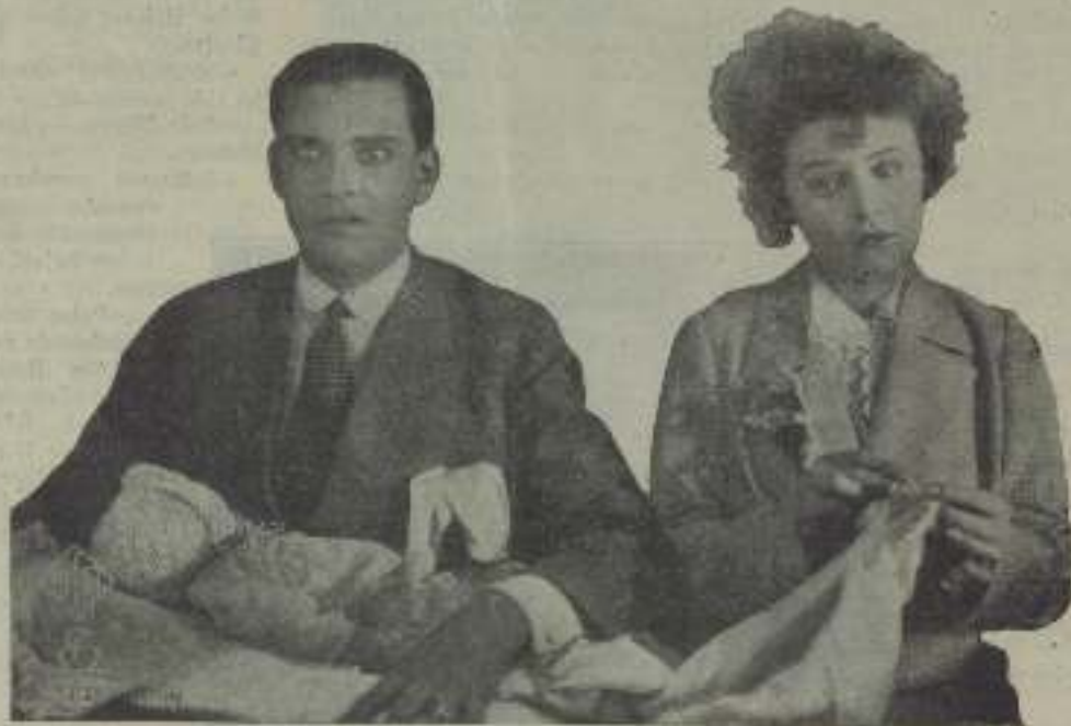
Lillian Harvey se armado un día con sus ropas de su esposo, para averiguar su nombre de "La terrible Lola"