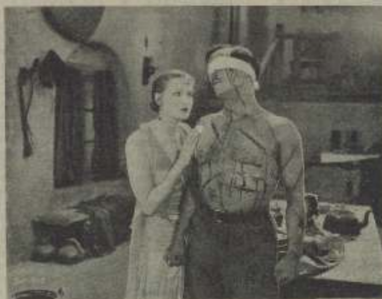
Greta Garbo y Antonio Moreno en la película «La tierra de todos»

El truco de un artista en el cine, actualmente depende mucho de lo que fue en su pasado en el arte