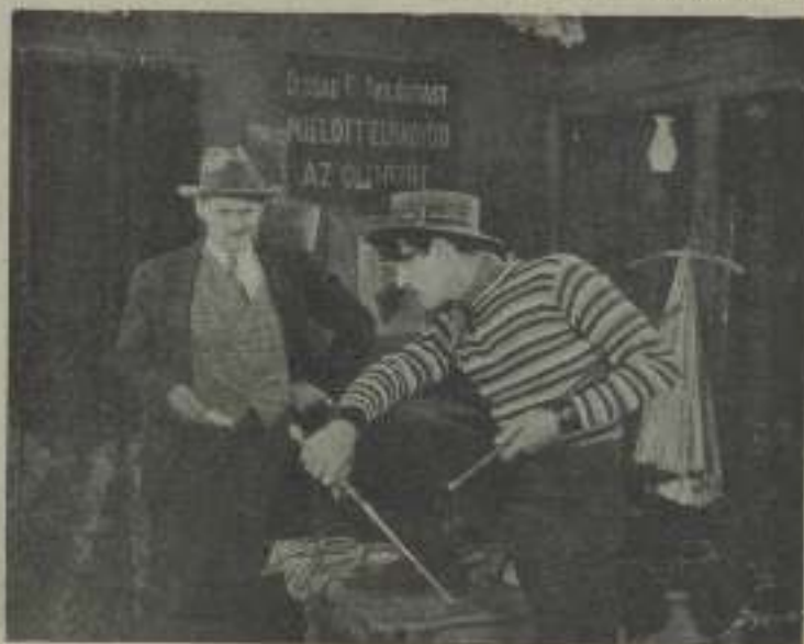
Un soborno y quizá un crimen en puertas, que se verá en El Palacio de las Marxvillas