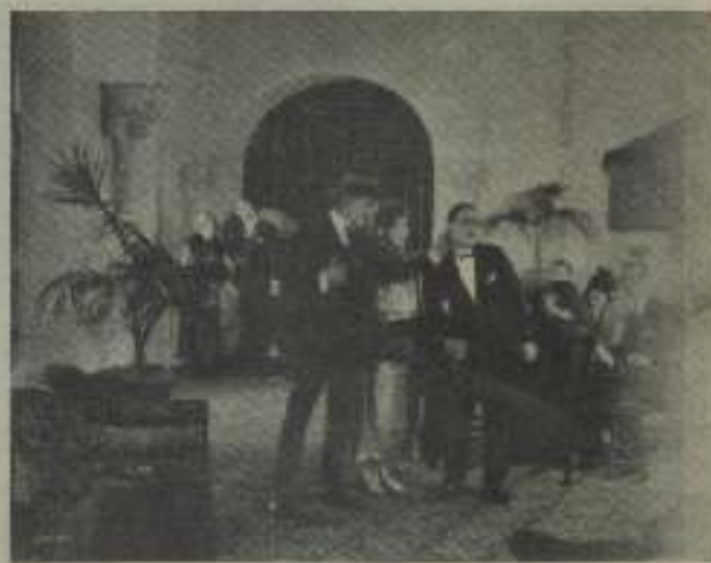
Una escena más, ya que en Análisis impera la ley seca, en La Venus Submarina.