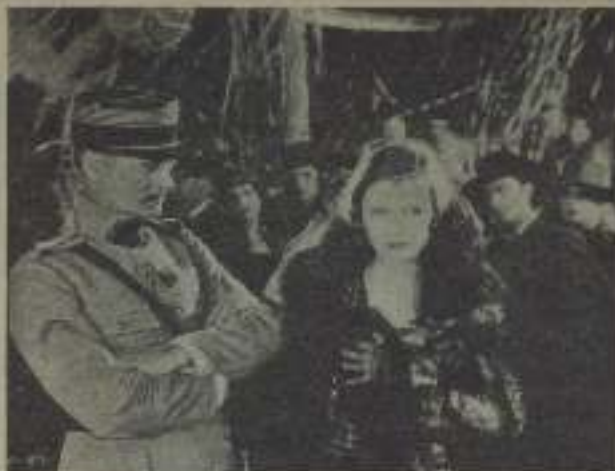
Greta Garbo, la más ilustre de las estrellas del cine en una escena de La Tierra de todos .

Creemos demostrados con estos breves indicios que las sólidas bases