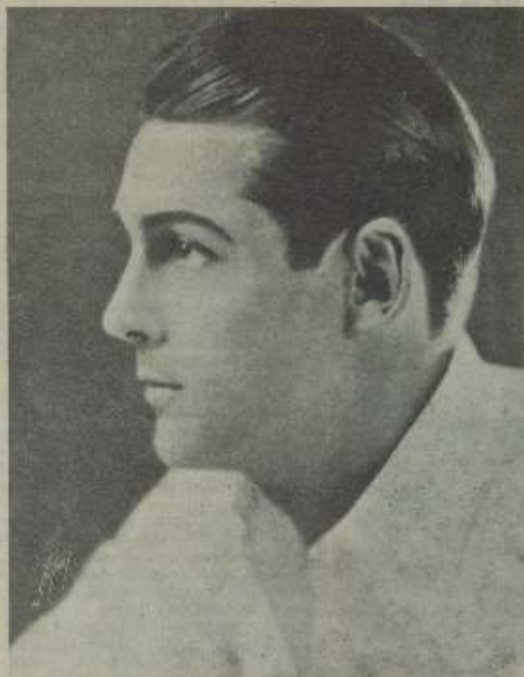
Charles Farrell, que ha ascendido a la categoría última entre los artistas de la Pantalla por su creación en El Séptimo Cielo