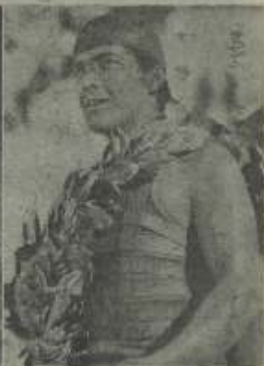
El colosal actor hispanoamericano, único en su clase, Ramón Novarro en tres bellas escenas de la magna obra "Rom-Rom"