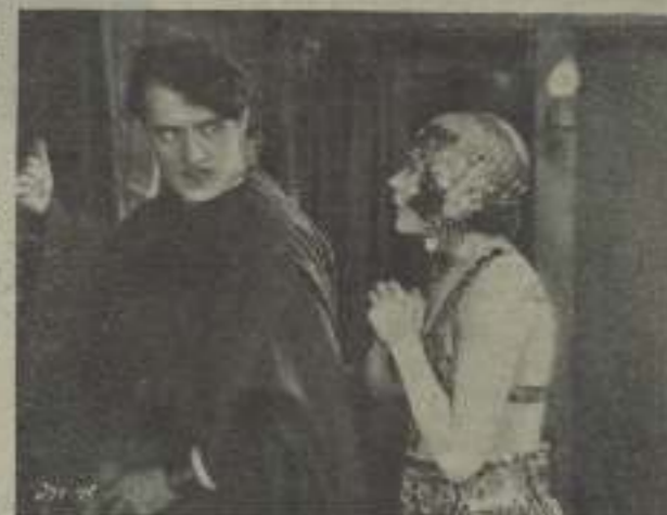
La cosa se pone grave en esta escena de "El palacio de las maravillas"