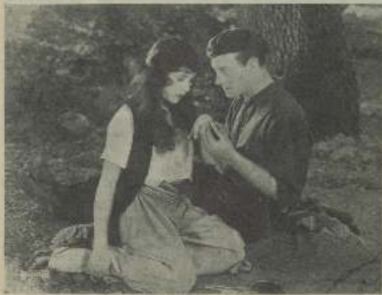
En momento supremo, que muestra a los dos de "En su lugar detras"