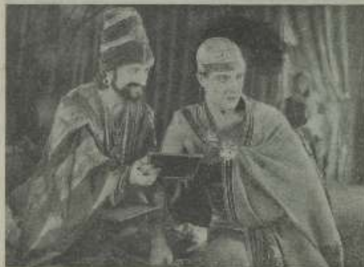
Ramón Novarro en una solitaria escena de «Ben Hur»