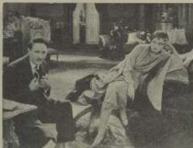
Greta Garbo, la gran estrella de la pantalla, en una escena de la gran producción La Tierra de todos .