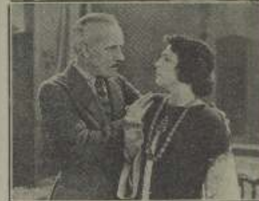
Illegible caption for the image of the couple.