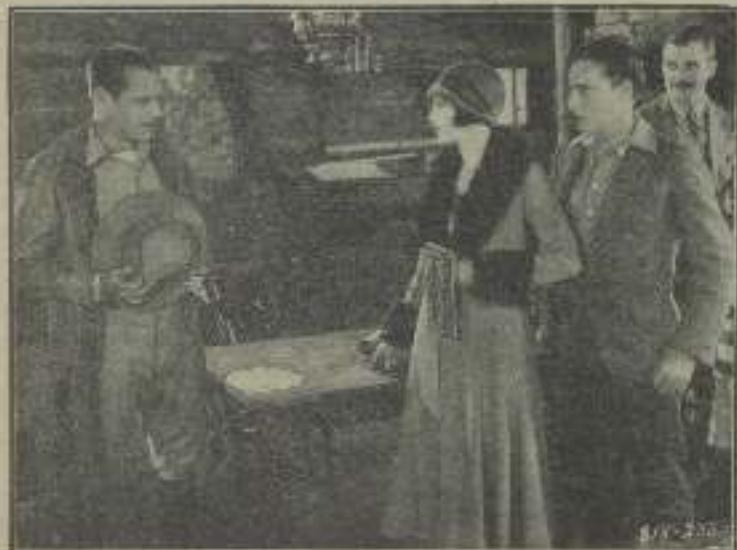
Illegible caption for the image of Jack Holt.