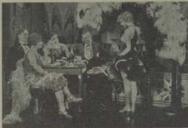
Una escena de Crime and Punishment, en la que se puede admirar alguna buena forma

El casamiento de Francis X. Bushman y Beverley Bayne fue una sorpresa y un sobresalto para el público que no podía admitir a la joven Beverley convertida en esposa en destreza. Francis tenía un hijo mayor. Hu-