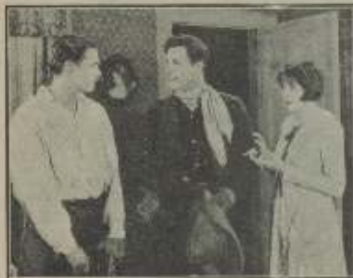
Una escena de velos muy corriente, que aparece en Promises in Prison