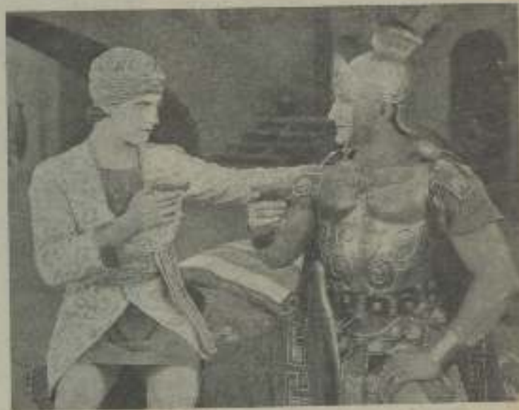
Ramón Navarro en dos escenas de "Don Quijote"