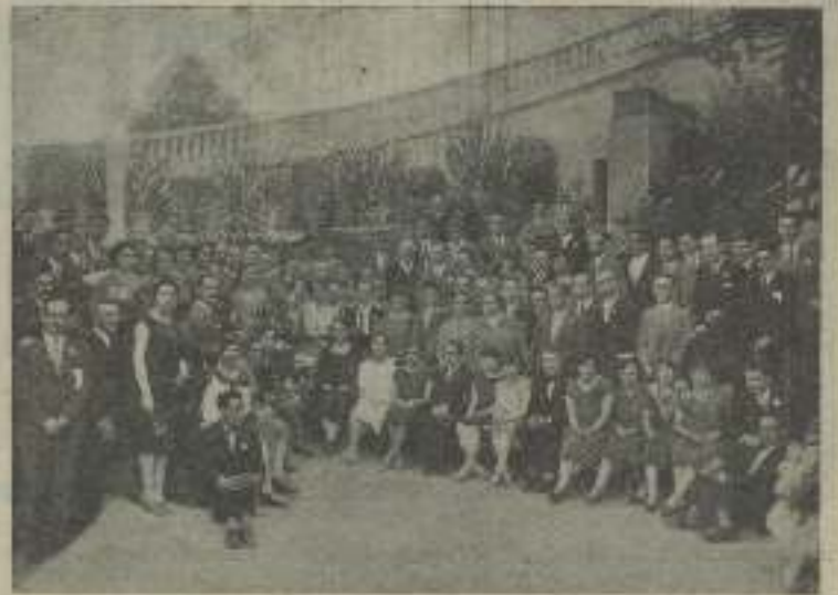
Illegible caption for the image of the group of people.

La información acerca de Lili Damita la publicaremos la próxima semana.