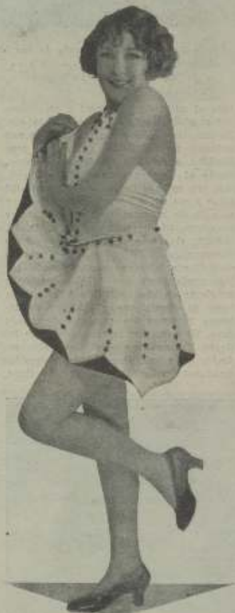
Vale d'Abel nos revela picarones, delirios y exaltados

El Gobierno americano ha declarado ilegal el sistema de distribución en block que afecta la Paramount. La decisión definitiva sobre este asunto es de entera trascendencia.