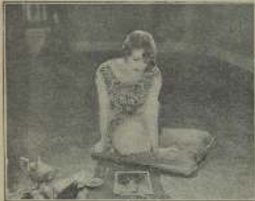
Illegible caption for the first image.