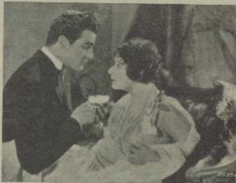
Norma Talmadge, la protagonista de Kiki en una escena de Margherita Gautier

Kiki encuentra ese Príncipe, con malicia inocente y candorosa lo conquista. Y el Prin-