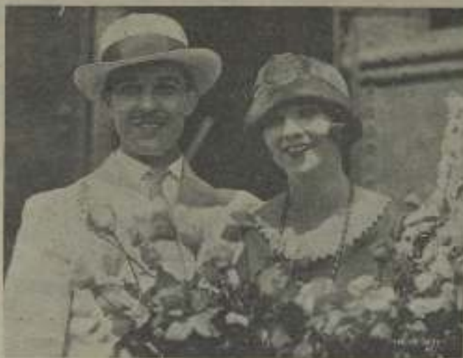
Ramón Novarro en el momento de dar la bienvenida a Alice Terry, durante su última estancia en Hollywood

El cinematógrafo, a pesar de su precario curso, sus innegables progresos y su brillante porvenir — justo es confesarlo — se mantiene todavía hoy en el rango de las artes útiles, en la categoría de un tratamiento genuinamente popular, adaptado