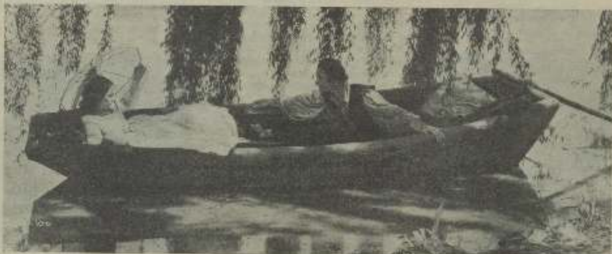
Juan Gilbert y Eleanor Boardman disfrutando de la poesía de un bote, en lago y un espléndido sol en una escena de El Caballero del Alamo