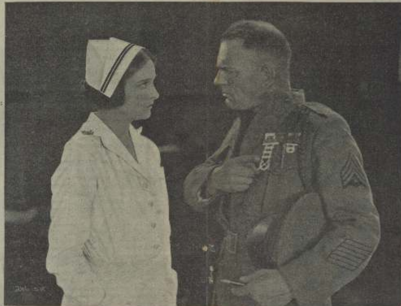
Illegible caption for the large central image.