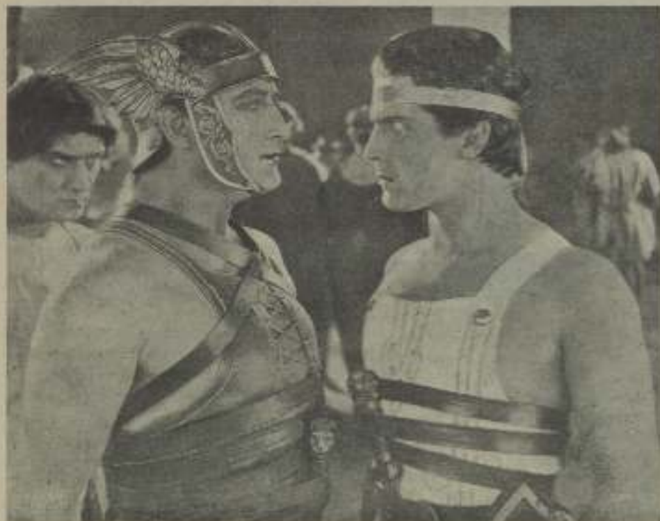
Ramón Novarro y Francis X. Bushman, en una interesante escena de "Don Quijote"

Todas las compañías productoras de films de los Estados Unidos poseen sus locales propios y espero que la comisión volverá atrás en su acuerdo.