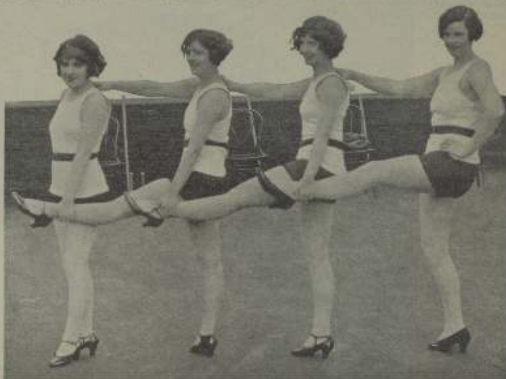
Cuatro bellotas de las muchachas que aborran todas las películas cómicas de la Fox, que son la mejor de lo mejor.

una encantadora novela de amor y aventura, cosas extraordinarias. Mucha comedia brillante también. Estoy segura de que gustará. El carácter principal, además, es claro y bien delineado. Esto le hace muy agradable. Quiero decir, que me gusta ser muy en regla que le doy a una la oportunidad de verdaderamente crear una per-