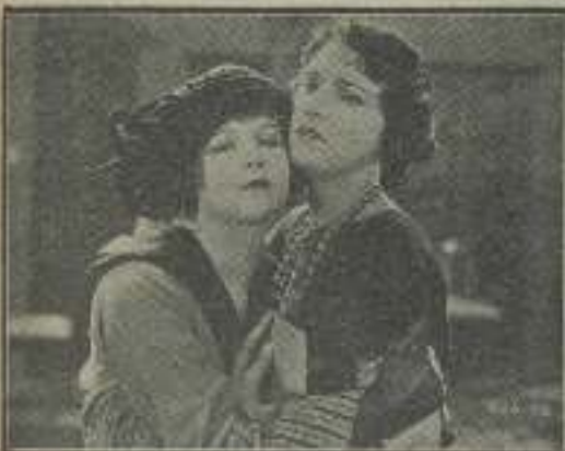
Illegible caption for the second image.