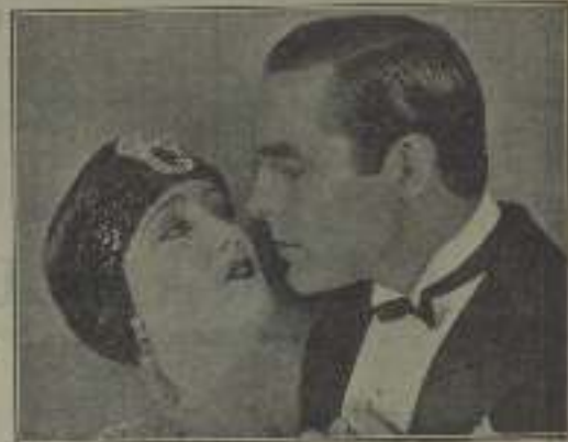
Illegible caption for the image of the couple.