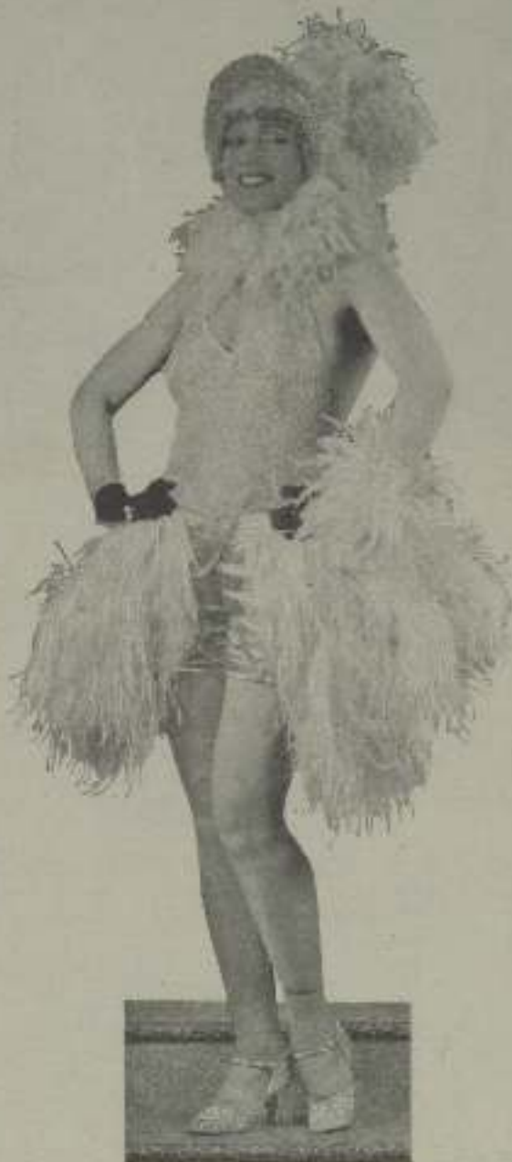
Lita Gray te está diciendo, lector, que hoy un Parelato tarrañal en muy lejos de ti

Un prestamista. — «Hola, amigo, ¿qué tal, cómo te va el mundo? «(La botella de un cigarrero de oro con iniciales de brillantes)».