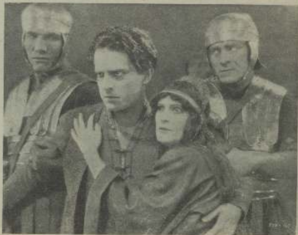
Ramón Novarro demuestra su furioso celo en esta escena de "Ben Hur"

de la vida de Ramón. fuera del estudio, transcurre apacible y serena, como la de un monje. La música y el canto consu- men el tiempo que el estudio le deja a libre y jamás se le ve en los "parties" o reuniones de los otros artistas. En reali- dad, él vive como al margen de la vida tumultuosa y estridente de Hollywood, la cual conoce menos que cualquier profano. Su pasión por la música y el canto revie- le los caracteres de un verdadero culto. Hablando recorrido muchos países, ha le- vado reunir una colección de canciones populares francesas, italianas, alemanas, españolas, rusas, cubanas, mejicanas, etc., que es, acaso, la más selecta y numerosa