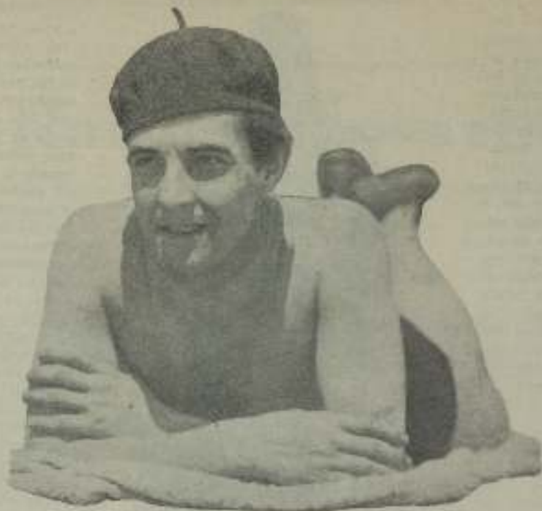
Ramón Novarro descansa en la playa del ardor trabajo de la semana

varto trabajaba por aque- llos días en un pequeño teatro de Hollywood al que asistían con frecuencia ar- totes y directores del ci- nematógrafo. Desempeñaba el papel principal en una farsa titulada "The Spa- nish Landango" y tuvo la suerte de que una de las noches se encontrase entre los espectadores, Rex In- gram, el gran director del Metro Studio. Ingram con- sideró en seguida las po- sibilidades que este joven cita aún subsiste en su vida y al día siguiente tuvo lugar la cita por cinco años anhelada y pacien- temente esperada. Tal fue la clara visión que Rex tuvo del talento artístico de su nueva estrella, que le con- cedió inmediatamente el tan portante papel de Director de Escenas en "El príncipe, negro de Zenda", la pelí- cula que consagró a nues- tro compatriota.