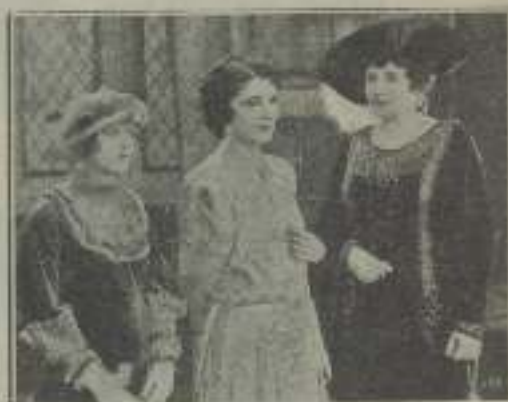
Tres damas no muy satisfechas en No Regrets to My Wife