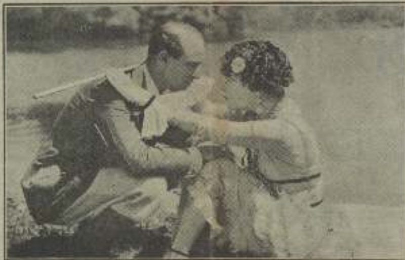
Illegible caption for the image of the woman on the ground.

El padre de Cholo amonesta a la fiera para hacerla aparecer en una película.