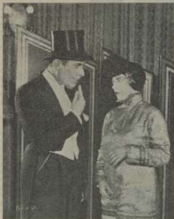
Renée Adoré y Lou Chaney se entienden como pueden en "El honor del Mandarín"

Renée no tuvo una risueña niñez, no supo por mucho tiempo lo que era una muñeca, ni comer golosinas o dormir en un mullido lecho, pero las horas que todo lo ven, han deseado recompensarla, y hoy su nombre está catalogado entre los astros de primera magnitud.