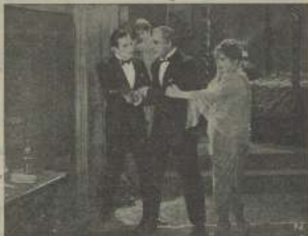
Una escena de "Danza atrevida"