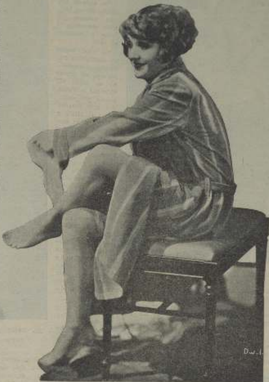
Madge Bellamy, la notable estrella de la Fox, en una escena íntima de la superproducción Saltadores de verano .

Siente la bondad, admira al bien, repudia la bajez.