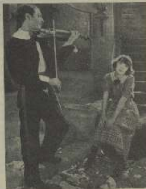
Colleen Moore en "La danzarina rusa"