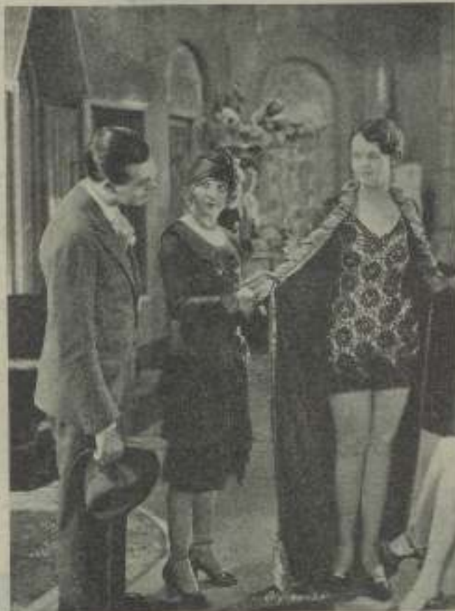
Madge Bellamy no se atreve a decir que hermanita sepa, le gusta mucho, en esta escena de Tablitas piensosas de la Fox.

arriba de su traje de anillo y en cincuenta figuras tan frías, cobré bríos y contesté: «Es sin duda alguna, esta película la menos simpática que he hecho, quiero decir, menos cómoda. Ya tenemos aquí diez días y nos estaremos otros tantos. No me importa mucho el calor, pero el trabajo constantemente frente a esas máquinas de hacer viento, es algo que perjudica grandemente al sistema nervioso. El viento lo sopla de tal manera que sobra y, además, echan una especie de humo para hacerlo más espeso. Hasta la fecha he estado afortunada, porque las chispas que se producen no me han quemado el pelo, sólo algunas me han quemado las manos.»