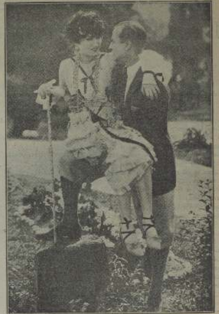
Gloria Swanson en "Zaza"

Ahora que los villanos de la pantalla se han conquistado la confianza del público, el cual no los ve ya como antes despreciables y no necesitan por tanto ser un