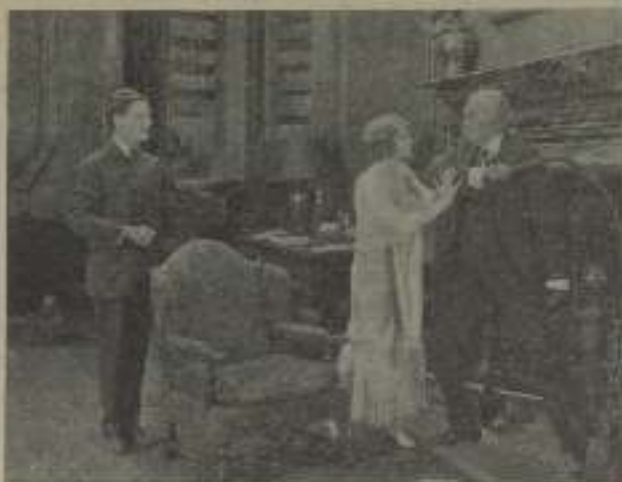
Una escena de "Ladrón en el paraiso"

cuando me comenzaron que era la escogida para el papel en cuestión, por el cariño que le tenía y por haber vivido los últimos momentos de la tragedia que asoló Fran- cía e hizo llorar a tantas mujeres.