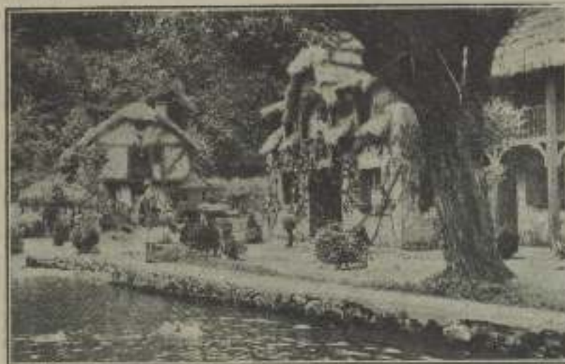
Un bello paisaje que aparece en "Xana"