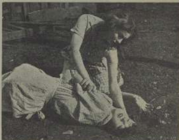
Das interesantes escenas de "Hombres de acero"

de Norteamérica, que se asemeja por la grandiosidad de su concepción, y por la fatigante de su presentación a una epopeya de titanias.