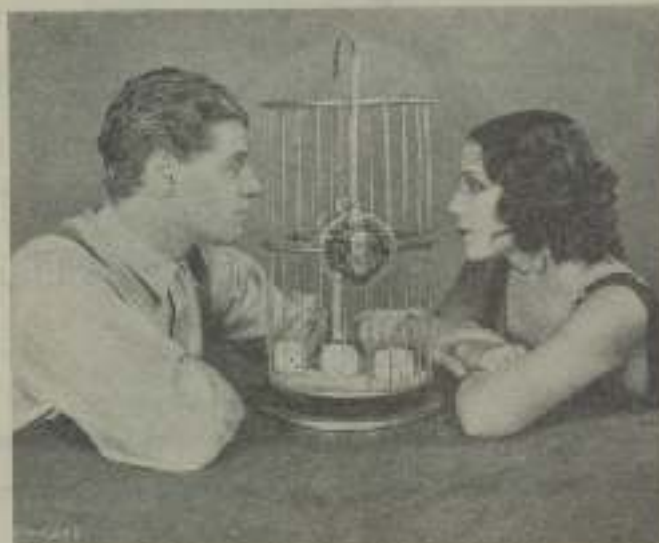
Dolores del Río y Raip Foches, protagonistas de "El coche mágico y otros" de Metro Goldwyn Mayer.

Sonríe y dice que está pronta a contestar a todo lo que le pregunte, con lo que hace gala a una vez más de su proverbial simpática y amabilidad para con todo el