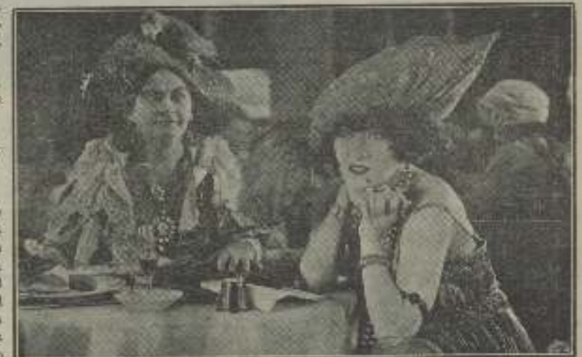
¿Qué mirará con tanta fijez Gloria Swanson en esta escena de "Zaza"?

gran por diez mil, aparecen de cuando en cuando desempeñando los más extraños papeles. Warner Oland, por ejemplo, cuya singular sonrisa le hiciera famoso entre los más famosos "villanos", interpreta a un viejo bondadoso entólogo en la película "Lo que ocurrió a papa", y en vez de hacer de "coco" en la cinta, su papel no puede ser ni más simpático ni más del agrado público.