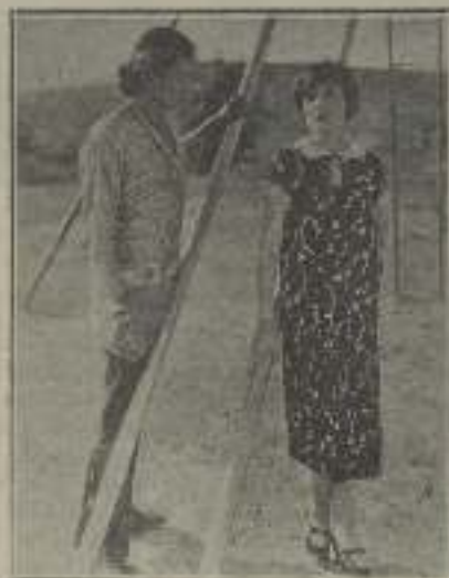
Lola Wilton y Richard Dix, en "El pecado de una cruz"

Una producción nacional selecta sería indudablemente el modo más eficaz de realizar una activa campaña de propaganda española por todos los ámbitos del globo. Se trata, por lo tanto, de una labor patriótica de verdadera trascendencia.