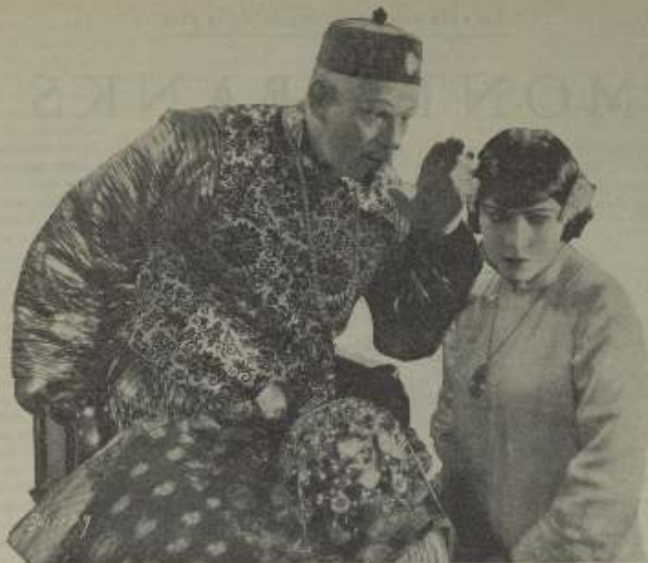
Lou Chaney, el hombre de los cien curus, y Renée Adoré, la gentil francesa, convertidos en dos súbditos de la colista republica, en una escena de "El honor del Mandarín" de la Metro Gallespa Mayor

la cinematografía. Un mundo enteramente nuevo para ella.