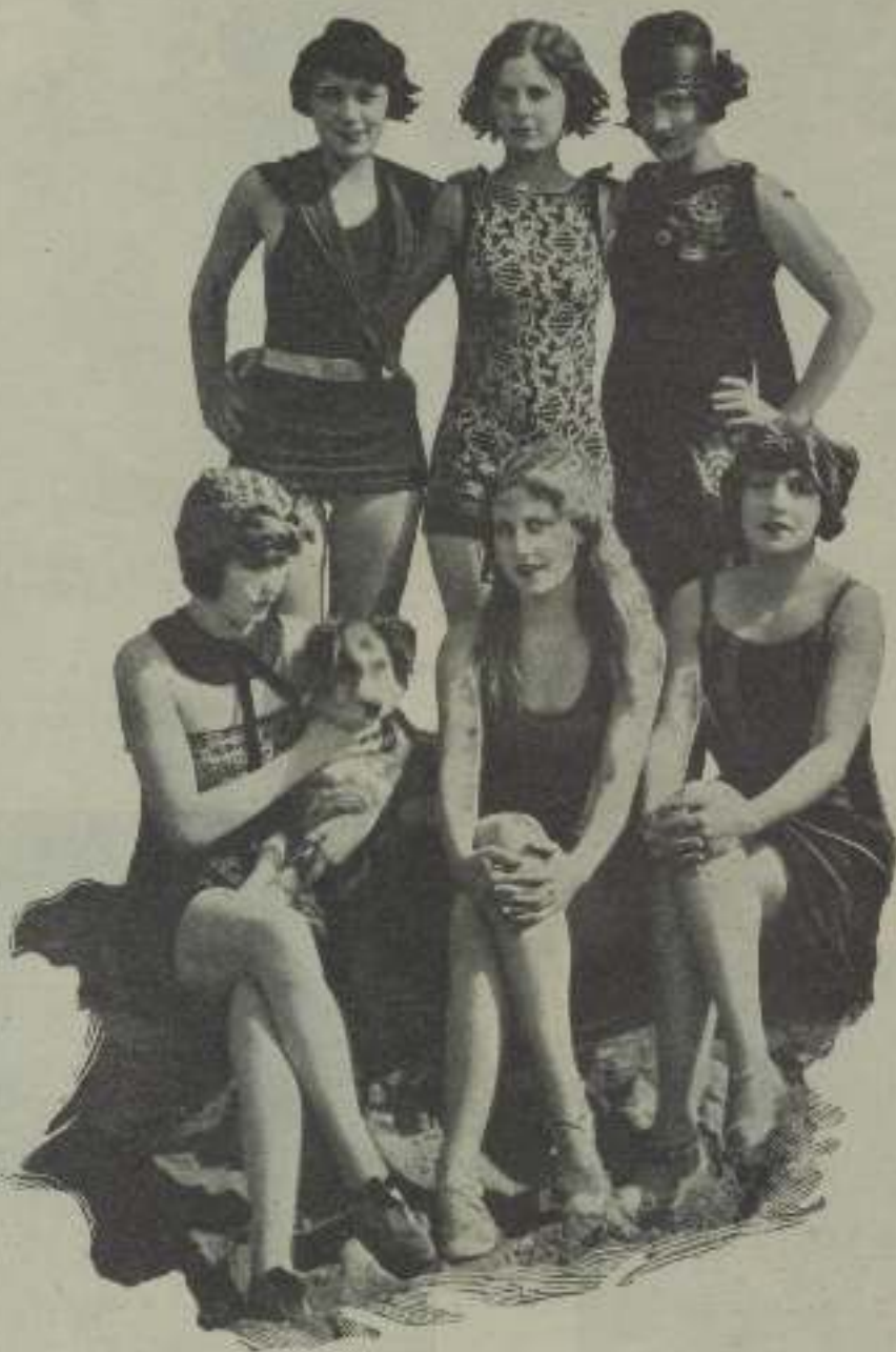
Seis encantadoras niñas dispuestas a combatiros con el primero que se presenta

Sus esfuerzos empezaron a ser coronados por cómodas ganancias en metálico. Se asoció entonces con Warner Brothers para