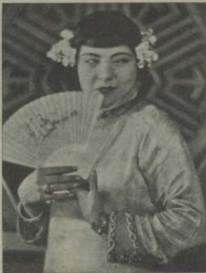
Nadie удивирaría que esta risueña china no es otra que Renée Adoré en "El honor del Mandarín"