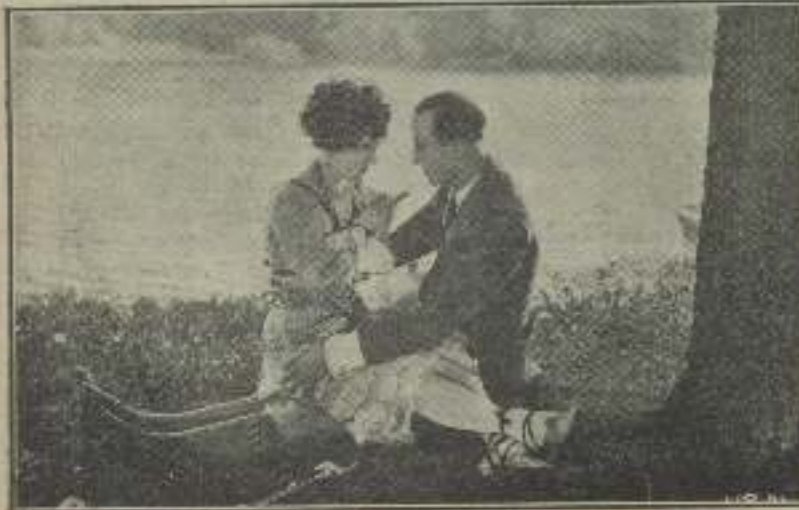
Todo invita al amor y a la poesía en esta escena de "Zaza"