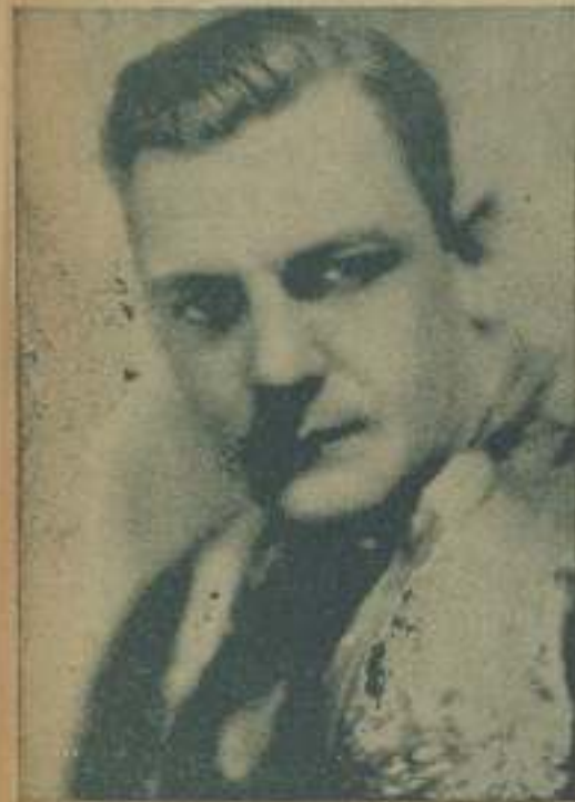
CHARLES ("BUCK") JONES