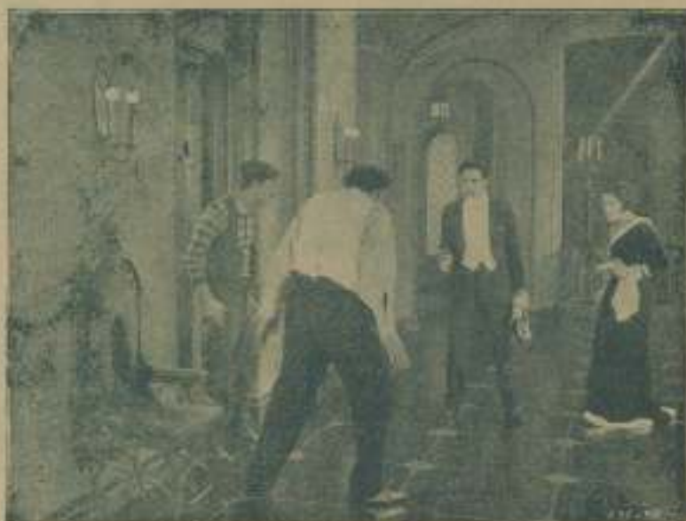
Una bella escena de "Zora, la mística".