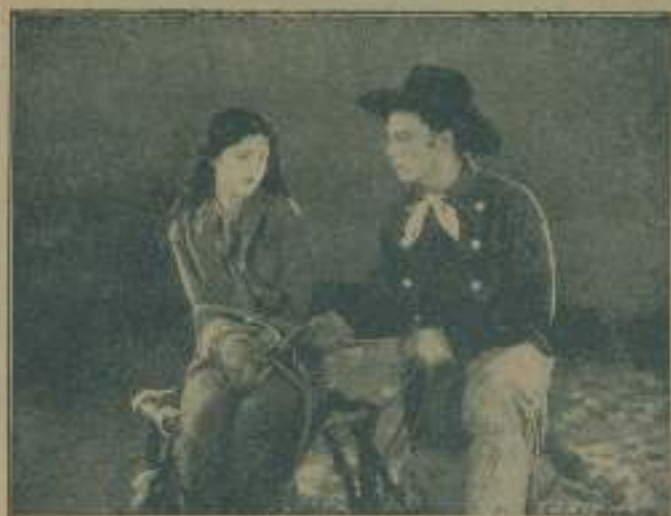
Olive Borden y George O'Brien en un momento interesante de "Tres hombres malos"

Desconocido, Barcelona. — Cuida uno es dueño de decir y apreciar lo que le parece sobre diferentes artistas, aunque la