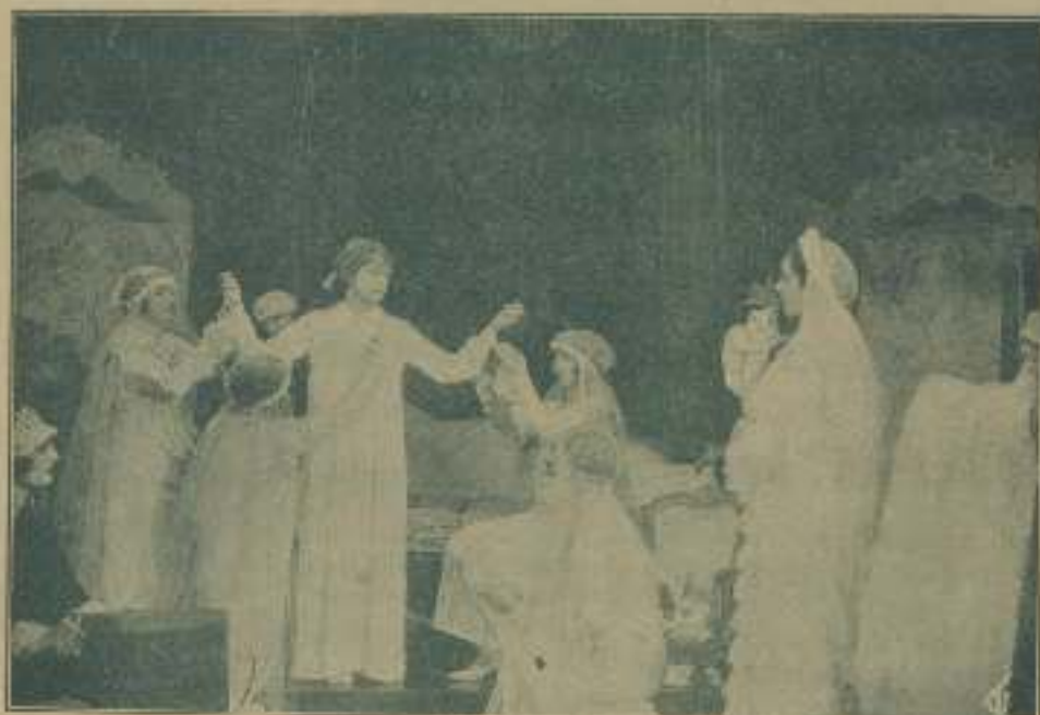
Momento sublime, el estudio de una mujer es más de las escenas más hermosas de la magnífica cinta "El sueño de un país".

EL CINE lo confeccionan verdaderos entusiastas del Arte Mudo y solo es el secreto de su éxito