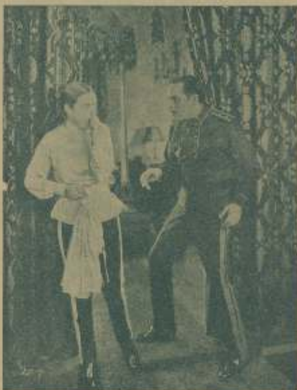
Una escena de «Su Alteza el Príncipe»

Los chicos dedicados a la venta de caramelos en el cine, son discretos en grado superlativo. Ven, oren, huelen,