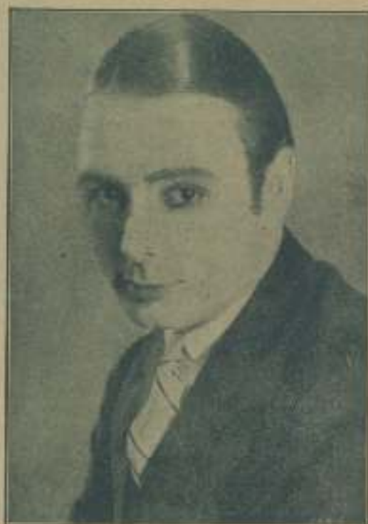
GEORGE K. ARTHUR

como es lógico, y sería invertido en la formación de un completísimo almacén de decorados, muebles, alfileras, guardarropa y hasta si fuera conveniente, este detalle sería a estudiar, de aparatos de impresión, positivado y laboratorio.