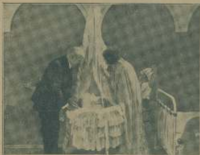
Un bello momento de la penúltima película "Deben tener hijos los pobres".

lencia. Así, ni la madre ni el hijo son fundamentalmente malos, aproximan-