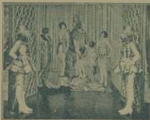
Una escena de la película "Montecarlo".

«el eje de la acción, no hay nada que justifique la actitud embrayada de la madre en su defensa. Después del patricidio, toda noble actitud es solo expiación, y el martirio deja de ser martirio para convertirse en sanctón o peni-