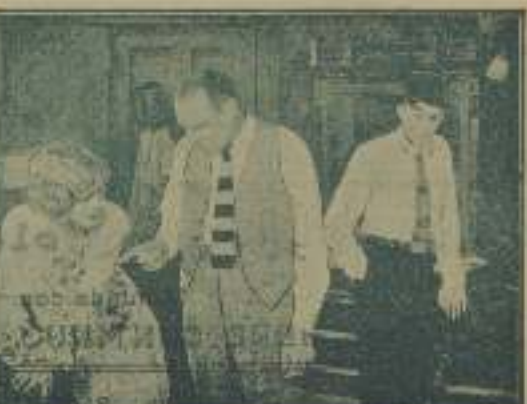
Interrogantes escenas de "El que no corre, truca".