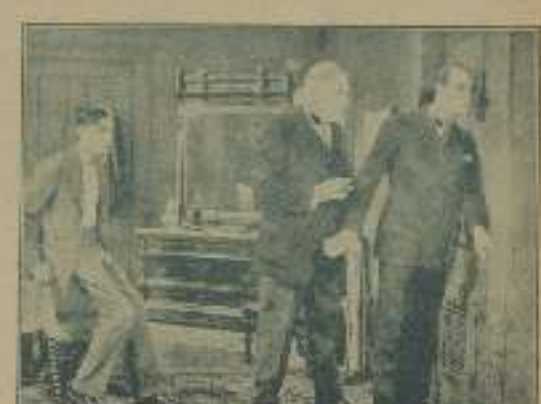
Emocionantes momentos de "El que no corre, truca".