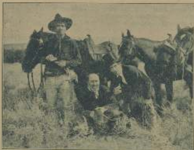
Una escena de «Tres Amores más».

por tres años irá a cobrar a otra parte.