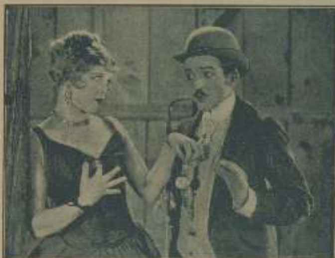
Escena nueva de «Tres Amores más».