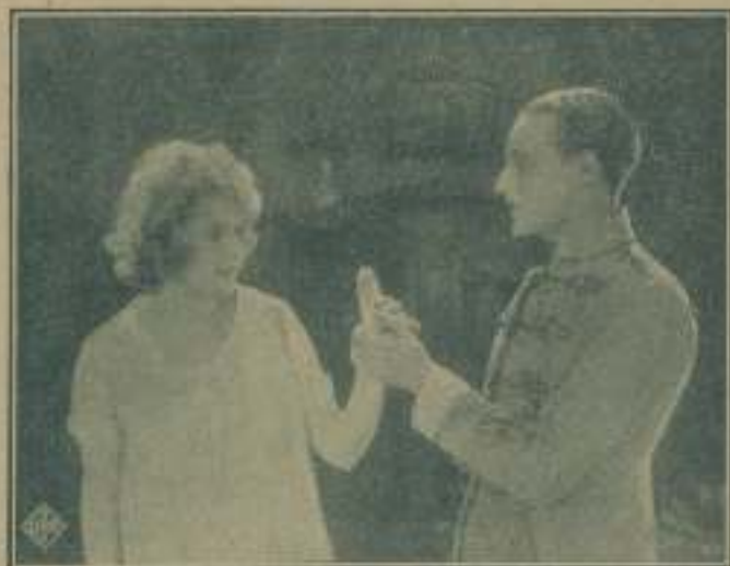
Los cuadros que son un poema, y también dos simpatísimas escenas de la hermosa producción "El sueño de un calé".