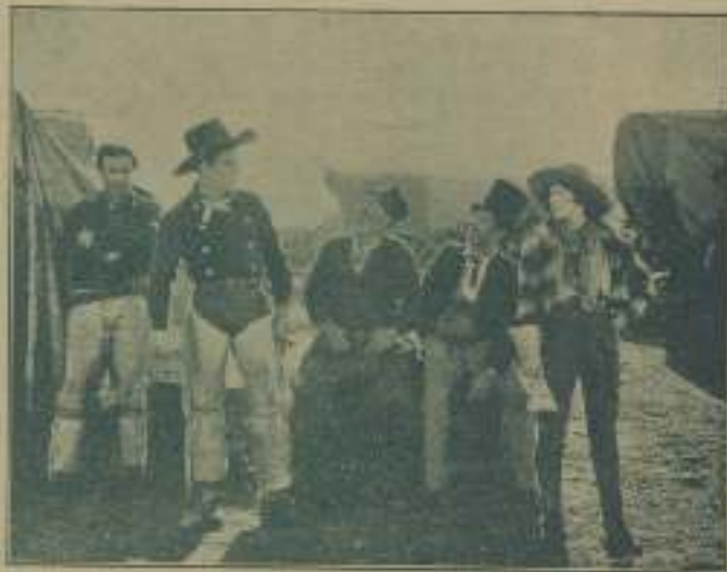
Interesantísima escena de "Tres hombres en un cuna".

Lo que me interesa descubrir es por qué esta adoración a un us del cine por cientos de miles de muchachas anglosajonas se concede tan generosamente a los galanes latinos y se rehúsa a los de su propia raza.