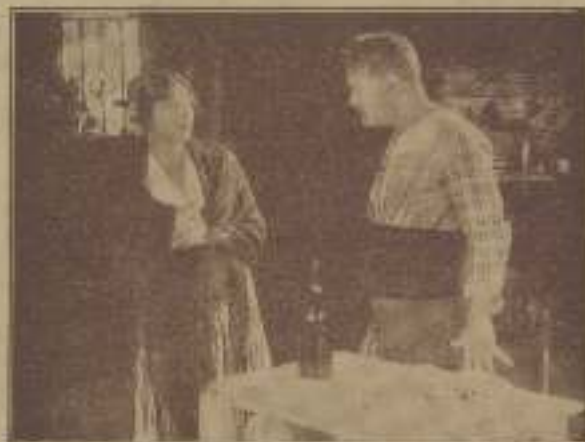
Emocionante escena de "Matrimonio"