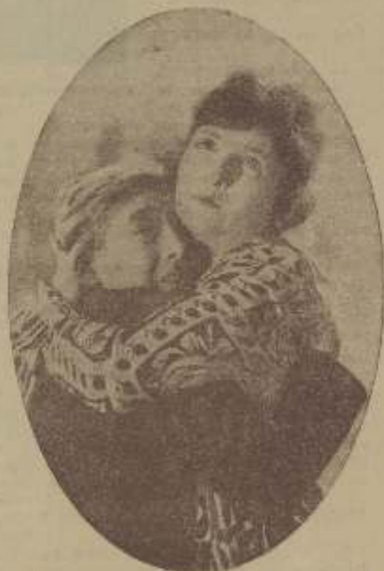
Este momento de la evolución de películas "Sin Puntos"

La Universal ha obtenido un beneficio de 1.968.689 dólares durante el año 1926, contra 1.365.506 en 1925.