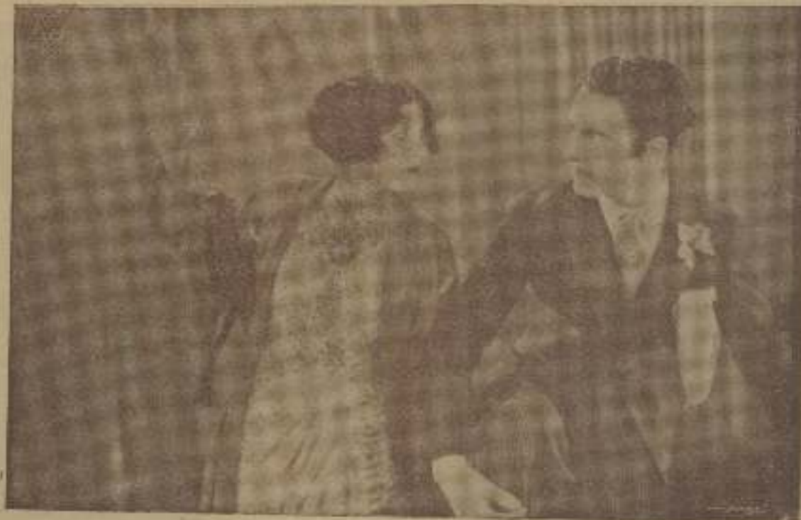
"¡Sin vergüenza! ¡Qué atrevida!", vocifera Olive Borden en esta escena de "Historia de perra"; pero si piensa por sus aventuras, ya se convencerá de que las de haberme ellas.