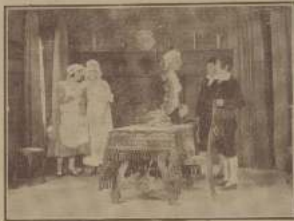
Interesante escena de «El médico a palos»

lo menos, la ventaja de estar siempre ocupados. De ellos, Los de Córdoba muy bien, a sí como los señores Graeco, Infante y Alcaraz.