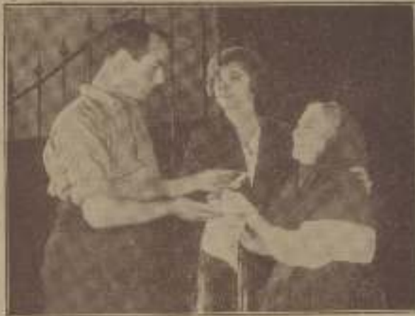
Otra interesante escena de «Malacology»