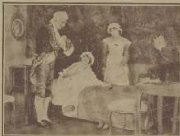
Última escena de «El médico a palos»

Pathé y Capitol Cinema. — «Doctor, no apriete usted», Fox. — Nuevamente Tom M'Alha querido saliera del género vaquero, y el resultado ha sido un completo fracaso, pues además de que él no sabe trabajar fuera de su estilo característico la película está plagada de absurdos y contrasentidos por ejemplo, ¿qué razón hay para que un muchacho enfermo, que se cura en su casa a tirar el blanco, lo haga con pantalones de montar y guantes, y, además, que no =