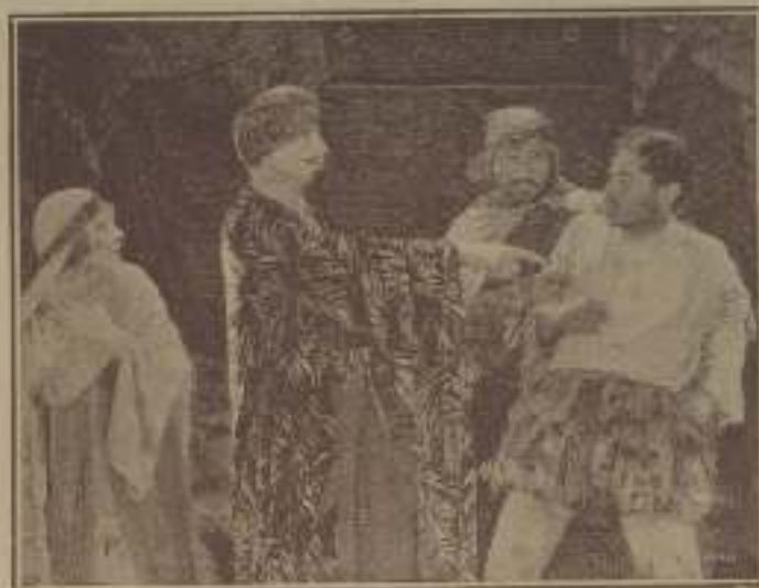
Arrogante y bella escena de la Arrogancia película "El pueblo de los marcos".

Cortez y Pola son una combinación que promete en la próxima película "Confesiones". Pola Negri parece recibir mucho trabajo bajo la dirección de extranjeritos y debe ser muy buen director para ella el joven Lothar Mendes, que tiene gran variedad de ideas y aspiraciones de llevarla a la pantalla.