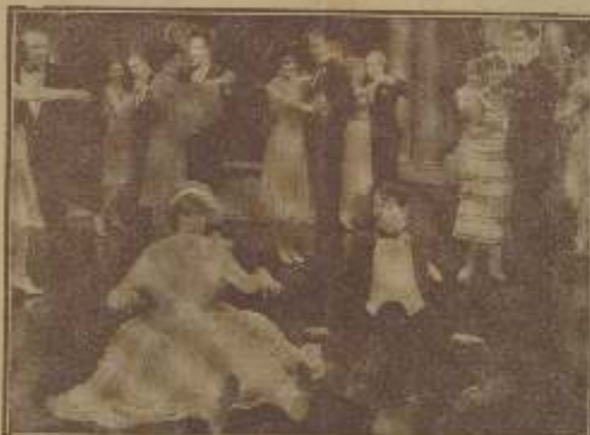
"Lloréas de carnos" se hizo la película una escena publicitaria, y a la verdad que bien merecían el mérito.