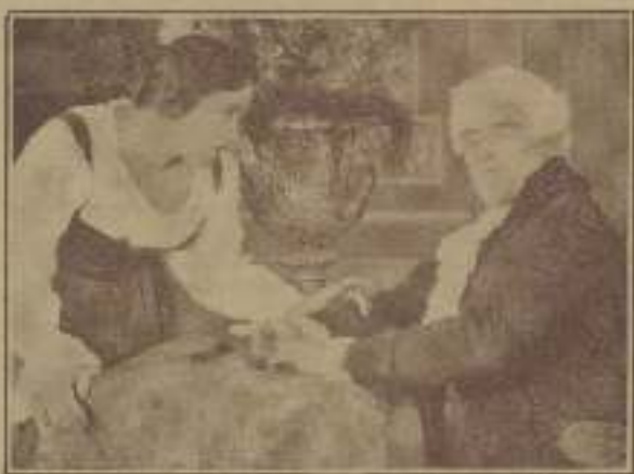
Picaresca escena de "El médico a palos"