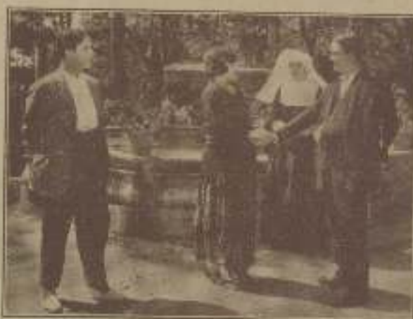
Suposición escena de «Malesones»