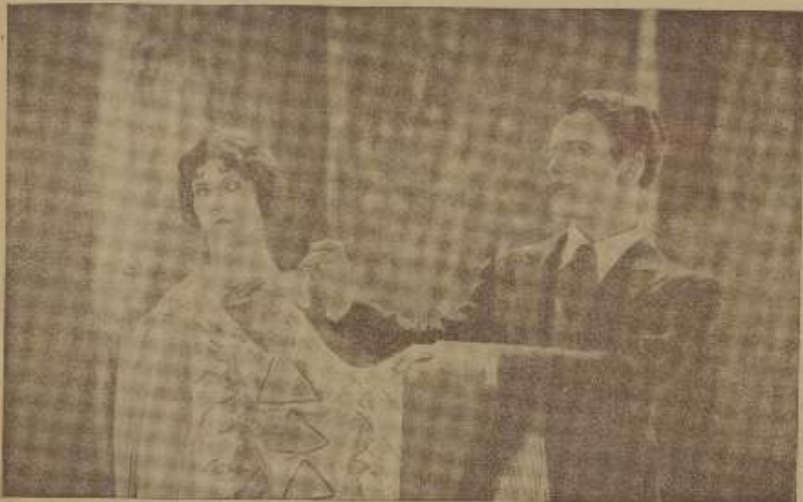
"Historia guapa", dice para sus aventuras Olive Borden en esta escena de "Historia de perra". La cantidad femenina se temen... No hay nada que lo daña.