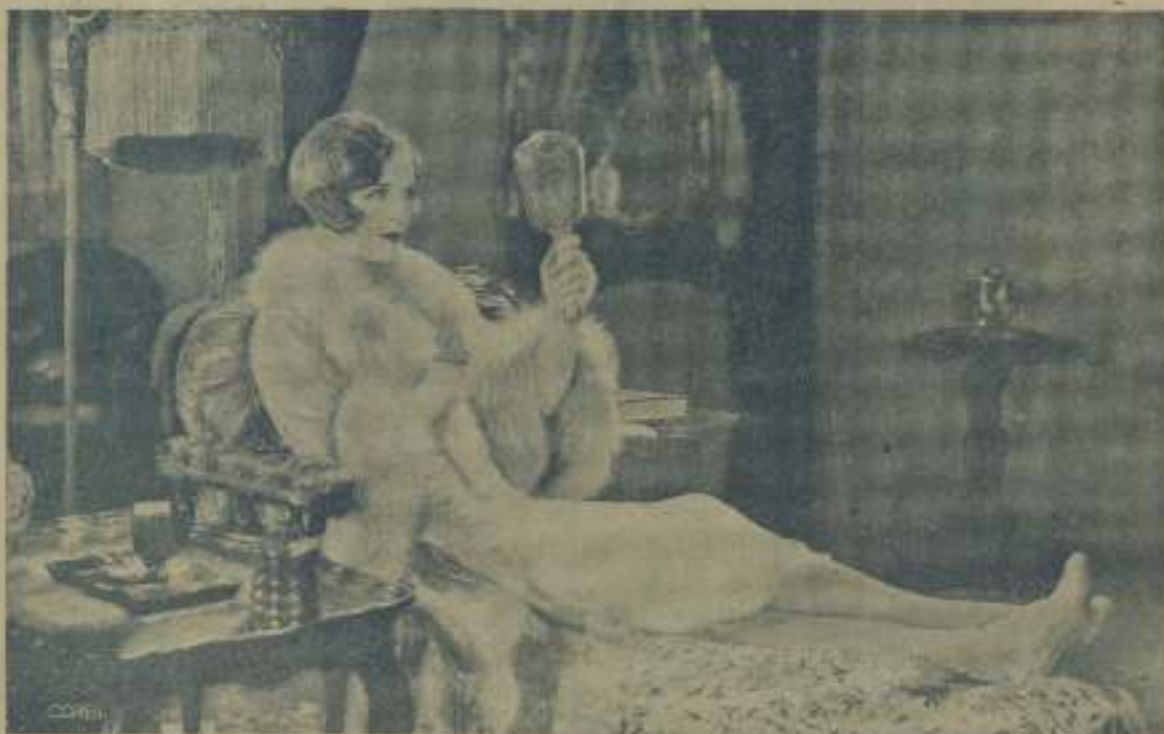
¡Siempre la vanidad! Un espejo para una dama, es lo mismo que para nosotros una mujer; la buscamos, la tenemos, renegamos de ella, y otra vez a empezar. La bella dama de la fotografía aparece en "Folias de parral", en esta misma forma.

Mr. Lasky ha aplazado las pruebas, a fin de que el muchacho descanse y se le asienten los músculos. El interesado, por su parte, dice que fuera de su leve cansancio, se siente encantado de la vida.