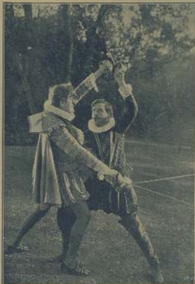
Otra fotovisualizante escena de "El perdón de los reyes".

Junto a esta distinción, que tiene a pre-