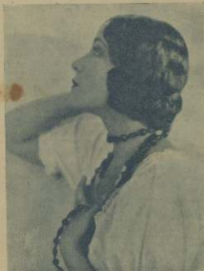
DOLORES DEL RIO