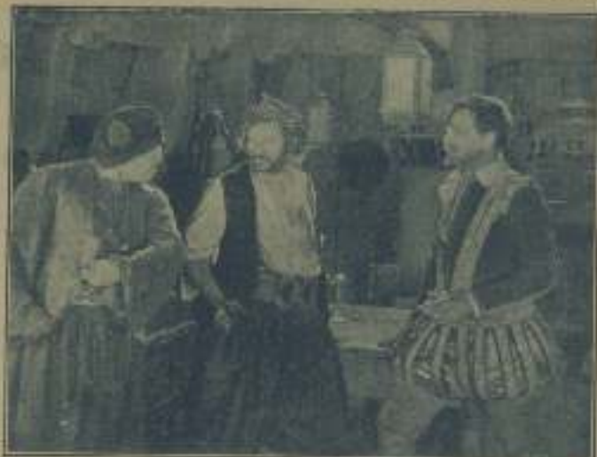
Otra escena de "El golem de los merca"

De Nueva York llegan rumores de que Gloria Swanson considera que trabajar en películas propias exige mucha más tensión de lo que ella esperaba y que se propone, una vez terminada una película que tiene pendiente, volver a la Famous Players Lasky.