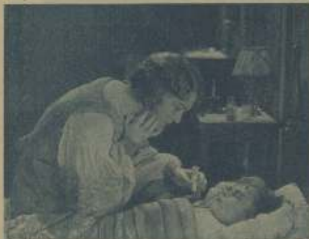
Una escena de "La mujer que supo amar"

Mi vecino de asiento regresa del restaurante después del almuerzo, acompañado de otro viajero. Este hombre es pequeño y estrimado. Viene con una elegancia extraordinaria y habla con movimientos nervio-