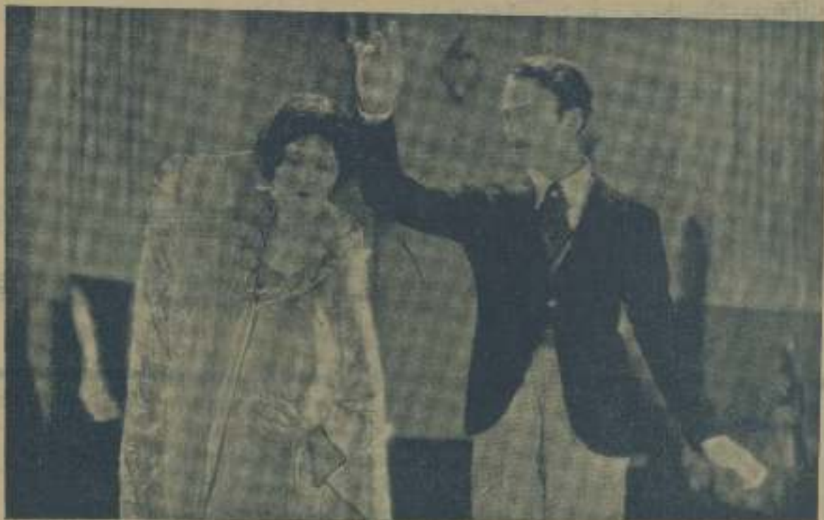
Para convencer a una mujer, nada como los vestidos. La prueba. Mien fiell es de ver en la fotografía que antecede a estas líneas, que pertenece a "Hijas de perla".

Pola Negri tenía muchos deseos de ser síla la protagonista de la novela de