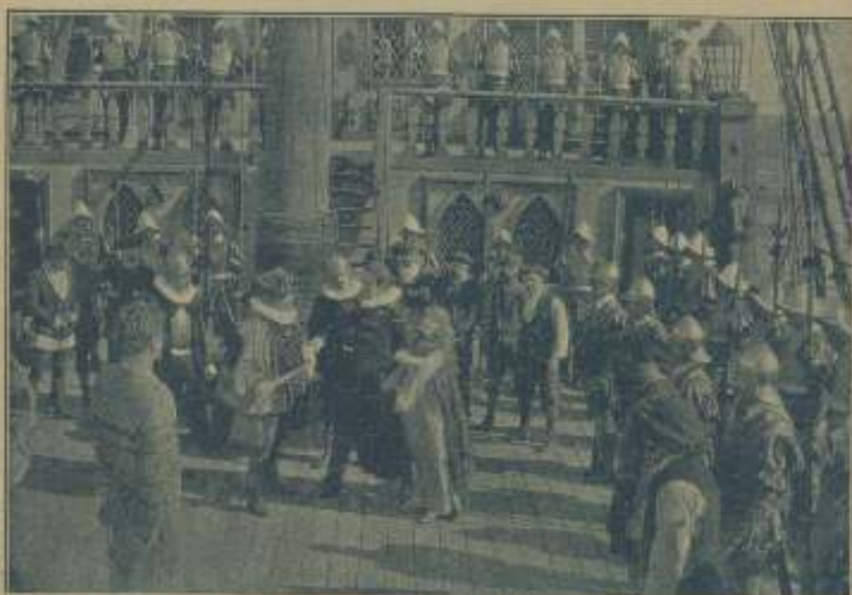
Una escena de "El mundo porfiño"

Creemos que juzgas los comentarios, y además nos parece que al público, cuando demostren un desconocimiento tan grande de las cosas, debe abstenerse de hacer comentarios, pues el que está a su alrededor, no puede menos que reírse de semejante pretensión de estar enterado de todo y de sus aires de gente sapientísima.