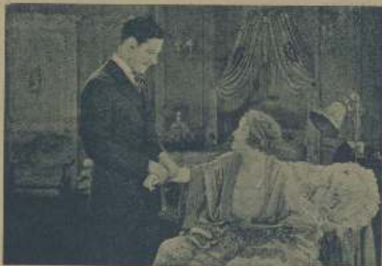
Edna Purviance, cuyo nombre, con el protágonista del desconcertante Chaplin, aparece ahora en los pe ródicos, en una escena de "Una mujer en París".

ne nada que ver con la afición de la bñlica seña en a la care de cubetas, de lo cual ha de alegrarse mucho el amigo Walter Pidgeon, que trabajará en esa película con Alma Rubens sabedor de que no perderá la suma, a menos que ésta se empeñe.