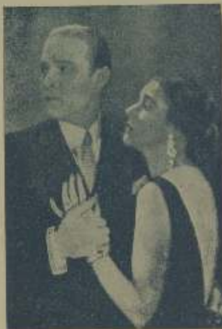
Rodolfo Valentino en una escena de "Cuba"

El público ha decidido no admitir a los grandes "espectáculos" cinematográficos que a cambio de unas cintas desechables,