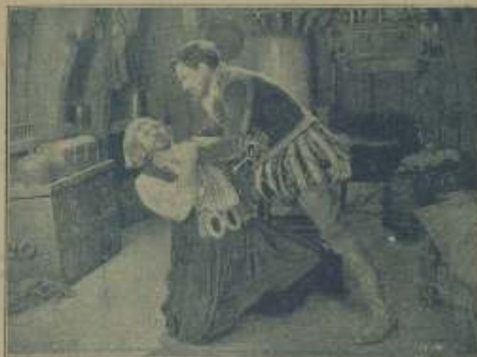
Una escena de "El jardín de las maravillas"