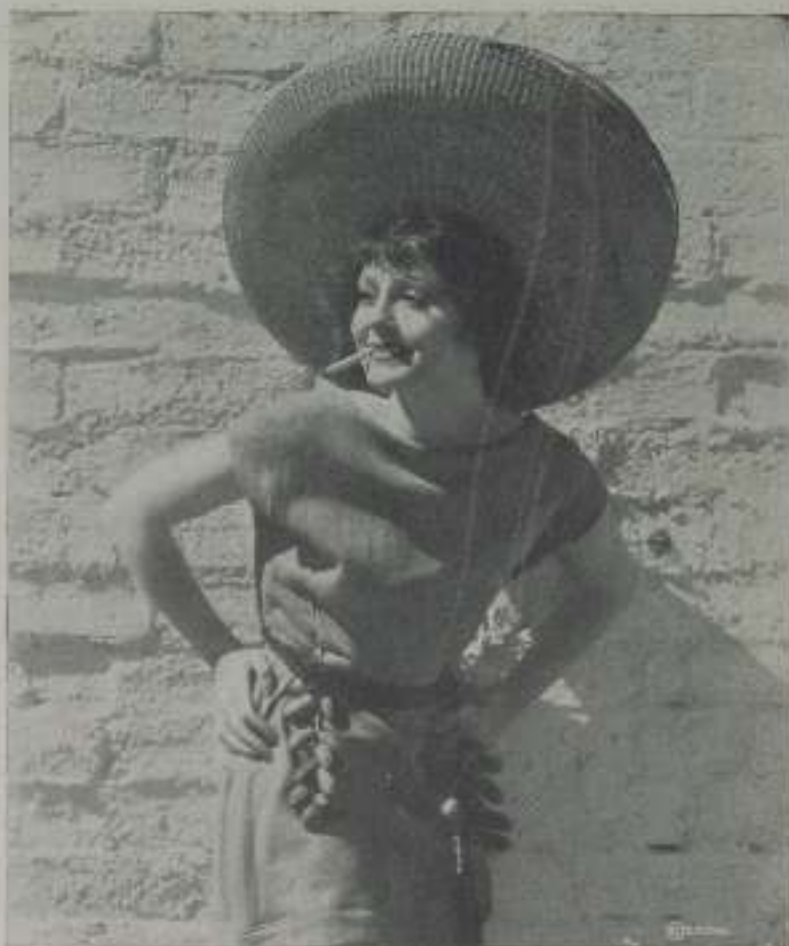
NANCY CARROLL, gentil estrella de la Cifesa, se siente perfecta mejicana en esta foto

△ Douglas Montgomery ha regresado de Nueva York donde tuvo oca-