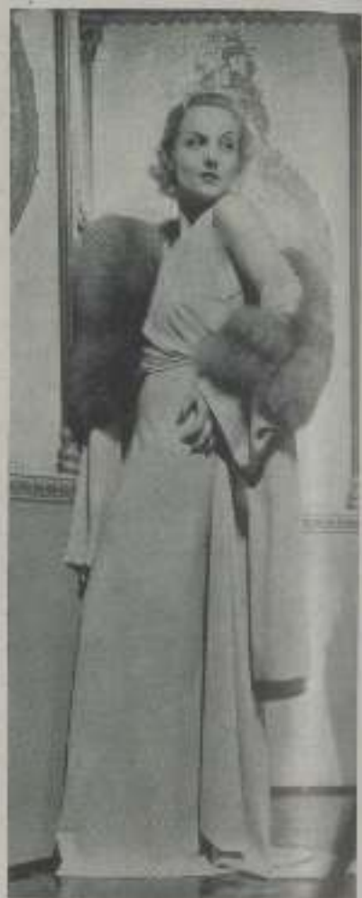
Elegante y distinguida, CAROLE LOMBARD es admirada por el público

mente con su vida. Brilla entre las multitudes. Las personas le son muy simpáticas.