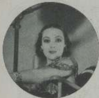
DOLORES DEL RIO, de la Warner