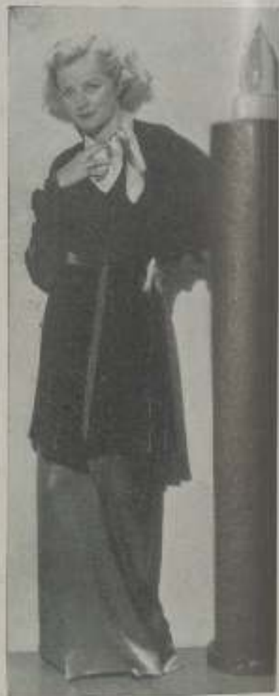
EVELYN LAYE, una criatura muy agradable y elegante en grado sumo.

— ¿Es una reunión de solteras? — le pregunté a boca de jarra.