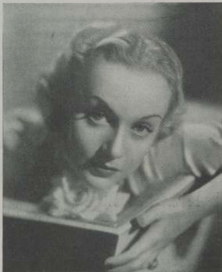
CAROLE LOMBARD, la exquisita actriz de la Paramount, que en la vida particular dista mucho de ser como la vemos reflejada en la pantalla

Pienso que solamente hay una Carol, y es aquella que se deja ver raramente por el lado de la verdadera Carol, tal como se presenta en su última en la cual dice: "Yo sé lo que quiero, pero no lo puedo conseguir". Y con una sonrisa valiente continúa: "Tomaré las cosas como mejor me vengan". Y yo creo que es lo que está haciendo exacta-