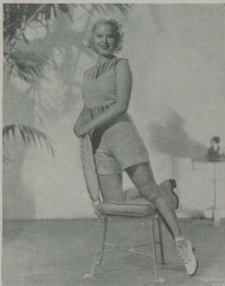
MARY CARLISLE, de la Metro, espléndida belleza de atractivos personales que hace la maravilla de sus piernas bonitas.

Las solteritas de Hollywood, esas muchachitas atraentes que causan nuestra admiración con su belleza, cuyas vidas particulares tanto desean conocer los aficionados, son unas mujeres tan atractivas fuera de los estudios como representan en la pantalla.