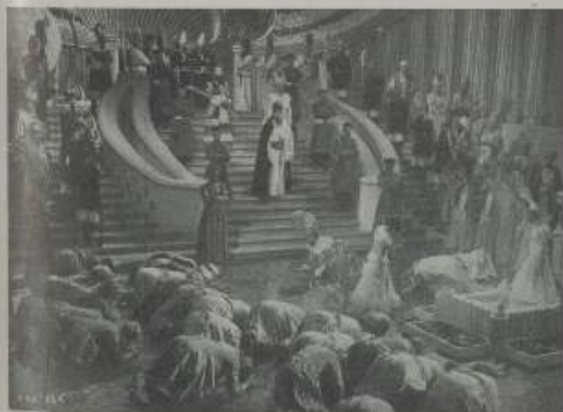
Una escena de "Chu Chin Chow", que ha obtenido gran éxito

sión de hacer la corte de nuevo a la encantadora Lois Moran que no está dispuesta aún a regresar al cine.