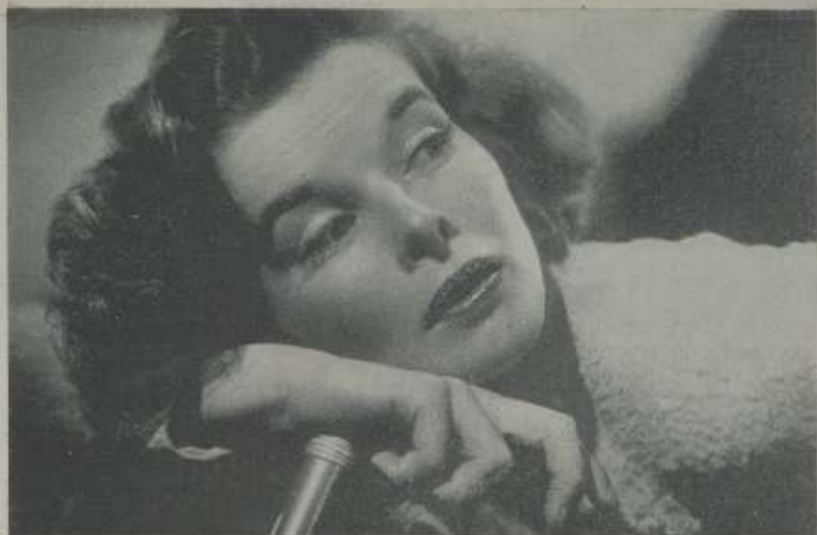
KATHERINE HEPBURN; la genial actriz de Radio Film, uno de los valores más firmes de la cinematografía americana.