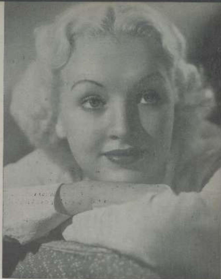
BETTY GRABLE, guapísima estrella de Radio Film, que la veremos brillar con esplendor en breve

Cuarenta años ahora hace que Lumiere consiguiera la primera proyección de imágenes: cuarenta años que las imágenes se proyectan con movimiento y en ese transcurso de tiempo, ¡cuántas variaciones ha sufrido el primer invento!