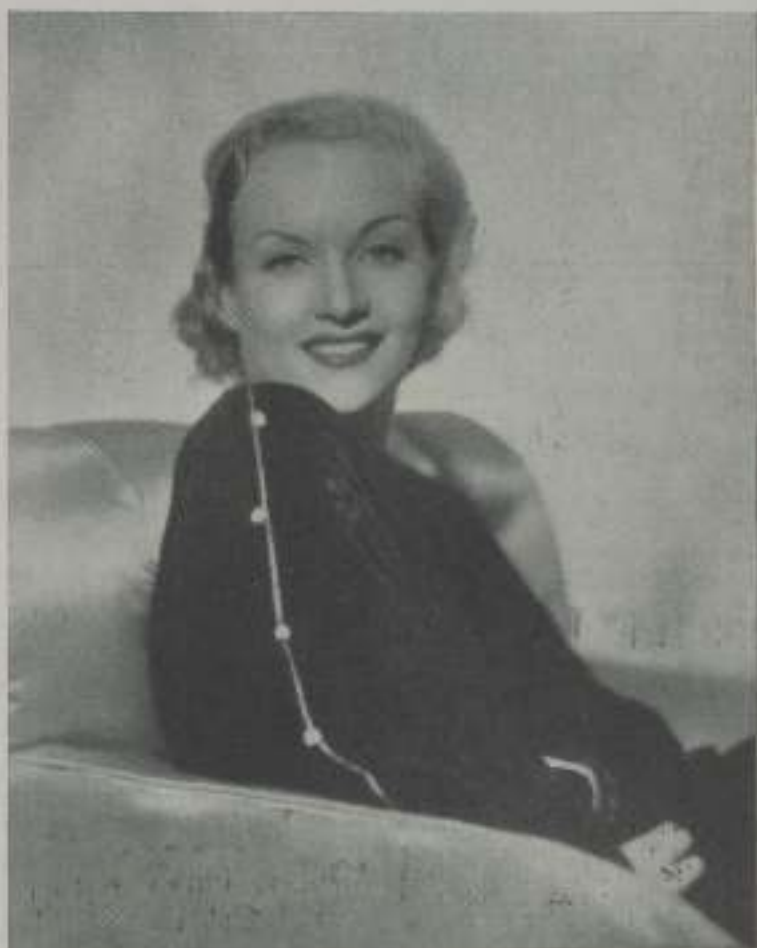
La sonrisa de CAROLE LOMBARD es un enigma. No sabemos si corresponde ya a la pregunta que van a hacerle o es complacencia a lo que se le ha dicho.

"Yo sé lo que quiero, pero no lo puedo conseguir, conque me tendré que conformar y tomar las cosas como mejor me vengan."