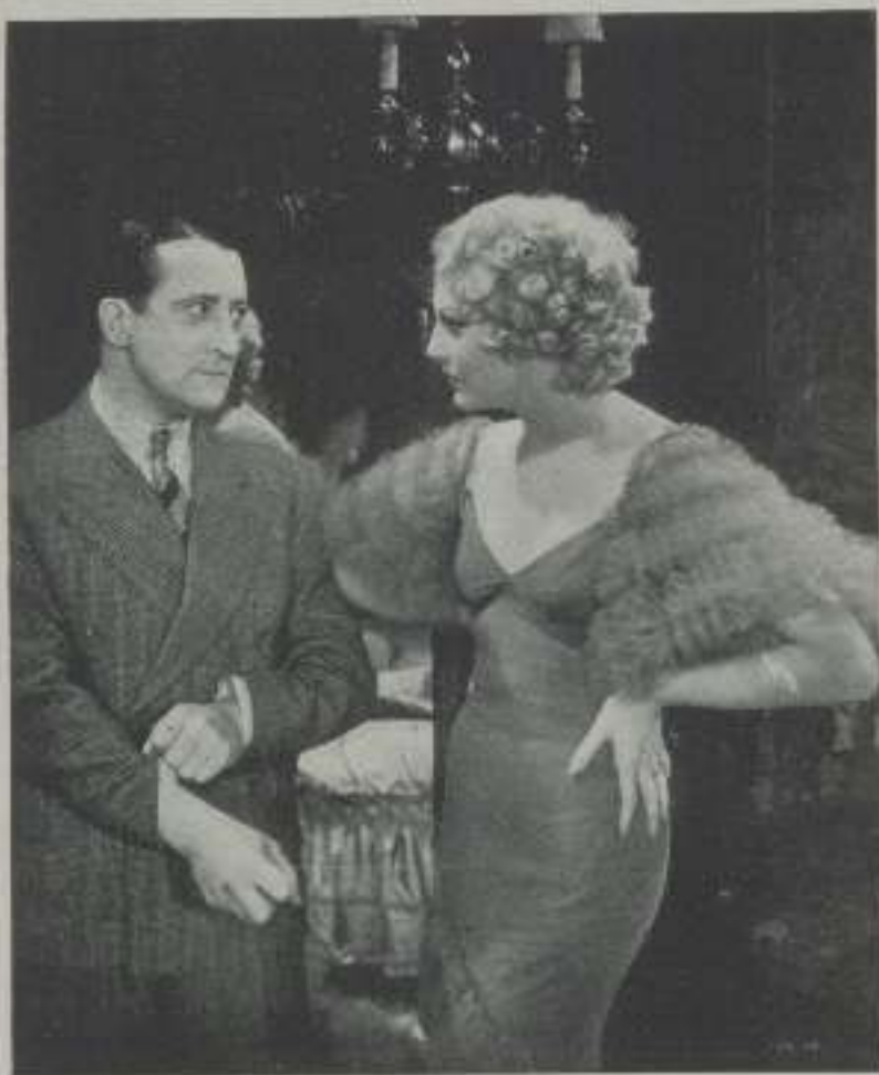
THELMA TOOD, la guapísima rubia y STANLEY LUPINO en una escena de «Vaya niña» de Cifesa

¿Qué te parece a ti, lector? Tiene o no razón Thelma? ¿Sí? Desde luego. Nosotros no podemos negarles nada cuando nos lo piden, cuando nos lo ruegan o cuando nos lo ordenan inamoviblemente . ¿Ea o no cierto?