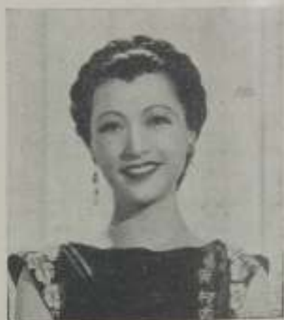
ANNA MAY WONG

La influencia de Capricornio, afecta a todos los nacidos entre 21 de diciembre y 21 de enero, e irán mejorando hasta marzo. Los nacidos en Acuario, 21 enero a 19 febrero, entre los que se hallan Ro-