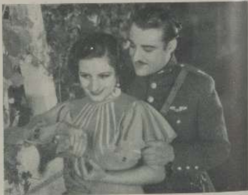
Una escena de "El vuelo de la muerte" de Cifesa

Animado por los mejores deseos para que el cine hispanoamericano sea un hecho firme, no ha reparado en sacrificios para dar a nuestra cinematografía una obra llena de emoción y en la que ha puesto todos sus entusiasmos, dando vida a un problema sentimental en que un hombre se sacrifica por un amor puro, gesto que es muy propio de nuestra raza ya que llega incluso a morir por él.