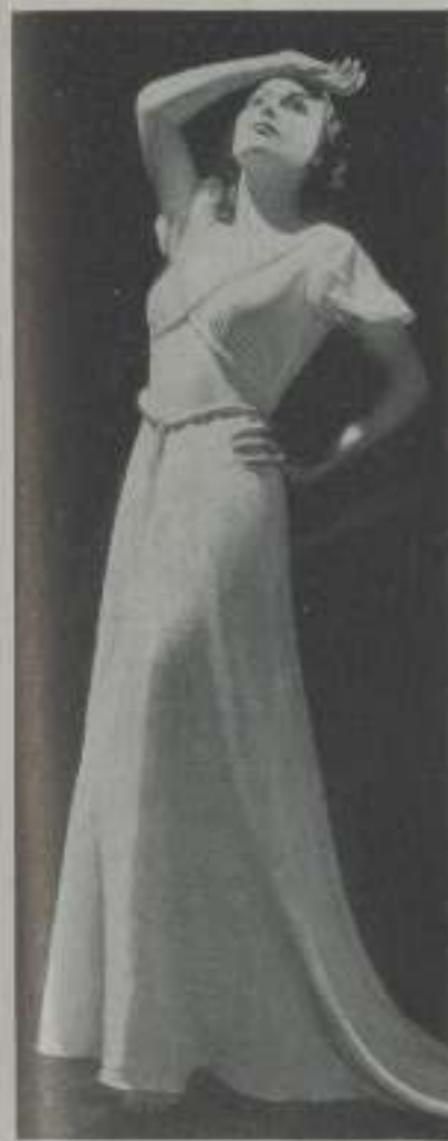
Una expresión característica de CAROLE LOMBARD

Si a veces, en un momento de desentido, se le ve una mirada de desilusión en sus ojos con la sugestión de que las lágrimas están muy cerca, hay que mirar a otra dirección.