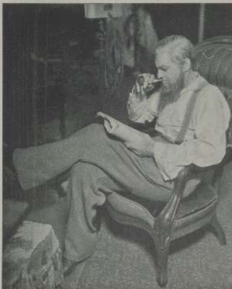
LIONEL BARRYMORE , uno de los prestigios más consolidados de la Metro.

♣ Jean Harlow ha ido a Nueva York a visitar a su madre y su padrastro.