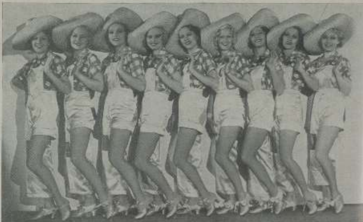
Un grupo de preciosas extras que lucen su belleza en "Seamos optimistas", de la Fox.