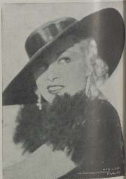
MAE WEST , la pícaro actriz de la Paramount, que confiesa que el serlo "No es pecado".

♣ La pareja Charles Farrey y Virginia Valli continúa siendo muy feliz, a pesar de los rumores de continuas desavenencias conyugales.