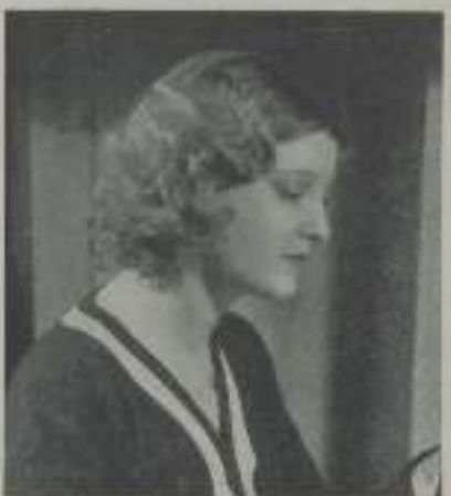
JEANETTE MAC DONALD

En conjunto, el año actual, concederá grandes beneficios a los artistas cinematográficos.