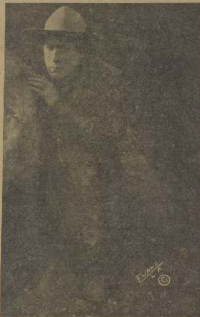
William S. Hart, el gran actor de la pantalla, es también el más experto traductor de luz que existe entre los artistas que impresionan películas en el Oeste.

En el momento de su caída al rey es el castillo de Sautenburg, su vestida prestigiosamente. Todo París, del campo y de la