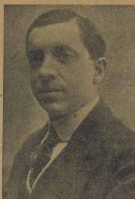
El célebre poeta FRANCISCO VILLALPESSE, que actual- mente triunfa en la América Latina

cantando, mientras se peina la negra sombra, cantando un viejo canto de amor!