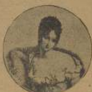
MADAME DE RECAMIER

El colosal edificio tendrá una sala de es-