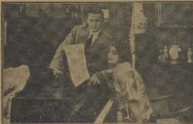
Una interesante escena de la "La Princesa Wacziarg".