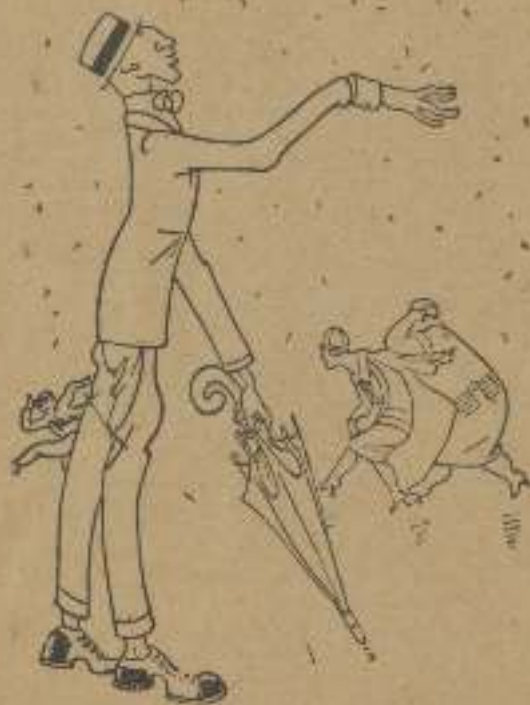
LAMENTACIÓN DEL BARCELONÉS