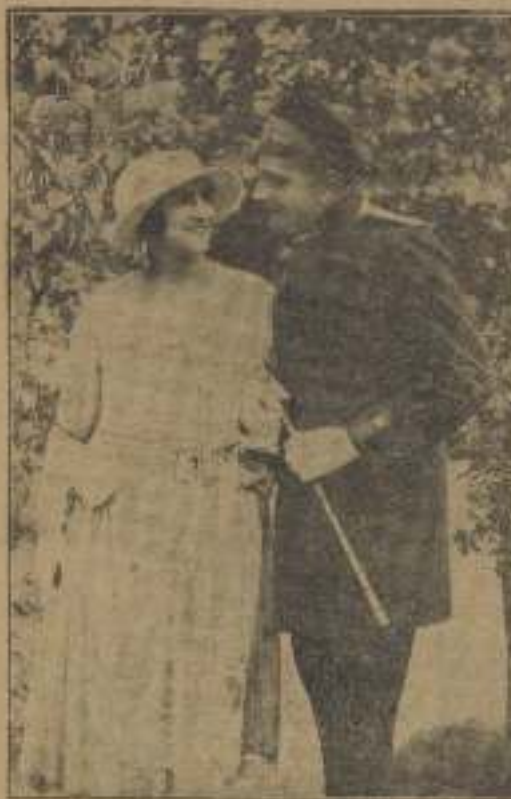
La bella escena de la película, "Ellos", en una de sus más bellas escenas.