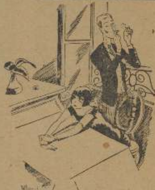
INCOMPATIBILIDAD DE CARACTER

—¡Ah! Si yo hubiera sabido que tú eres tan machista no me hubiera casado contigo.